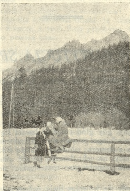
W czasie rekreacji na tle Nosala.

Panie również starają się wszelkimi siłami, by zastąpić nam rodziców.