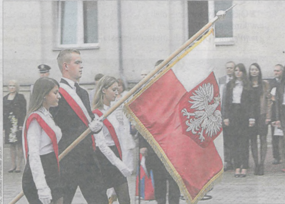
Tegoroczne rozpoczęcie roku szkolnego w Zespole Szkół Ponadgimnazjalnych nr 2 w Jarocinie będzie miało szczególny charakter ze względu na inaugurację wojewódzką