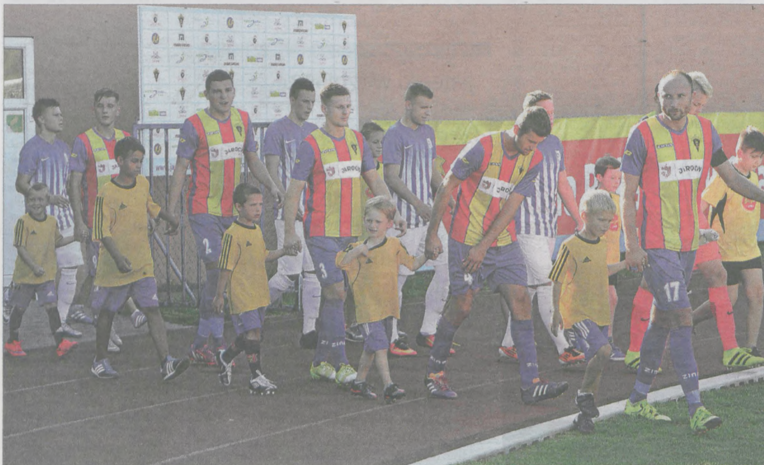
Piłkarzy na hitowy pojedynek wyprowadzali żacy Jaroty Jarocin i GKS-u Jaraczewo