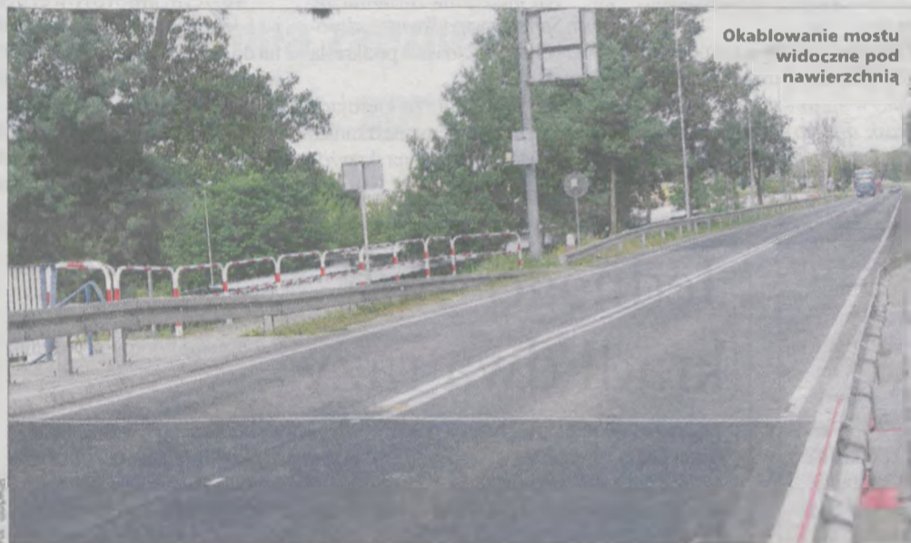
Okablowanie mostu widoczne pod nawierzchnią