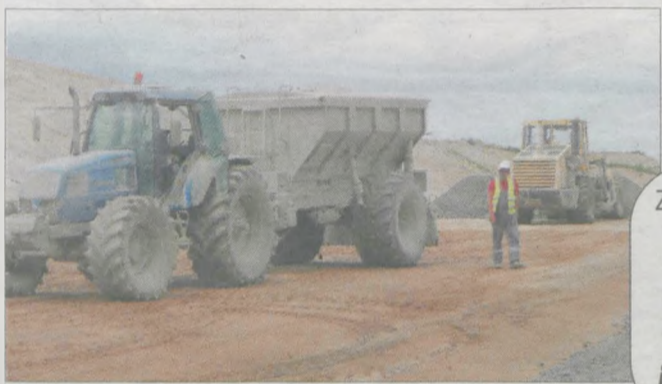
W Mieszkowie trwa utwardzanie nawierzchni. Niedługo będzie lany asfalt