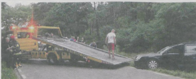
Niezbędna była pomoc drogowaa

Do groźnie wyglądającego wypadku doszło 8 lipca w Śmielowie. - 21-letni mieszkaniec gm. Jarocin kierujący samochodem marki Ford Mondeo nie dostosował prędkości do warunków ruchu, zjechał na pobocze i tam