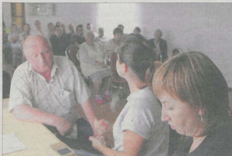
Choć mieszkańcy zajęli wszystkie miejsca w świetlicy wiejskiej, nie udało się wybrać sołtysa

Wóldarz gminy prosił, by wybrano chociaż zastępcę, na czas dwóch miesięcy. Wówczas Wolica Pusta mogłaby otrzymać dotację. Była pani sołtys sugerowała, że pieniądze przydałyby się na zrobienie oświetlenia na ulicach. Pomimo tych propozycji, nie pojawił się żaden chętny. - Nie doszukiwałbym się w tej miejscowości jakichś wielkich konfliktów. Zawsze się z przyjemnością przyjeżdżało na zebrania. Szkoda, że nie dokonano wyboru, ale takie sytuacje mają miejsce. W Wolicy zawsze dość trudno wybierało się sołtysa. Trochę to dziwne, bo są wsi, gdzie się o to bija. To dobrze, gdy jest duża rywalizacja. Kolejny termin wyborów będzie można wyznaczyć dopiero podczas następnej sesji, czyli 31 sierpnia - poinformował wójt po zebraniu. (dag)