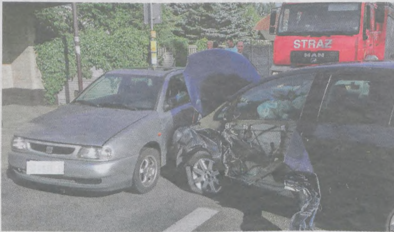
Do czasu zakończenia akcji odbywał się ruch wahadłowy

Oprócz policji na miejsce dotarła też straż pożarna i pogotowie. Matka z miesięcznym dzieckiem została przewieziona do jarocińskiego szpitala, a pozostałym uczestnikom wypadku udzielono pomocy na miejscu. obrażenia wszystkich poszkodowanych okazały się niegroźne. (seb)