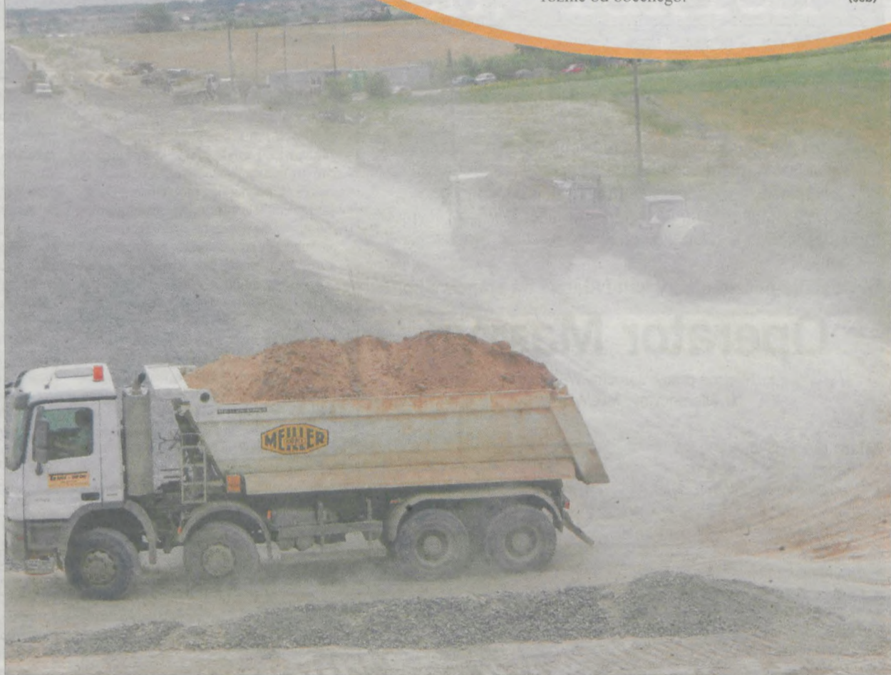
Upały dają się pracownikom Budimexu podwójnie we znaki. Nie dość, że gorąco, to jeszcze mnóstwo kórzu