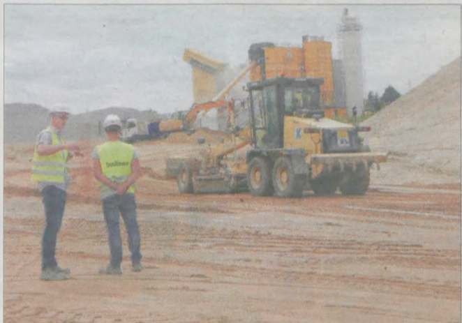
Jeden ze zjazdów z obwodnicy nabiera ostatecznego kształtu