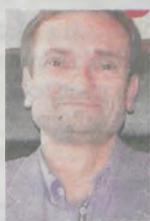
MACIEJ GRUCHALSKI prezes Sądu Rejonowego w Jarocinie