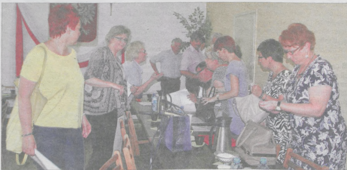
Dyrektorki szkół z gminy Kotlin uczestniczyły we wspólnym posiedzeniu komisji kotlińskiej rady