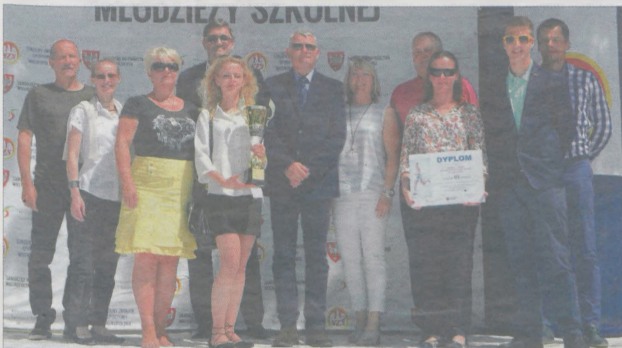
Reprezentacja „jedyńki” nie kryła radości z osiągnięcia najlepszego wyniku w historii szkoły

Szkoły ponadgimnazjalne (243 szkoły) I. I Liceum Ogólnokształcące w Turku II. Liceum Ogólnokształcące w Wolsztynie III. Zespół Szkół Ponadgimnazjalnych nr 1 w Jarocinie IV. II Liceum Ogólnokształcące w Gnieźnie V. II Liceum Ogólnokształcące w Kaliszu