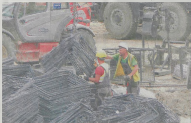
Bez drutów nie powstanie żaden most