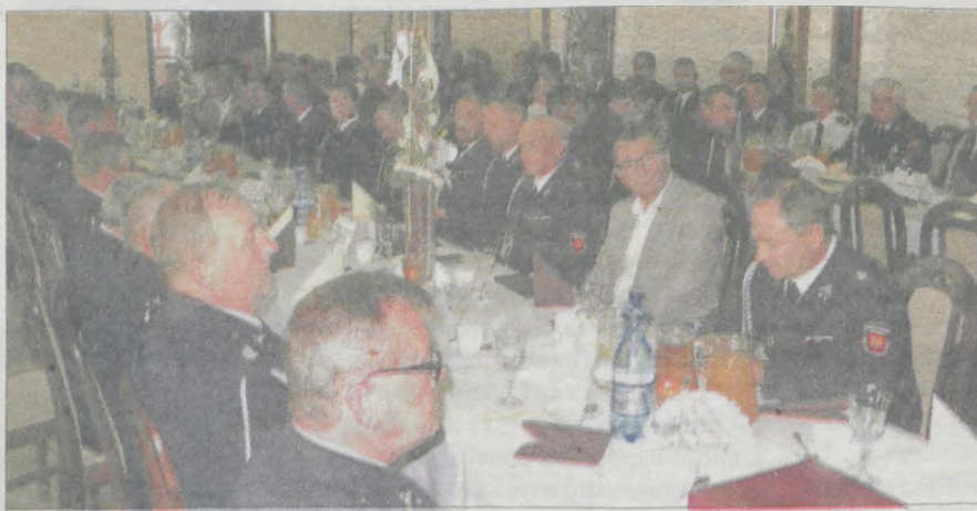
Po wyborach strażacy zasiedli do wspólnego stołu