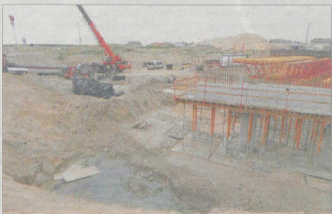
Wielki wykop przy ul. św. Ducha zostanie częściowo zasypywany po zakończeniu budowy tego fragmentu obwodnicy