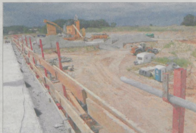
Most nad bajpasem w Mieszkowie