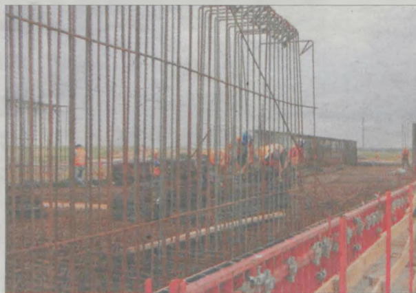
Budowa wiaduktu kolejowego w Cielczy