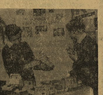
Na zdjęciu — Uczniowie Szkoły przy własnoręcznie wykonanych zabawkach.

W 69 Szkole Podstawowej przy ul. Jarochońskiego, w związku z piętnastą rocznicą wyzwolenia Poznania, urządzono wystawę prac uczniowskich dzieci z klas 1—7. Zajęcia praktyczne w starszych klasach (od 5 do 7), prowadzą w szkole pedagodzy-specjaliści — pp. Tądrowska i Andrzejewska.