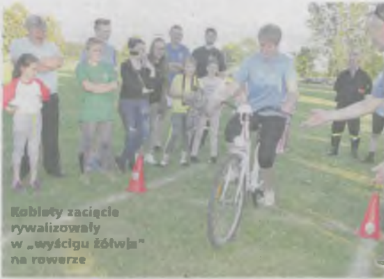
Kobiety zacięte rywalizowały w „wyścigu żółwia” na rowerze