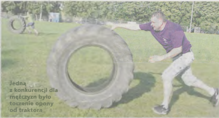
Jedną z konkurencji dla mężczyzn było toczenie opony od traktora