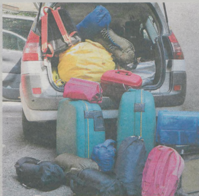
(hm) Fot. Fotolia.pl

W szale pakowania, rezerwowania noclegów i przeglądania przewodników, nie możemy zapomnieć o naszym samochodzie. Zaniedbanie, szczególnie przy długich, zagranicznych wojażach, może przysporzyć nam niepotrzebnych zmartwień. O kilka szybkich rad poprosiliśmy Artura Kołka z Okręgowej Stacji Kontroli Pojazdów w Jarzawie.