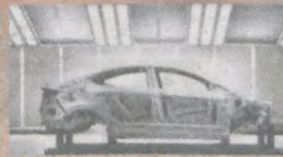
Ultradłuzymała stal o podwyższonej sztywności