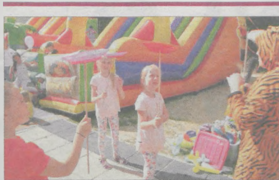
Nie zabrakło kuglarskich zabaw z animatorem