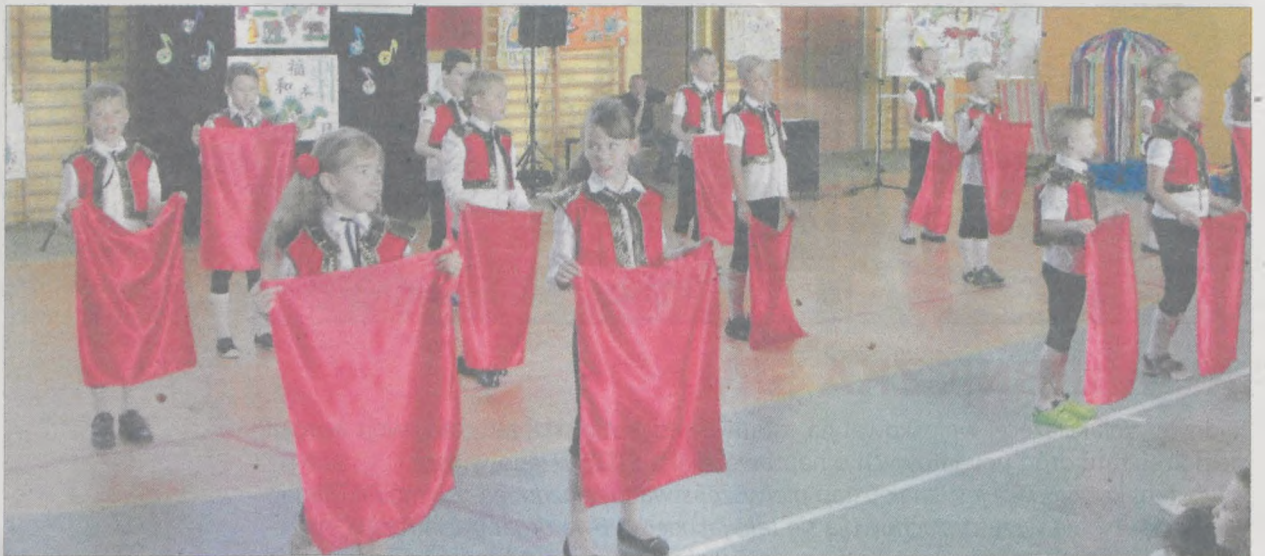
Dzieci włożyły wiele starań i pracy w przygotowanie odpowiednich strojów

Opowiedzieć piosenką o wybranym kraju - takie było zadanie uczniów klas 1 - 3 Szkoły Podstawowej nr 4 w Jarocinie, którzy udali się w barwną podróż dookoła świata dzięki 17. edycji Festiwalu Piosenki Szkolnej.