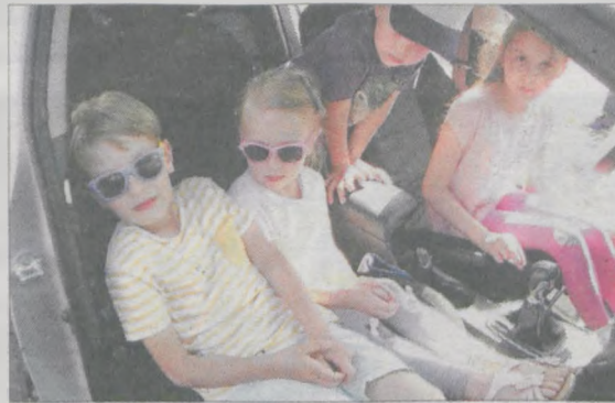
Wóz policyjny oblegali zaciekawione tłumy