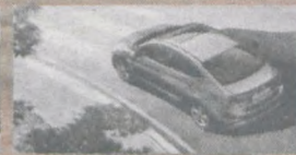
Zoptymalizowane zawieszenie i układ kierowniczy