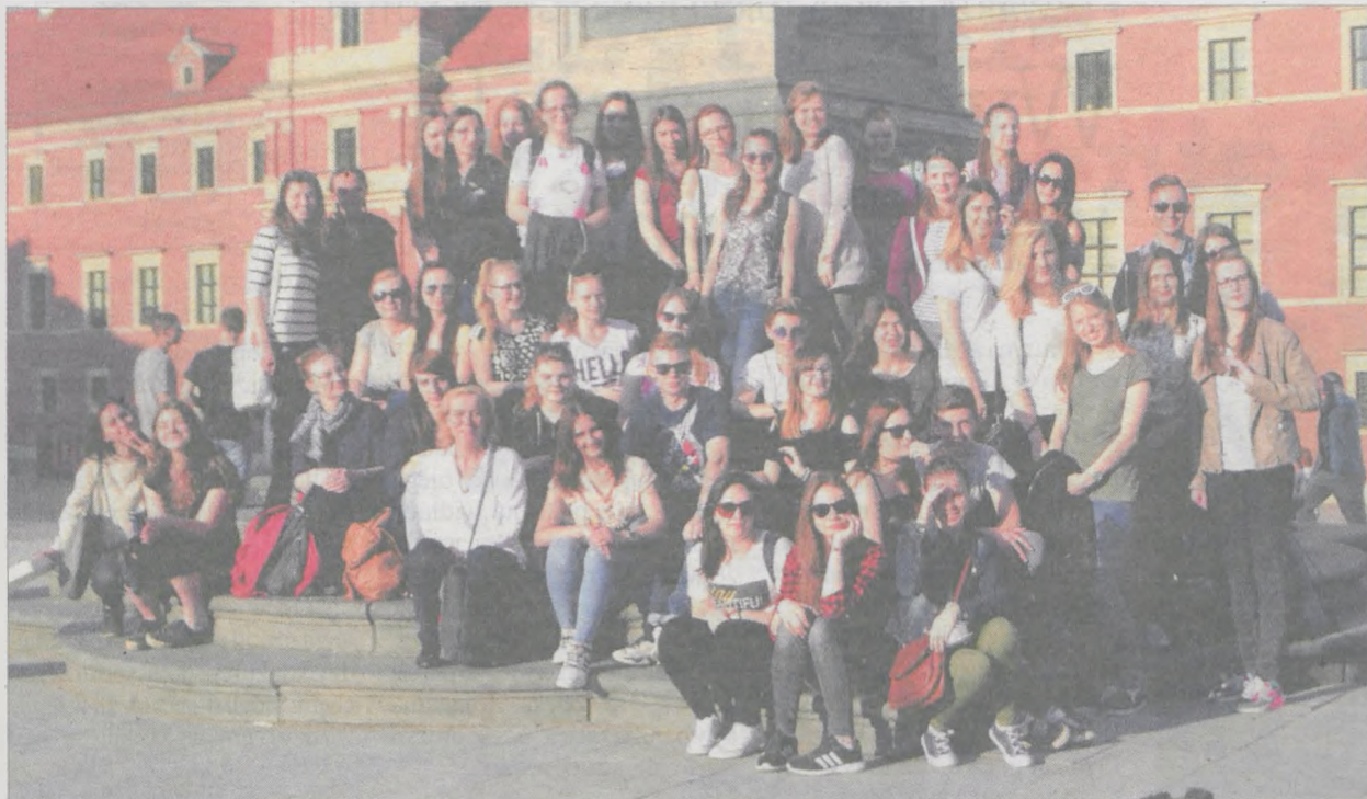
Uczniowie podczas wspólnego zdjęcia na warszawskiej Starówce