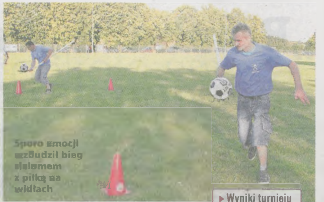
Spora emocji wzbudził bieg slalodem z piłką na widłach

Ekipa z Magnuszewic nie kryła radości ze zwycięstwa