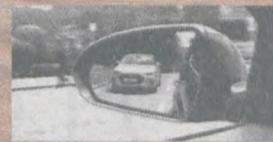
System monitorowania martwego pola

Nowoczesna linia nadwozia nowego Hyundai Elantra podkreśla jego sportowy i zdecydowany charakter. Zoptymalizowane zawieszenie i układ kierowniczy pozwoliły uzyskać wyważone i pewne prowadzenie. Nadwozie nowego Hyundai Elantra wykonane jest w 53% z ultradłuzymałej stali, co przekłada się na wyższą stabilność i komfort jazdy. Nowy Hyundai Elantra dysponuje również zaawansowanymi technologiami, jak system wspomagania zmiany pasa lub system monitorowania tzw. martwego pola, zwiększając bezpieczeństwo kierowcy i pasażerów. Poznaj nowego Hyundai Elantra - samochód przyszłości dostępny już dziś.