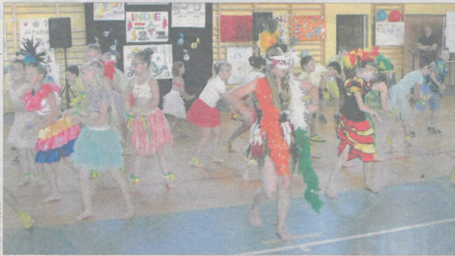
Na scenie było egzotycznie, a czasem bardzo gorąco