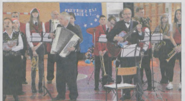
Uczestnicy spotkania śpiewali kolędy przy akompaniamentcie akordeonu Klubu Seniora „Babie Lato” oraz Orkiestry Dętej MCT (w tle)

„Babie Lato”, Zespołu „Chrzanianki” oraz dzieci ze Szkoły Podstawowej w Chrzanie. Do kolędników dołączyli się licznie przybyli mieszkańcy. (ann)