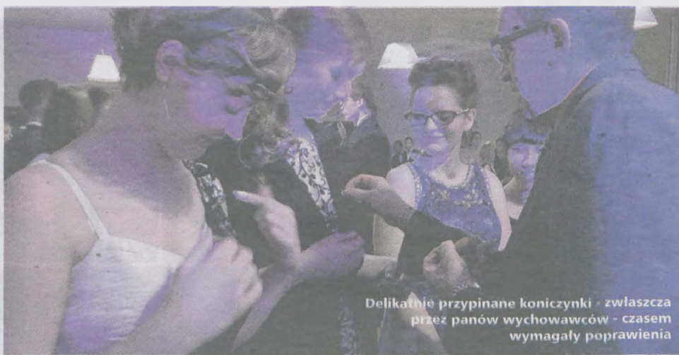
Delikatnie przypinane koniczyny - zwłaszcza przez panów wychowawców - czasem wymagały poprawienia