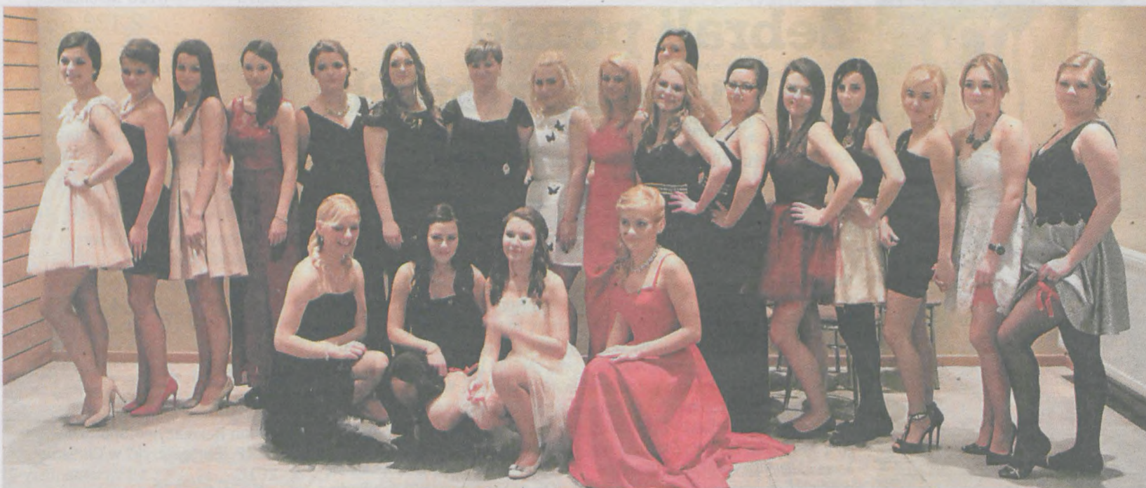
Dziewczyny prezentowały czerwone podwiązki założone „na szczęście”

► W sobotę - 6 lutego na studniówce bawić się będą maturzyści z Zespołu Szkół Ponadgimnazjalnych nr 2 w Jarocinie oraz Zespołu Szkół Społecznych.