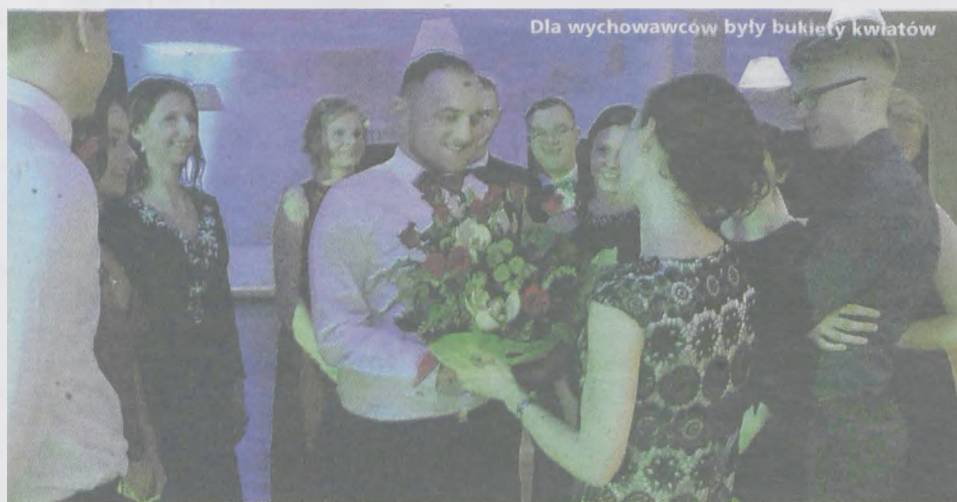
Dla wychowawców były bukiety kwiatów