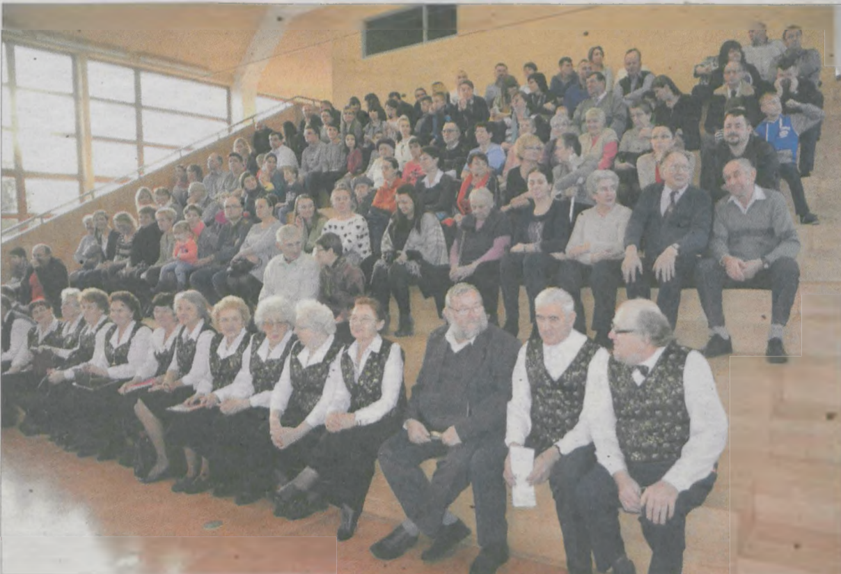
Inicjatywa wspólnego kolędowania spotkała się ze sporym zainteresowaniem mieszkańców Chrzana, również tych najmłodszych