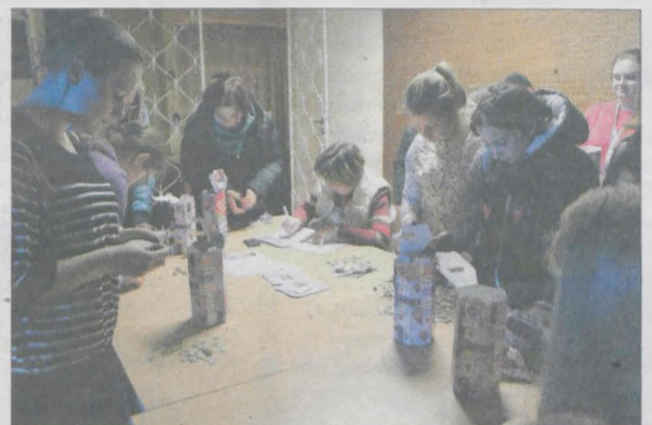
Liczenie zebranych pieniędzy w sztabie trwało od 15.00