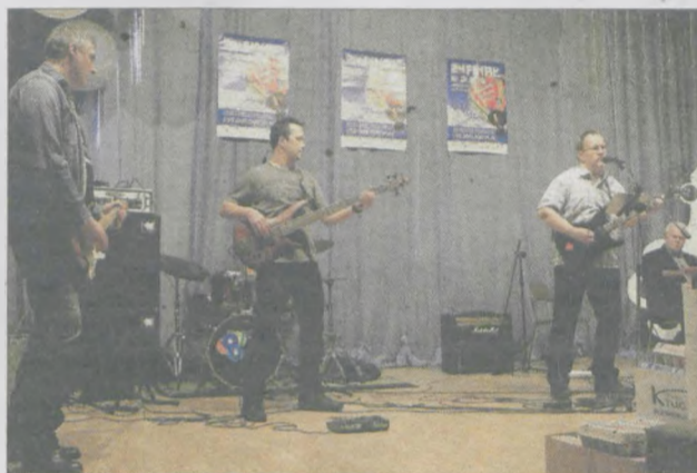
Na scenie wystąpiła poznańska kapela Pener's Killers