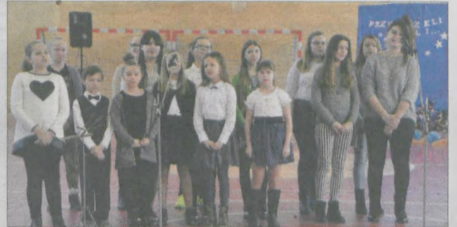
Swój repertuar kolęd zaprezentowali uczniowie Szkoły Podstawowej w Żerkowie