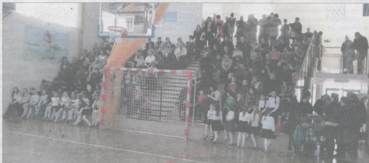
Przedstawieniu towarzyszyły tradycyjne jasełkowe stroje