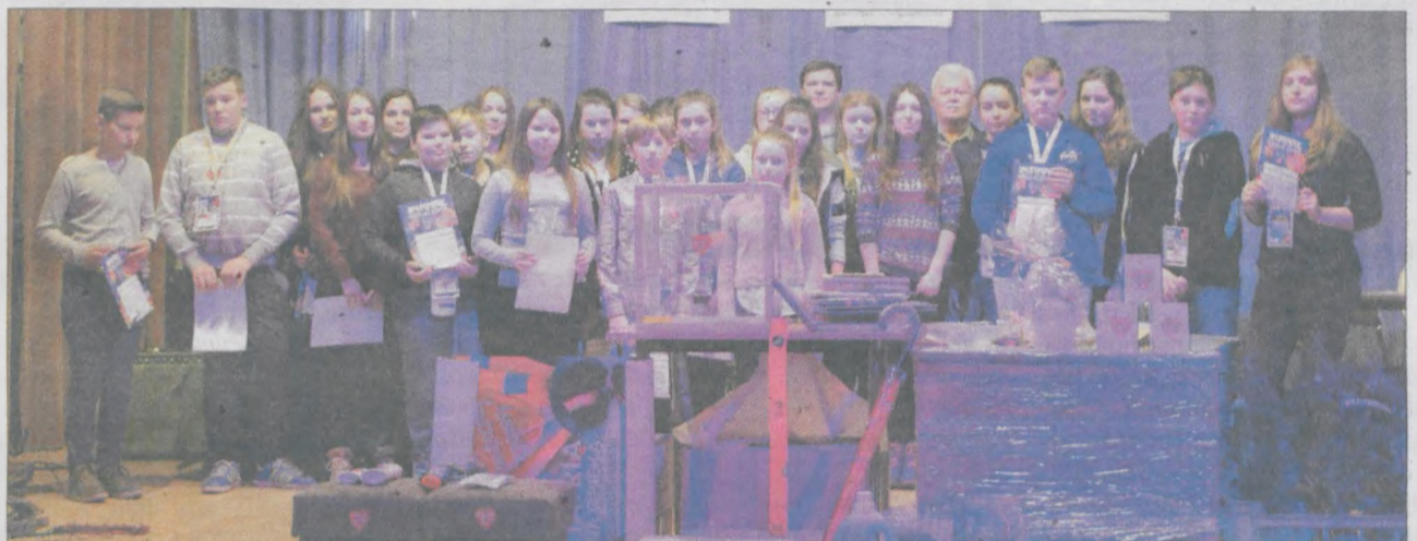
Pieniądze zbierali wolontariusze ze szkół w Boguszynie, Chociczy, Kłęce, Kolniczkach i Nowym Mieście