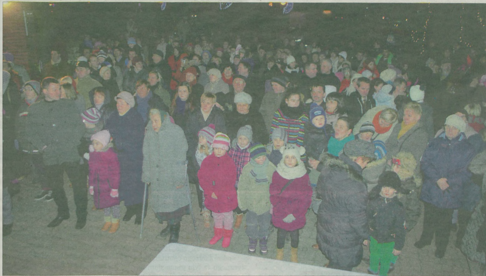
Po muzycznej uczcie tuluszkowianie tłumnie ruszyli na plac przed kościołem.

kowskim: „Gdy zbliżają się te święta i sprzątam już od rana, ilu jeszcze dziś pamięta, że to narodziny Pana? Czy biegając po marketach, gdzieś w Koninie, Turku, Łodzi, myślisz czasem, że coś nie tak, że nie o to przecież chodzi. Więc gdy bzdury postawimy w sercu i na pierwsze miejsce i co święte wyrzucimy, czy przyniesie nam to szczęście? Może jednak znów spróbować odkryć sens tajemniczego, aby później nie żałować, że odeszło coś wielkiego. Zasiąść w ciszy i milczeniu z kimś po prawej, lewej stronie i każdemu chleb w skupieniu na zgłodniałe złożyć dłonie. Dzisiaj bardziej nam potrzebne od słów wielu jest milczenie. Trwajmy w nim z bliskimi razem, to jest Boże Narodzenie”.