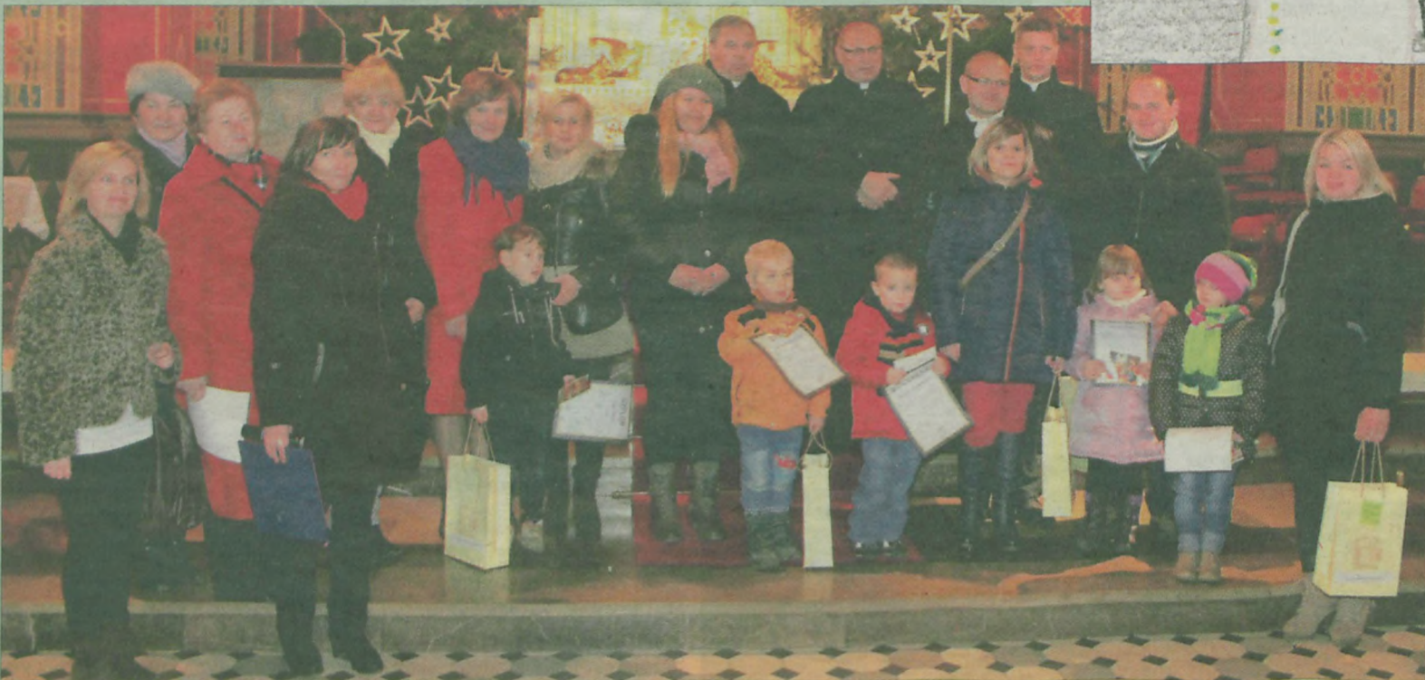
Nagrodzone maluchy wraz z organizatorami i opiekunami.

Każda edycja konkursu cieszy się dużą popularnością - zarówno ze względu na duże możliwości artystycznego ujęcia tematu, jak i na szczegól-