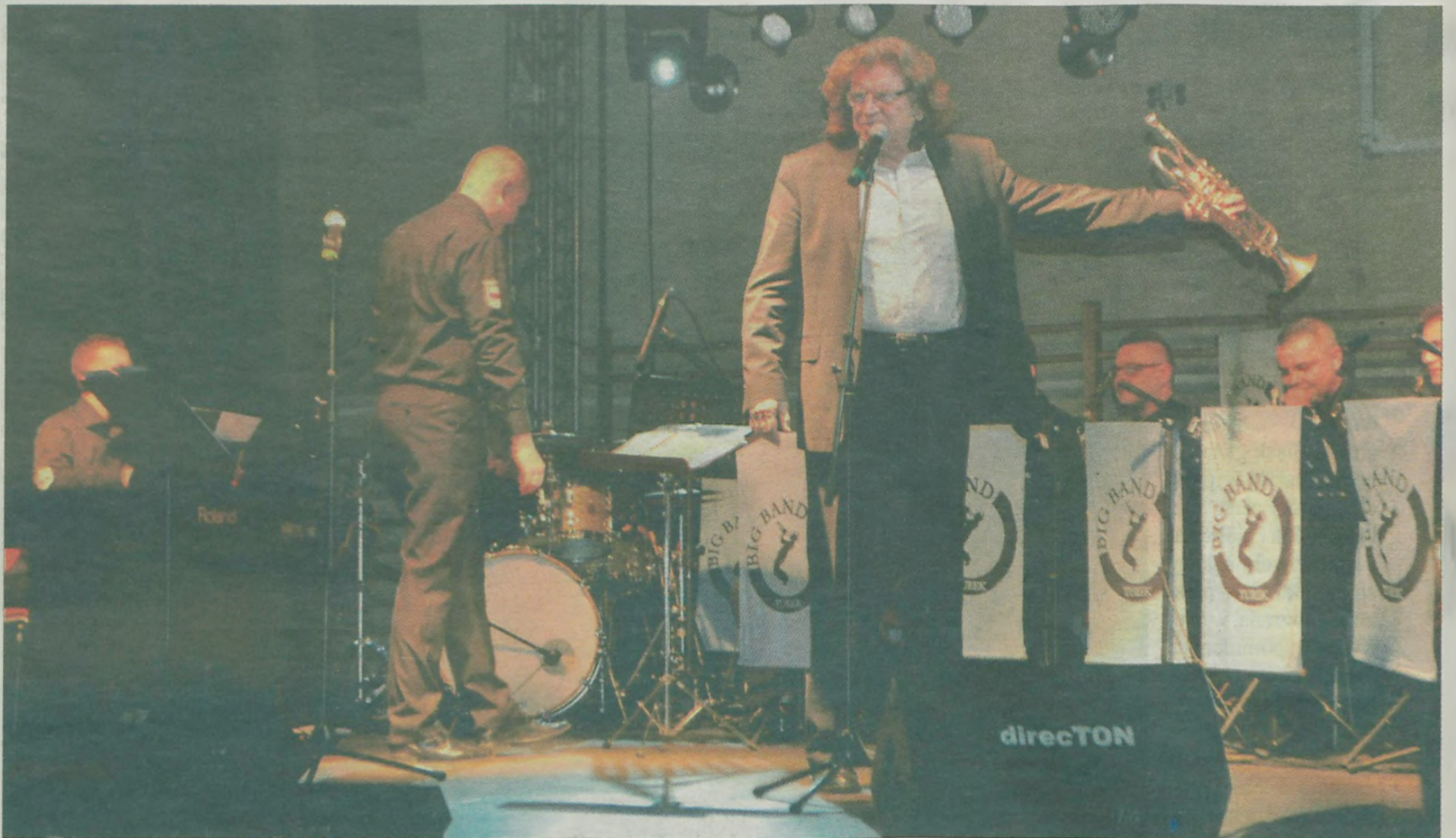
Wraz z Big Bandem Miasta Turku wykonał kilka utworów.