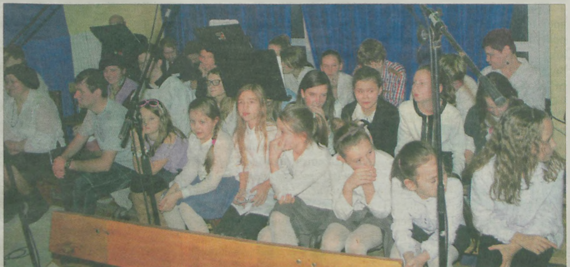
Chór wypadł wspaniale.