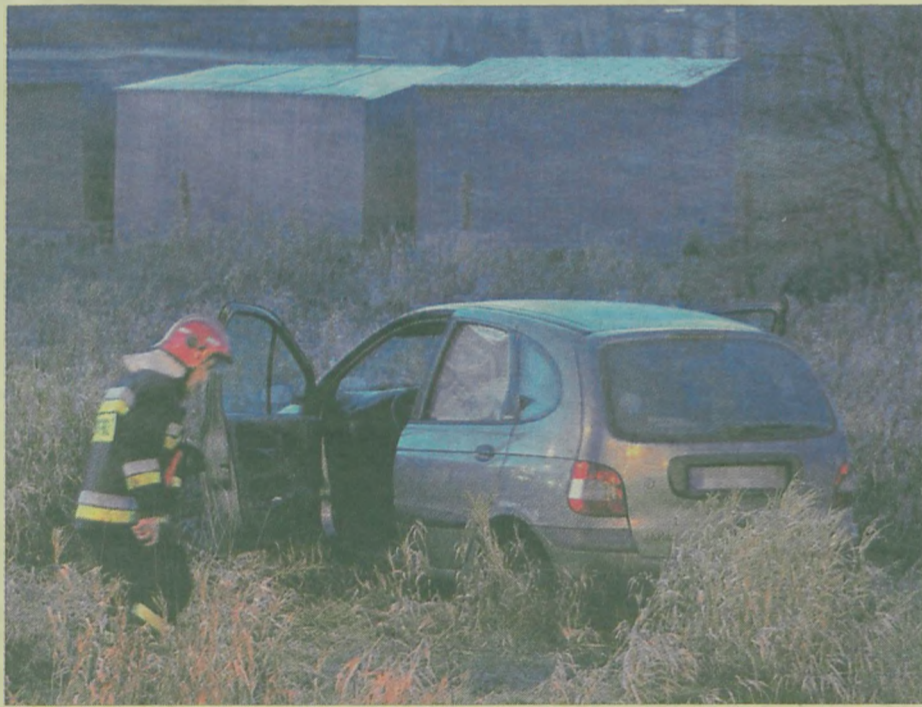
Mieszkanka Wymysłowa jadąca renaultem miała prawie trzy promile alkoholu.

się, że w scenicu podróżowała 40-letnia mieszkanka Wymysłowa (gm. Tuliszków). Kobieta nie dość, że była pijana, bo badanie wykazało u niej 2,86 promila alkoholu, to jeszcze zachowywała się skandalicznie, obrzucając mundurowych wyzwiskami. Dlatego też policjanci nie mieli skrupułów i wywieźli ją do konińskiej izby wytrzeźwień. Samochód odholowano na policyjny parking. ił