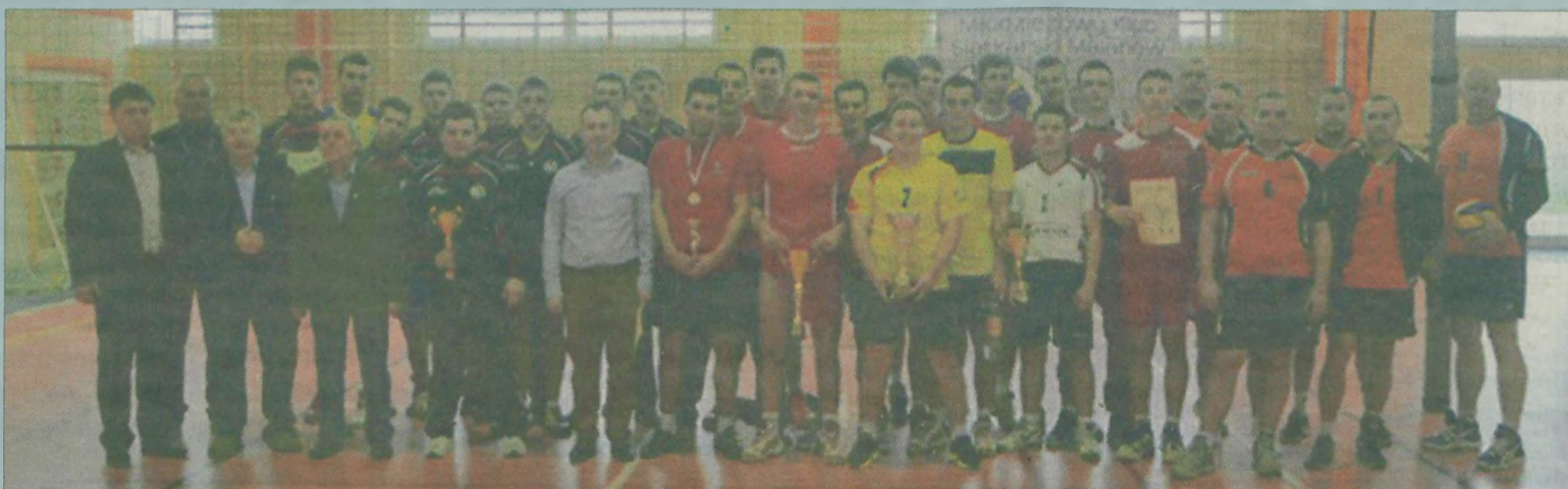
W VII Mikołajkowym Turnieju Piłki Siatkowej w Malanowie wzięło udział 6 zespołów.

dobrą zabawę. Uczestnicy otrzymali pamiątkowe dyplomy oraz słodkie upominki. Drugi etap akademii rozpocznie się w drugim tygodniu stycznia, a jego zwieńczeniem będzie wyjazd na mecz PlusLigi mężczyzn – PGE Skra Bełchatów – ZAKSA Kędzierzyn-Koźle. dac