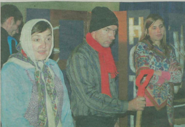
Aktorzy z Powiatowego Środowiskowego Domu Samopomocy w Czepowie.