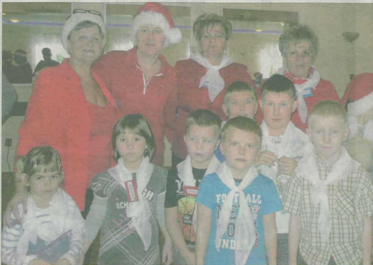
Wspólne zdjęcia zakończyły choinkową zabawę dla dzieciaków.

Na koniec każdy z uczestników zabawy otrzymał prezent, dzieciaki chętnie stawały też do pamiątkowych zdjęć z jegomościem z brodą. –Doświadczenie zdobyte przy organizacji tego typu spotkań sprawiają, że każde kolejne jest lepsze i bardziej atrakcyjne, a nasza radość jest jeszcze większa – mówią zgodnie panie z Forum i przy okazji dziękują za pomoc i wsparcie wszystkim sponsorom,