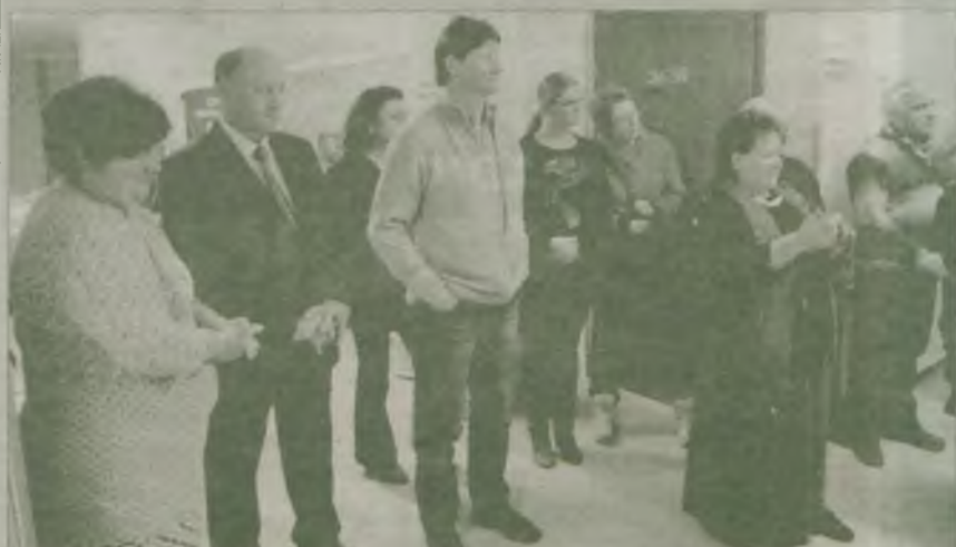
Spotkanie polsko-czeskie w Tokarach.

Delegacjom, przedstawicielom i Liceum Ogólnokształcącego im. Tadeusza Kościuszki w Turku, młodzieży, oraz wszystkim, którzy w trudnych chwilach dzielili z nami smutek, żal, okazali wiele serca i życzliwości, wzięli udział w modlitwach pożegnalnych, we Mszy Św. i towarzyszyli w ostatniej drodze