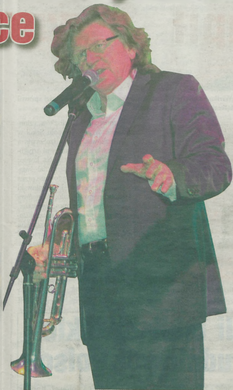
Zbigniew Wodecki na turkowskiej scenie wystąpił z trąbką i skrzypcami.

waj tego kawałka!" a ja tłumaczę, że to przecież nie moja wina. Przy tej okazji chciałem życzyć wszystkim paniom zdrowia, szczęścia, w domu, pracy i szkole, a piosenkę „Oczarowa-