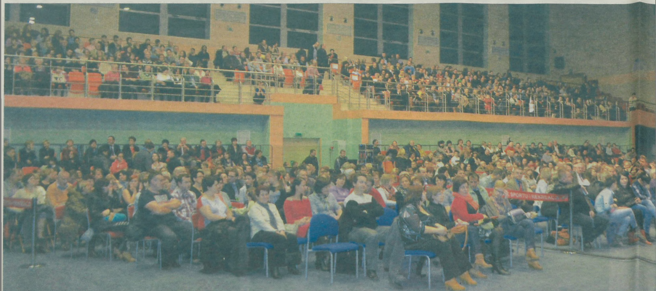
Liczna publiczność, około 1500 osób, z niecierpliwością oczekiwała koncertu Zbigniewa Wodeckiego i oczywiście naszego Big Bandu Miasta Turku, który przygotował tę przedświąteczną m