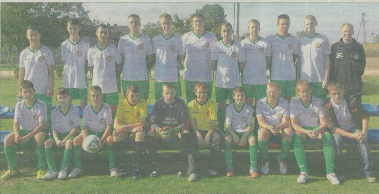
Drużyna juniorów młodszych Orła Kawęczyn.