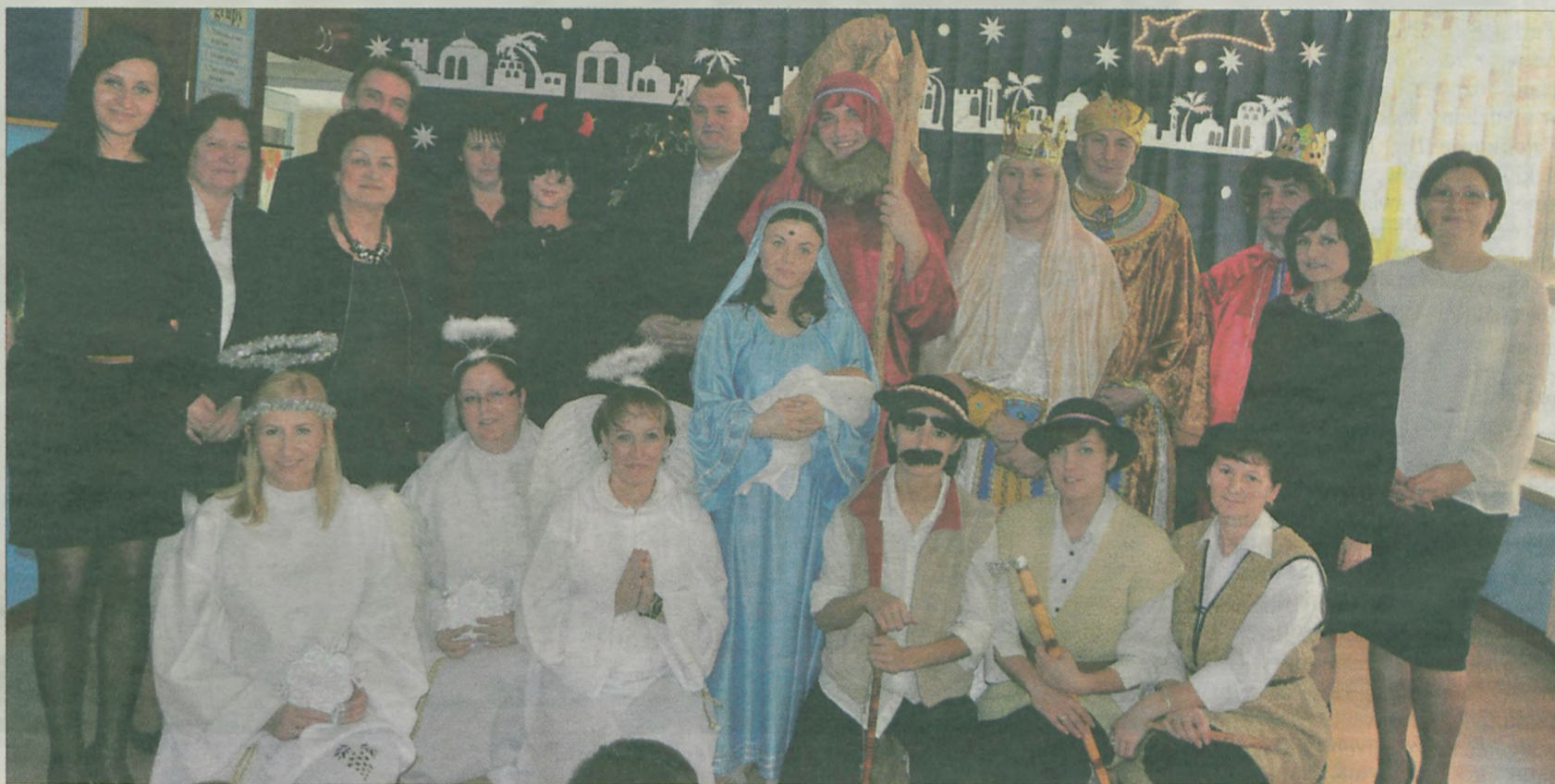
Plejada gwiazd rodzicielskiego przedstawienia z jego organizatorami i gośćmi.