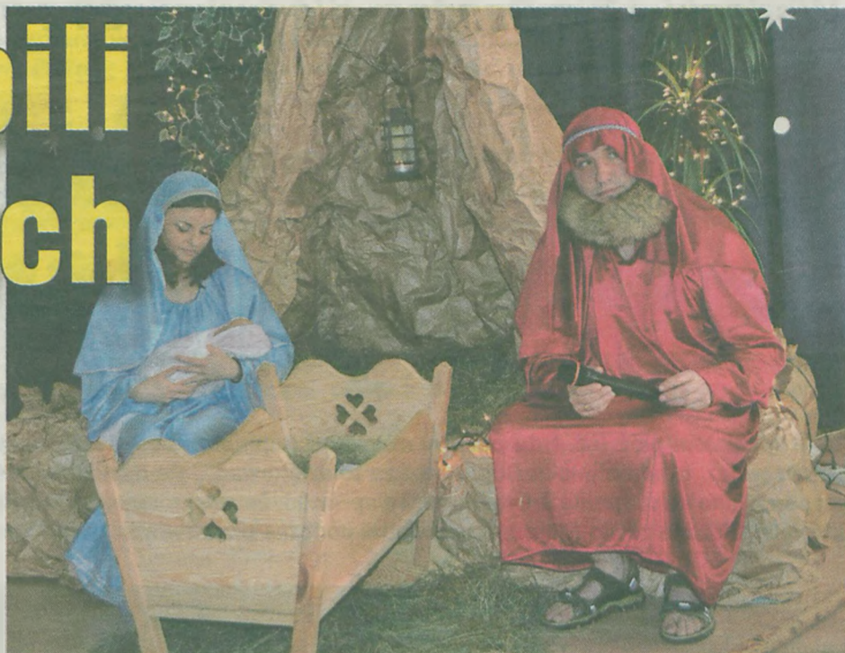
Scena niczym ze świętego obrazka.