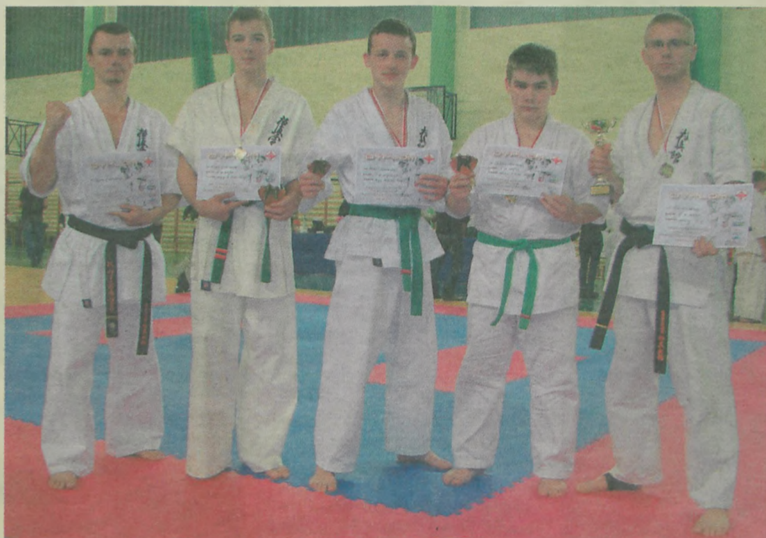
Mistrzowska ekipa Klubu Sportów i Sztuk Walk w Turku podczas Mistrzostw Polski Południowej.