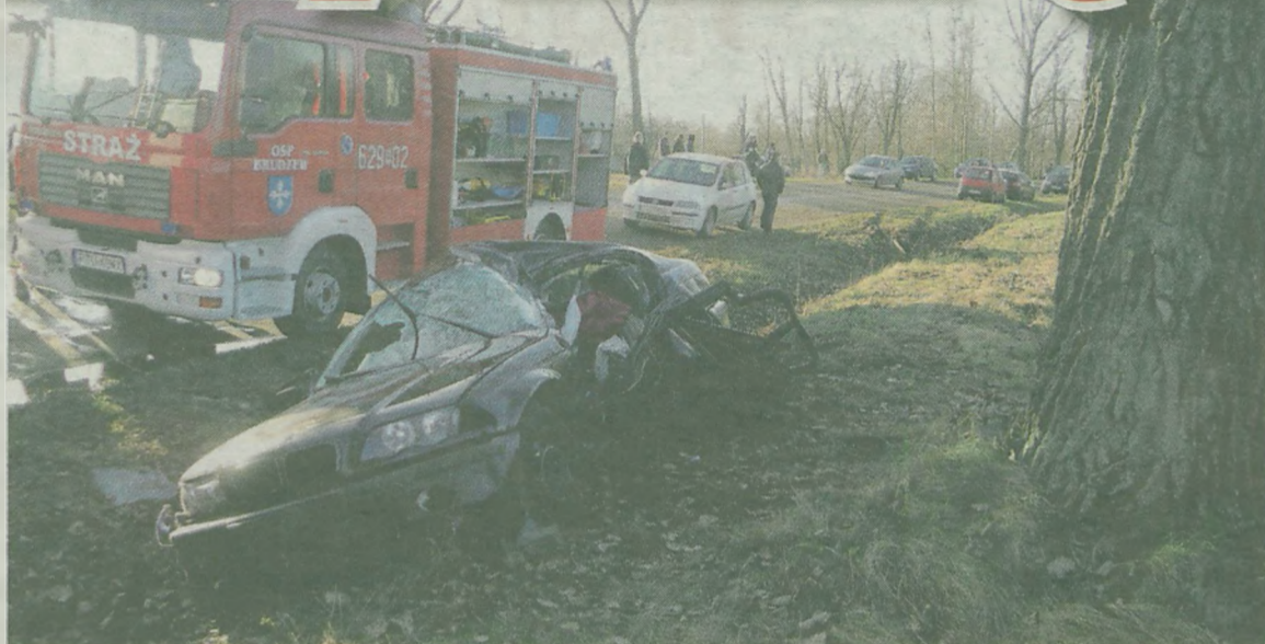
21-letni mieszkaniec Tarnowej zmarł kilka godzin po wypadku, do którego doszło dzień przed wigilią.

Turkowska prokura wyjaśnia przyczyny tragedii. ił