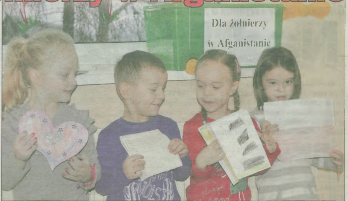
Dzieci prezentują swoje kartki i laurki dla żołnierzy w Afganistanie.