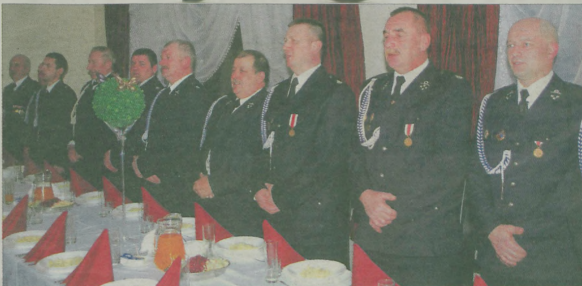
Strażacy odśpiewali kolędę.

ność ratowniczo-gaśniczą, ale także kulturalną i oświatową. Życzył im w nowym roku rozwiązania wszystkich problemów organizacyjnych oraz, aby w komplecie odliczyli się podczas przyszłorocznego