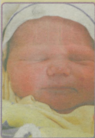
... Warych córka Weroniki i Macieja ur. 22 grudnia, godz. 3.00 waga 3650, długość 55 cm