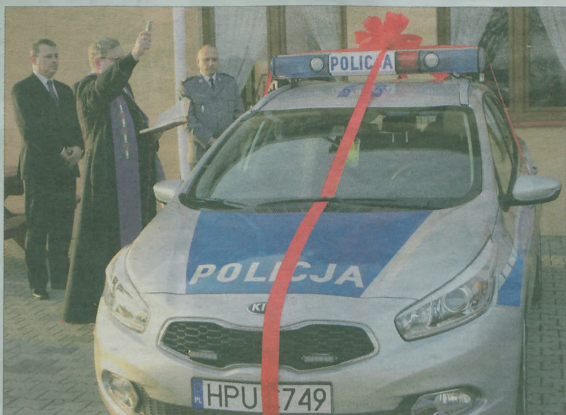
Kia ceed warta około 100 tys. złotych trafiła do Wydziału Ruchu Drogowego.

Błogosławieństwa na nowy rok udzielił kapelan mundurowych, ks. proboszcz Mirosław Frankowski. Po wspólnych życzeniach i oplatku wszyscy zasiedli do wspólnej wigilii. ii