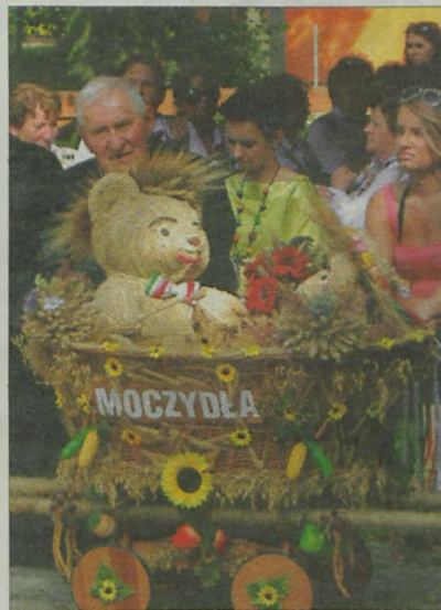
Zabawny wieńiec z Moczydła.