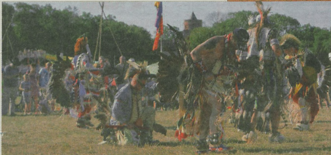
Tańce wojowników w barwnych strojach przyciągały uwagę i małych i dużych widzów.