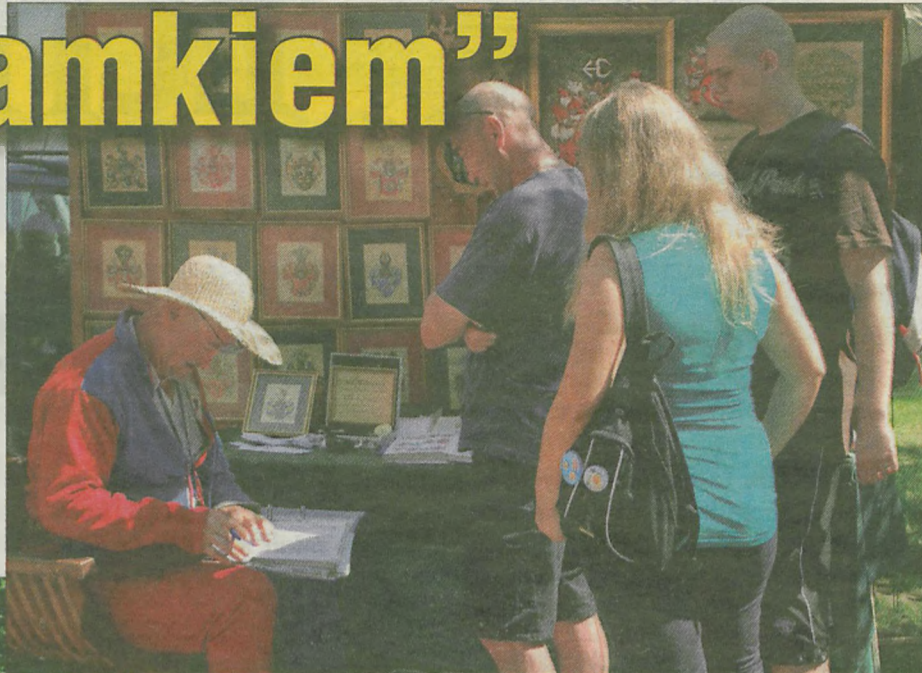
Heraldyk odnajdywał szlacheckie pochodzenia i herby.