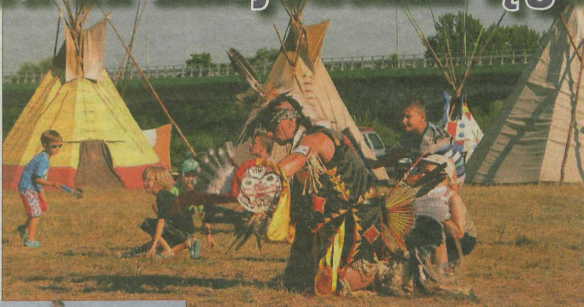
Do zabawy wojownicy zapraszali dzieci.