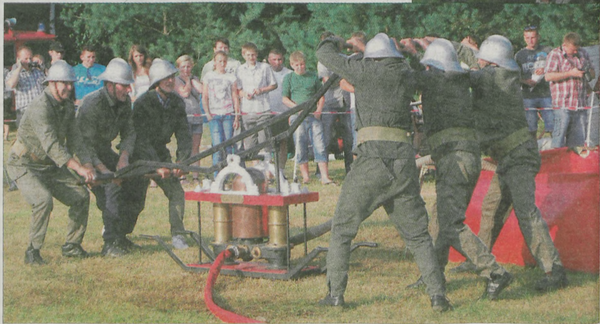
By popłynęła woda trzeba nie lada sił i umiejętności.