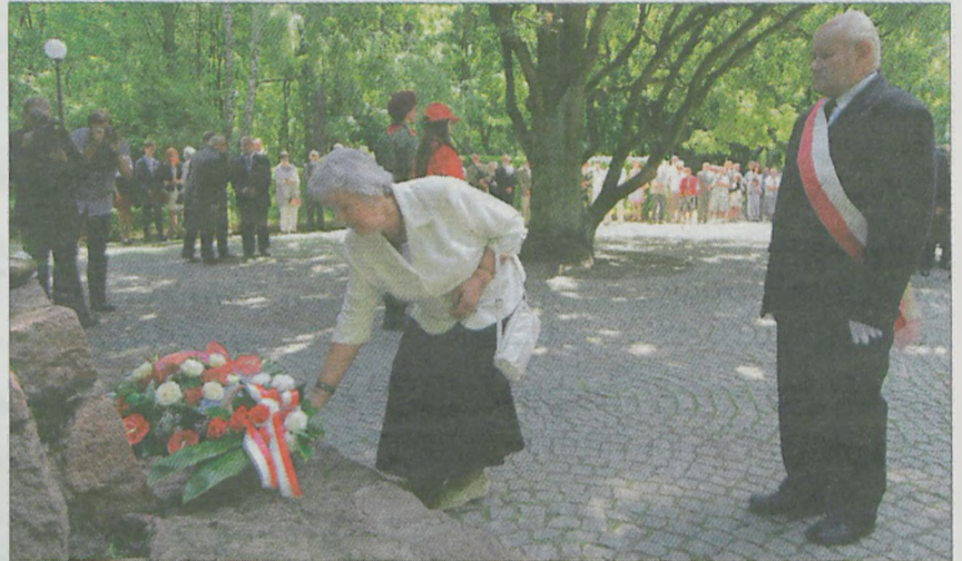
if Kwiaty przed pomnikiem Marszałka Piłsudskiego złożyli kombataneci.

Tradycyjnie kwiaty przed pomnikiem złożyli przedstawiciele kombatanów, władze samorządowe, a także uczniowie, nauczyciele i dyrektorzy szkół, przedstawiciele zakładów pracy, związków, stowarzyszeń, organizacji pozarządowych oraz partii politycznych. Po części oficjalnej zebrani w parku zaproszeni zostali na wojskową grochówkę.