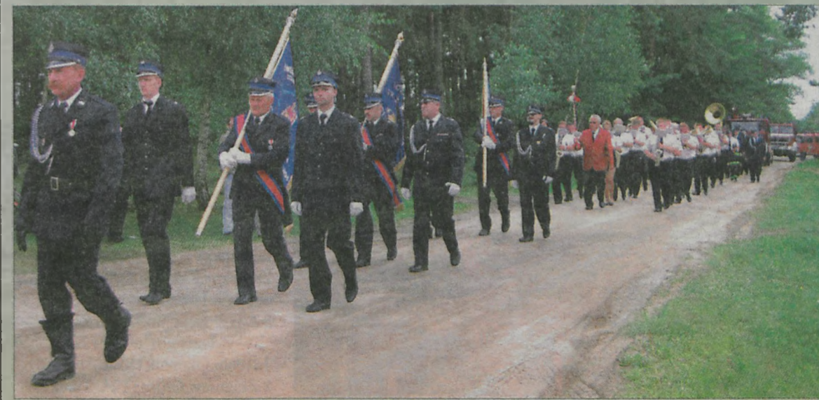
Z kościoła druhowie przemaszzerowali do remizy w Feliksowie.