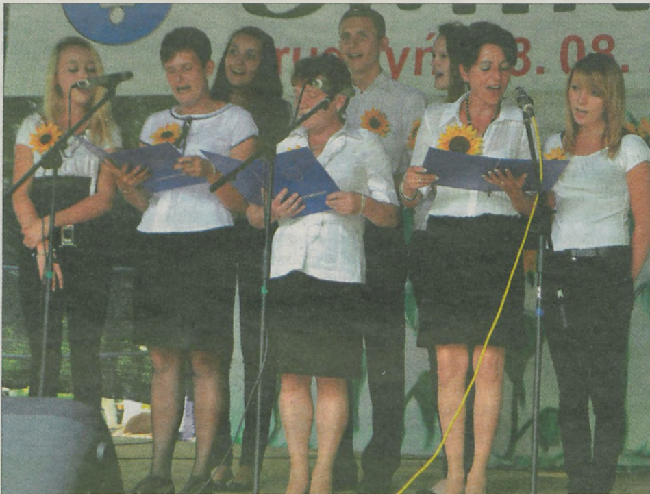
Mieszkańcy Brudzyń, w swoich tradycyjnych przyśpiewkach, zabawnie, ale jednak skrytykowali księży, miejscowych lekarzy, wójta, radnych i swojego sołtysa.