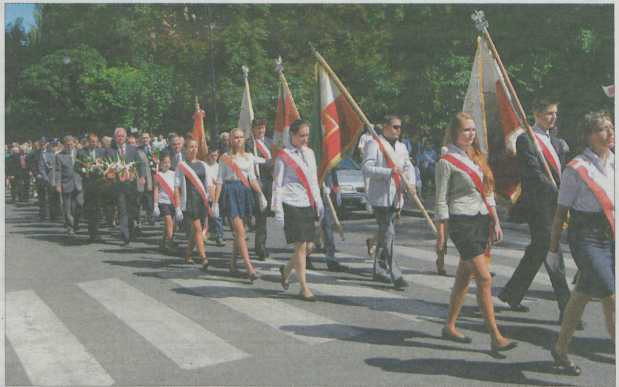
W tym roku było mniej pocztów sztandarowych niż w latach ubiegłych.