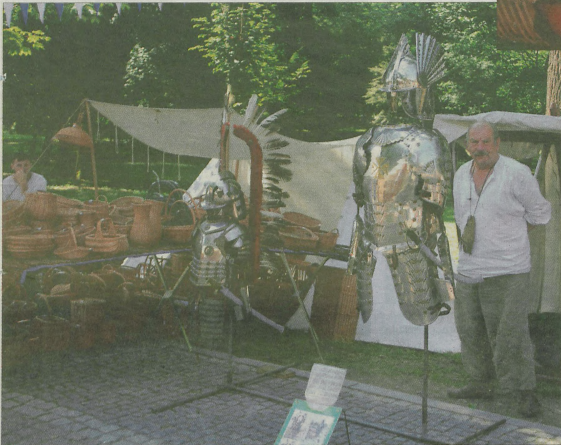
Chętni mogli nabyć pełne wyposażenie rycerskie.