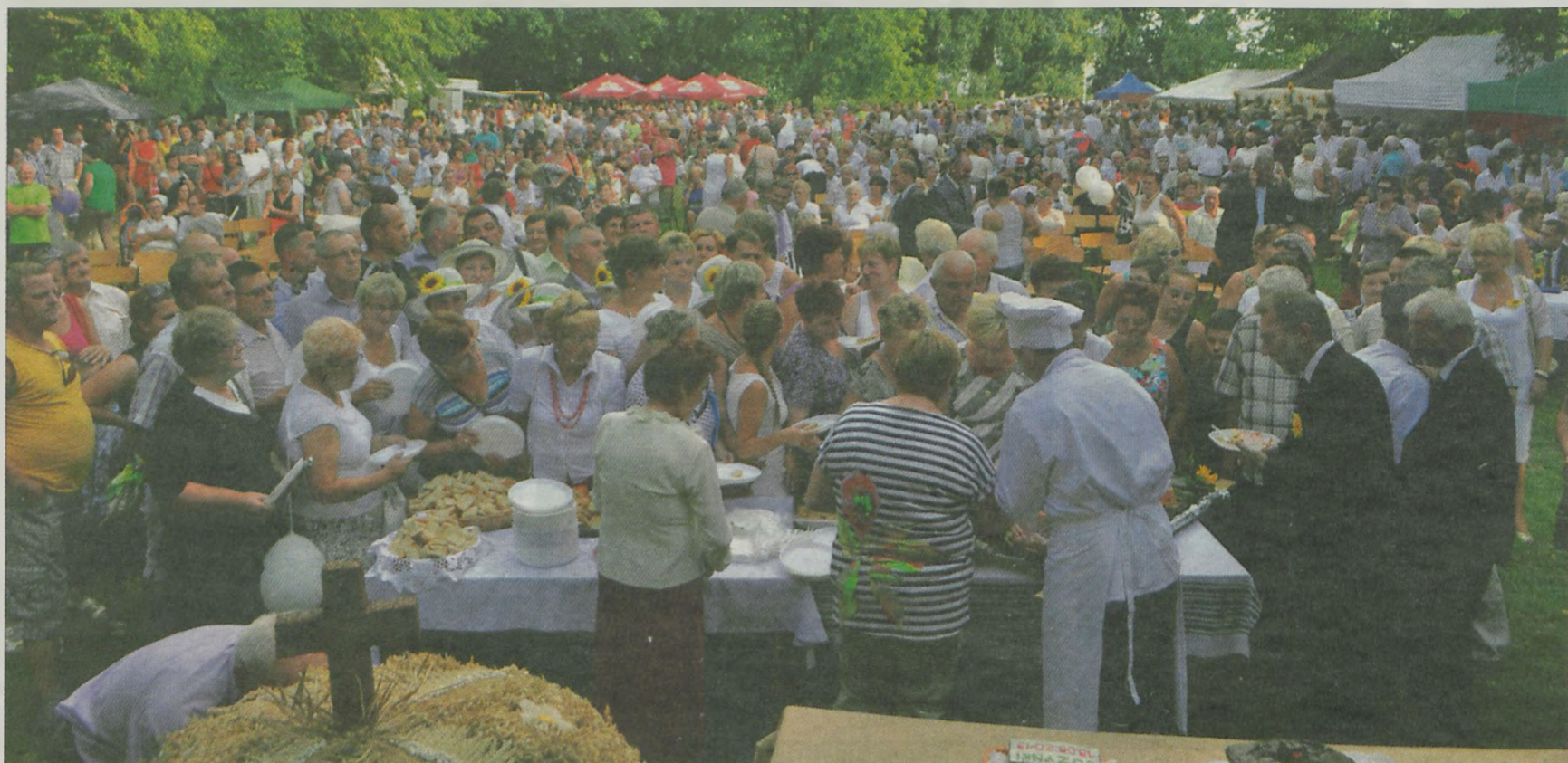
Na zakończenie części oficjalnej na stoły przed sceną wniesiono pieczonego prosiaka.