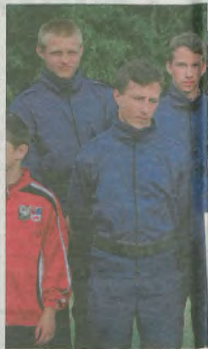
Ubiegłoroczni mistrzowie Polski b