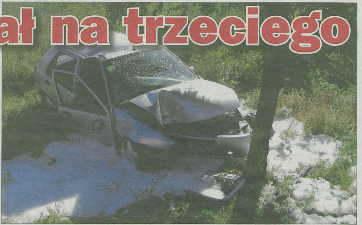
Do wypadku, w którym ucierpiało trzy osoby doszło w piątek, 16 sierpnia w Turkowicach.

Gdy na miejscu pojawiły się służby ratownicze, cała trójka była na zewnątrz. Mimo to lekarz pogotowia zdecydował się przewieźć poszkodowanych na obserwację do szpitala.