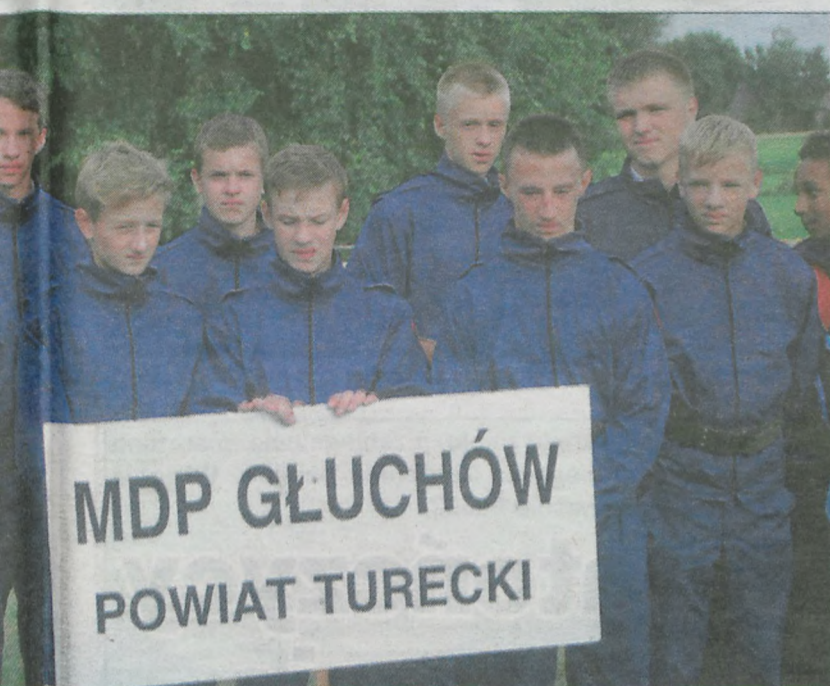
...ski byli nie do pokonania.