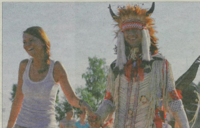
Dziewczęta lgnęły do przystojnych Indian.