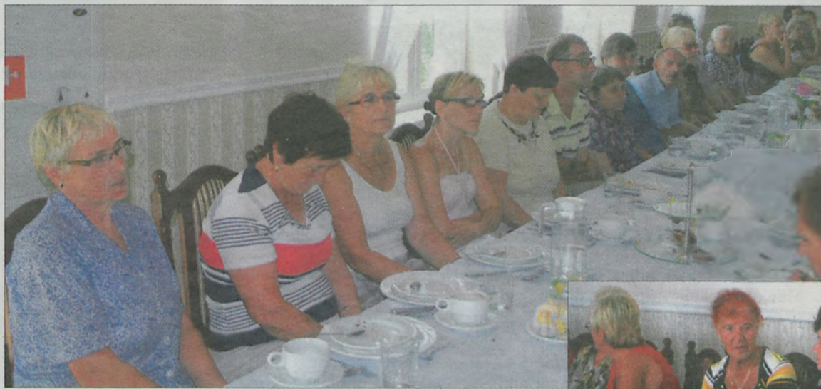
W spotkaniu wzięło udział około sześćdziesięciu osób w tym członkowie PZN (część z opiekunami) i goście.

Spotkanie trwało sześć godzin. Uczestnicy odjeżdżając deklarowali chęć wzięcia udziału w kolejnych. (art)