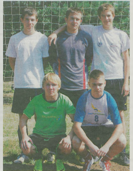
Uniejowska drużyna reprezentująca OSP Wielenin zajął pierwsze miejsce.