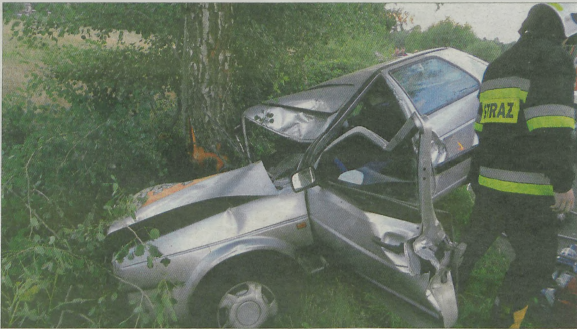
Przyczyną wypadku w Krępie była najprawdopodobniej zbyt brawurowa jazda kierowcy.

By wydobyć tuliszkiwianina z auta, strażacy musieli ciąć jego karoserię. Jednak mimo faktu, że wypadek wyglądał naprawdę poważnie, kierowcy nic się nie stało.