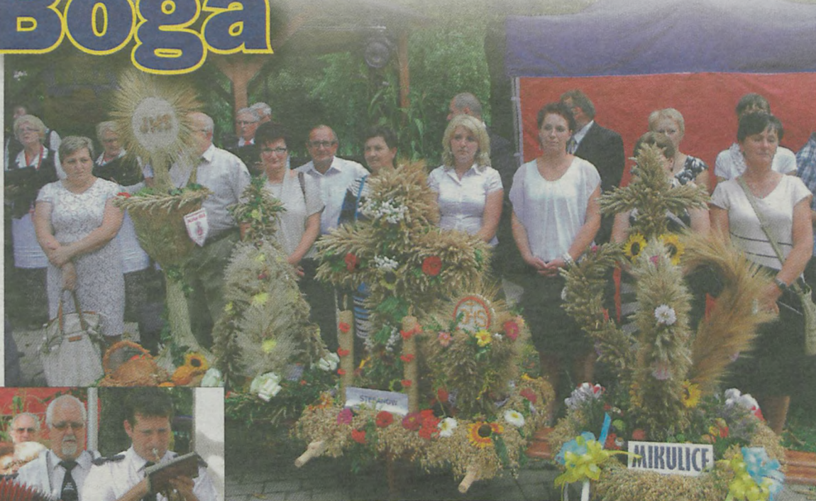
Delegacje dożynkowe ustawiły swoje wieńce przed sceną.