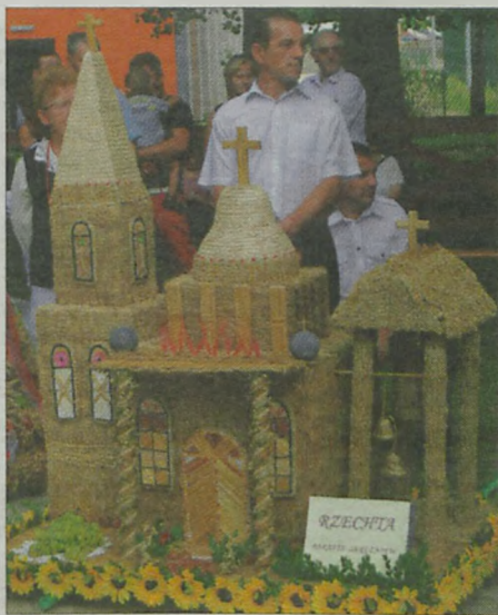
Najokazalszy wieńiec z Rzechty.