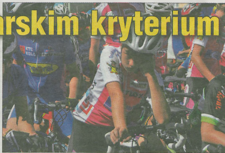
Długie oczekiwanie na start mogło znużyć...

Ponad cztery godziny zajęło przebiegnięcie maratonu biegaczom z klubu biegacza Geotermia Uniejów. Udział w imprezie wzięło dwanaście osób.