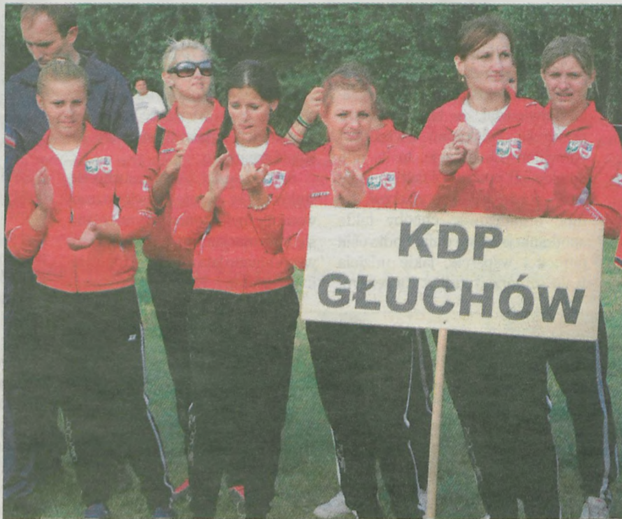
Kobiece drużyna pożarnicza z Głuchowa ponownie w drodze po najwyższe laury.