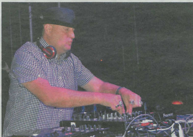
Dopiero po 2007 roku w Polsce wzrosło zainteresowanie moją muzyką – mówił w rozmowie z „Echem” Shaun Baker, sobotnia gwiazda wieczoru.

Na scenie nieopodal plaży prace przygotowawcze trwały już od samego rana. Tam zabawa przeniosła się po godzinie 17. I choć na początku tłumów nie było, to z każdą godziną przybywało coraz więcej osób. Organizatorzy szacują, że House Music Village w szczytowym momencie zgromadził około dziewięć tysięcy fanów muzyki house, nie tylko z Uniejowa i Turku, ale z całej Polski. Było to widać chociażby po tablicach rejestracyjnych na parkingu. Najwięcej samochodów było z województw łódzkiego i wielkopolskiego, ale zdarzały