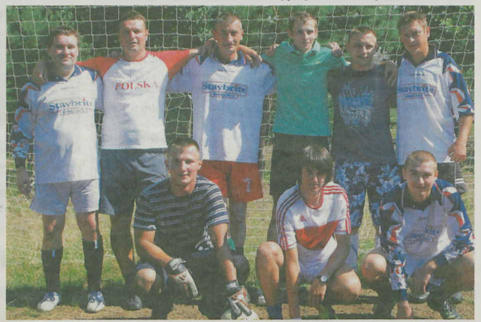
Reprezentacja OSP Roźniatów zajął drugie miejsce.