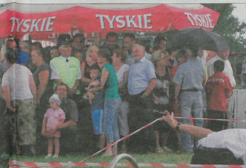
Kibice ściśnięci pod parasolem czekali, kiedy przestanie padać.