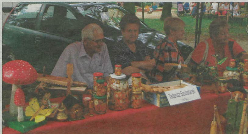
Stoiska wokół wyspy oferowały wyroby rękodzieła ludowego.