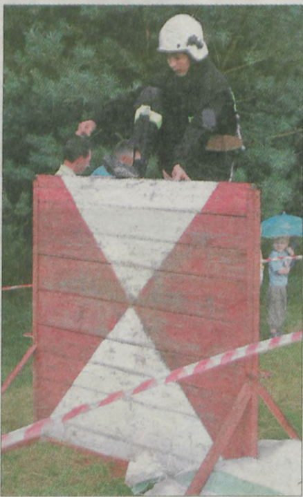
Ściana nie stanowiła przeszkody dla strażaków z gminy Kawęczyn.

do rywalizacji, choć rozważano rezygnację z równoważni po upadku jednego z zawodników. Wówczas jednak drużyny, które już wystartowały, musiałyby powtarzać konkurencję. Kibice w czasie ulewy chronili się w remizie, po chwili wrócili na plac zawodów.