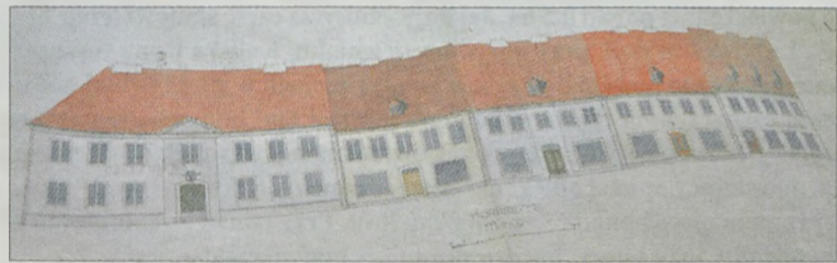
Plan prezentowany na zdjęciu przedstawia projekt północnej (z ratuszem) pierzei. W wizji okupacyjnych architektów budynek turkowskiego ratusza miał stracić swoją charakterystyczną wieżę.