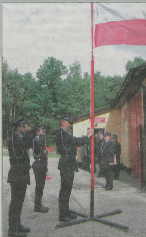
Uroczystości z okazji 60-lecia OSP przygotowano na placu przed wyremontowanym budynkiem.