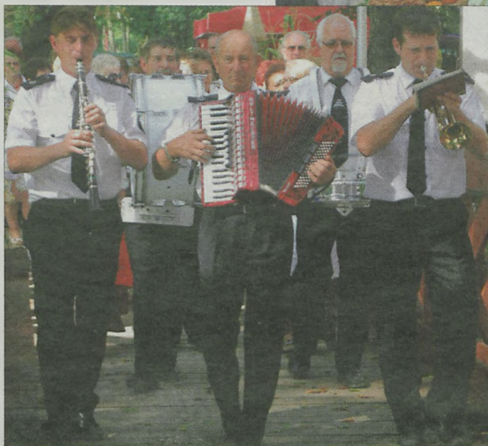
Korowód na wyspę poprowadziła Dobrska Kapela Biesiadna.