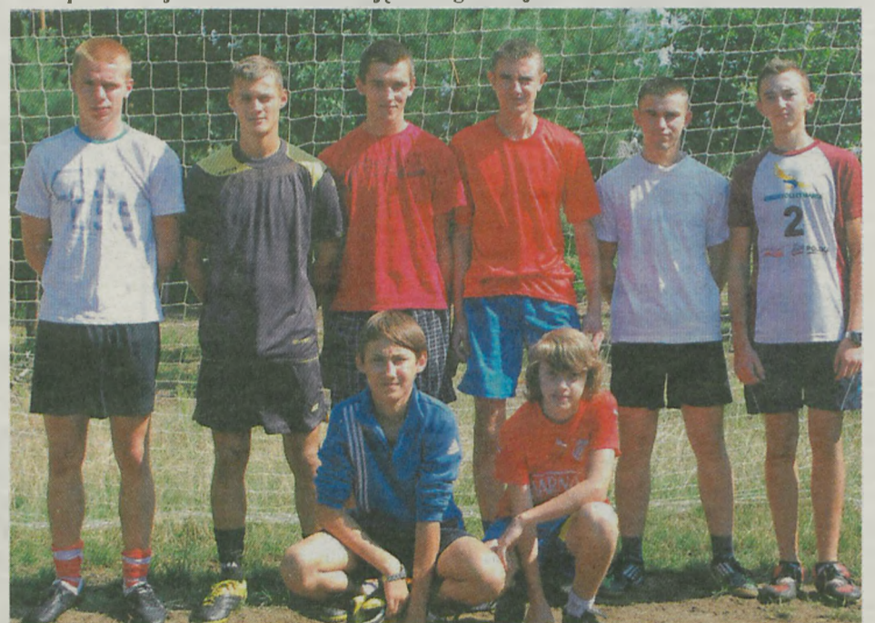
Młoda drużyna z Orzeszkowa wywalczyła trzecie miejsce.