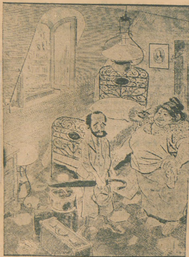
Gospodyni pensjonatu: — Za pokój trzeba regulować zgóry, bo Pan ma zwyczaj uciekać w nocy... Tęgo rodzaju niewybredny dowcip zamieszcza włoska gazeta „Il Travaso delle Idee“.