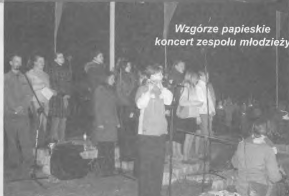
Wzgórze papieskie koncert zespołu młodzieżowego