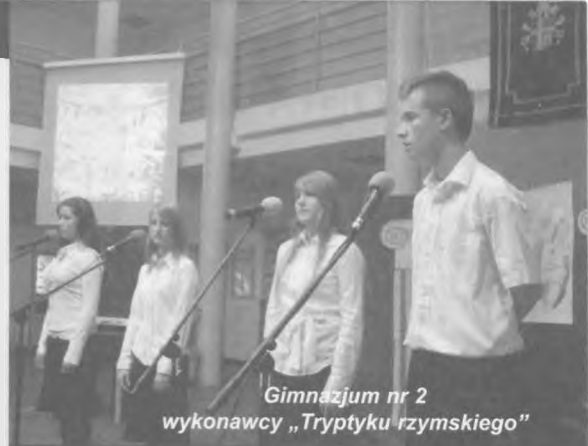
Gimnazjum nr 2 wykonawcy „Tryptyku rzymskiego”