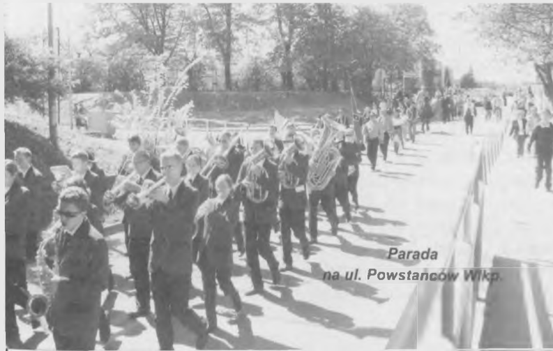
Parada na ul. Powstańców Wkp.