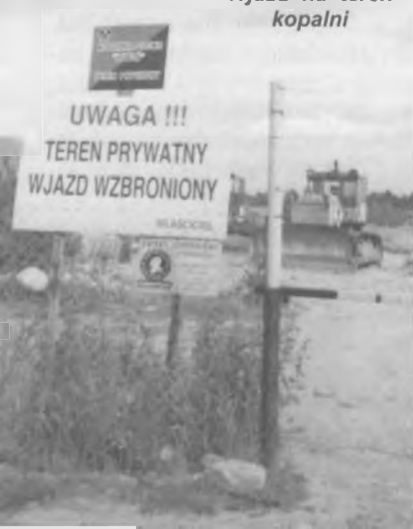
Wjazd na teren kopalni

nych cmentarzy. W tym miejscu, by wyjaśnić możliwe pochodzenie owych kości, rozrzuconych po wyrobisku w lubońskiej żwirowni, należy sięgnąć do historii miasta Poznania. Otóż na początku XX wieku władze pruskie uczyniły ze stolicy Wielkopolski miasto rezydencjonalne cesarza, by w ten sposób bardziej związać zrabowane ziemie polskie z państwem pruskim. Poszerzono wtedy granice administracyjne miasta o sąsiadujące z nim przedmieścia i w sie a w zaprojektowanym centrum pruskiego miasta (teren dzisiejszego Placu Wolności, Św. Marcin, Pl. Mickiewicza, ul. Fredry, aż po Kaponierę) likwidowano cmentarze, przenosząc je w odleglejsze miejsca. To wówczas powstał katolicki cmentarz na Wzgórzu Świętego Wojciecha i drugi - na stokach Cytadeli. Na miejscu zlikwidowanych nekropolii urządzono piękne parki i zieleńce. (Znaj-