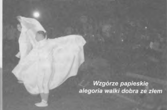
Wzgórze papieskie alegoria walki dobra ze złem