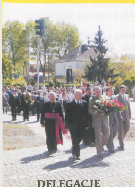
DELEGACJE POD KRZYŻEM MILENIJNYM

RADOSNE ŚWIĘTO MAJOWE W LUBONIU BYŁO INNE NIŻ ZAZWYCZAJ. PARADA PRZESZŁA ULICAMI NA STADION MIEJSKI, GDZIE RODZINNIE MIESZKAŃCY BAWILI SIĘ NA FESTYNIE.