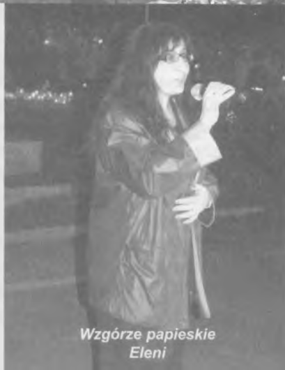
Wzgórze papieskie Eleni