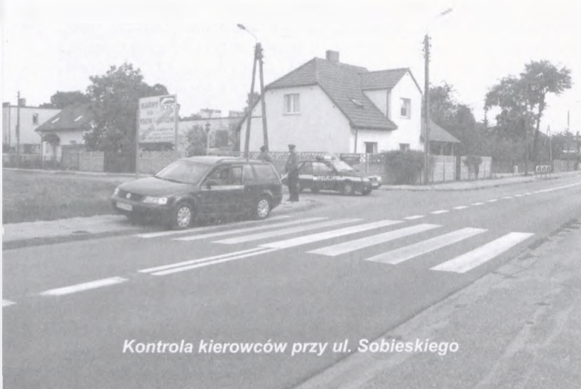
Kontrola kierowców przy ul. Sobieskiego

Policyjne patrole pojawiają się coraz częściej na ulicach naszego miasta. Niestety, patrole to nie wszystko! -Wysłuchaliśmy „Polonez” nie ma szans dogonić złodziei samochodów - mówili nam rozgoryczeni policjanci, którzy wstydzą się swojej bezsilności. Być może już wkrótce powód ich wstydu trafi na złom! Rada Miasta Luboń zatwierdziła we wrześniu przeznaczenie 30 tys. zł z samorządowego budżetu na dofinansowanie zakupu nowego radiowozu dla Komisariatu Policji w Luboniu. L.K.