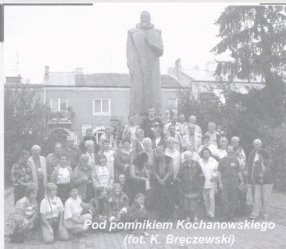
Pod pomnikiem Kochanowskiego

Z osobą „ojca poezji polskiej” wiąże się miejscowości: Sycyna, w której się urodził, Zwolen – z kościołem i szkołą parafialną do których uczęszczał oraz oczywiście Czarnolas - własność Jana Kochanowskiego. Tu powstała większość jego utworów. To miejsce znamy z fraszek „poematów i trenów. Mieliśmy okazję usiąść na kamieniu pod nieistniejącą już lipą, oraz zwiedzić muzeum w dworku zbudowanym na miejscu dawnego, drewnianego dworu Kochanowskich. Ciekawostką dla nas była informacja, że właściwie nikt nie wie jak wyglądał Jan Kochanowski! Najbardziej prawdopodobną jego podobizną jest płaskorzeźba z kościoła w Zwoleniu. (Pomnik w Czarnolesie to