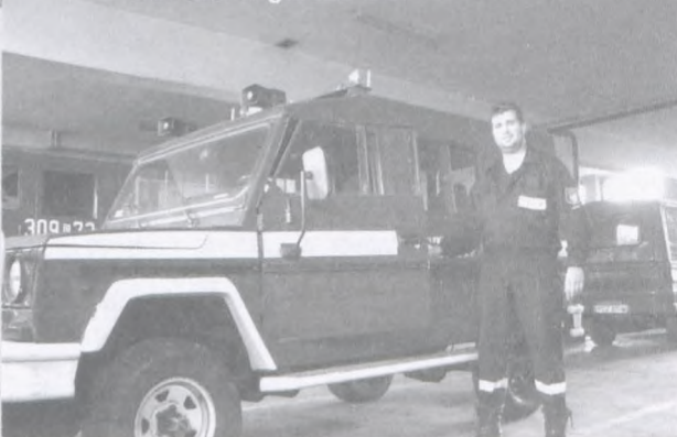
Dar stoi w garażu OSP

żyły się na nagrodę, w postaci dobrego sprzętu. Honker już jest w Luboniu. Kiedy wyposażony zostanie jeszcze w radiotelefon i doprowadzony „do polysku”, zastąpi starego „Żuka”, znajdującego się w naszej OSP. (Tego „Żuka” z kolei otrzyma w darze jakaś mniej zasobna jednostka OSP. Najprawdopodobniej OSP-Daszewice.) Za naszym pośrednictwem druhowie z OSP Luboń gorąco dziękują Wielkopolskiemu Komendantowi Wojewódzkiemu i Komendantowi Miejskiemu PSP za ten niespodziewany dar. Honker bardzo się przyda do wstępnego rozpoznania zgłaszanych zagrożeń, powiedzieli nam lubońscy strażacy! M.R.