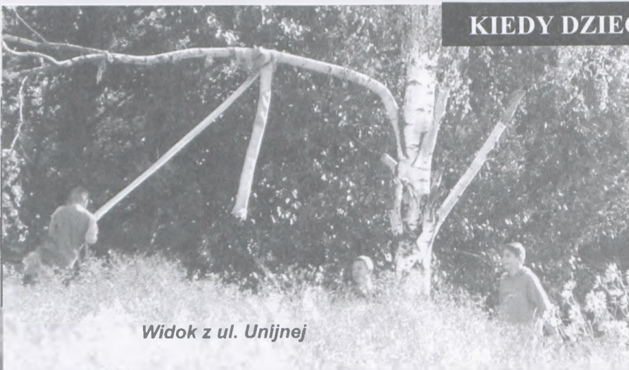
Widok z ul. Unijnej