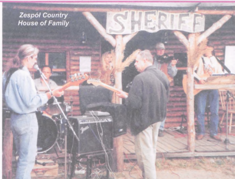
Zespół Country House of Family