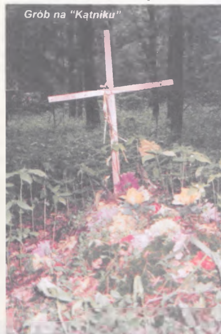
Grób na „Kątniku”