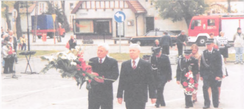
Święto 3 Maja 2003 w Luboniu

janowskiego młodzież szkolna prezentuje okazjonalny montaż słowno-muzyczny, chór „Bard” śpiewa wzniosłe pieśni, na koniec przemawia Burmistrz Miasta, delegacje składają kwiaty a poczty sztandarowe defilują przed pomnikiem „Znicz pokoju”. Rzecz w tym, że ta część uroczystości odbywa się już ze znikomym udziałem mieszkańców miasta! Także tegoroczne obchody 3-go Maja wyglądały identycznie! W Luboniu nie znalazła się nawet setka osób, z własnej i nieprzymuszonej woli chcąc uczcić odzyskaną demokrację! Młodzież z Gimnazjum nr 1 występowała dla własnej satysfakcji, podobnie jak chórzyci i dwaj trębacz, mający podkreślić podniosłość chwili! Jako naród chyba nie lubimy tego święta! Nie zdobimy ulic i domów flagami, nie oka-