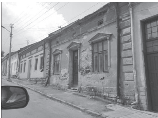
Domy w zabudowie szeregowej w Przemyślanach, zapewne na ulicy Borszowskiej. 2018 r.