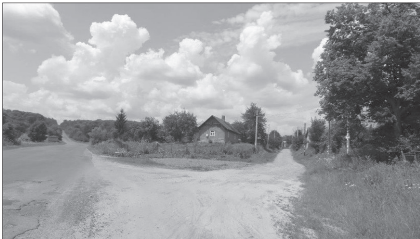
Szosa Świrz-Bóbrka (po lewej) i droga polna przez Świrzyk, stan 2013 r.

fikowane jako łąki - 1929 mórg 1288 sążni (w tym: łąki - 978 mórg 213 sążni, stawy - 68 mórg 590 sążni, ogrody i sady - 173 mórg 1152 sążni, pastwiska - 709 mórg 933 sążni), a lasy - 1363 mórg 135 sążni. Z tego do gruntów dominikalnych możemy zaliczyć 329 mórg 495 sążni pól ornych, 968 mórg 1259 łąk i ogrodów oraz 1363 morgi 135 sążni lasów, a jako grunty rustykalne można zaklasyfikować 630 mórg 1155 sążni ziemi ornej i 961 mórg 29 sążni łąk i ogrodów.