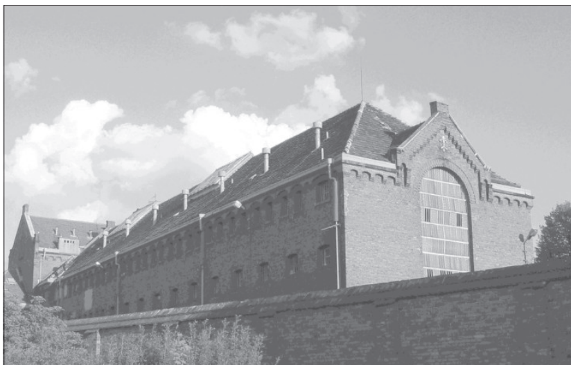
Więzienie we Wronkach.

Tym razem nie przyjęto mnie na leczenie. Potem często czułem się źle; miałem powody, bo bolała mnie złamana zaraz po aresztowaniu no-