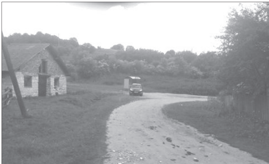
Rozpoczęta budowa domu w Plenikowie przy przystanku.

ca pokaże. Chcę oprócz Plenikowa zajrzeć do Ciemierzyniec i Wiśniowczyka. Żeby tylko pogoda dopisała.