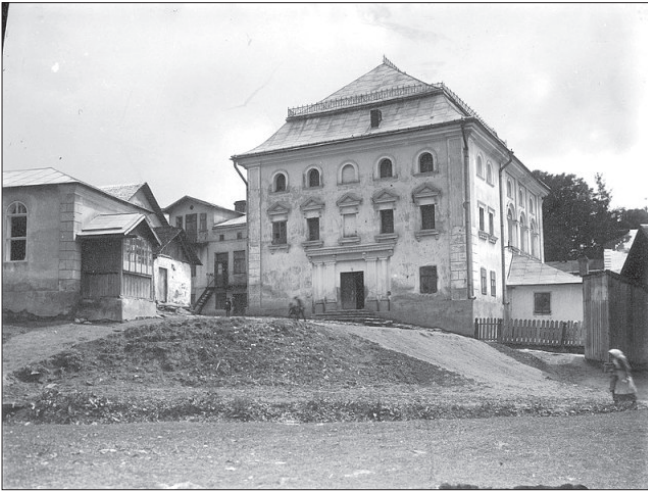
Synagoga w Przemyślanach z XVII w.

jennych zeznań ocalałych Żydów, „ukraiński tłum” zaatakował przywódców społeczności żydowskiej. Belzer Rebe (szef historycznej dynastii chasydzkiej z Belżca), która szukała schronienia w Przemyślanach przed okupowaną przez hitlerowców Polską, ledwo uciekł. Jego syn nie miał tyle szczęścia i został wrzucony do płonącej synagogi. [1]