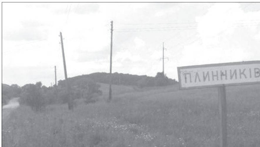
Tablica stojąca na początku Plenikowa.

Zamieszkaliśmy w zespole „Hotel i Restauracja Complex HOP-OK” w miejscowości Brodki, w odległości około trzydziestu kilometrów od Lwowa przy drodze magistralnej M-06. W hotelu było tak, jak pisali w swojej reklamówce: goście mają dostęp do baru, ogrodu i tarasu. Oferuje on restaurację, całodobową recepcję oraz bezpłatny bezprzewodowy dostęp do internetu w całym budynku. Dostępna jest obsługa pokoju. Hotel oferuje bezpłatny parking oraz płatny transfer lotniskowy. Wszystkie pokoje wyposażone są w telewizor z płaskim ekranem i dostępem do kanałów telewizji kablowej. Pokoje w kompleksie są klimatyzowane i posiadają łazienkę.