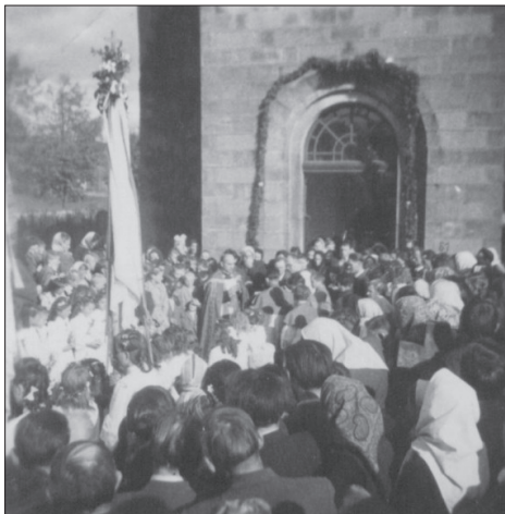
Uroczystość przed wejściem do cerkwi grekokatolickiej w Świrzu, lata 30. XX w.