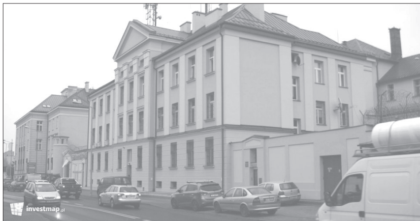
Zakład karny w Tarnowie.

się szyby. Oczywiście według krążącej famy byliśmy mordercami, działającymi w bandach i bojówkach. Część z mieszkańców z pewnością się nas bała. Ale pewnie byli i tacy, którzy nie wierzyli propagandzie. Po przejściu przez główny deptak, dotarliśmy do zakładu karnego.