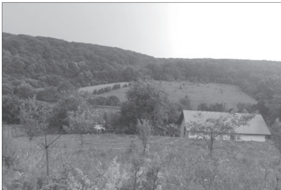
Jeden z nielicznych domów w Plenikowie.

powiada, po zastanowieniu, że byli tacy. Ale ich nie ma. Ich domu też nie ma. Spalił się w czasie wojny. Pytam o Czajkowskich. Pamięta. Ale ich też nie ma od wojny. Domu też nie ma. Dopytuję tego człowieka o jego wiek. Mówi, że urodził się w 1936 roku. Myślę, że ten Pan raczej nie opierał się na swoim pamiętaniu tamtych czasów. Raczej pamiętał to, co mówiono, o czym opowiadano. Niestety w krótkiej rozmowie nie wyjaśniłem tego. Pamiętałem bowiem, że według nacjonalistów ukraińskich, w tamtym czasie Czajkowsy i Zawadzcy byli ciemżycielami ludu ukraińskiego. Wręczam kobiecie książkę Pana Zawadzkiego, mężczyźnie drugą. Są zdziwieni, ale przyjmują książki z podziękowaniem.