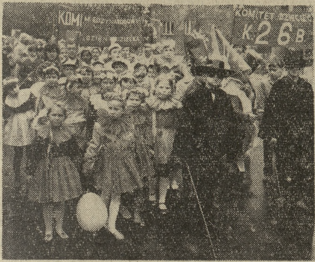
27 bm. rozpoczęły się uroczystości obchodów Międzynarodowego Dnia Dziecka. Na zdjęciu: barwny korowód, w którym uczestniczyło około 800 dzieci, na ulicach Warszawy.