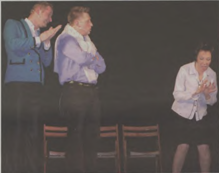
Gwiazdą sobotniego wieczoru był kabaret Nowaki.

kami, stworzyli grupę Memento Mori, która także brała udział w TESKO. –Gdy wyjechałem cztery lata temu na studia do Łodzi, kabaret nie miał już racji bytu, ale konferansjerkę bardzo chętnie prowadzę – opowiada Nowakowski. Nie znalazł się nikt chętny, kto chciałby poprowadzić Memento Mori. Kilka razy pojawiały się na spotkaniach miejscowe grupy, działające przy technikum w Turku czy Kaczkach Średnich. I na tym koniec.