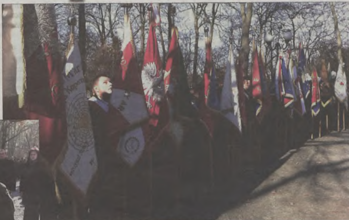
W uroczystości pod pomnikiem udział wzięło kilkadziesiąt pocztów sztandarowych

Oficjalne uroczystości rozpoczęła msza w kościele pw. Najświętszego Serca Pana Jezusa. Zgromadzili się na niej samorządnicy, a uczestnicy uroczystości udekorowali postument morzem z wiązanek kwiatów.