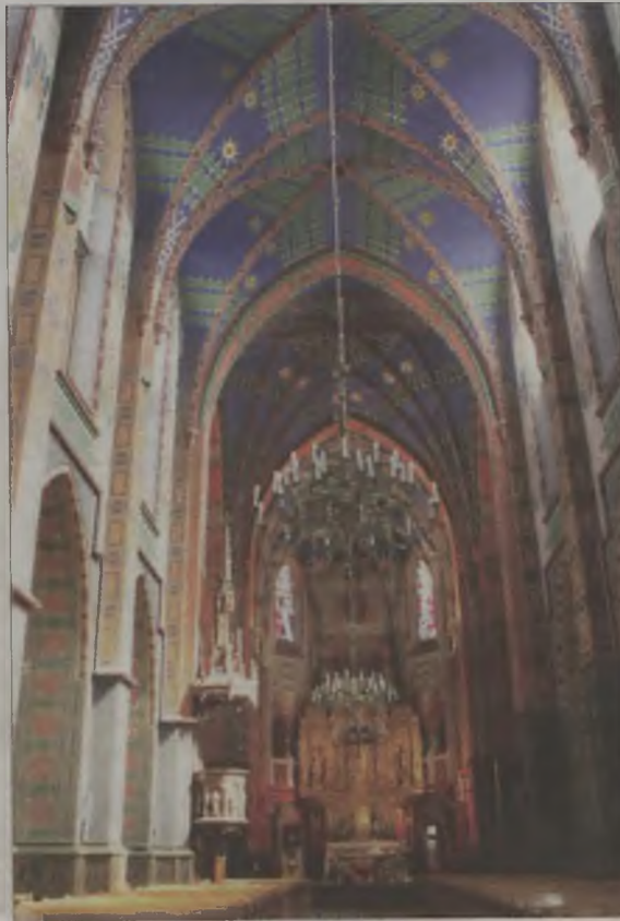
Tak wnętrze kościoła wyglądało w 1936 roku