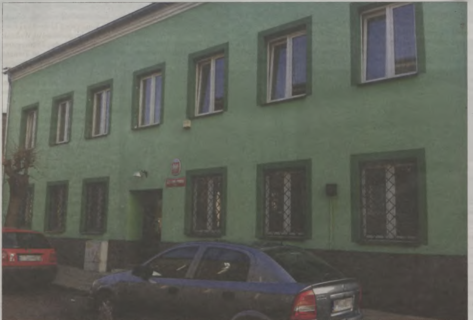
Najpierw szkoła, potem wojsko, a teraz miasto zajmować będzie historyczny budynek