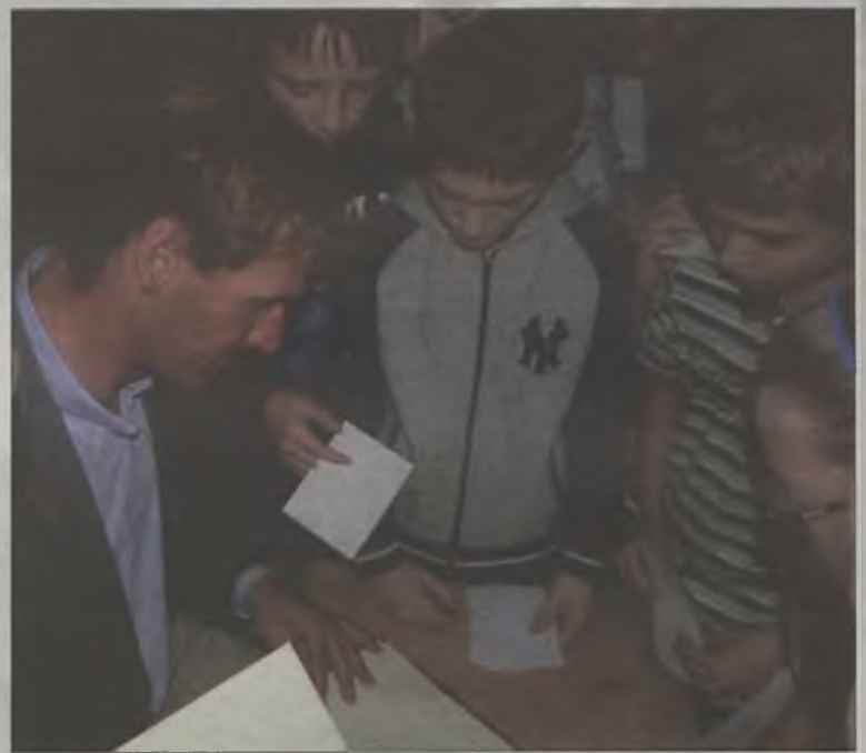
Mistrz olimpijski propaguje żeglarstwo wspierając konkursy dla dzieci z uczniami „Jedynki”. Mówił im przede wszystkim o swojej pasji - żeglarstwie, o ciężkiej pracy, jaką dochodził do sukcesów oraz swoich osiągnięciach. Opowieść ubarwił prezentacją slajdów. Potem rozdawał autografy i pozował do zdjęć.

Nie było łatwo „wstrzelić się” w napięty kalendarz sportowca, ale wreszcie udało się. Mistrz przyjechał do Turku pod koniec października i spotkał się