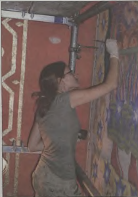
Centymetr po centymetrze konserwatorzy przemaalowali 3 tys. metrów kw. powierzchni

wówczas skandalicznej renowacji polichromii, która sprowadzała się do zamalowania oryginalnej warstwy nową, w dodatku połączoną zupełnie inną techniką. To wszystko spowodowało, że u progu XXI wieku dzieło Józefa