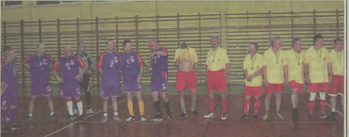
Trwająca dwa razy po 15 min. rywalizacja „Zbędnych” z „Niepotrzebnymi”, zakończyła się wynikiem 8:4 na korzyść tych pierwszych. I trzeba przyznać, że sporą zasługę w tym miał Krawczyk Junior.