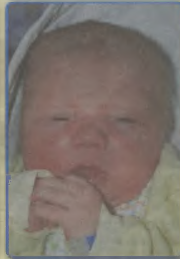
...Gunia syn Magdaleny i Tomasza ur. 23 listopada, godz. 0.15 waga 3700, długość 56 cm