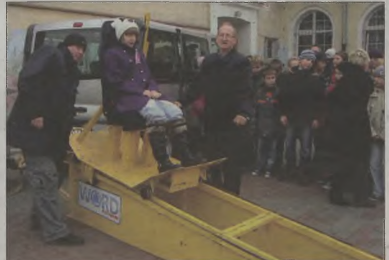
Uczniowie SP 1 podczas testowania symulatora zderzeń

ogólnopolskiej akcji „Wypadki na drogach – porozmawiajmy”. Tematem przewodnim tegorocznej edycji było „Bezpieczeństwo w pojeździe, pasy bezpieczeń-