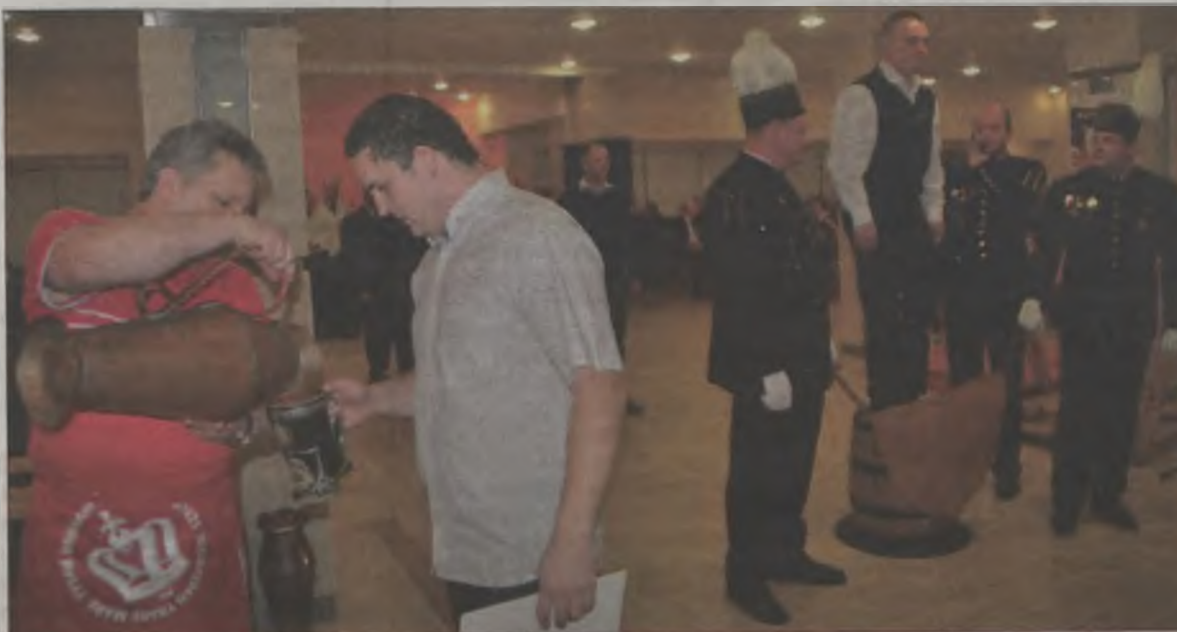
Po skoku i pasowaniu, awans konsumowany był w postaci złocistego płynu.