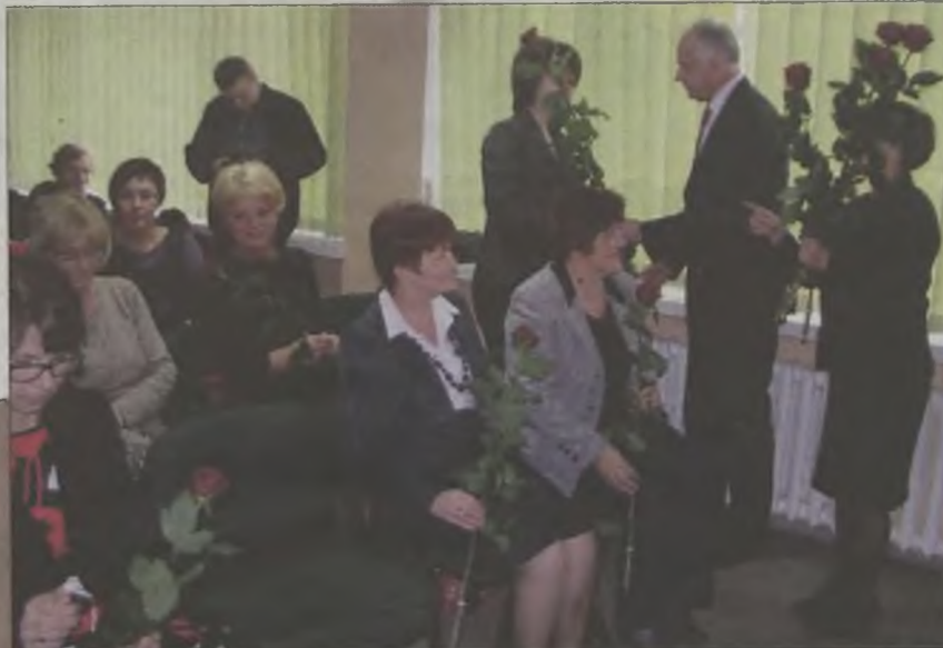
Z okazji Dnia Pracownika Socjalnego były też życzenia i kwiaty.

dzięki pracownikom gminnych i miejskich ośrodków pomocy społecznej wychowankowie placówki, mieli szansę skorzystać m.in. z turnusów rehabilitacyjnych, bezpłatnych obiadów oraz pomocy rzeczowej i materialnej. A w tym roku, dzięki projektowi „Na ju-