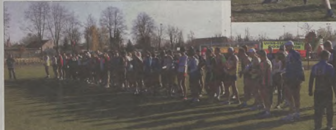
Gotowi do biegu uczestnicy biegu głównego...

dowcy, kombatancki, przedstawiciele organizacji państwowych, społecznych i politycznych, szkół, związków zawodowych oraz wielu mieszkańców miasta. Było też kilkadziesiąt pocztów sztandarowych. Po mszy pochód prowadzony przez orkiestrę OSP Turek przemarszerował do Parku Miejskiego im. Żerminy Składkowskiej. Tam, przed pomnikiem Marszałka Józefa Piłsudskiego