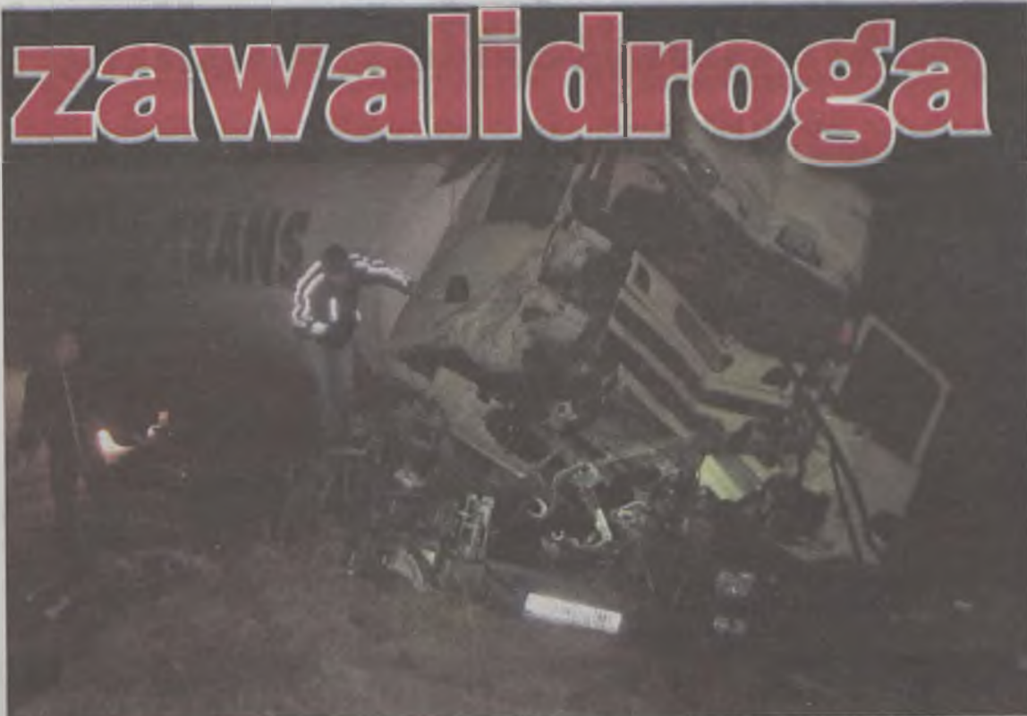
Choć wypadek wyglądał bardzo groźnie, żadnemu z kierowców nic się nie stało.

Wszystko nie trwałoby tak długo, gdyby na miejscu był dźwig, bo jedynie on jest w stanie podnieść TIR-a. Trzeba było czekać, aż zostanie ściągnięty z Konina. Dlatego dopiero po godzinie 11.00, udało się udrożnić drogę. aksa