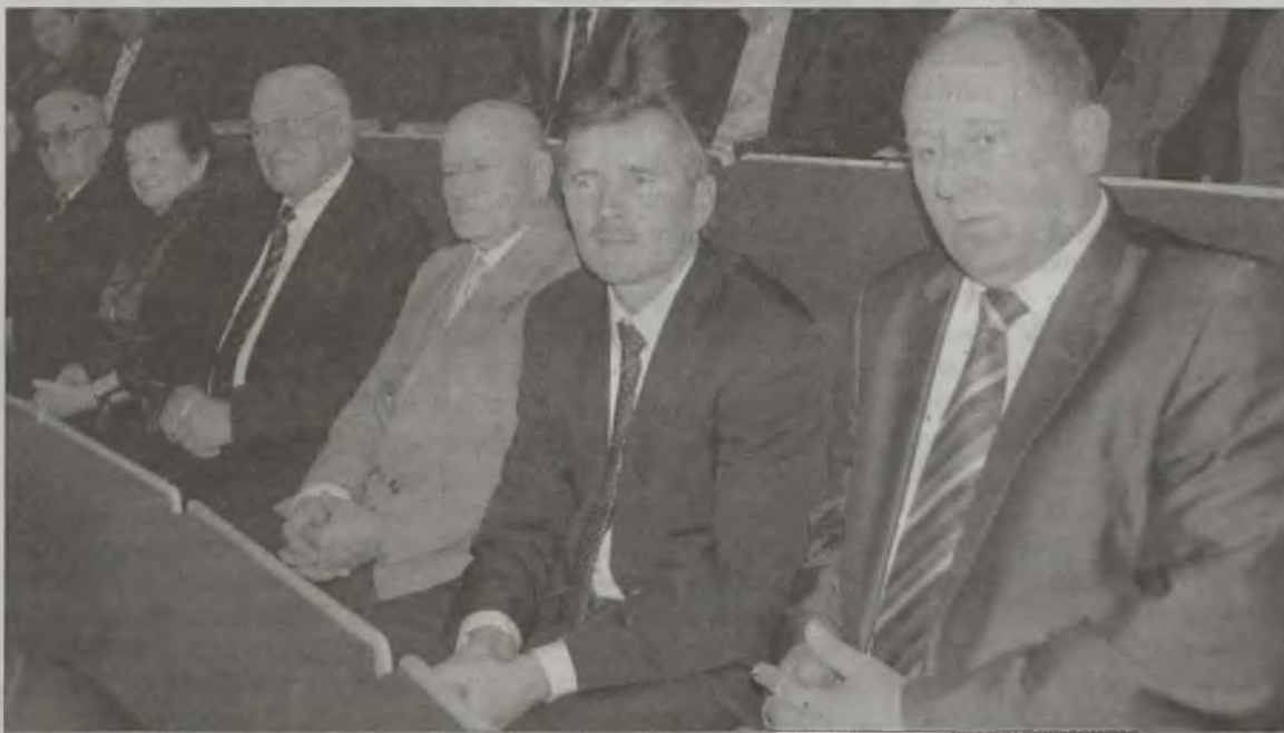
Sześciuosobowa delegacja z gminy Kawęczyn.

się na przykład sytuację z powołaniem komendanta policji, który teraz kandydował do Sejmu z listy SLD. Stwierdził też, że bulwersują go wygórowane diety radnych, czego nie było w pierwszej kadencji samorządu. Jego zdaniem, radni powinni działać całkowicie społecznie. Na koniec oznajmił, że teraz jest na emeryturze społecznej i politycznej.