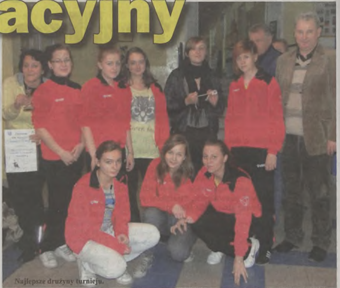
Najlepsze drużyny turnieju.

wając z Malanowem 2:0 (25:16) (25:15) i z tureckim Gimnazjum 2:0 (25:9) (25:15). Gimnazjalistki pomimo przegranej wyjechały z Uniejowa usatysfakcjonowane. Męskie drużyny podchodziły do nich bardzo szarmancko, a publiczność głośno dopingowała. Stały się jej ulubienicami. Nie dziwi więc, że obiecały wziąć udział w kolejnym turnieju, który odbędzie się w lutym przyszłego roku. Z grupy czwartej awansowała Przykona, pokonując po 2:0: Nadleśnictwo Turek i Zadzim I (25:20) (25:16). Półfinale Przykona pokonała Dobrą 2:0 (25:21) (25:13), a Grabów zwy-