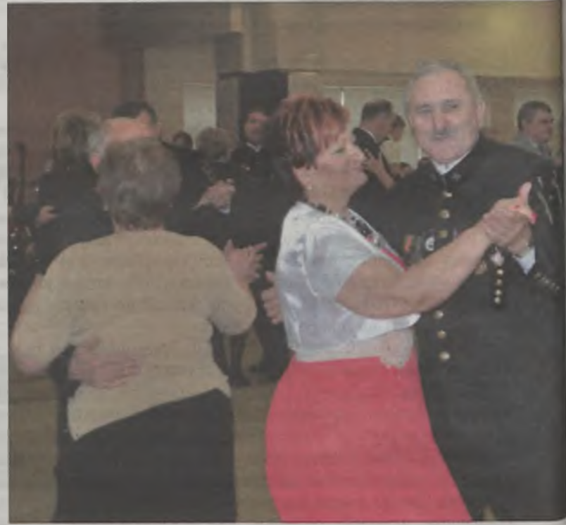
Zespół muzyczny sprawił, że najbardziej zasłużeni pracownicy, ochoczo