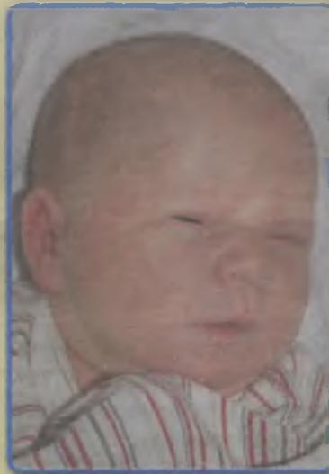
...Borkowska córka Wiesławy i Krzysztofa ur. 20 listopada, godz. 4.15 waga 3400, długość 55 cm