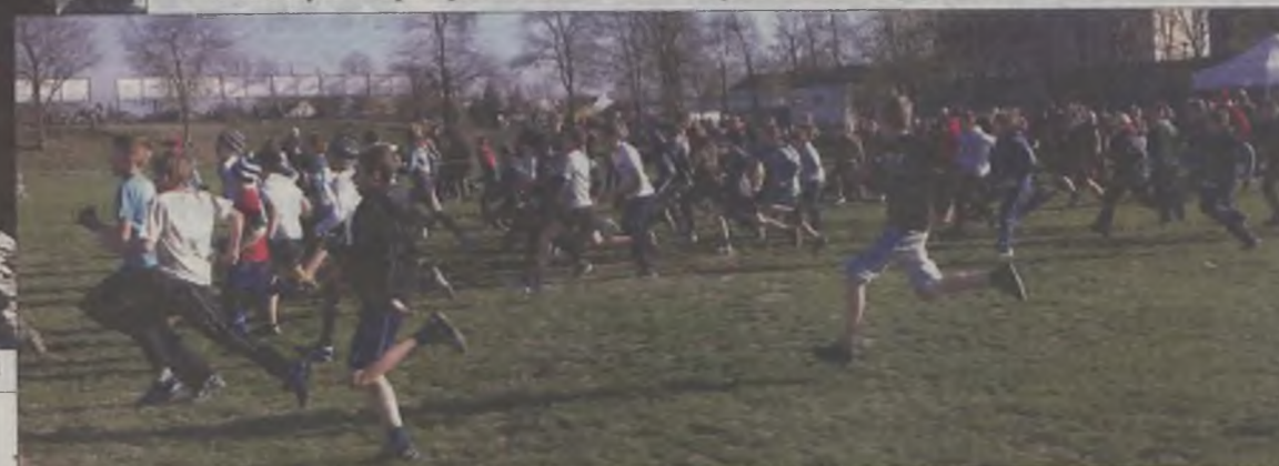
...i w pełnym biegu uczniowie szkół podstawowych