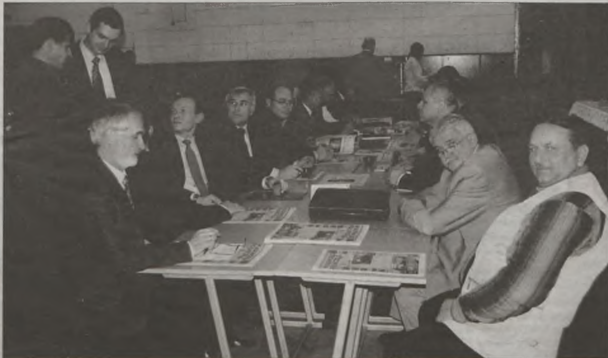
W ubiegły piątek i sobotę w podturkowskich Kaczkach Średnich na trzecie walne Zgromadzenie WIR zjechali się delegaci z całej Wielkopolski.