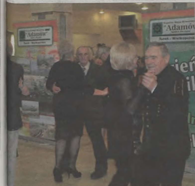
Podrywali się do tańca.