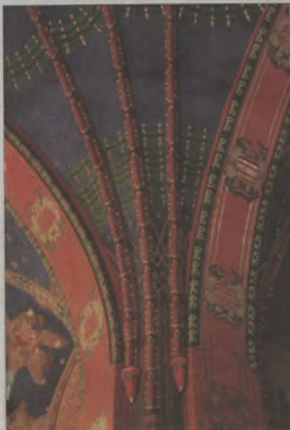
A oto odnowiona polichromia w pełnej krasie

Wreszcie, po 27 długich miesiącach, prace dobiegają końca. Z kościoła niebawem znikną rusztowania, a wtedy cała odrestaurowana polichromia załśni nowym blaskiem. Ł. Maciejewski