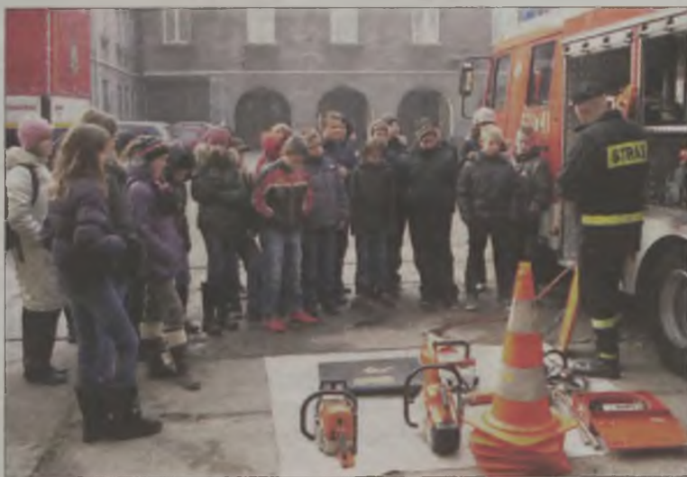
Uczniowie SP 4 na pokazie sprzętu strażackiego

ogólnopolskiej akcji „Wypadki na drogach – porozmawiajmy”. Tematem przewodnim tegorocznej edycji było „Bezpieczeństwo w pojeździe, pasy bezpieczeń-