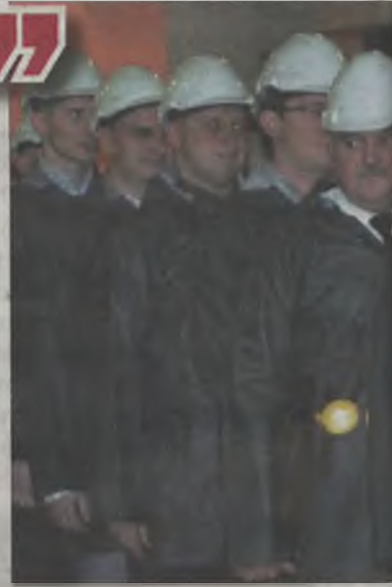
„Młode Lisy” przygotowane do