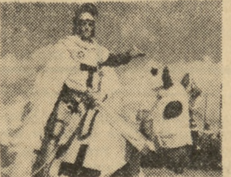
Scena z filmu prod. polskiej pt. „Krzyżacy”

KALISZ — „Pierwszy dzień wolności” Kina APOLLO — ul. Ratajczaka — g. 10, 12.30, 15.30, 18, 20.15 „Hiroshima moja miłość” (franc. 16 l.) BAŁTYK — ul. Roosevelta — g. 11, 16, 19.30 „Krzyżacy” (polski 12 l.)