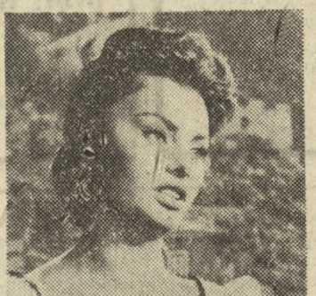
Sophia Loren w filmie prod. włoskiej pt.: „Chleb, miłość i...“

APOLLO — ul. Ratajczaka — g. 10, 12.30, 15.30, 18, 20.30 — „Pół żartem, pół serio“ (USA, 18 l.) BALTYK — ul. Roosevelta — g. 15.30, 18, 20.30 — „Chleb, miłość i...“ (włoski, 16 l.)