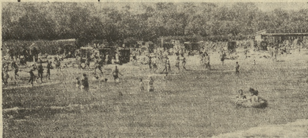
Tym razem przepowiednie meteorologów spełniają się: na początku sierpnia pogoda miała się poprawić. I rzeczywiście — od dawna oczekiwane słońce coraz częściej wygląda zza chmur. Oczywiście powoduje to natychmiast wzmożony ruch na plażach, jak to widać na naszym zdjęciu z Sopotu.