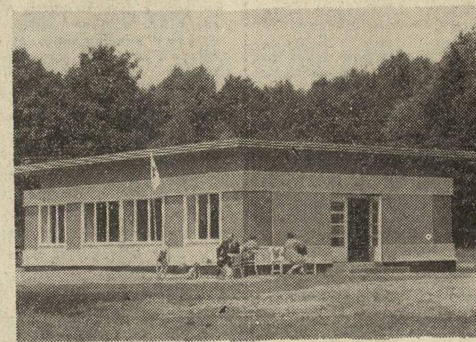
Budynek gospodarzy nad Rusałką, w którym mieści się również punkt sanitarny. Wszystkie trzy pawilony — restauracyjny, gospodarzy oraz szatnia otrzymały efektowną, kolorową szalę.

W Kiekrzu na razie przygotowano plażę i wypożyczalnię leżaków. Po zakończeniu sezonu przystąpi się do postawienia dwóch pawilonów — szat-