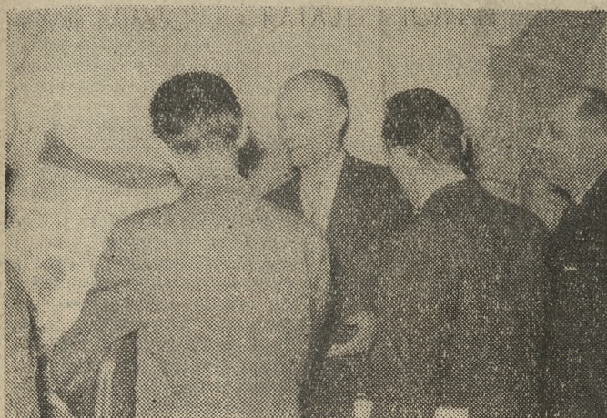
RADNI PRZED MAPĄ MIASTA

Członkowie Prezydium Rady Narodowej m. Poznania i radni przed mapą miasta, uwzględniającą nowe kierunki rozwoju.