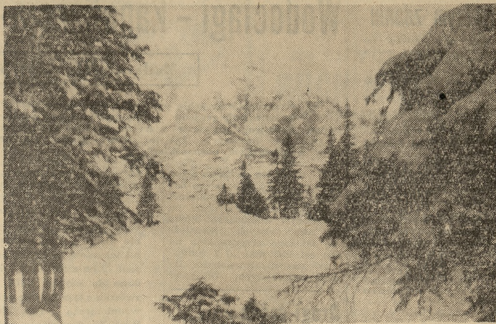
Fot. — autor

Koszty ubezpieczenia są niewspółmiernie niskie do ryzyka i naprawdę nie warto próbować organizowania wycieczek bez dopełnienia formalności ubezpieczeniowych w najbliższym Inspektoracie PZU. (na)