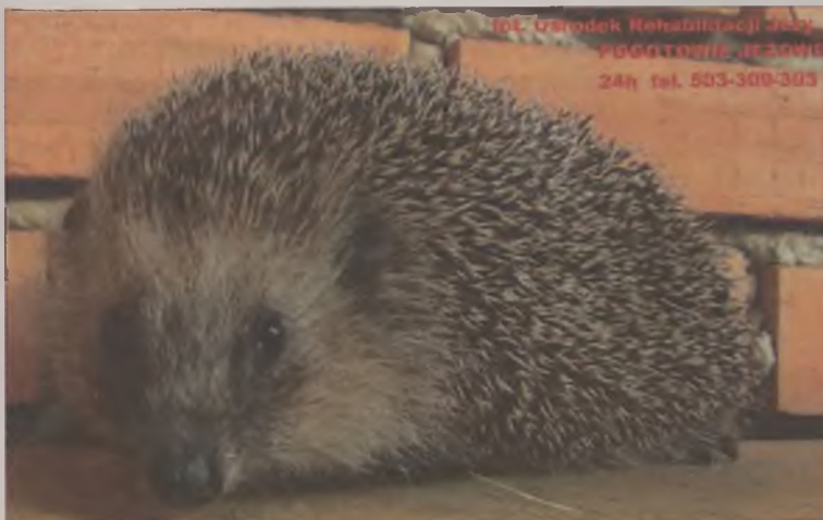
Jeż zachodnioeuropejski Erinaceus europaeus .

W Polsce występują dwa gatunki jeży: jeż zachodnioeuropejski (łacińska nazwa naukowa Erinaceus europaeus ) (fot. 1) oraz jeż wschodni (po łacinie: Erinaceus roumanicus ) (fot. 2). Należą do rzędu jeżokształtne, rodziny jeżowate. Są to ssaki o nocnym trybie życia, dzień spędzające w różnych schro-