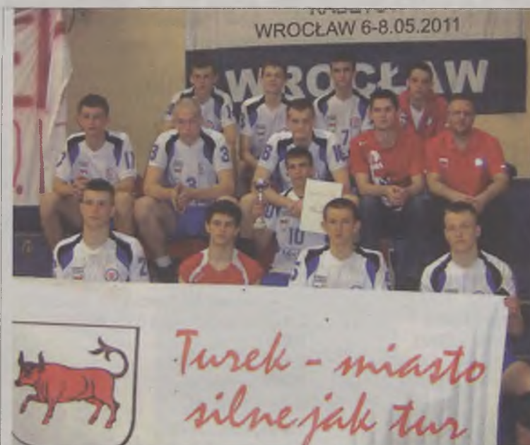
Turkowskie siatkarze podczas wrocławskiego ćwierćfinału Mistrzostw Polski kadetów wywalczyli awans do półfinału.

W meczu otwarcia turnieju turkowie czekała niespodzianka - Metro Warszawa pokonało gospodarza - Gwardię Wrocław 3:2. Zawodnicy „Piątki” w pierwszym spotkaniu gładko pokonali zespół Żaka Pyrzyce 3:0. W drugim dniu turnieju UKS rozprawił się z Metro Warszawa 3:1, a Gwardia Wrocław zgodnie z przewidywaniami pokonała Żaka 3:0. Wszystko rozstrzygnęło się w niedzielne przedpołudnie. Metro pokonało Żaka 3:0 i do walki stanęły zespoły UKS i Gwardii. Młodzi siatkarze Gwardii, aby