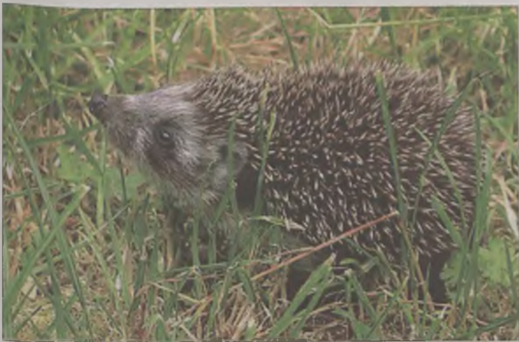
Jeż wschodni Erinaceus roumanicus .

jeżach oraz popularyzowanie wiedzy o tych tylko pozornie dobrze znanych ssakach.