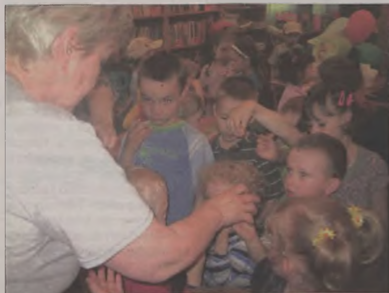
Chętnych na kanapki z miodkiem nie brakowało.

i lubiany przez wszystkie dzieci miś, lubiący słodki miód i zawsze czujący w brzuszku głód, zachęcał do wypożyczania i czytania książek. Projekcja filmu rysun-