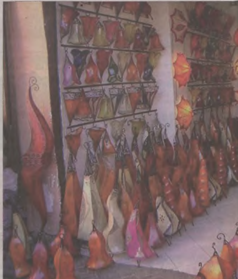
Lampy skórzane na bazarze w Marrakeszu.