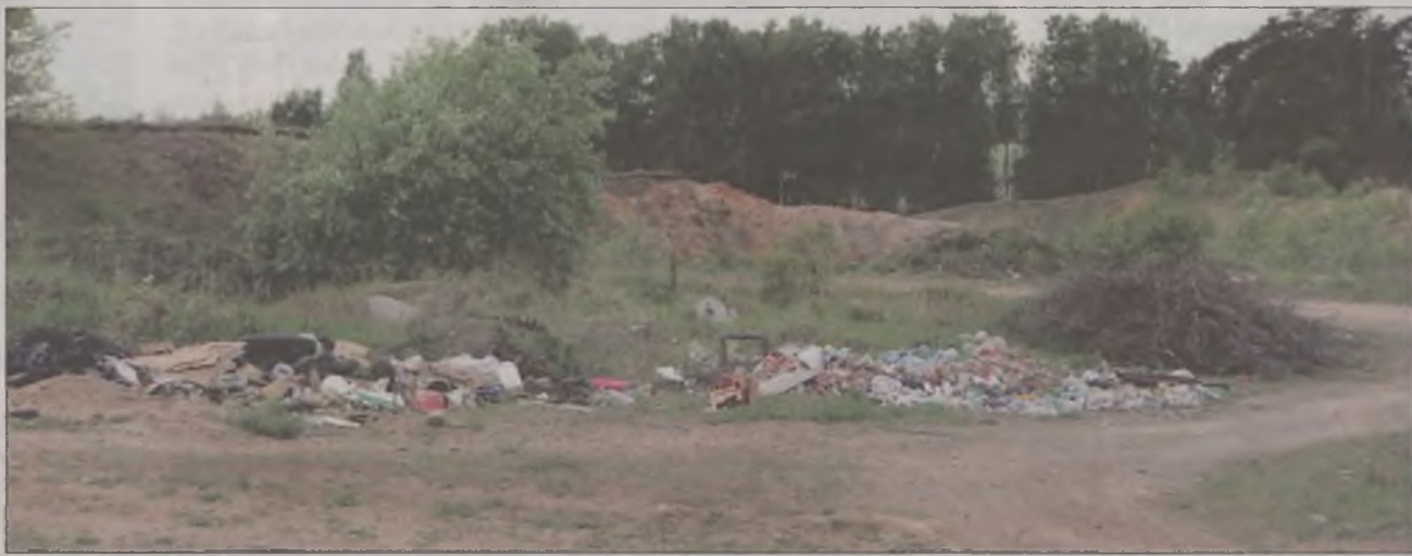
Choć na terenie gminnej żwirowni fani sportów ekstremalnych chętnie jeżdżą jeepami i na quadach, teren wokół powoli zmienia się w dzikie wysypisko.

Dzikie wysypisko tworzy się także w leżącej nieopodal żwirowni. A Młyny mają aż dwie, jedną prywat-