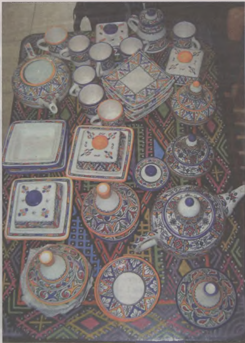
Marokańskie wzory na ceramice.