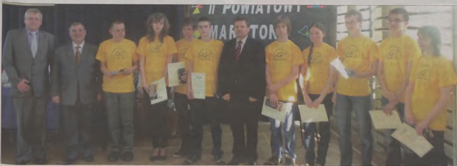
Trzy zwycięskie drużyny z Turku, Tuliszkowa i Władysławowa.

Organizatorami maratonu byli nauczyciele matematyki Gimnazjum nr 2. boxa