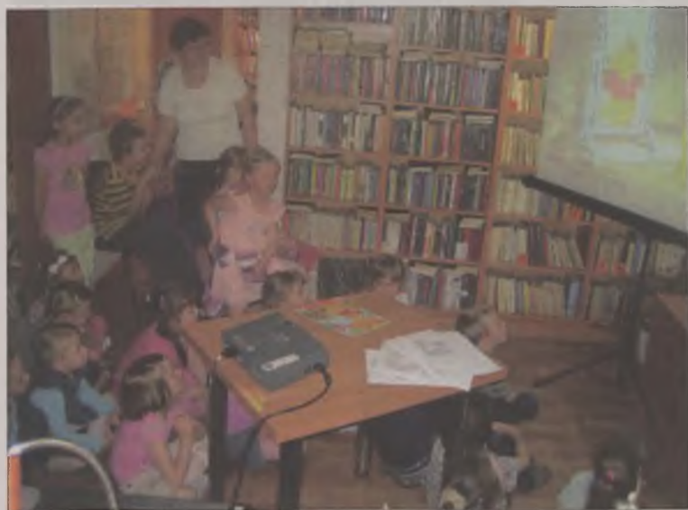
Obejrzano film o Kubusiu Puchatku.

bliotek. Przez cały tydzień tamtejszą Miejsko-Gminną Bibliotekę Publiczną odwiedzali najmłodszy czytelnicy. Przygotowano dla nich wiele zajęć i warsztatów.