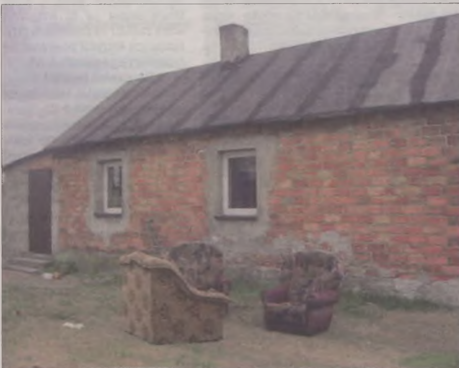
W domu na wzgórzu nie doszło do morderstwa.

Obaj tuliszkowianie prowadzili hulawczy tryb życia. Ludzie mówią, że pili wszystko i w każdych ilościach, nie wyłączając „ulubionego”, najtańszego alkoholu na rynku, denaturatu. „Dykta” była praktycznie codziennością. Obaj byli też doskonale znani policji, a i szerszemu gronu mieszkańców. W zasadzie można powiedzieć, że dzięki „rapowym” nagraniom jakie ukazywały się na YouTube obu, a zwłaszcza zmarłego, znał cały Tuliszków, niestety nie z tej lepszej strony.