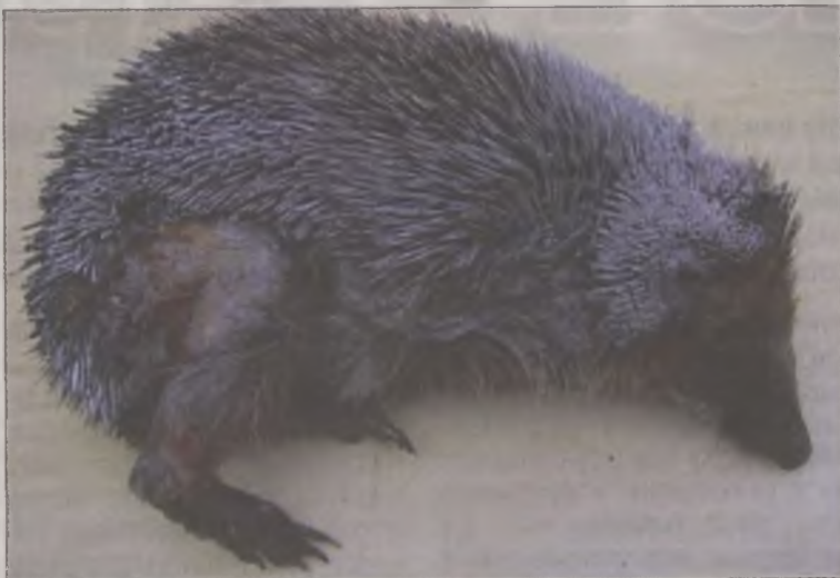
Ciężko poparzony jeż zachodni ocalony z celowo wzniesionego pożaru nazywanego „wypalaniem nieużytków”.

Celem mojego artykułu jest zwrócenie się do Czytelników Echa Turku z gorącą prośbą o przesyłanie do mnie informacji o napotkanych