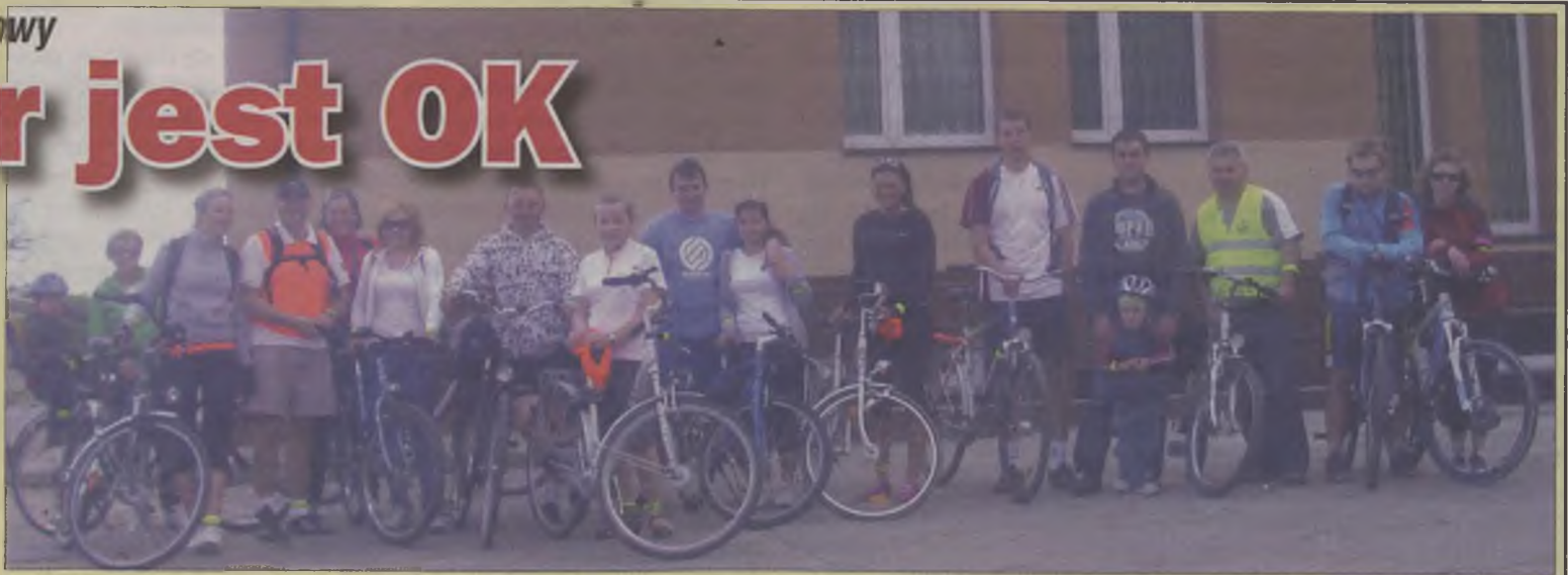
Zmęczeni, ale usatysfakcjonowani uczestnicy rajdu.

Ekipa, wyposażona w specjalne opaski odbłaskowe, przeka-