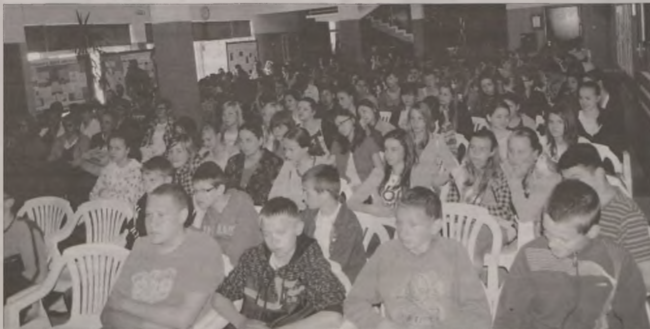
Szkolny hol zapełnił się zainteresowanymi tym, co mają do powiedzenia wybitni sportowcy z powiatu tureckiego.

Po spotkaniu przeprowadzono konkurs plastyczny poświęcony ruchowi olimpijskiemu. Uczniowie rywalizowali w wieloboju rekreacyjno-sportowym. Odbył się także mecz koszykówki. (art)