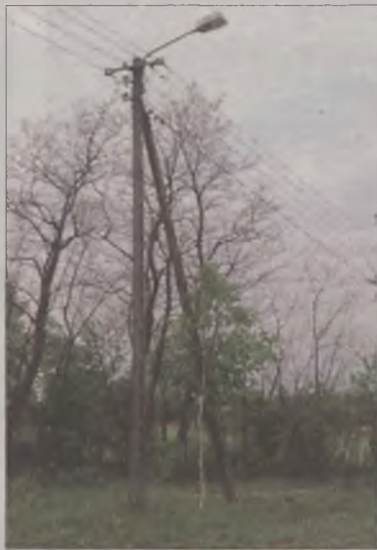
Mieszkańcy kupili i zamontowali dwie lampy za pieniądze z funduszu sołeckiego, od dwóch lat czekają żeby zaświeciły.

ną i drugą gminną. Z gminnej już od dawna nie wydobywa się żwirów, zrobiono tam natomiast tory do jazdy jeepami i quadami. –Niech sobie dzieciaki jeżdżą, niech ćwiczą,