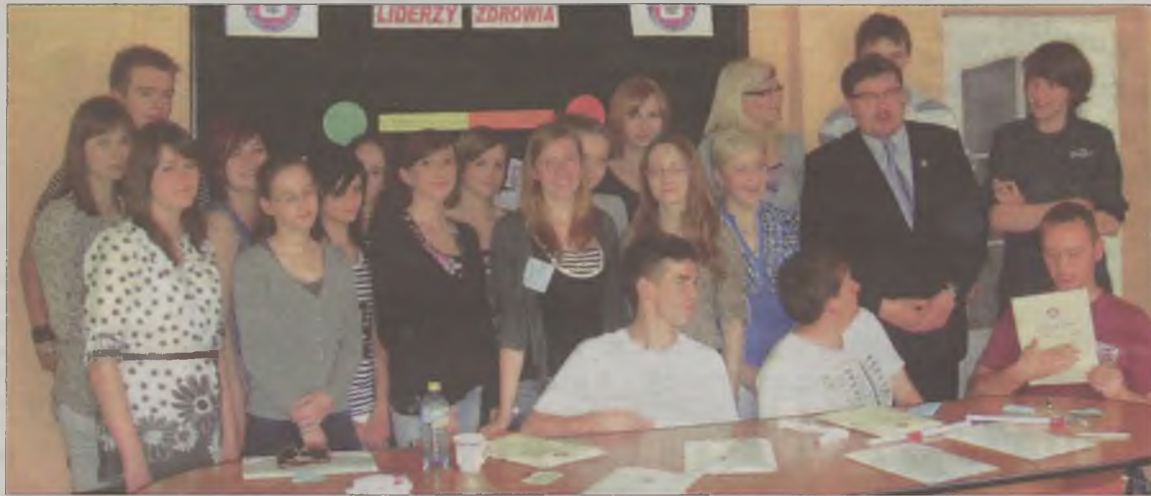
Nowa grupa liderów zdrowia.

Uczestnicy szkoleń otrzymają certyfikat Młodzieżowego Lidera Zdrowia oraz materiały edukacyjne, z nadzieją, a nawet zobowiązaniem, że to właśnie oni staną się alternatywą dla wszystkich ryzykownych zachowań swoich kolegów, przekazując rówieśnikom zdobytą wiedzę. Edukacja rówieśnicza, jest skuteczną metodą przeciwdziałania róż-