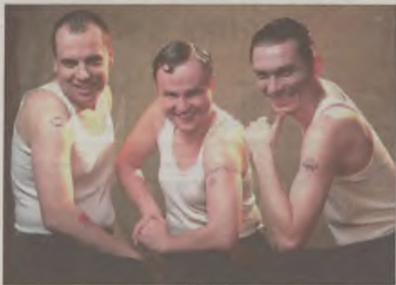
W piątek, 27 maja kabaret Czesuaf będzie bawił Turków.

Czytelników mamy cztery bezpłatne wejściówki. Wystarczy zadzwonić do redakcji pod numer 63 278-53-41 we wtorek, 17 maja o godz. 14.00. Bilety otrzymają pierwsze cztery osoby. boxa