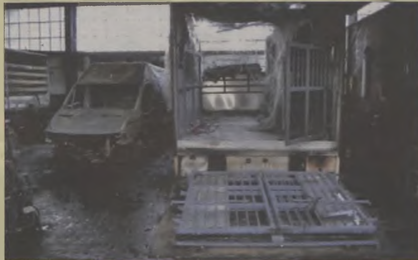
Stojące w hali samochody spłonęły.

W Uniejowie przy ulicy Kościelniczej wybuchł pożar w hali warsztatu samochodowego. Ustalono, że pożar był wynikiem zwarcia instalacji elektrycznej w samochodzie ciężarowym, który znajdował się wewnątrz hali. Spaleniu uległy dwa samochody ciężarowe. Uszkodzona została konstrukcja hali. Właściciel warsztatu wycenił starty na kwotę 800.000 zł. Mienie było ubezpieczone. (art)