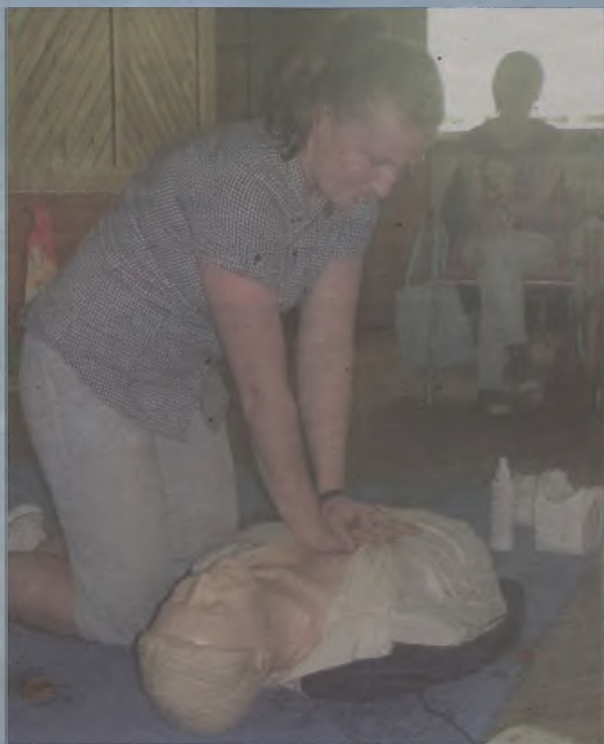
Wolontariusze sprawdzali swoją wiedzę w teorii i praktyce.

„Zawsze nam się wydaje, żeśmy coś zrobili, ale wstrzymujemy się, kiedy pomoc jest najbardziej potrzebna” – mając w pamięci te słowa turkowscy wolontariusze szkolą się na każdym kroku. Niedawno przygotowano dla nich kurs pierwszej pomocy.