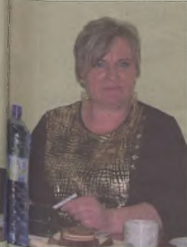
Starostka pełniąc wiodącą rolę w

kuchni Zespołu Szkół w Kowalach Pańskich Kolonii. Mężczyznom zlecały prace przy gminnej zieleni, obiektach sportowych oraz prace remontowo-budowlane.