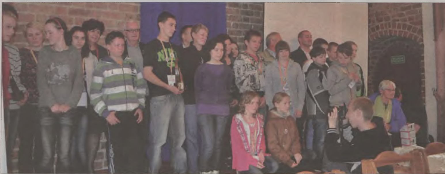
Laureaci klasyfikacji generalnej VII Ogólnopolski Zlot Młodzieży Wiejskiej PTTK „W Centrum Polski”.

Organizatorem zlotów jest Oddział PTTK „Ziemi Łęczyckiej” w Łęczycy. Imprezę współorganizowali: Komisja Środowiskowa ZG PTTK, Porozumienie Oddziałów PTTK Województwa Łódzkiego, Urząd Miasta w Łęczycy, Urząd Miasta w Uniejowie, 37. Dywizjon Lotniczy Ziemi Łęczyckiej w Leźnicy Wielkiej, Ośrodek Szkolno-Wychowawczy w Stemplewie, Lokalna Organizacja Turystyczna „Centralny Łuk Turystyczny”. Celami zlotu są: przybliżanie turystycznych walorów województwa łódzkiego, krajoznawstwa, historii i tradycji uczestnikom zlotu; promocja krajoznawstwa przez turystykę wśród dzieci i młodzieży, ze szczególnym uwzględnieniem aktywnego wypoczynku; wspieranie inicjatyw związanych z projektami turystycznymi; promocja twórczości artystycznej, ze szczególnym uwzględnieniem piosenki turystycznej; przygotowanie dzieci i młodzieży do aktywnego i kreatywnego uczestnictwa w szeroko pojętej działalności turystycznej; integracja turystyczna dzieci i młodzieży z różnych środowisk; wskazanie alternatywnych sposobów spędzania czasu wolnego. Michał Jarek