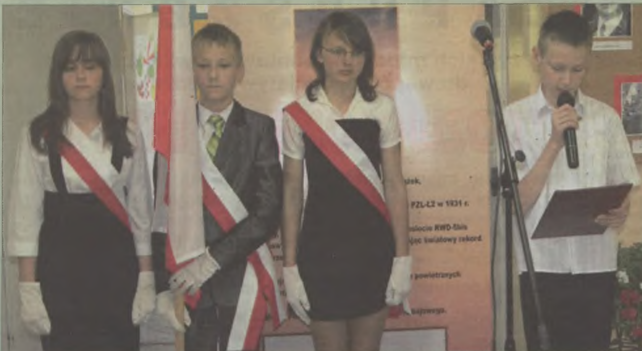
Uroczystość miała patriotyczny charakter, a uczniowie wykazali się dużą wiedzą o patronie szkoły.