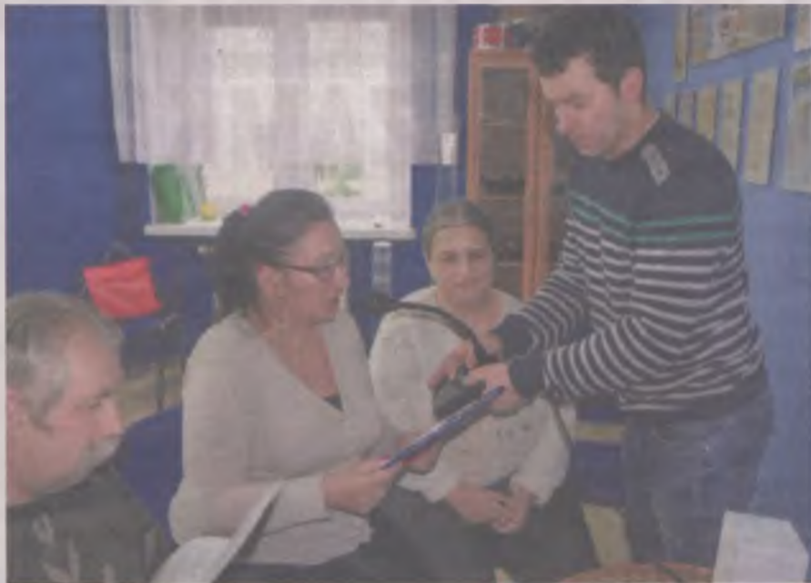
Podczas warsztatów „Radio Kanada” niepełnosprawni pozyskali bardzo ważną umiejętność, jak pozyskiwać i przekazywać rzetelne informacje.

Niewątpliwie największą atrakcją projektu były warsztaty „Jak mówić po Polsku?”, które po-