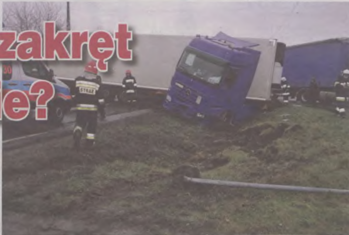
Naczepa ciężarówki, która w Przykonomie wpadła do rowu, kilka godzin blokowała ruch na drodze krajowej z Turku do Uniejowa.

dzie akumulator, zabezpieczyli wyciek paliwa, a także uszczelnili pęknięty zbiornik i zneutralizowali plamę oleju wyciekłą na jezdnię. Ich działania trwały ponad godzinę. Okazało się, że blokujący drogę mercedes nie stwarza zagrożenia,