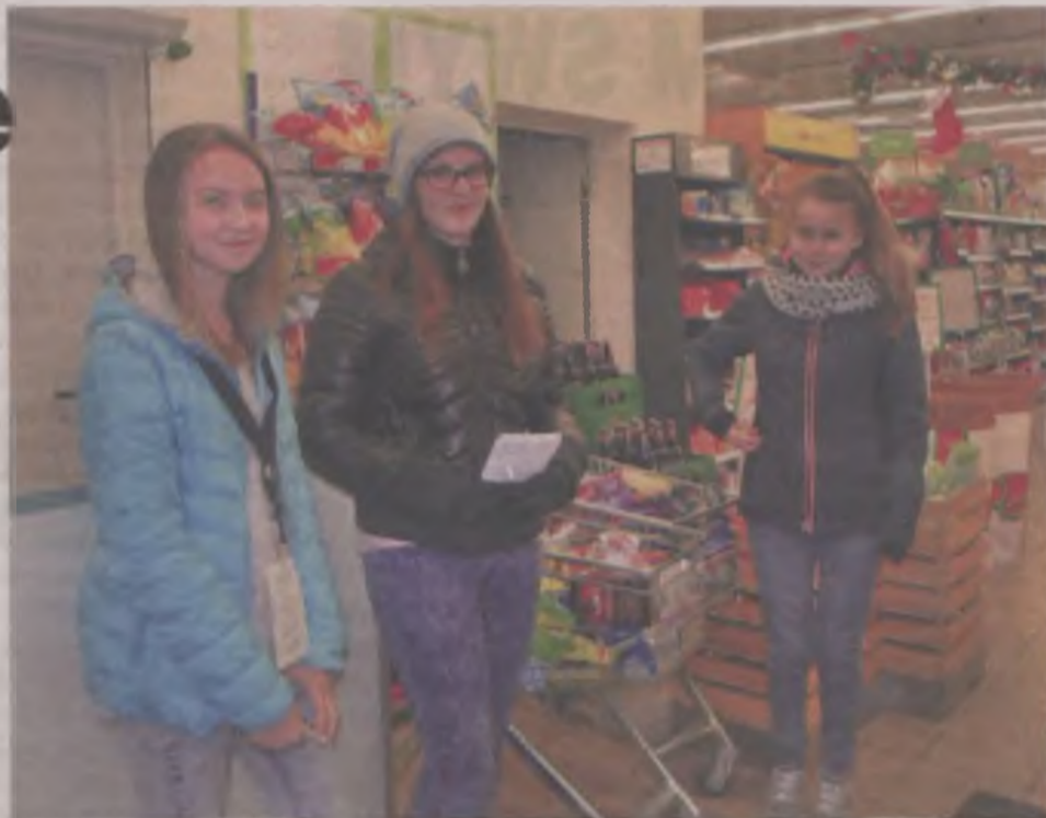
Wolontariuszki w jednym z uniejowskich sklepów.

Z zebranych produktów, a jest to żywność, słodycze, zabawki, środki czystości itp., zostaną przygotowane paczki dla dzieci z rodzin znajdujących się w trudnej sytuacji materialnej. Trafiają do dzieci z gmin, gdzie prowadzona był zbiórka. (art)