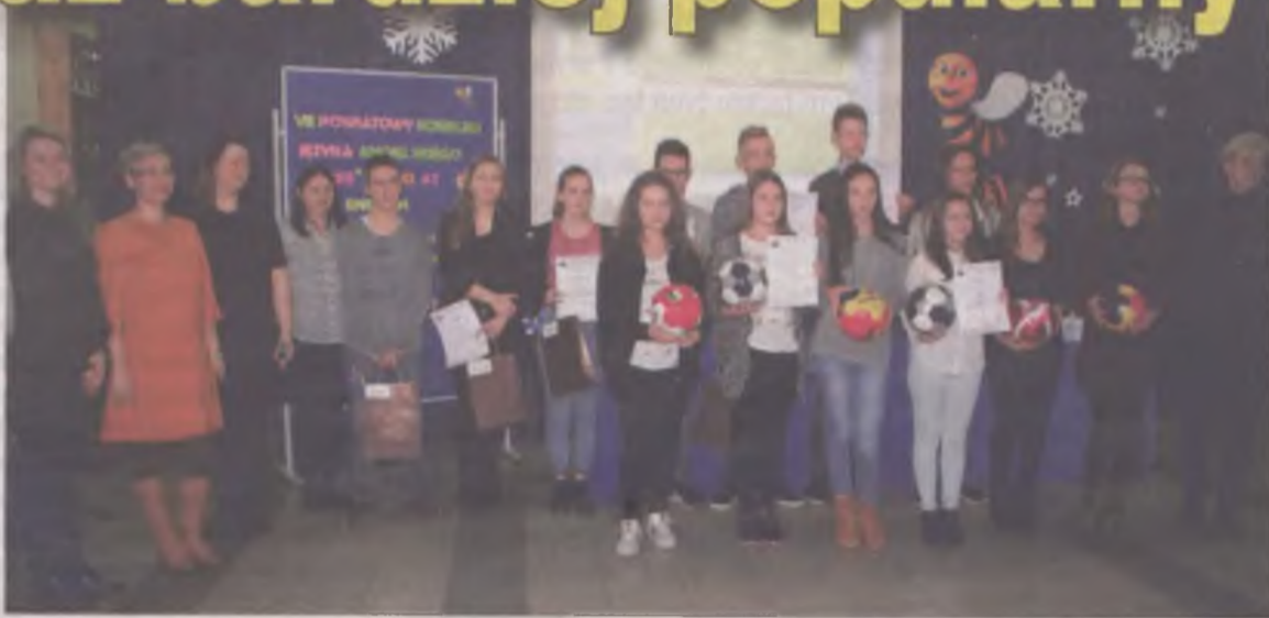
W tym roku do zmagania konkursowych z języka angielskiego przystąpiło 15 uczniów, z języka niemieckiego osiemnaścioro.