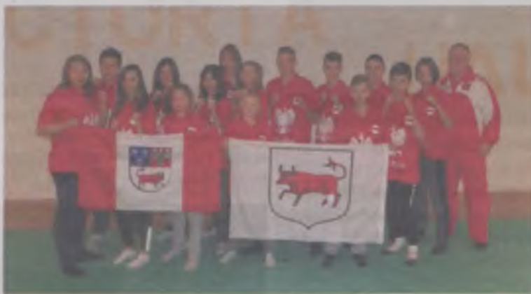
Nasza ekipa spisała się podczas Pucharu Świata w Kyokushin Karate znakomicie.

Zawody, otwarte z wielką pompą i udziałem szefów światowych organizacji oraz burmistrza greckiego Kilkis, stały na bardzo wysokim poziomie sportowym i organizacyjnym. Chociaż w nocy przed rozpoczęciem pucharu doszło w Kilkis do