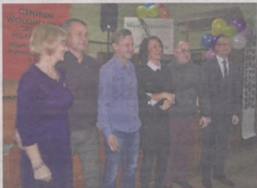
Odznaki w kształcie łapki otrzymali turkowie wspierający Centrum Wolontariatu.

przeczytać, że o Ewie Podembskiej śmiało można powiedzieć „Człowiek z pasją pomagania”.