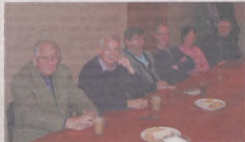
W zebraniu wzięło udział kilkunastu członków Stowarzyszenia.