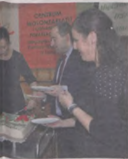
Występował burmistrz wraz z radnymi.