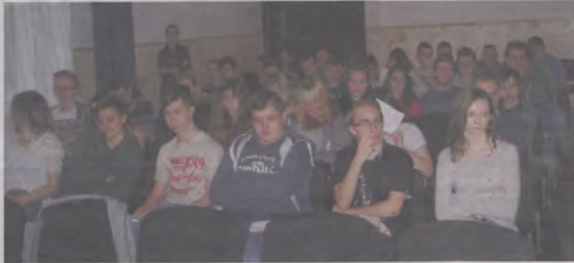
W debacie wzięli udział uczniowie Zespołu Szkół Rolniczych w Kaczkach Średnich.

nych środków narkotycznych była ogromna. Komendant powiedział, że był to jeden z pięciu punktów działających na terenie Wielkopolski. Powiedział też, że zdaje sobie sprawę z tego, iż będzie to długotrwała wojna z dopalaczami. Apelowal do młodzieży: -Nie wchodźcie w dopalacze. Niech nikt nie wierzy, że jest to tylko chwilowa rozrywka. To jest nieprawdopodobne uzależnienie.