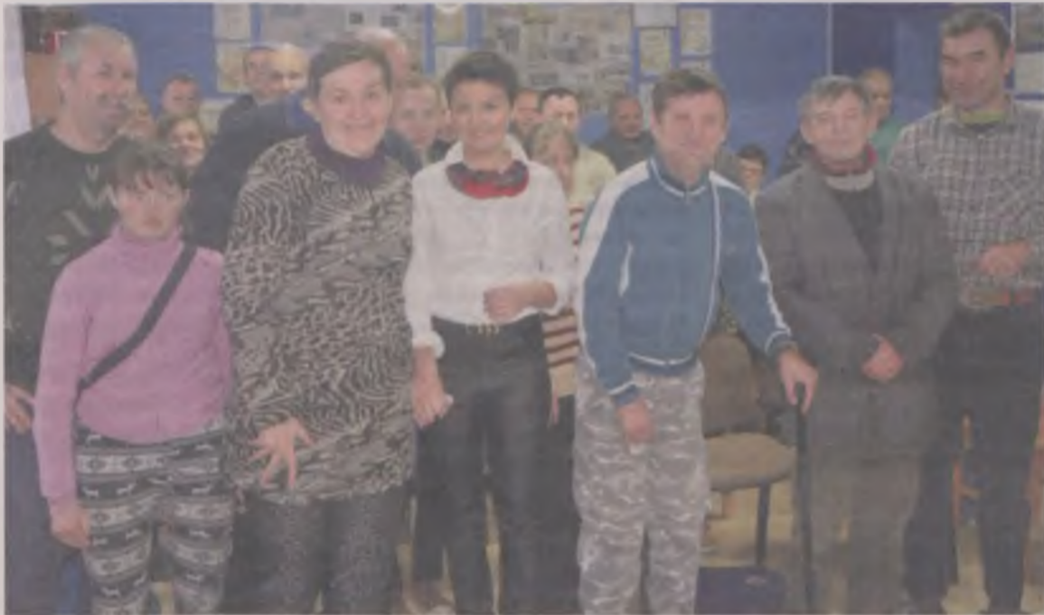
Podczas projektu radiowego podopieczni czepowskiego ośrodka uczestniczyli w zajęciach pod hasłem „Jak mówić po Polsku?”.