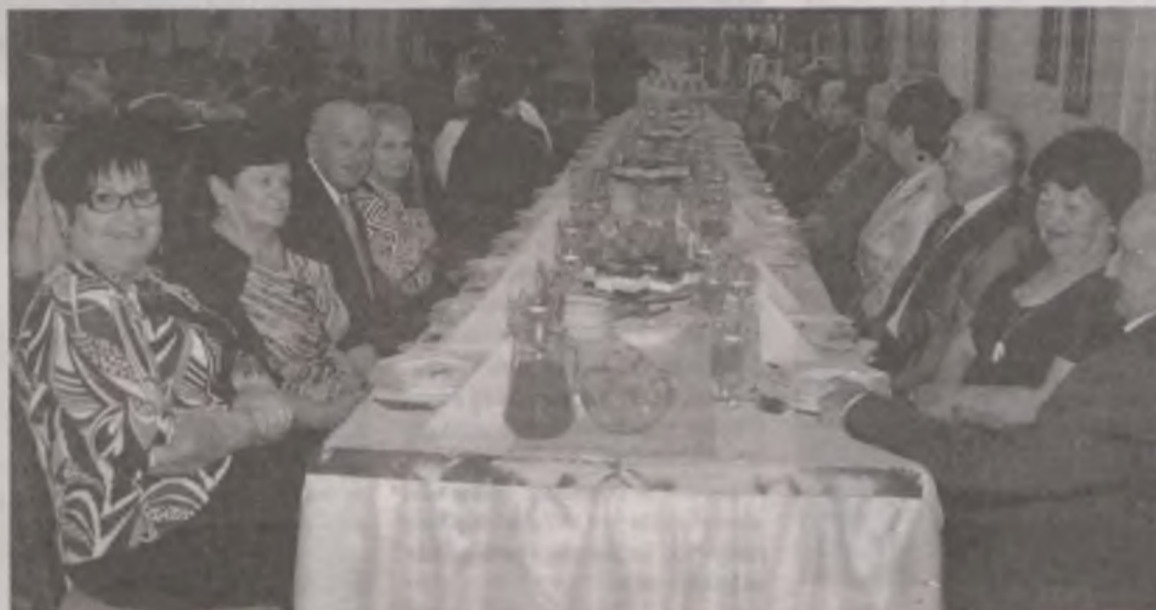
Uczestników seniorskiego święta zaproszono na obiad.