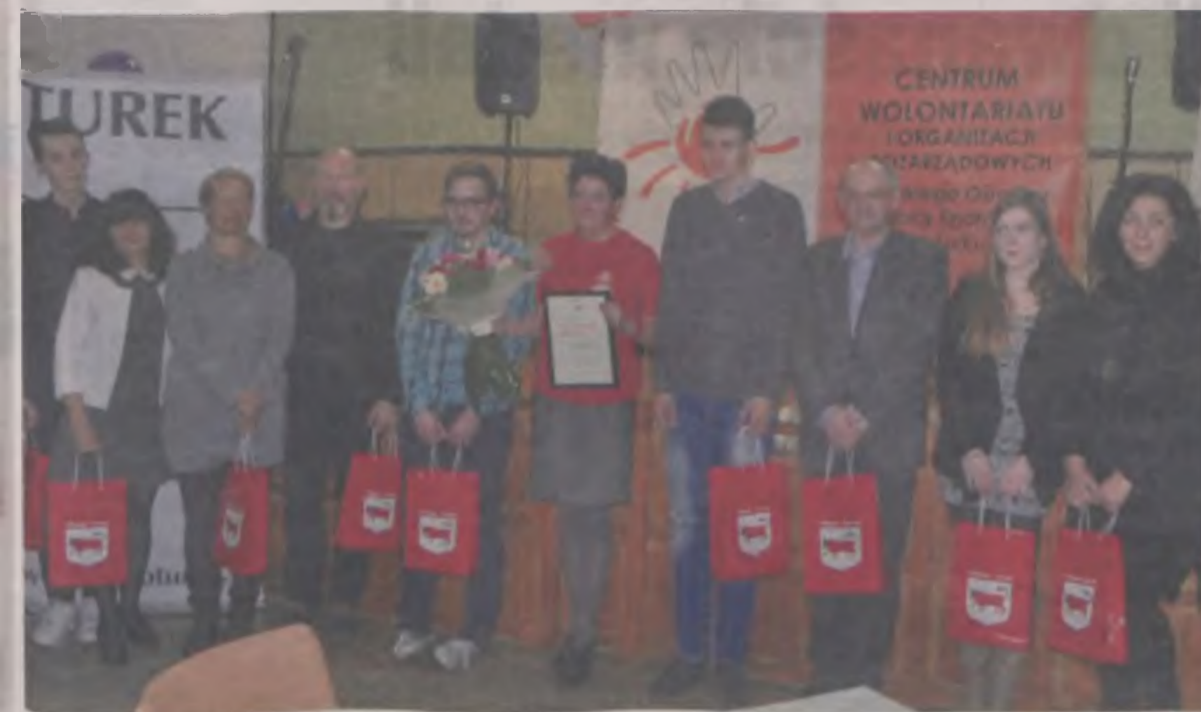
Wyróżniono też laureatów konkursu Wolontariusz Roku z poprzednich lat.