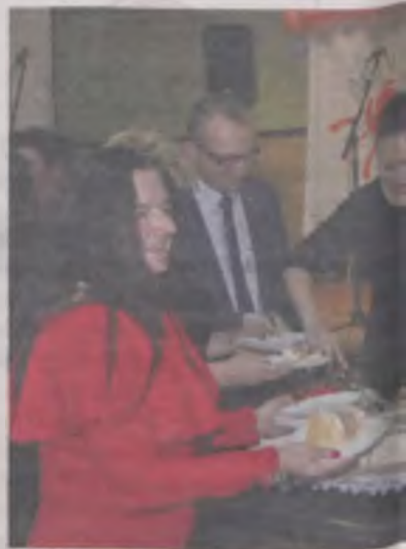
W tym roku jubileuszowym tortem

–Pokazaliście w filmie wszystko czym dla was jest wolontariat. Chciałbym być nigdy się nie zmie-