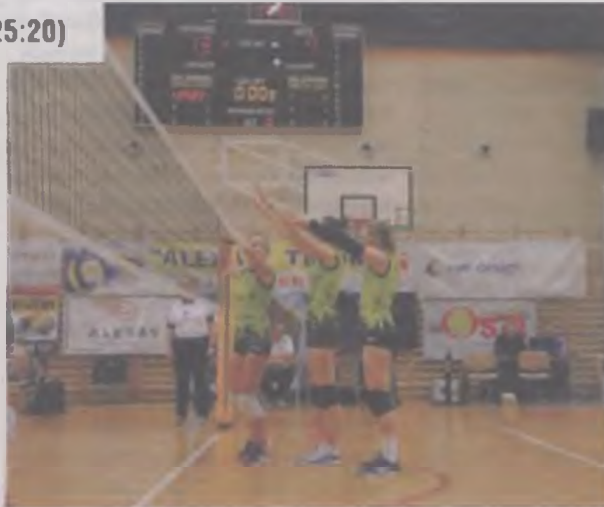
Siatkarki Alexas Turek odniosły trzecie zwycięstwo na cztery mecze rozegrane na swoim boisku. 10 grudnia zagrają w Poznaniu, gdzie zmierzą się z zawodniczkami KS Energetyk Poznań.