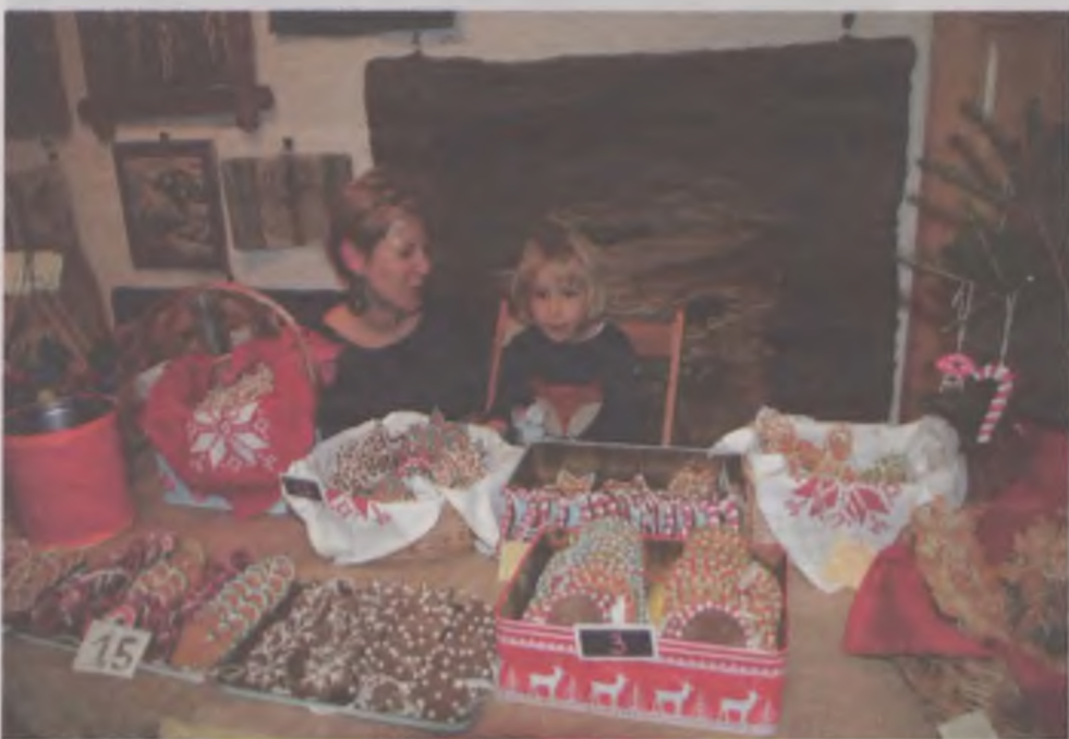
Dużą popularnością cieszyły się pierniczki – do zjedzenia i na choinkę.

Ostatni przed świętami weekend w Turku będzie w ogóle wyjątkowy. Rozpocznie się niewinnie w piątek, 16 grudnia, warsztatami bożonarodzeniowymi w Miejskim Domu Kultury. (godz. 11.00 – 14.00 oraz 16.00 – 19.00). Następnego dnia w sobotę od godz. 10.00 ruszy w Przystani Fahryka Świętego Mikołaja, gdzie dzieci wraz z rodzicami będą przygotowywać prezenty. I ogólnie świetnie się