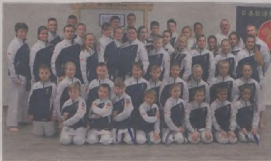
Uniejowско-Poddębicka ekipa na zawodach we Francji.