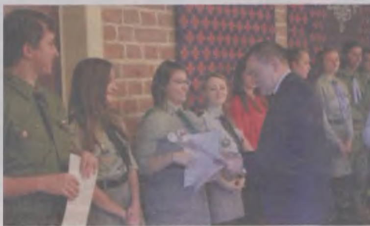
Za działalność na rzecz społeczności lokalnej i promocji gminy nagrodzeni zostali między innymi harcerze.