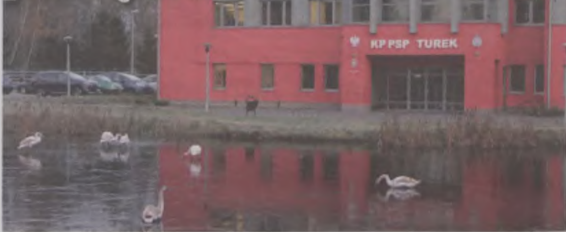
Łabędzia rodzina na stawie przed turkowską strażnicą.

Strażacy z turkowskiej PSP nie tylko gaszą pożary, albo jeżdżą do wypadków, ale też ratują zwierzęta. W poniedziałek, 28 listopada, około godz. 14.00, wezwani zostali do hali sportowej przy ulicy Parkowej w Turku. Jak się okazało tego dnia, najprawdopodobniej by odpocząć, łabędź wylądował na dachu budynku. Niestety nie miał możliwości ponownie wzbicie się w powietrze, bo powierzchnia była zbyt mała, a do tego bardzo śliska. Strażacy przy użyciu podnośnika weszli na dach hali. Ptak był bardzo wystraszony, dlatego nie od razu dał się złapać. Po kilkunastominutowej akcji, zmęczony łabędź dał za wygraną i pozwolił podejść do siebie strażakom. Mundurowi zwieźli młodego osobnika na ziemię, a następnie wypuścili do stawu w parku przy Dobrskiej.