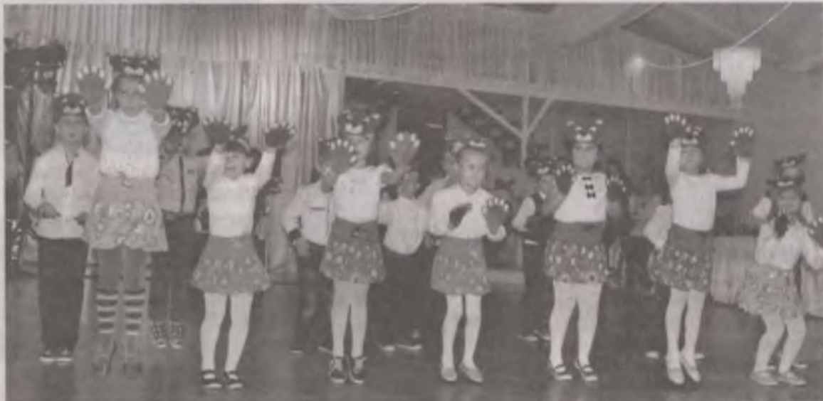
Przedstawiciele przedszkola śpiewali i tańczyli dla seniorów.