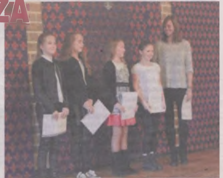
Wśród wyróżnionych przez samorząd stypendystów znalazły się także medalistki Pucharu Europy we Francji z Klubu Karate BASSAI.