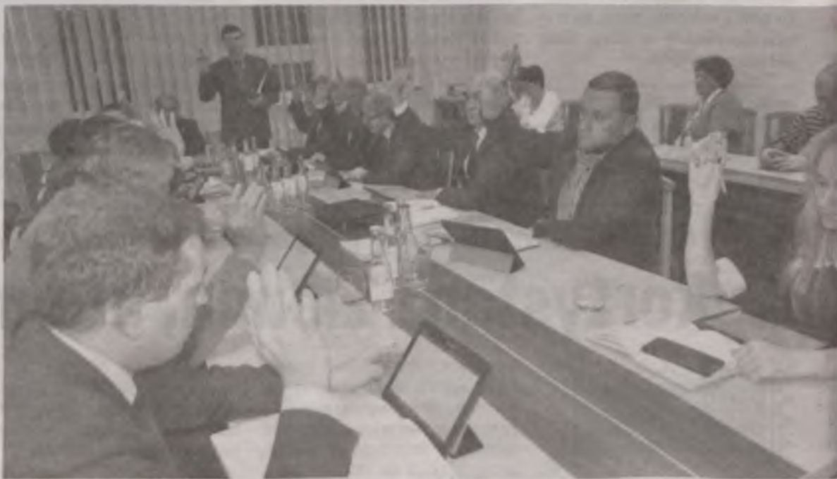
Radni jednogłośnie postanowili pozostawić w przyszłym roku podatki lokalne na tym samym poziomie co obecnie.

Tym samym podatek rolny, tak jak w tym roku, rolnicy będą płacić od ceny żyta wynoszącej 42 zł za kwintal (obniżony z kwoty ustalonej przez prezesa GUS na 52,44 zł). Podatek od nierucho-