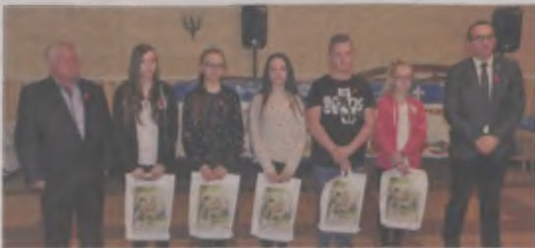
Laureaci konkursu plastyczno-literackiego.