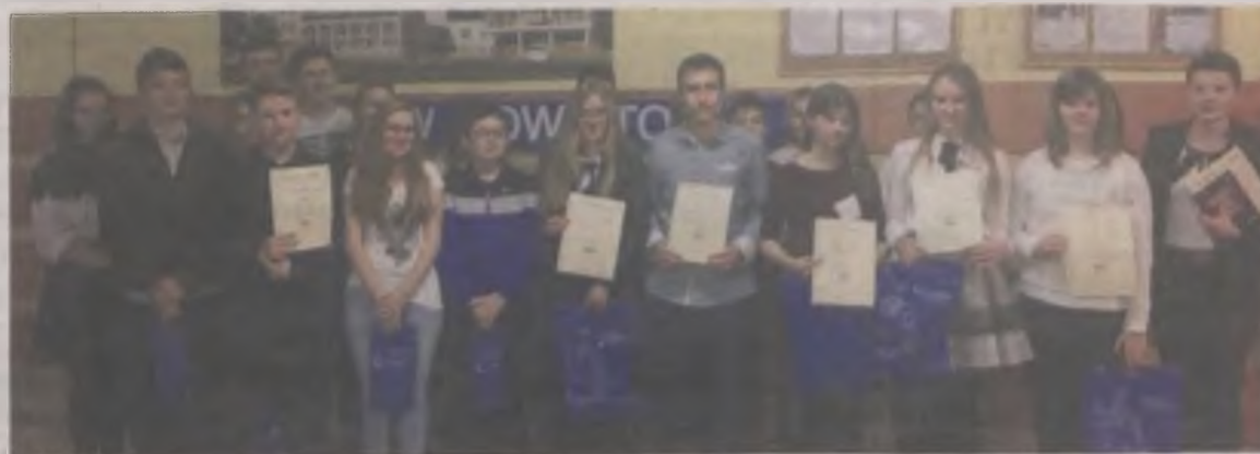
Uczestnicy konkursu literowania, jaki po raz czwarty odbył się w Gimnazjum w Tuliszkowie.