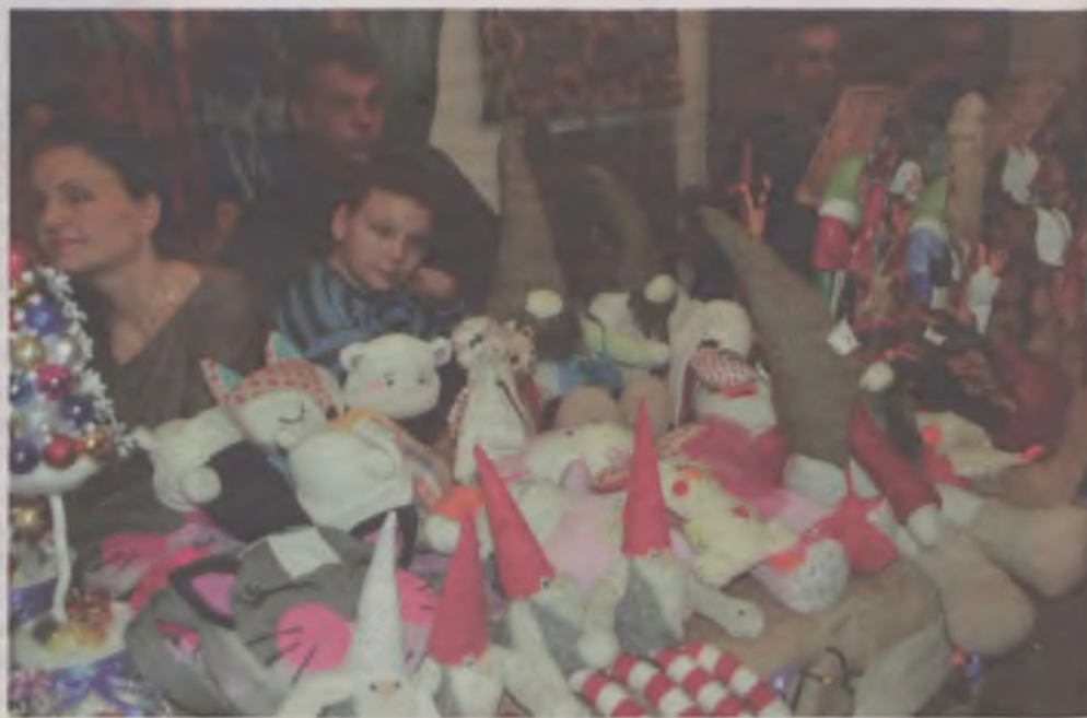
Krasnale z wielkimi czapami, gałkankowe lalki, misie, zające – wszystko ręcznie wykonane z przyjemnych materiałów. W sama raz na prezent dla naszych milusińskich.