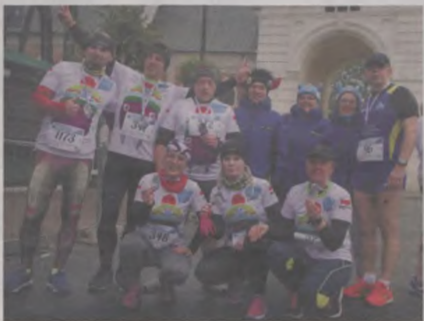
W niedzielnym biegu wzięli też udział między innymi turkowianie – indywidualni biegacze, przedstawiciele klubów, a także morsy.

W niedzielę, 16 października, odbyła się jubileuszowa, dziesiąta odsłona „Ogólnopolskiego Ekologicznego Biegu do Gorących Źródeł Sanus per Aquam - Zdrowie przez Wodę”, wchodząca w skład Cyklu 9 Biegów o Puchar Marszałka Województwa Łódzkiego.