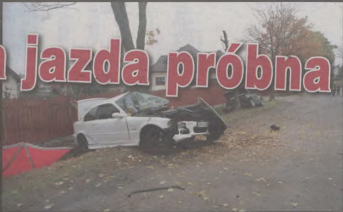
Sprawcą wypadku był kierowca BMW. Mężczyzna zginął na miejscu. Kilka godzin później w szpitalu zmarła pasażerka volkswagena.

W volkswagenie passacie podróżowała para obywateli Bułgarii. Pasażerka przewieziona została do szpitala w Kaliszu. Obrażenia jakich doznała były bardzo poważne. Kobieta miała