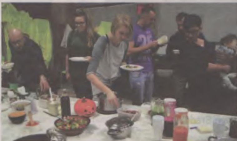
Przystani, 23 października 2016 r.

Kto nie był, niech żałuje! A jeszcze bardziej niech żałują ci, co zamiast spotkania z życiem, zdecydowali się tego wieczora na związek ze „gadającym szklanym pudłem”, skąd sączy się jedynie nierzeczywistość. ika