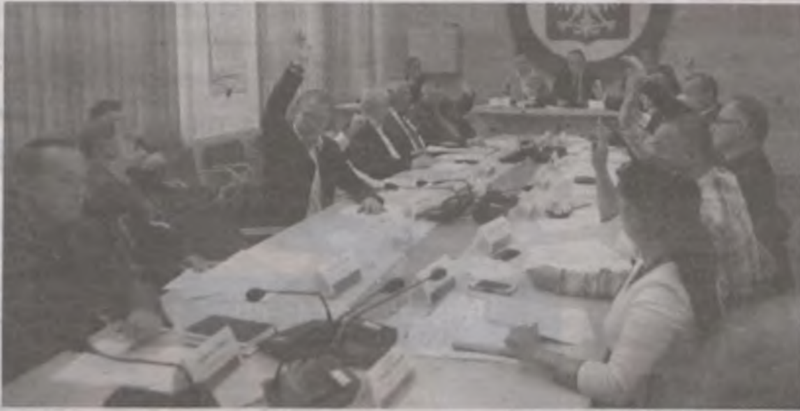
Miejscy radni chyba wyraźniej widzą wspólnotę losów miejskiej i wiejskiej gminy niż ich koledzy na Ogrodowej.

ślił, że stosowny wniosek w tej sprawie trafił 31 maja do Urzędu Marszałkowskiego w Poznaniu. Ale dopiero w czwartek, 13 października, przyszła odpowiedź, z której wynikało, że Sejmik Wielkopolski może zająć się zatwierdzeniem zmian granic aglomeracji na sesji zwołanej na koniec października. Ale żeby się tak stało, to kwestia musi trafić pod obrady sejmikowych komisji zwołanych już na środę, 19 października. Co oznaczało, że radni gminni (a przy okazji i miejscy), musieli podjąć stosowne uchwały już we wtorek, 18 października.