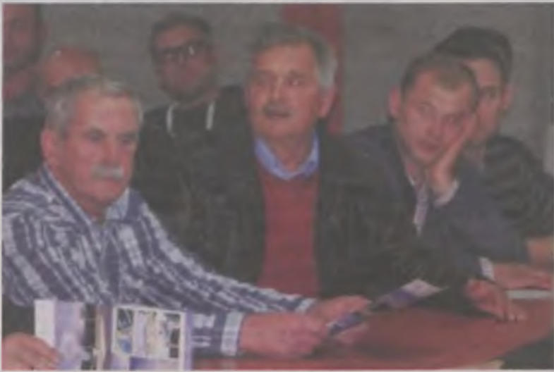
Jedynie pan Jarosław (w środku) bronił bioelektrowni, która jego zdaniem jest dla niego dobrodziejstwem.

Dyskusja nabierała rumieńców. Jeden z zabierających głos mężczyzn zapytał: -Gdzie ten ferguson z dużą beką wywoził jej zawartość? Natychmiast też odpowiedział na zadane pytanie: -Jak pan chce, to zahiorę