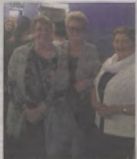
Władysławowskie seniorzy podczas spektaklu w Poznaniu.