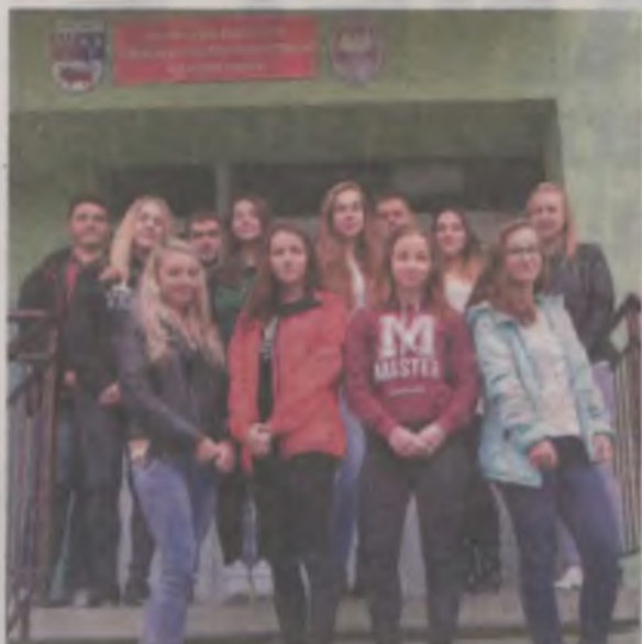
Uczniowie z ZSR CKP w Kaczkach Średnich zaangażowani w nowy lingwistyczny projekt.