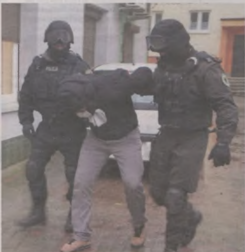
Turkowanie do sprawy posiedzą w areszcie. Za rozboje w recydywie grozi im 12 lat więzienia.

Sceny jak z gangsterskiego filmu rozegrały się w ubiegłym tygodniu przy Placu Sienkiewicza w Turku, gdzie antyterrorysty w kominiarkach i z bronią w rękach gonili przestępcę. Zatrzymany mężczyzna, to jeden z trzech bandytów, którzy bez skrępowania wchodzili do domów z nożem w ręku, grożąc pozbawieniem życia. Zabierali pieniądze i cenne przedmioty.