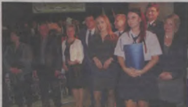
Podziękowano rodzicom niepełnoletnich muzyków orkiestry.

Na sali można było obejrzeć wystawę zdjęć i dokumentów obrazujących historię orkiestry jubilatki, przygotowaną przez Stowarzyszenia Przyjaciół Ziemi Dobroskiej z własnych i powierzonych materiałów. Dopelnieniem uroczystości była biesiada z muzyką w lokalu naprzeciwko dobrskiego Centrum Kultury.