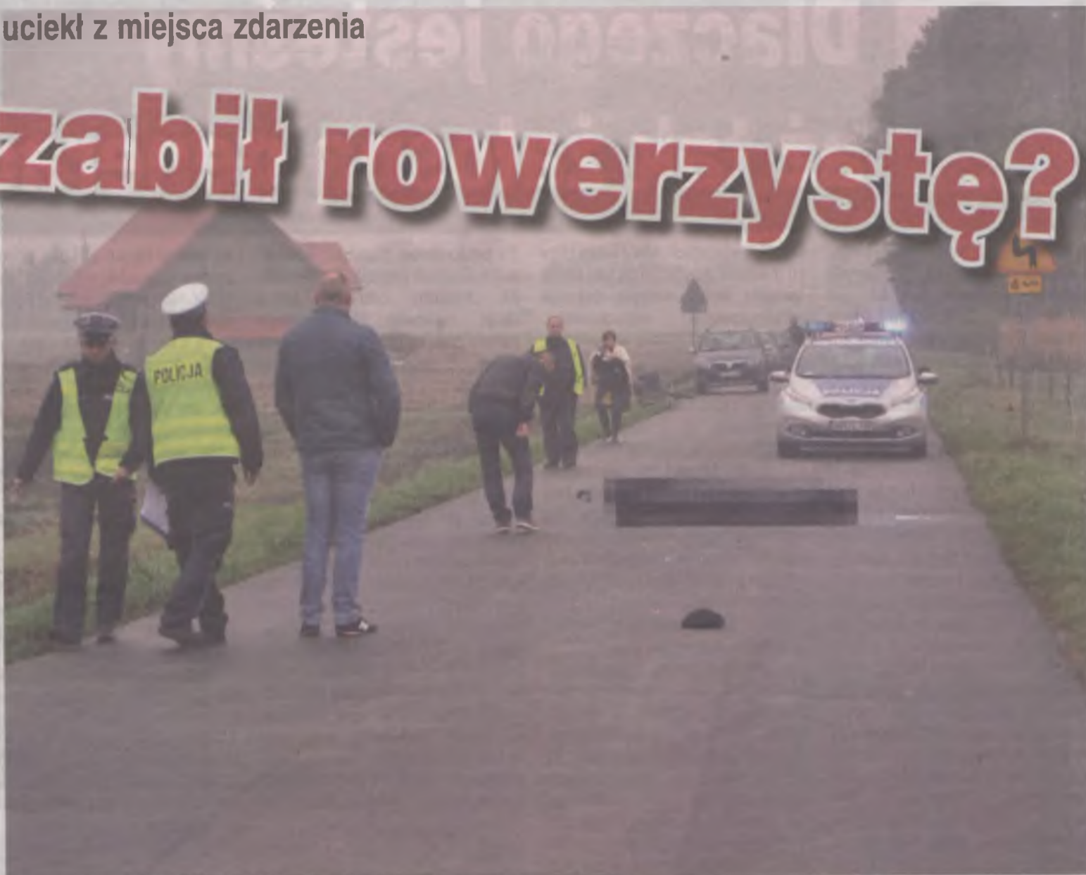
W Brudzewie zginął 62-letni mieszkaniec Tarnowej. Mężczyznę potrącił samochód, którego kierowca uciekł z miejsca wypadku.

jeszcze i to, że na miejscu wypadku policjanci znaleźli części zderzaka samochodu, który prawdopodobnie śmiertelnie potrącił mieszkańca Tarnowej. To element srebrnego opla astry II. Zaraz po ustaleniu tego faktu, rozpoczęły się poszukiwania samochodu i jego właściciela.