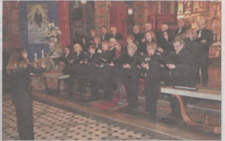
Podczas niedzielnego przeglądu nie mogło zabraknąć Chóru Nauczycielskiego Turkowskiego Towarzystwa Chóralnego.

Jako ostatni wystąpił Chór Nauczycielski Turkowskiego Towarzystwa Chóralnego. Zespół powstał w 1985 roku, był laureatem przeglądu