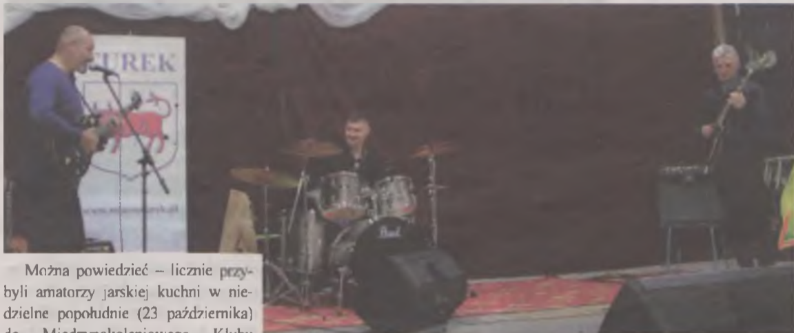
Pysznie i muzycznie było w niedzielne popołudnie w Przystani!