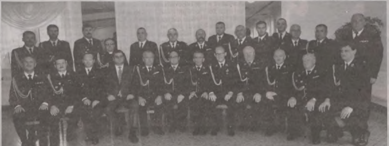
Zarząd Oddziału Powiatowego Związku ZOSP RP w Turku.