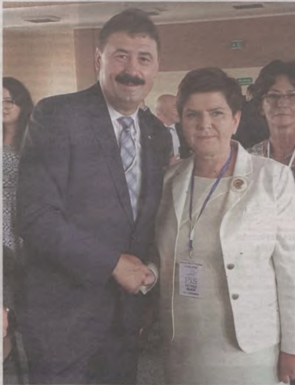
Najbardziej spektakularne wydarzenie kampanii wyborczej to nieplanowana wizyta obecnej Premier Beaty Szydło, która w odpowiedzi na moje zaproszenie, pojawiła się w piątkowy przedwyborczy rano na turkowskim zieleniaku. Na zdjęciu z Prezes Rady Ministrów na posiedzeniu Komitetu Politycznego PiS.