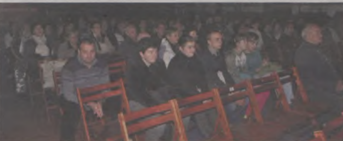
Występu małżeństwa wysłuchała spora grupa turkowlan.