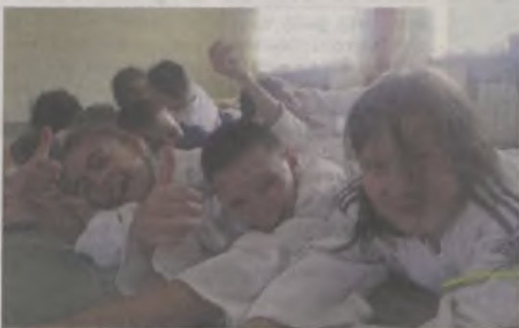
Fizyczne zajęcia nie muszą być, jak widać, wcale nudne.