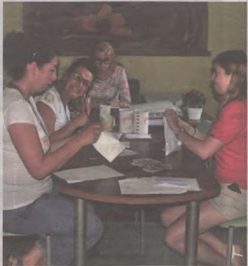
Organizatorzy na bieżąco liczyli pieniądze.