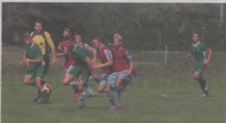
W meczu z Osiekiem Wielkim Tur 1921 wygrał 4-0.