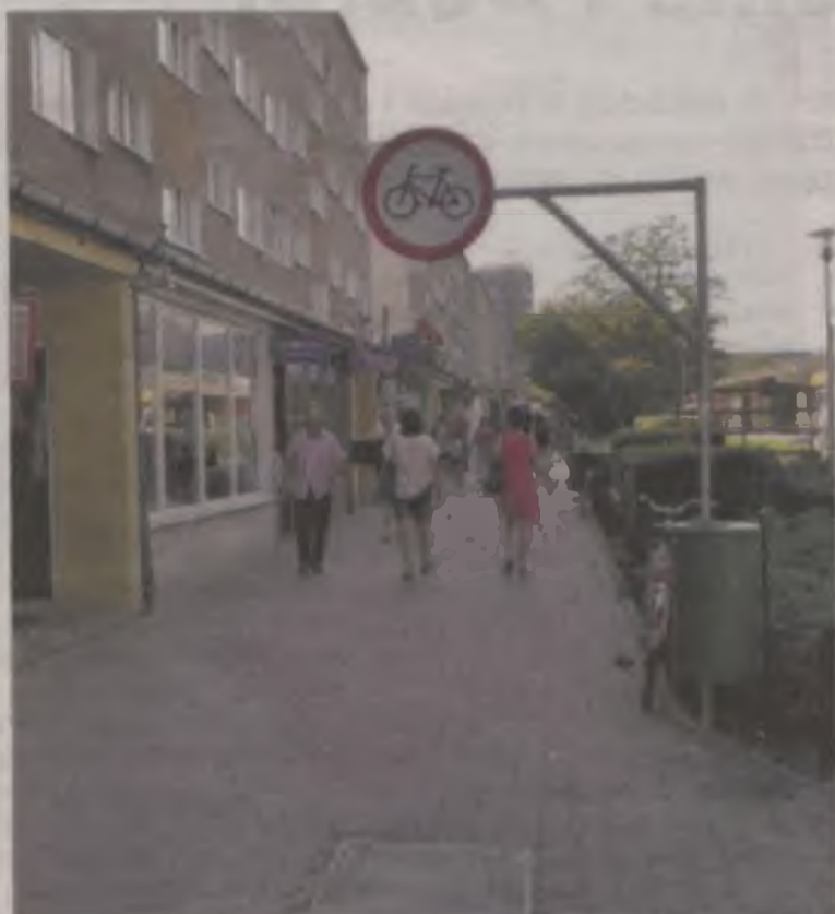
Podczas spotkania turkowień mieli wiele pomysłów na ulepszenie planu przebudowy ulic 650-lecia i Dąbrowskiego. Jeszcze przez tydzień można zgłaszać w Urzędzie Miejskim propozycje zmian.