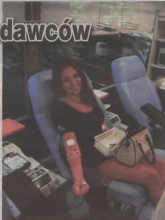
Na krew od pięknej dziewczyny chętnych nie zabraknie.