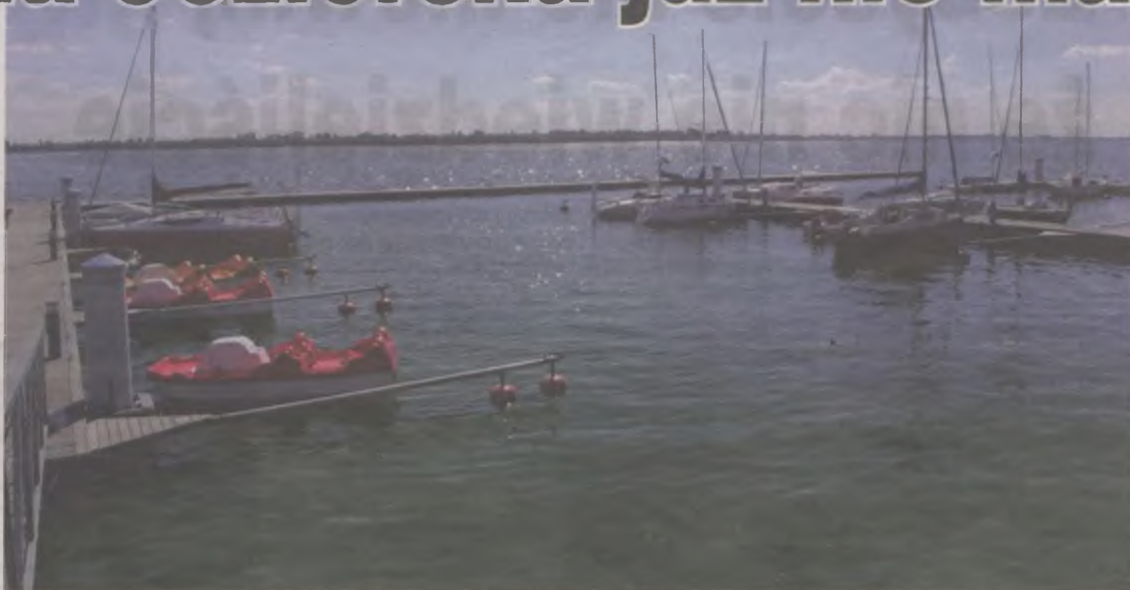
Takie warunki stworzyła turystom gmina Warta.

Bełchatowska kopalnia zapowiedziała budowę dużego sztucznego jeziora na pokopalnianych terenach. Stanowił on będzie konkurencję dla zbiornika Jeziorsko, który bazuje głównie na letnikach z aglomeracji łódzkiej. Przez kilkadziesiąt lat gminy zrobiły niewiele dla rozwoju turystyki nad zbiornikiem. Teraz zabrzmiał ostatni dzwonek, aby przyciągnąć wczasowiczów stwarzając im jak najlepsze warunki wypoczynku. Pęczniew to bardzo uboga gmina, której nawet przy dofinansowaniu inwestycji trudno zgromadzić wkład własny. Dobra pomimo wielu zapisów w programie rozwoju gminy nie zamierza tam inwestować w infrastrukturę turystyczną. Jedynie gmina Warta, budując port w Ostrowie Warczim pokazała, że można wiele.