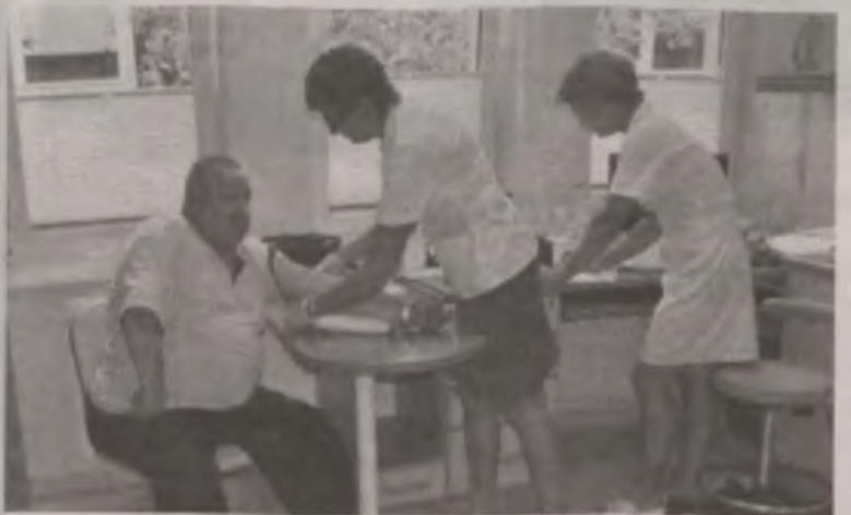
Z bezpłatnych badań w Przychodni Lekarza Rodzinnego „Medicus” skorzystało 87 osób.