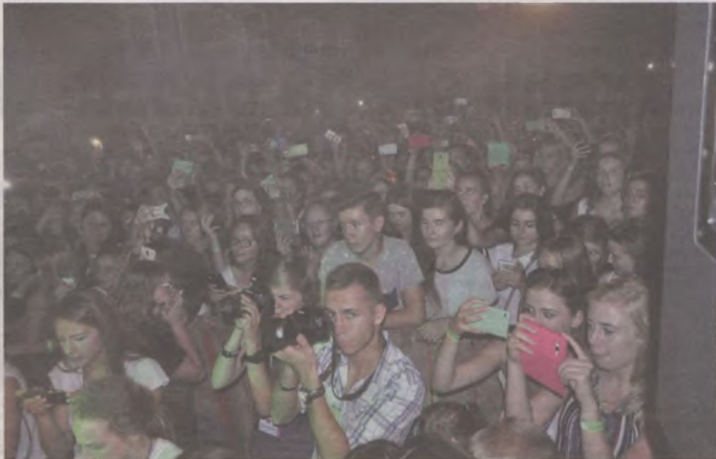
W koncercie uczestniczyło ponad 500 osób. To zasługa gwiazd młodego pokolenia, które przyciągnęły tłumy fanów po to, by wsparli charytatywną akcję.

a także zarejestrowana w Urzędzie Celnym w Kaliszu. By wylosować nagrodę wystarczyło kupić los za pięć złotych. Akcję finansowo wsparło też wielu sponsorów. Zbiórka zamknęła się kwotą 15642 złotych.