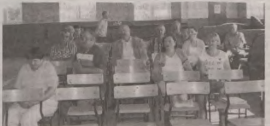
Nawet z doradcami WODR widownia wyglądała nader skromnie.