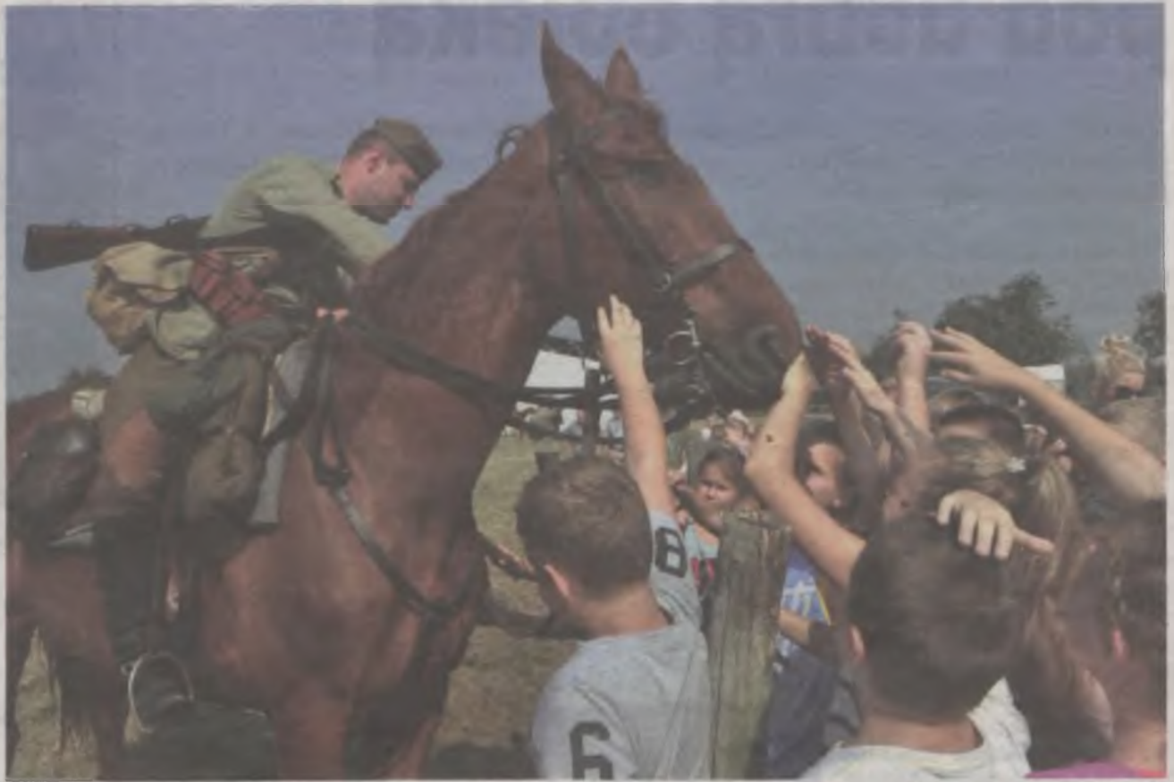
Po pokazach umiejętności jeździeckich, dzieciaki głaskały konie, poznając przy okazji jak fachowo nazywa się ich umaszczenie.

Z Poznania wyruszają 3 września, czyli w dniu kiedy pułkownik otrzymał rozkaz wymarszu na zachód, a do Ziewanic docierają w południe 12 września, by przed jego pomnikiem złożyć kwiaty i zapalić znicze.