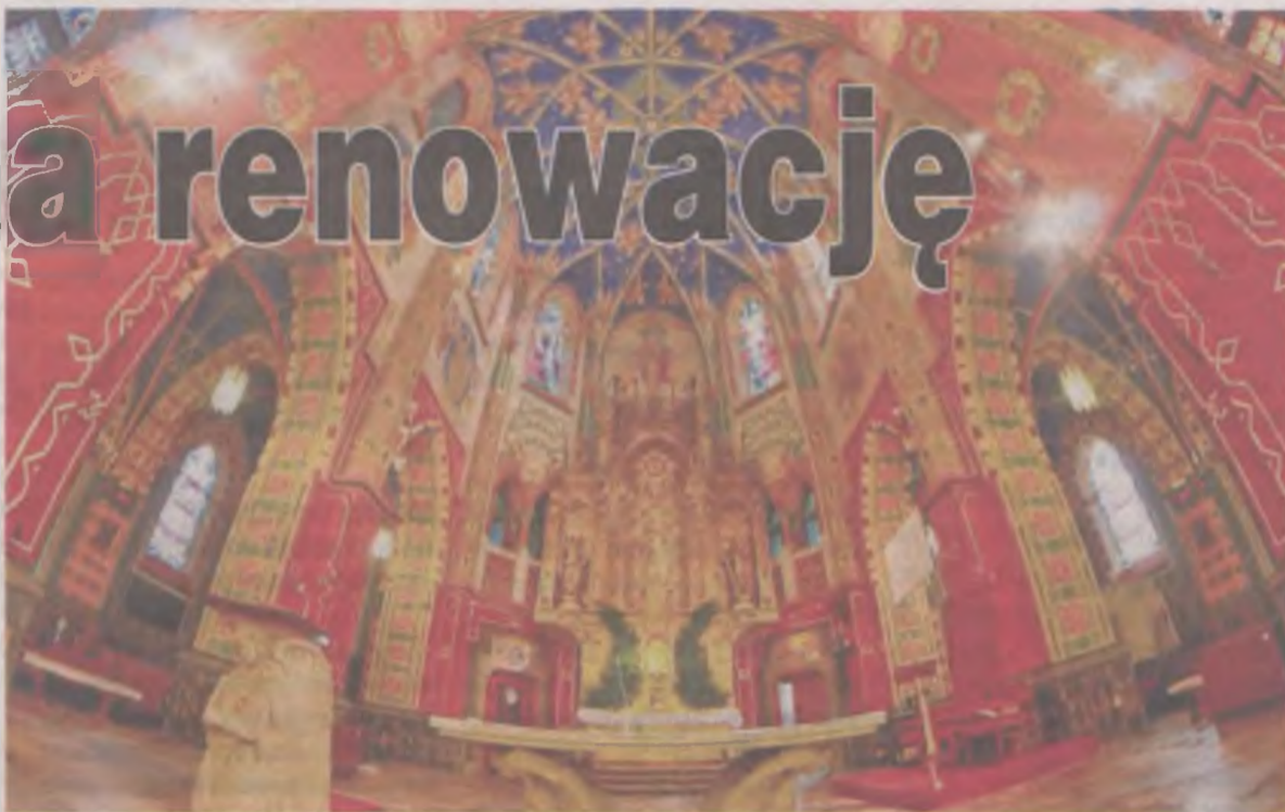
Wnętrze kościoła NSPJ w Turku skrywa całościową, i jak twierdzą specjaliści najbardziej dojrzałą, realizację artysty.