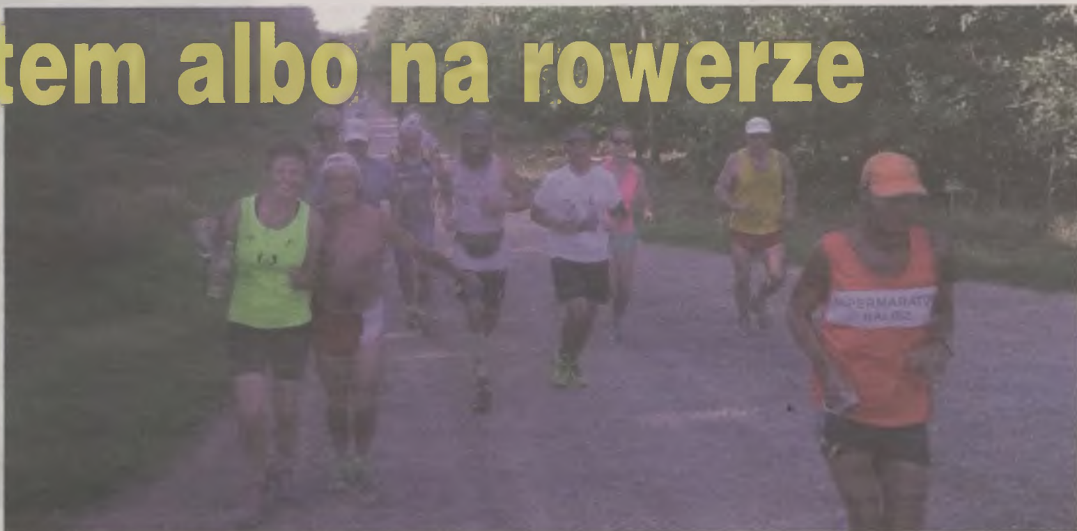
Bieg podzielono na dwa dystansy, półmaraton i maraton.