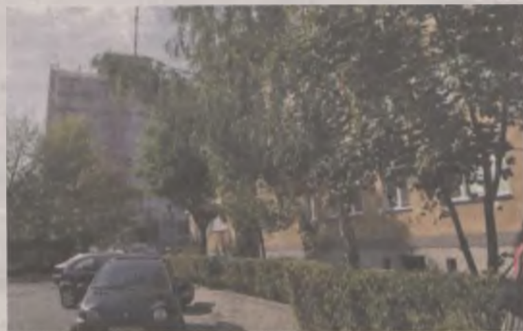
Przy 650-lecia 10, wycięte zostaną wszystkie drzewa.