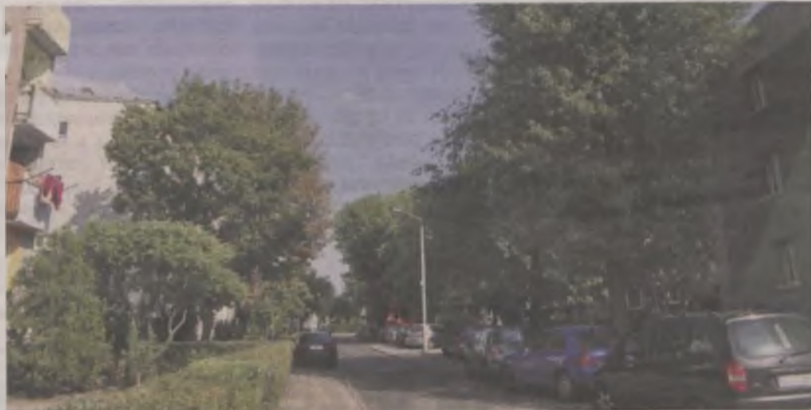
Jak widać, kierowcy cenią sobie bardzo cień, jaki dają drzewa. Jedyne auto po lewej stronie, także zaparkowano pod drzewem. Większości tych drzew nie będzie. Decyzja należy oczywiście do mieszkańców, byleby ją podjęli świadomie.

Druga część przebudowy drogi planowana jest między policją, a Legionów Polskich 5 – wjazd i parkingi przy przychodni. Jeżeli wspólnota