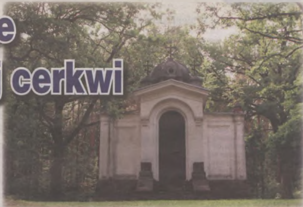
Odrestaurowanie kaplicy grobowej rodziny Tollów będzie kosztować prawie 200 tys. zł, remonty dofinansuje także samorząd województwa łódzkiego.

Tym razem rewitalizacji dokona Pracownia Robót Sztukatorskich i Konserwacji Zabytków „Arkady” z Łodzi. Celem prac jest poprawienie stanu technicznego, zabezpieczenie przed postępującym zniszczeniem i przed utratą wartości zabytkowych.