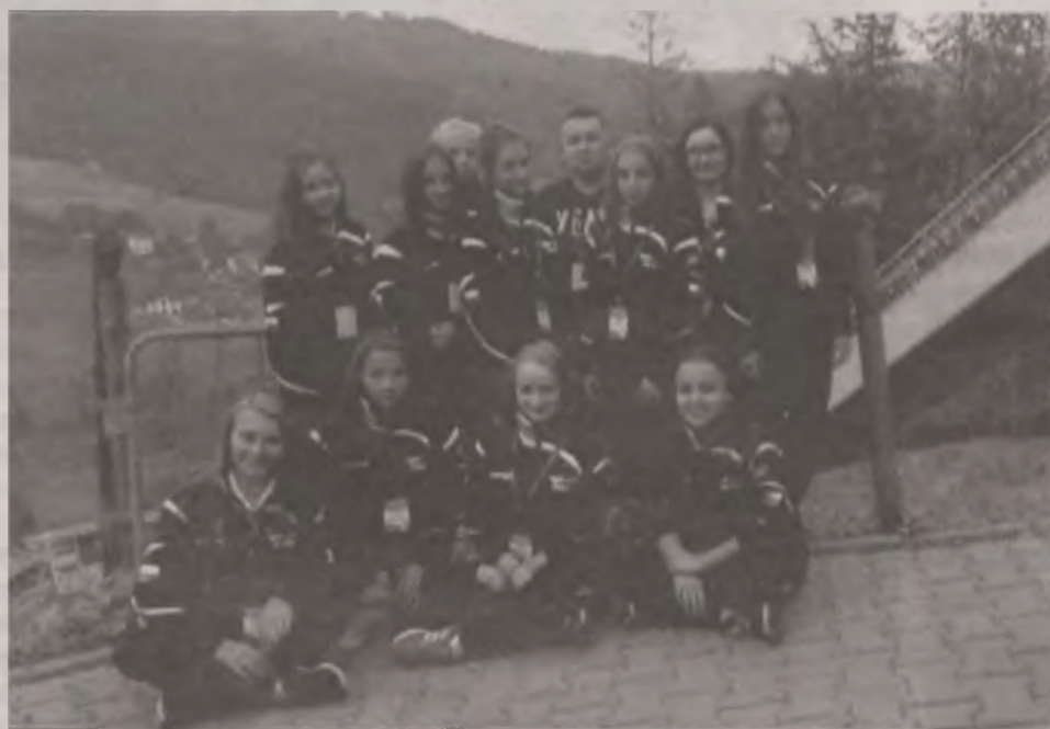
Młodzieżowa Drużyna Pożarnicza z OSP Żdźzar, a w tle skocznia im. Adama Małysza w Wiśle Malince.

W sobotę po śniadaniu odbyła się ceremonia otwarcia zawodów, a godzinę później rywalizacja, w której olimpijczycy z gminy Kawęczyn byli bezkonkurencyjni. W rozwinięciu bojowym dziewczęta z OSP Żdźzar uzyskały 957 punktów, wygrywając z drugą w klasyfikacji drużyną z Raclawówką na Podkarpaciu ponad trzema punktami. Równie doskonale spisały się w sztafecie uzyskując 99,99 pkt. Druga MDP Korzybie z województwa pomorskiego, była gorsza o ponad