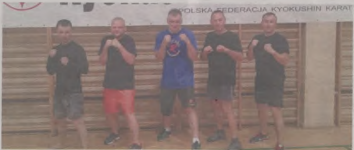
Podczas obozu szkoleniowego w Tucholi odbyły się także egzaminy na stopnie szkoleniowe.

W Tucholi odbył się również egzamin na stopnie szkoleniowe kyu oraz na stopnie mistrzowskie dan. Przystąpiło do niego 16 osób, w tym