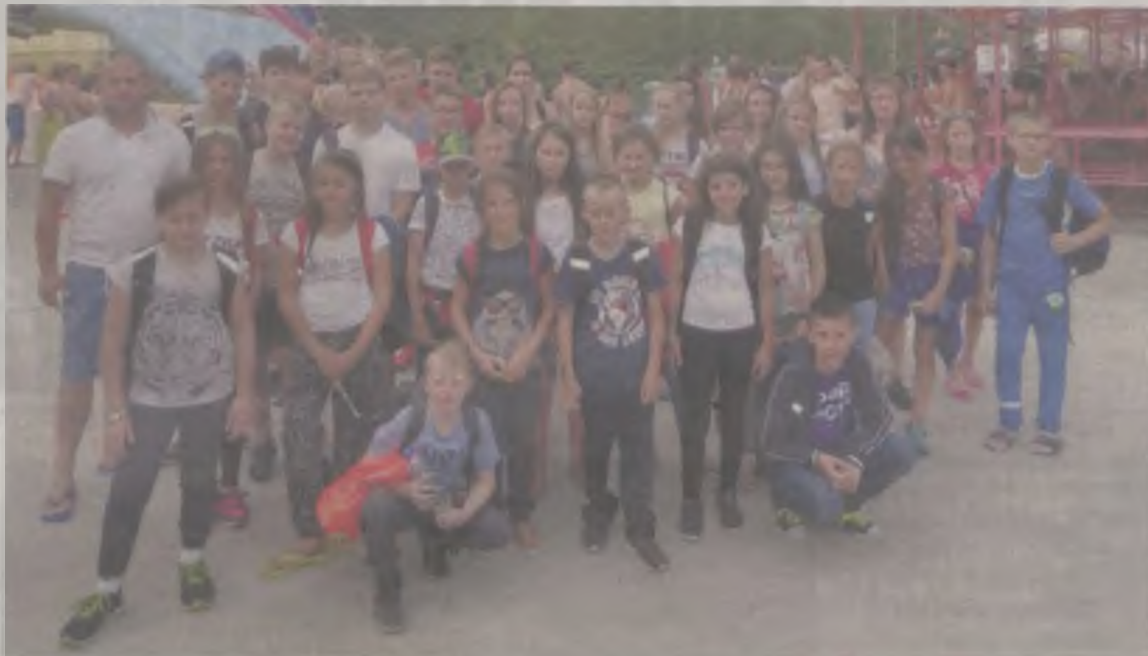
Najbardziej wyczekiwany punkt programu leniwego obozu w Murzasichle była oczywiście wycieczka do Tatralandi na Słowacji.