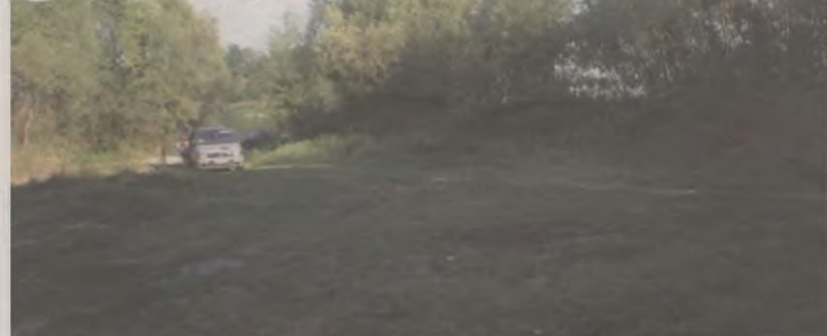
Takie warunki oferuje gmina Dobra.

nad Jeziorskim słabła. Optymista się zestarzała, a pęczniewski OSiR zlikwidowano. Plaża w Skęczniewie zarosła krzewami.