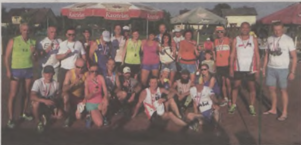
Po rozdaniu medali, uczestnicy biegu zaproszeni zostali na festyn rodzinny.