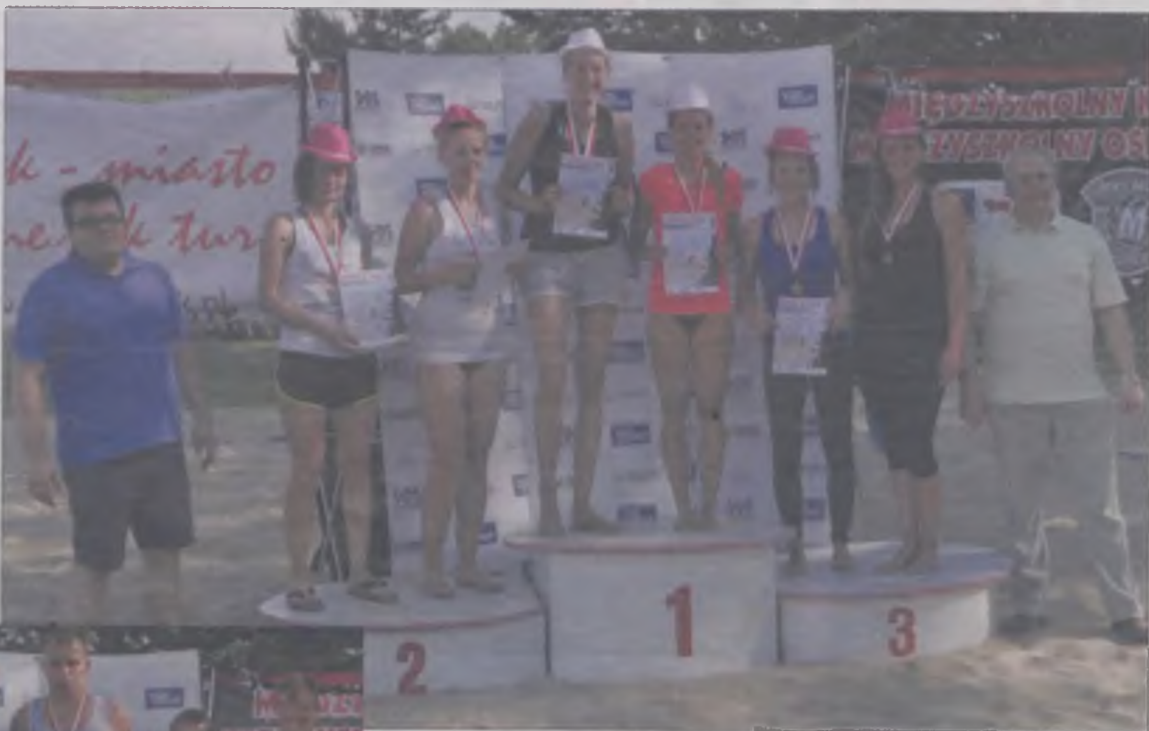
Zwycięskie dwójki kobiet.

Podobnie w kategorii męskiej, 12 duetów rywalizowało systemem brazylijskim. Należy od-