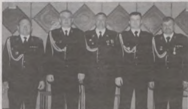
Komisja Rewizyjna w nowym składzie.

Nowy Zarząd przedstawił zarys planu kadencyjnego, który każdego roku będzie uzupełniany. Jednym z najistotniejszych zadań jakie postawiono przed sobą jest zakup ciężkiego samochodu gaśniczego dla Ochotniczej Straży Pożarnej w Brudzewie, jednostki będącej w Krajowym Systemie Ratowniczo-Gaśniczym. (art)