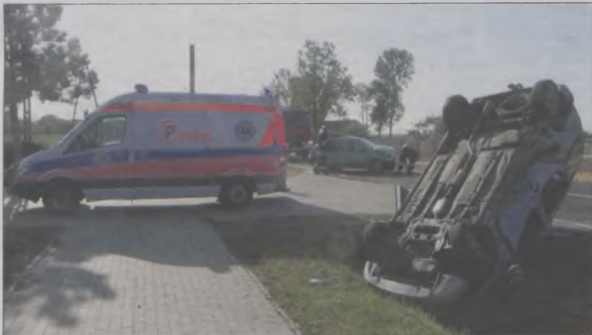
Po zderzeniu dwóch peugeotów w Smulsku, do szpitala trafiła kierująca mniejszym z aut.