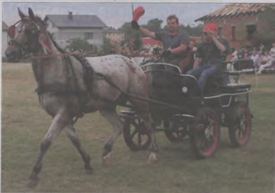
Widzom podobała się pięknie umaszczona klacz o nazwie Doda.