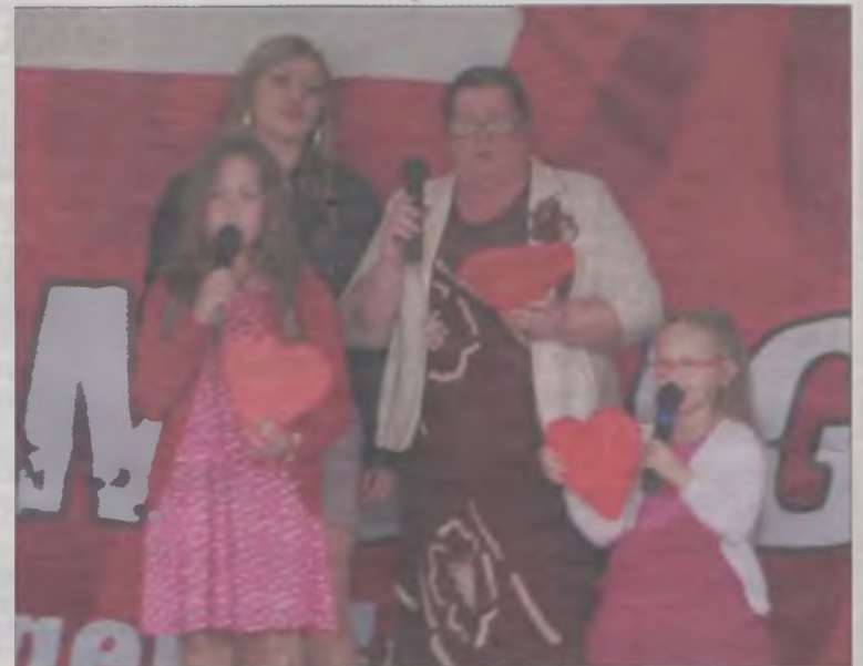
Trzypokoleniowy zespół Józefowa w gminie Dobra.