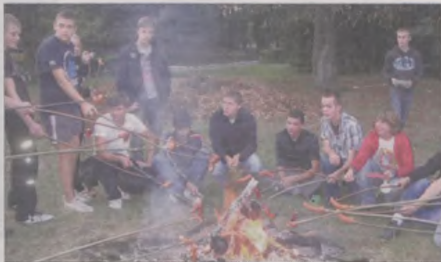
W internacie życie nie wiąże się jedynie z nauką i sprzątaniami.

A teraz coś przyjemniejszego - czas wolny. Czas wolny w internacie rozpoczyna się od chwili kiedy wracamy z zajęć lekcyjnych oraz po nauce. To okres dnia, który pozostaje do naszej wyłącznej dyspozycji - a więc nie jest wypełniony nauką własną, czynnościami organizacyjno-porządkowymi, posiłkami. W tym czasie mamy również możliwość wyjścia na dłuższy spacer. Jednak zanim wybierzemy się w dalszą