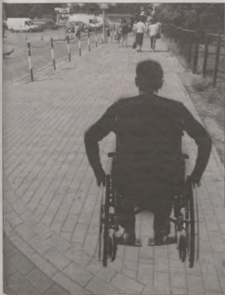
Chodniki w mieście pozostawiają wiele do życzenia. Ten, przy sądzie, nie ma jednego właściciela więc wygląda jak układanka z wielu kawałków, a dla niepełnosprawnych jest torem przeszkód.

Dodatkowe informacje można uzyskać w biurze Spółdzielni osobiście lub telefonicznie pod nr telefonu 63 278 55 30. Spółdzielnia zastrzega sobie prawo zaniechania przetargu bez podania przyczyny.