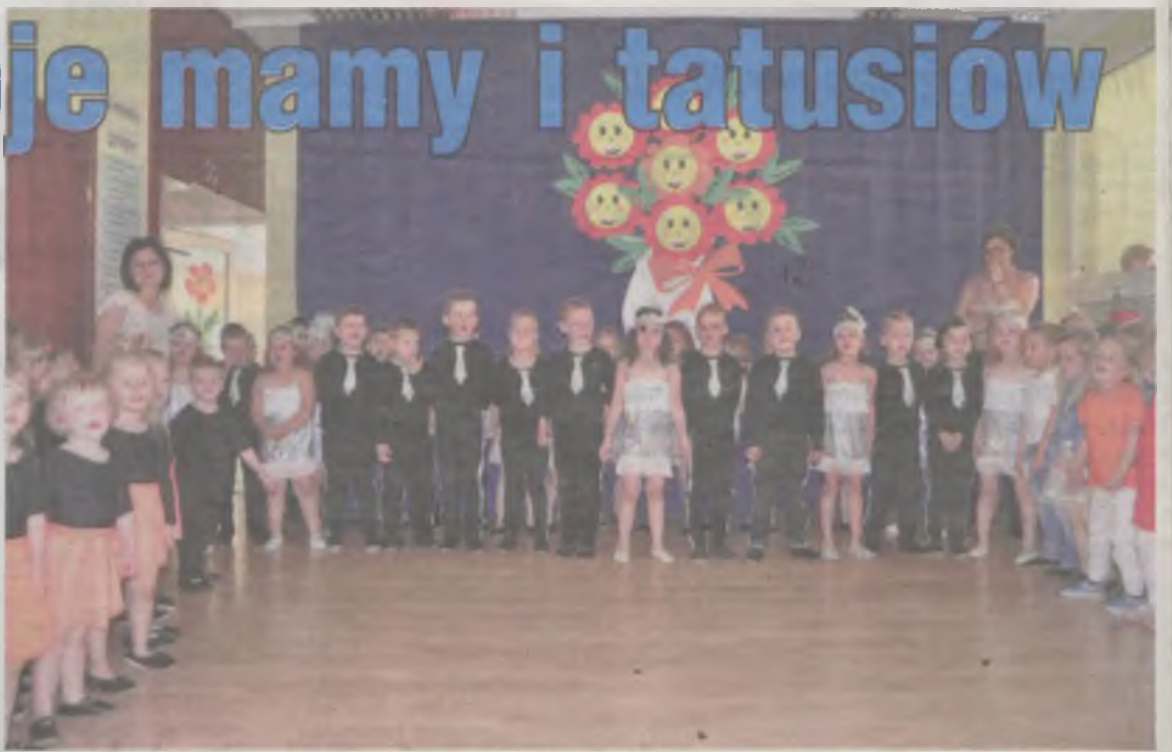
Dzieci wystąpiły dla swoich rodziców.