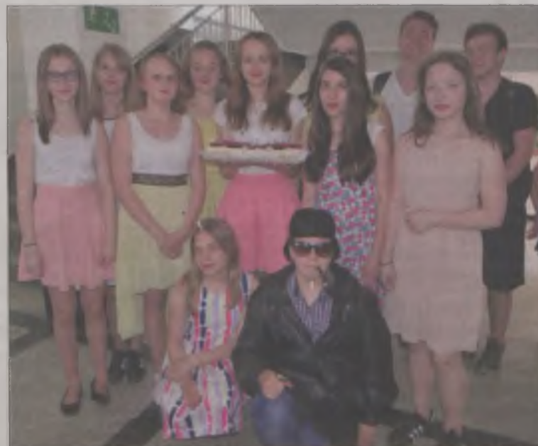
Uczniowie Gimnazjum nr 2 doskonale odnaleźli się w Londynie.