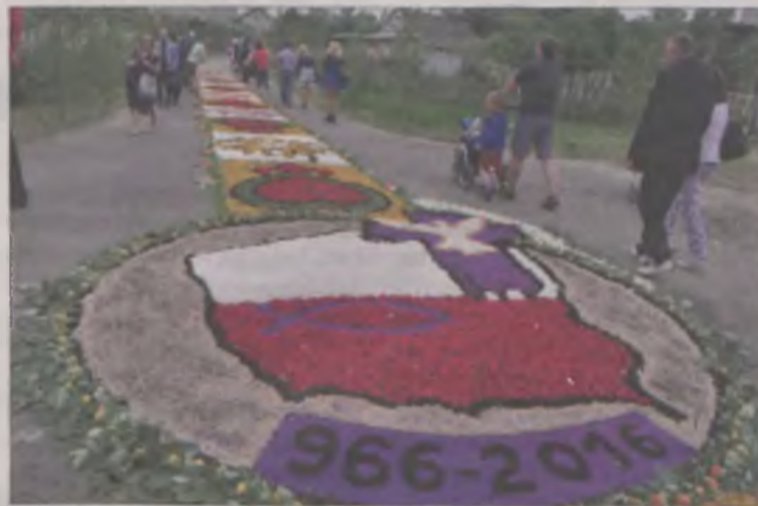
Niektóre motywy wymagały bardzo szczegółowej pracy i budziły zachwyt wśród przechodniów.

ludzi, z wielu stron kraju, dzieci i osoby zaawansowane wiekiem, z wiarą lub tylko ciekawością. Z ust setek oglądających małe dzieła sztuki usypane przez miejscowych, słychać było podziw, ale też niedowierzanie, że po kilku godzinach cały kwietny dywan zniknie pod nogami procesji. Po to jednak powstaje. Po mszy świętej o godz. 17.00 ruszyła wielotysięczna procesja eucharystyczna z pocztami sztandarowymi i asystą honorową. Wziął w niej udział, podobnie jak w ubiegłym roku biskup Wiesław Mering.