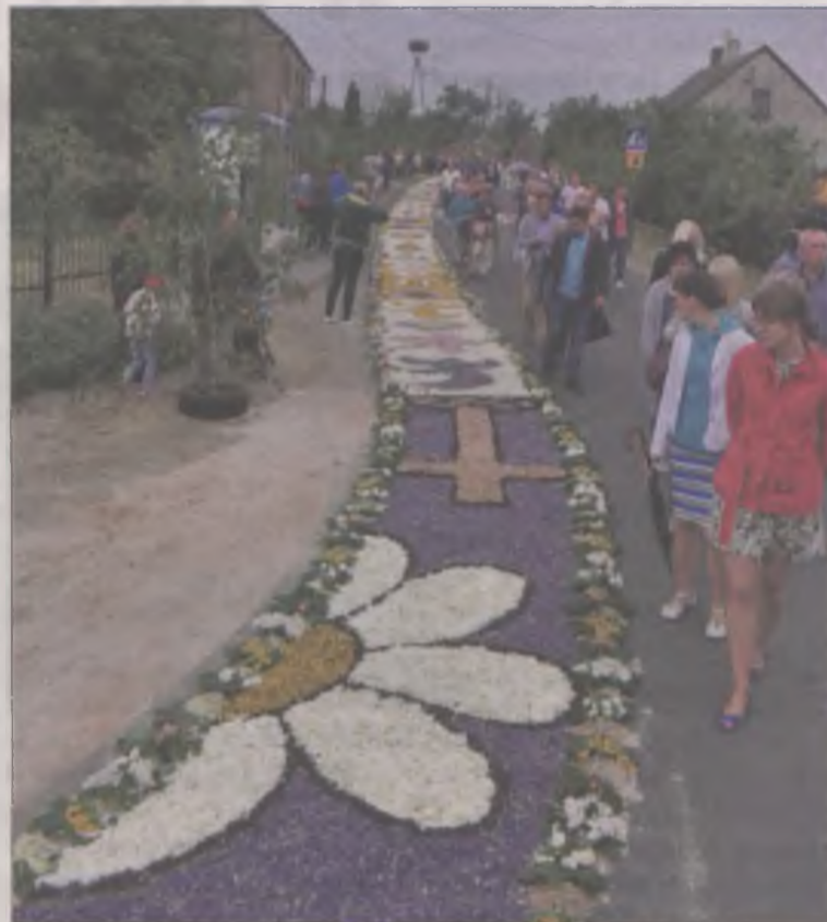
Kwietne dywany ciągną się na długość 2 kilometrów.

Tradycja układania dywanów z kwiatów z okazji Bożego Ciała w Spycimierzu sięga ponoć 200 lat. Niegdyś robione skromnie z piasku i gałęzi drzew na chwałę Pana, od kilkunastu już lat zyskują coraz większą sławę i popularność. W dzień Bożego Ciała do Spycimierza ciągną tysiące wiernych, by wspólnie i wyjątkowo obchodzić Uroczystość Najświętszego Ciała i Krwi Pańskiej. A jest tam co podziwiać. Długi na dwa kilometry, niesamowicie kolorowy dywan i kwietne bramy układane są od rana z różnych kwiatów i płatków, liści, kory,