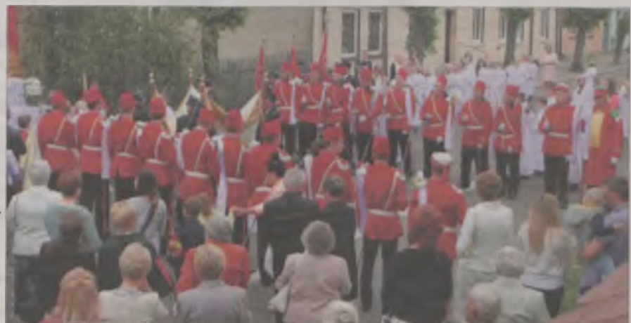
Zatrzymywano się przed ołtarzami, gdzie Turki tworzyli szpaler dla Najświętszego Sakramentu.

większości domostw, mijanych przez procesję. O bezpieczeństwo zadbał miejscowi policjanci i strażacy z Ochotniczej Straży Pożarnej, którzy pomagali kierować ruchem. Tradycyjnie rozwiązanie procesji nastąpiło przed dzwonnica, gdzie znajduje się kościelna brama. (art)