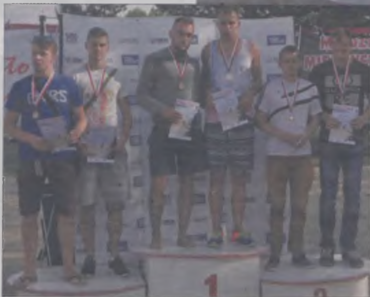
Pierwsza trójka par w kategorii męskiej.