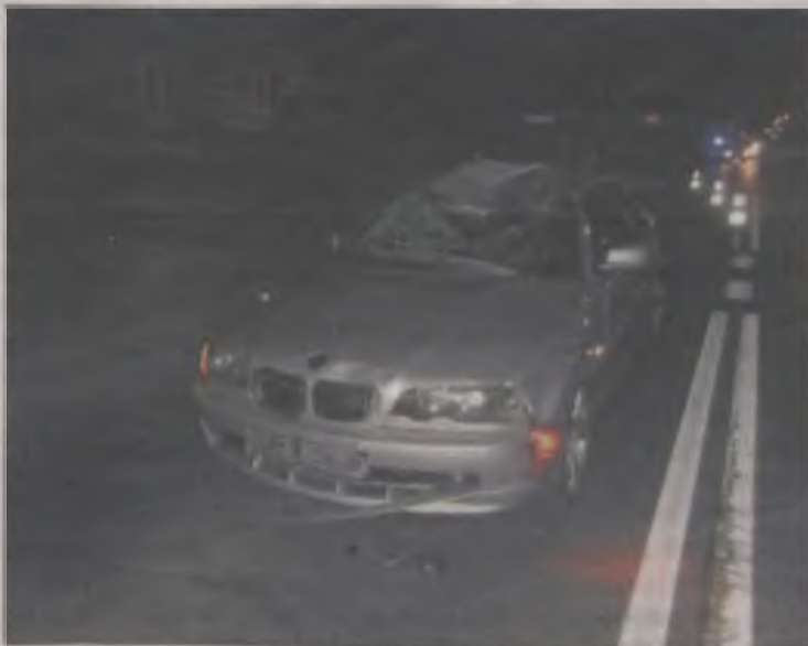
W wypadku, do którego doszło w piątkowy wieczór w Słodkowie, zginął 37-letni rowerzysta.

jakich doznał podczas wypadku były tak poważne, że 37-latek nie przeżył. Lekarz pogotowia stwierdził zgon. Choć na razie nie można jednoznacznie powiedzieć kto jest odpowiedzialny za spowodowanie wypadku, świadkowie twierdzą, że samochód wjechał na krzyżówkę prawidłowo, na zielonym świetle. W poniedziałek lekarz medycyny sądowej przeprowadził sekcję zwłok mężczyzny. Policja pod nadzorem prokuratury wszczęła śledztwo. II