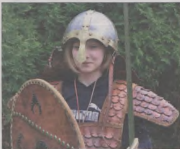
Oczywiście nie mogło się obyć bez pamiątkowego zdjęcia w zbroi wikingów...

Warsztaty czwartoklasistów z ZS-P w Dobrej w Kaliskim Grodzie Piastów, czyli na tzw. Zawodziu, były jeszcze jednym akcentem podsumowującym obchody 1050-lecia Chrztu Polski. Wybrała się tam grupa 42 uczniów. Uczestniczyli w wycieczce po Prośnie repliką łodzi pod wdzięczną nazwą Calsia , którą prawdopodobnie płynął św. Wojciech do krainy Prusów. Poznawali również tajniki pracy w średniowiecznym scriptorium , gdzie próbowali pisać gęsim piórem, ucząc się kaligrafii. Zapoznali się z pracą archeologów, dokonując „wykopalisk” w zaimprovizowanych „stanowiskach archeologicznych”, zwiedzali również replikę słowiańskiego grodu z X wieku, wchodzącego w skład „państwa gnieźnieńskiego”. Jego renowacja zakończyła się w 2007 roku. Jej podstawą były przeprowadzone wcześniej prace wykopaliskowe.