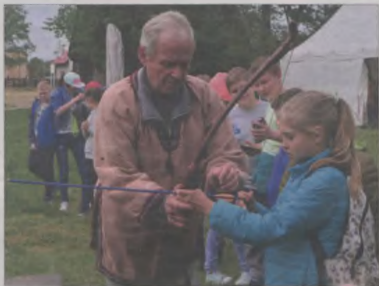
... oraz strzelania z łuku.