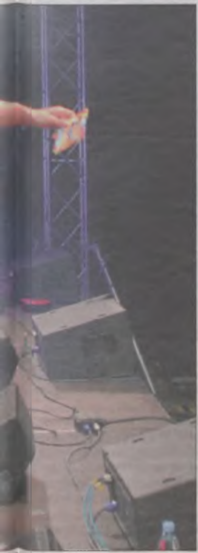
1 Tomasz Niecik.