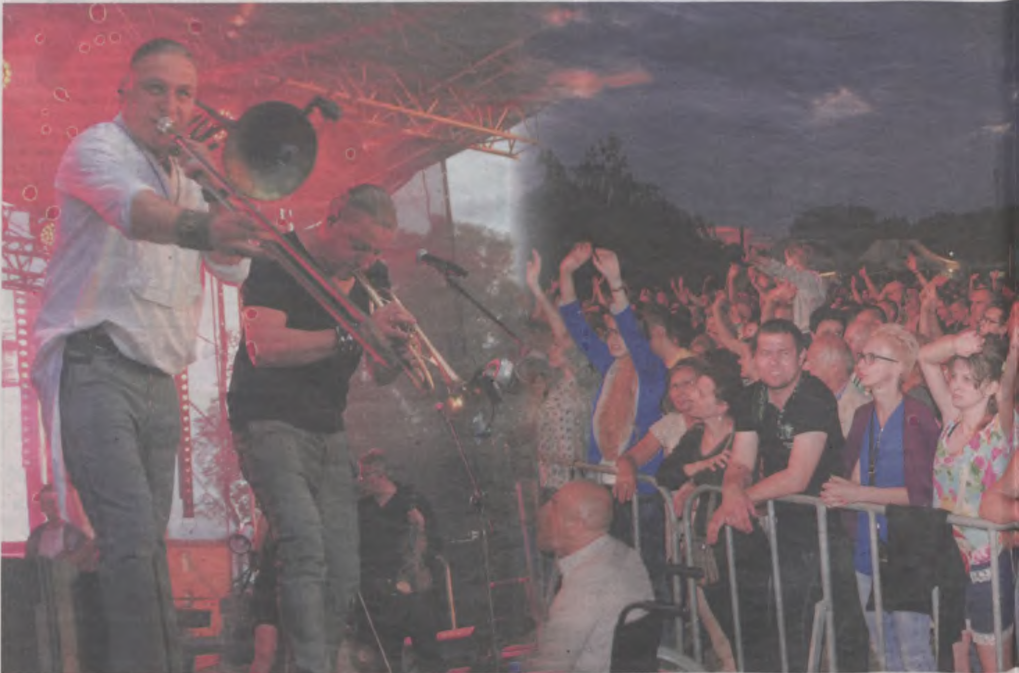
Najliczniejszą publiczność zgromadził niezawodny od lat zespół Golec uOrkiestra.