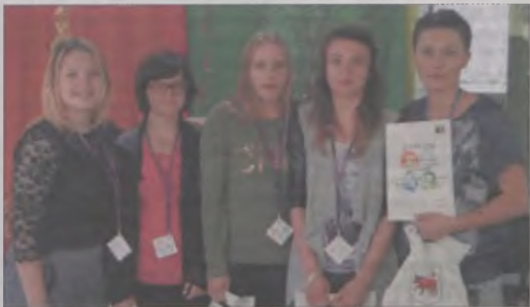
Uczennice ze Specjalnego Ośrodka Szkolno-Wychowawczego w Turku, laureatki Międzyośrodkowej Olimpiady Matematyczno-Przyrodniczej.

Gimnazjaliści ze Specjalnego Ośrodka Szkolno-Wychowawczego w Turku zostali zwycięzcami Międzyośrodkowej Olimpiady Matematyczno-Przyrodniczej pod hasłem „Cztery żywioły”.