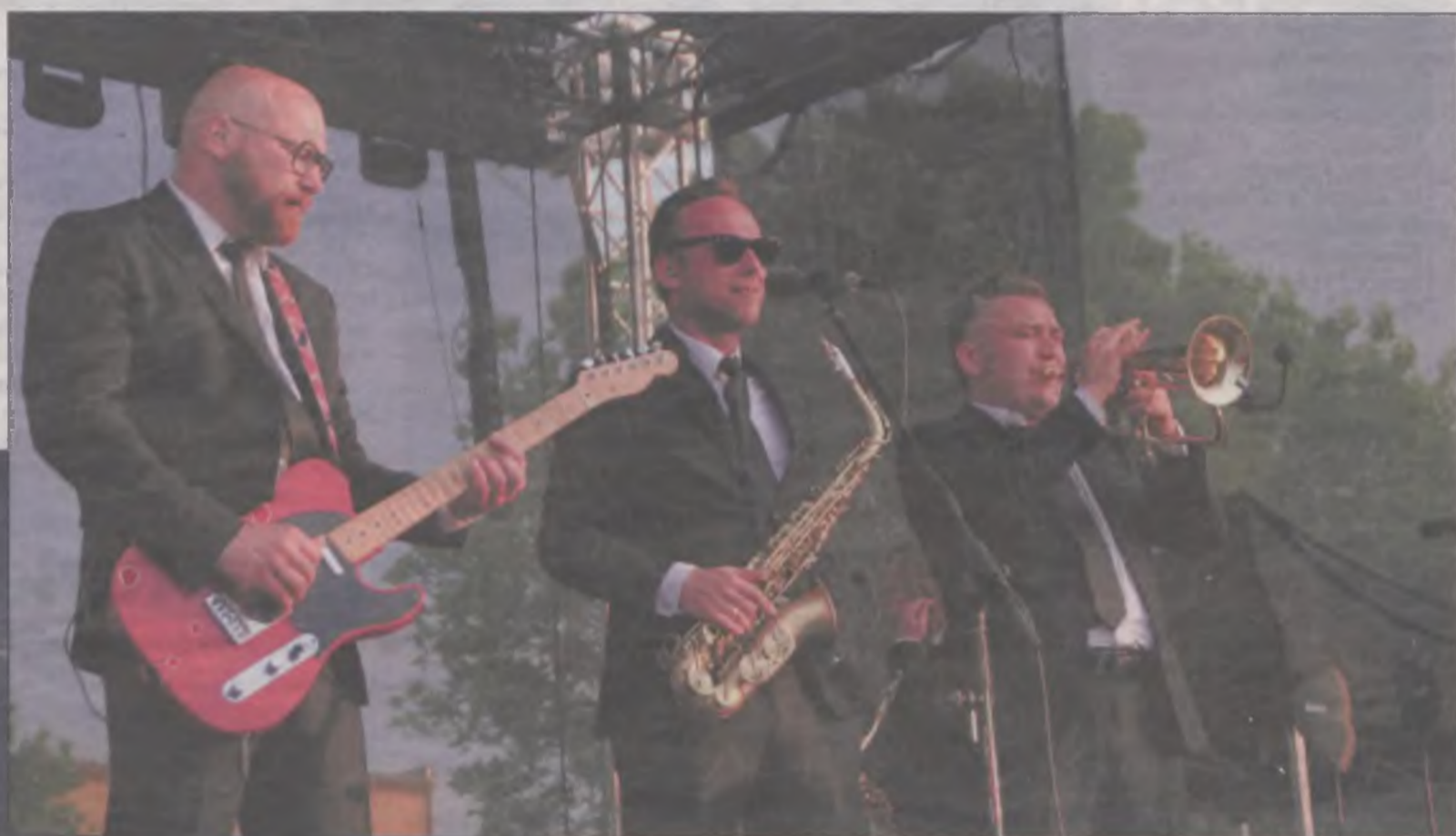
Poparzeni Kawą Trzy nie mogli zejść ze sceny, później jeszcze długo rozdawali autografy.