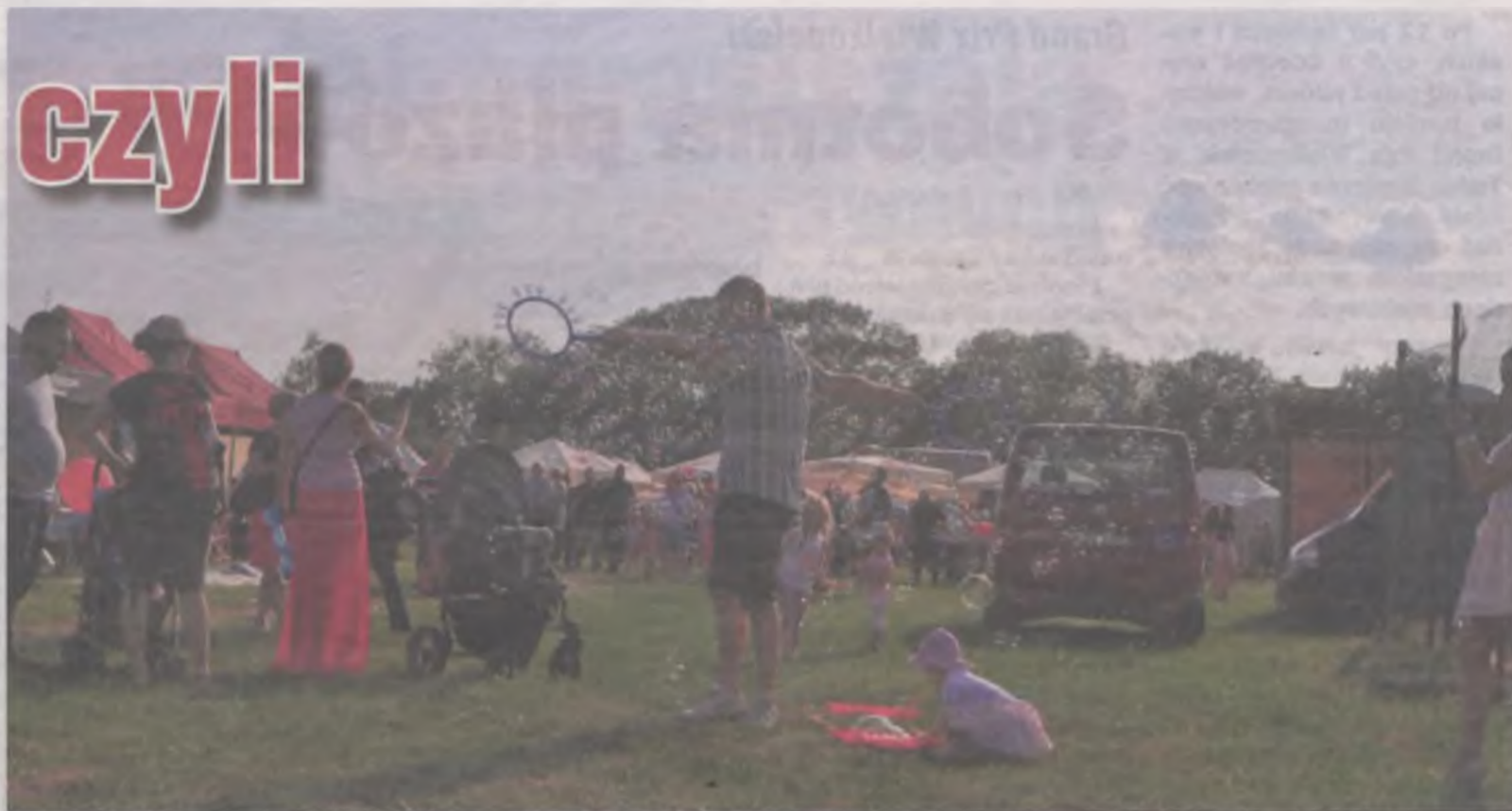
W tym roku pogoda sprawiła, że Dni Miasta i Gminy miały piknikowy charakter.