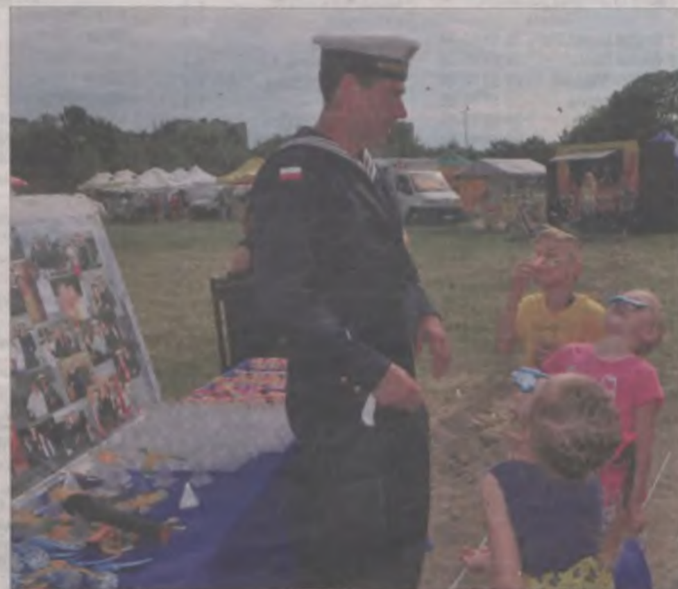
Na OSiRze na najmłodszych czekało wiele atrakcji.