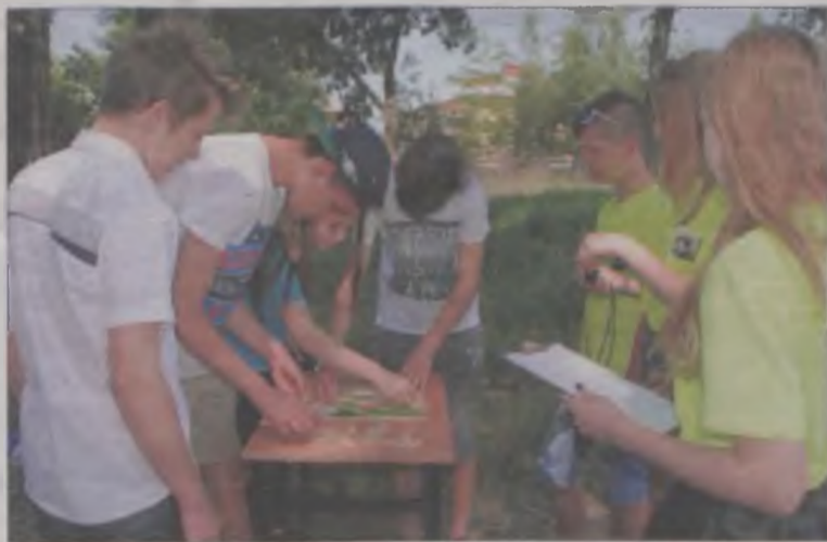
Mapa polityczna Europy nie sprawiała nikomu problemu.