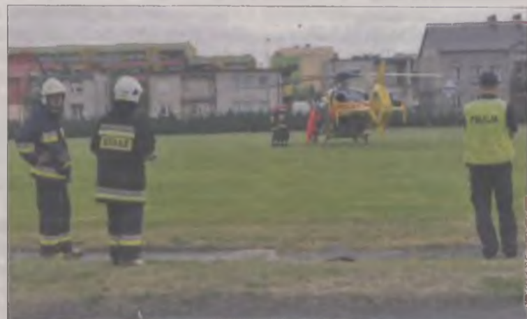
Lotnicze Pogotowie Ratunkowe przetransportowało czterolatek do łódzkiego Centrum Zdrowia Matki Polki.

Chwilę później na miejscu pojawiła się karetka. Lekarz postanowił, by na pomoc wezwać śmigłowiec. Zanim dotarł do Turku, strażacy zorganizowali miejsce do lądowania na stadionie przy liceum ogólnokształcącym. Z ambulansu dziecko przeniesione zostało do Lotniczego Pogotowia Ratunkowego, które przetransportowało je do łódzkiego Centrum Zdrowia Matki