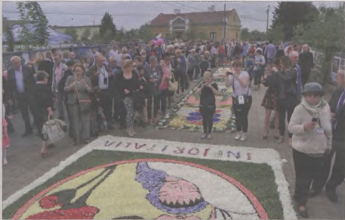
Tysiące osób fotografowały obraz ułożony przez Włochów.

W tym roku święto Bożego Ciała przypadło wyjątkowo szybko, bo w miniony czwartek, 26 maja. Nie spowodowało to jednak, że kwietne dywany były mniej bogate czy kolorowe. Podobnie jak w minionych latach mieszkańcy Spycimierza stanęli na wysokości zadania układając dwukilometrowy kobierzec z płatków, kory, liści i piasku.