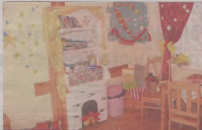
Przed świętami Bożego Narodzenia odbywa się w internacie konkurs na najładniej przystrojony pokój.