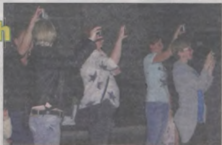
Fotografujących było bez liku.

wały i filmowały występujących. Zasady savoir vivre przestają obowiązywać, toteż fotografujący bez żenady utrudniali, a nawet uniemożliwiali widzom w tym dzieciom śledzenie