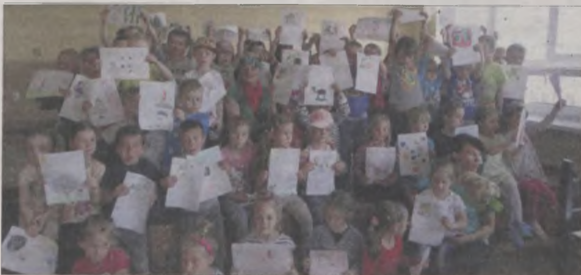
Dzieci zilustrowały swoje lęki. Zmierzenie się ze strachem jest najlepszą drogą do jego pokonania

W ramach tegorocznego Tygodnia Bibliotek w Miejsko-Gminnej Bibliotece Publicznej w Uniejowie odbyły się zajęcia dla najstarszych grup dzieci z Miejskiego Przedszkola w Uniejowie. Przybyłych licznie przedszkolaków przywitał sympatyczny zółwik - ulubiony bohater dziecięcych bajek: Franklin, który to na swoim przykładzie udowodnił dzieciom, że z każdej sytuacji jest wyjście. Tym razem Franklin próbował przezwyciężyć strach przed ciemnością. Dzięki pomocy dorosłych znalazł prosty, a zarazem skuteczny sposób na pokonanie w sobie obaw i lęków. Po raz kolejny sprawdziło