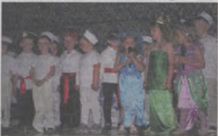
Dzieci rozśpiewane i roztańczone prezentowały barwne widowiska.

Niestety były też mankamenty. Pierwszy to słabe nagłośnienie, a przez to słowa płynące ze sceny w