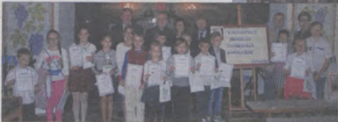
Nagrodzeni w konkursie plastycznym.

Ksiądz proboszcz podziękował uczestnikom za udział w przeglądzie i zaprosił na przyszłoroczny. Miejmy nadzieję, że wezmą w nim udział reprezentanci także innych gmin. Dużą w tym rolę katechetów, aby zachęćli dzieci i młodzież. Oby ponownie zawitali do Boleszczyna uczniowie szkół ponadgimnazjalnych. (art)