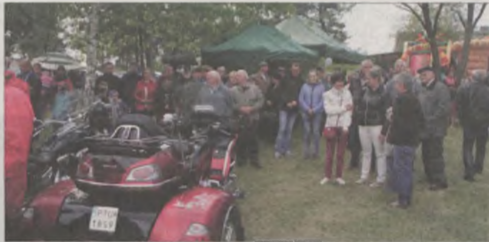
Mimo niesprzyjającej pogody, organizatorom pikniku udało się zgromadzić rzeszę mieszkańców. Dużą atrakcją był zjazd motocyklistów.