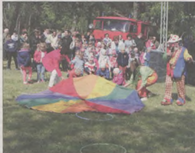
AJ Dzieci do zabawy angażował kłown wraz z pomocnikami.

Z pokoiu redaktorskiego obserwując to co się od dłuższego czasu dzieje u stóp Sanktuarium Przemienienia Pańskiego w Galewie wypada zauważyć, że jest to jedynie zbieranie owoców zrodzonych z biegłości w sztuce włączania całej społeczności lokalnej. Czy zatem gdzie indziej ta umiejętność nie byłaby równie przydatna?