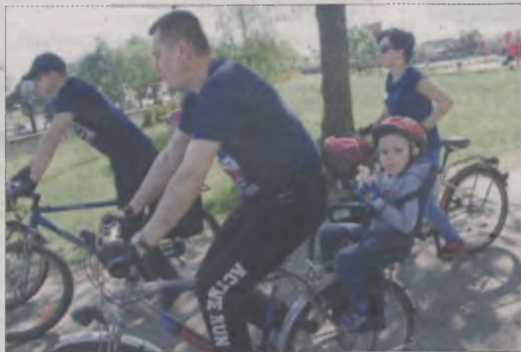
Najmłodsi podróżowali z rodzicami.