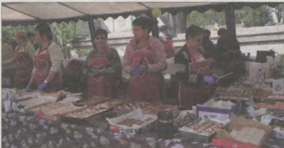
Takiej różnorodności i ilości wypieków mogłaby pozazdrościć niejedna cukiernia.