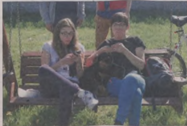
W oczekiwaniu na sygnał startu.