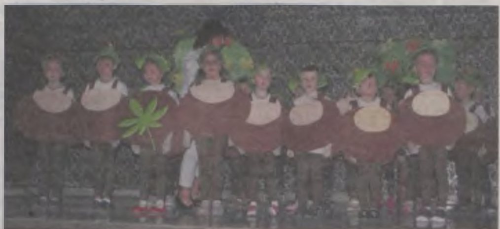
Kasztanowe ludki z Kowali Pańskich.