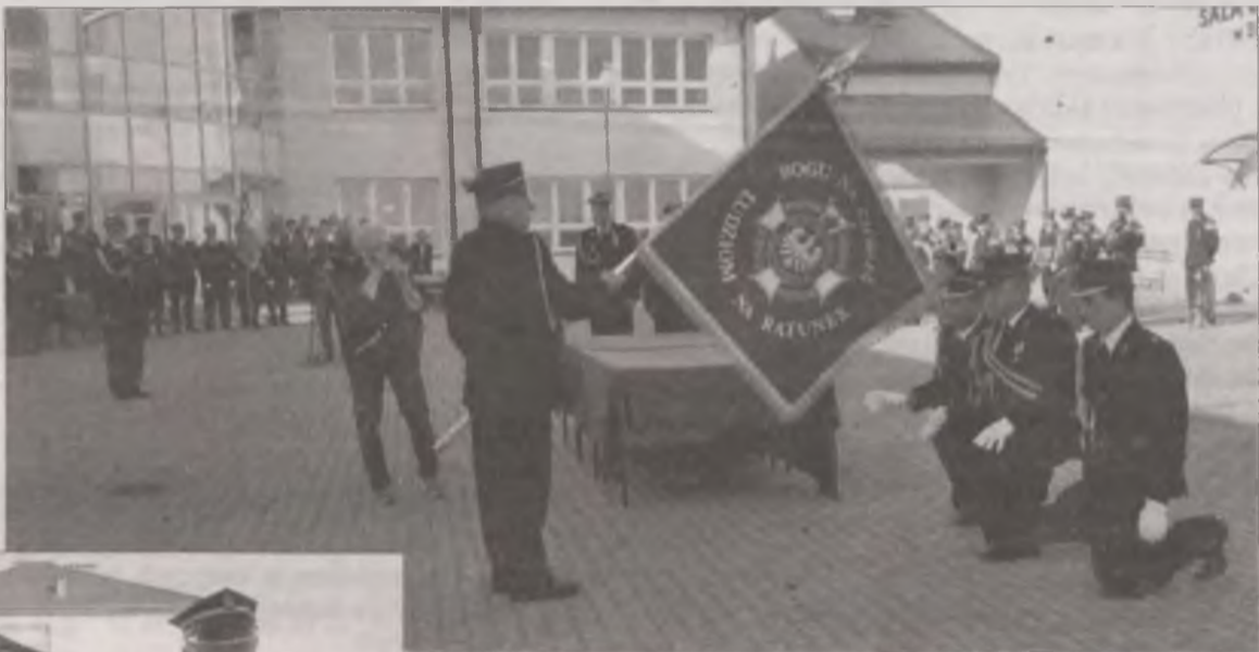
Ceremoniał przekazania nowego sztandaru słodkowskiej jednostce OSP.