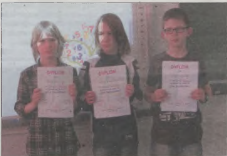
Najlepsi matematycy wśród czwartoklasistów.