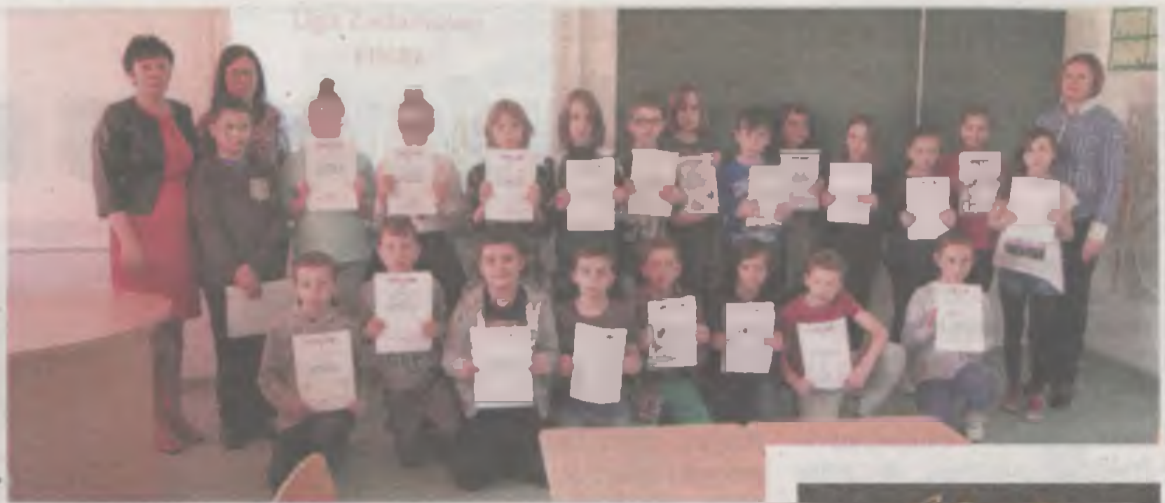
Uczestnicy finału Ligi Zadaniowej.