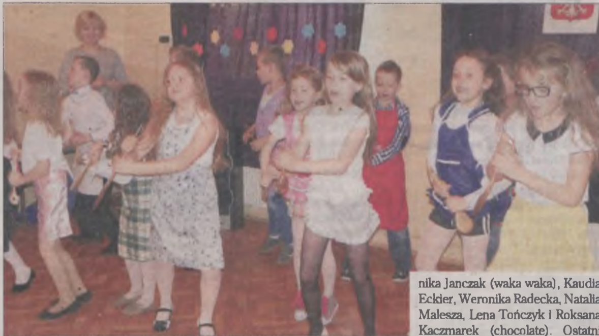
Uczniowie prezentowali zarówno tańce indywidualne jak i grupowe.