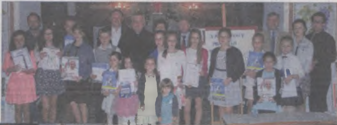
Uczestnicy części wokalne Przeglądu.

Tuż przed ogłoszeniem wyników konkursu, ksiądz Zygałliński zaproponował wspólne