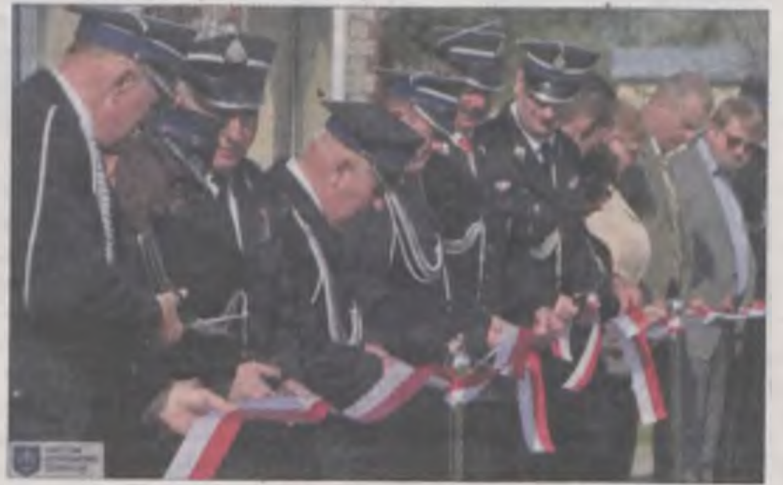
Druhny, druhowie, zaproszeni goście i przedstawiciele zaprzyjaźnionych jednostek - wstęgę przecinało kilkanaście par nożyczek, ho i remont wsparło sporo par rąk