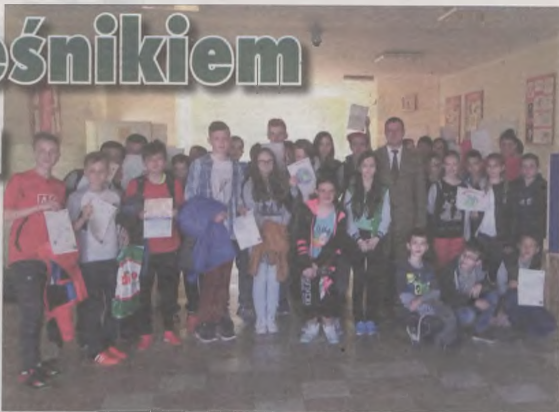
Pamiątkowe zdjęcie z leśnikiem.

Spotkanie było też okazją do zorganizowania warsztatów, podczas których uczniowie pisali i rysowali „Listy dla Ziemi”. (art)