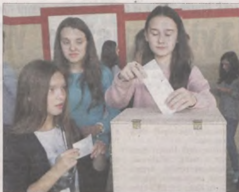
Wybory do Samorządu Uczniowskiego odbyły się na początku tego roku szkolnego.

Jeżeli chodzi o komunikację i media, w „jedyńce” prężnie działa kółko radiowe oraz gazetka szkolna. Audycji oraz muzyki można posłuchać podczas lekcyjnych przerw. Tematyka artykułów prasowych związana jest z ważnymi wydarzeniami z życia szkoły. A tych w placówce nie brakuje. Uczniowie uczestniczyli w Ogólnopolskim Dniu Drugiego Śniadania, podczas którego przygotowali smaczne i zdrowe kanapki, soki z marchwi i owocowe przekąski. Co roku obchodzą też Halloween, Międzynarodowy Dzień Życzliwości i Pozdrowień, Andrzejki czy Dzień Białej Bransoletki, symboli-