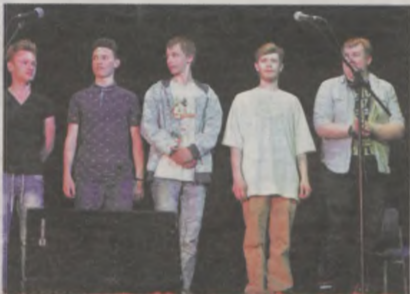
Uczestnicy warsztatów improwizacji kabaretowej, które poprowadzili artyści z Czesuafa.

W uroczystości „Dnia Strażaka” uczestniczyli też druhowie z OSP w Zdieszowicach (woj. opolskie). Strażacy przyjechali specjalnie, by podziękować ochotnikom i mieszkańcom gminy Malanów, za pomoc podczas powodzi w 1997 roku. Świętujący mieli dużo szczęścia, bo chwilę po zakończeniu części oficjalnej, zaczął padać deszcz. Jednak większość zdążyła już wejść do świetlicy, gdzie gospodarze zaprosili na poczęstunek. ii