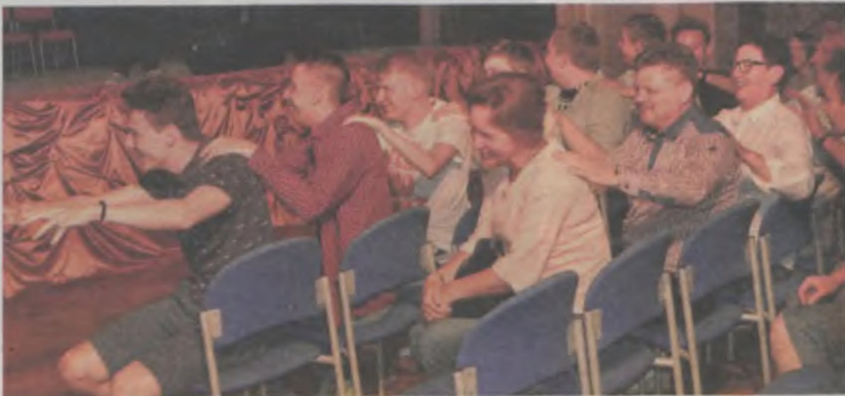
By rozluźnić publiczność, członkowie kabaretu zaproponowali wspólną zabawę.

W organizację wydarzenia oprócz turkowskiej biblioteki, włączyła się też Ochotnicza Straż Pożarna, Stowarzyszenie „Przy-