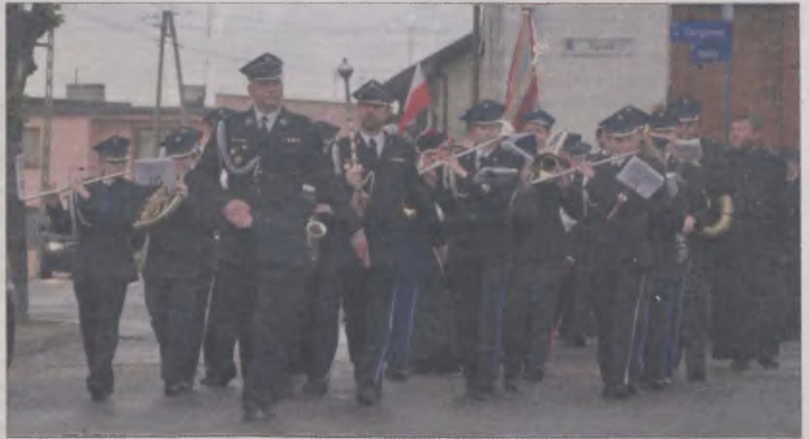
Przemarsz do kolegiaty poprowadziła Orkiestra Dętą ZHP-OSP Uniejów.

W majowy weekend Stowarzyszenie Przedsiębiorców Turystycznych zorganizowało majówkę w scenerii uniejowskiego parku. Wystawiono tam stoiska z napojami i jadłem, zapewniono muzykę, by w ten sposób reklamować turystyczną działalność. Swój akcent w majówce zaznaczyli też ochotnicy z OSP w Uniejowie. Druhowie zaprezentowali samochód gaśniczy i znajdujący się w nim sprzęt. Wykonali też kontrolowany pokaz gaszenia pożaru snopka słomy. Instruowali zebranych jak powinien zachować się człowiek udzielając pierwszej pomocy poszkodowanemu w wypadkach drogowych. Zademonstrowali posadany sprzęt ratownictwa medycznego i jego działanie. Przeprowadzili też pogadankę ze znajdującymi