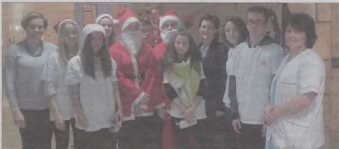
Słodkowskie Mikołaje zawitali w szpitalu.

Wolontariusze z Gimnazjum w Słodkowie zebrali pół tony żywności