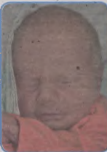
... Bazan syn Malwiny i Huberta ur. 13 stycznia, godz. 1.50 waga 3100, długość 49 cm