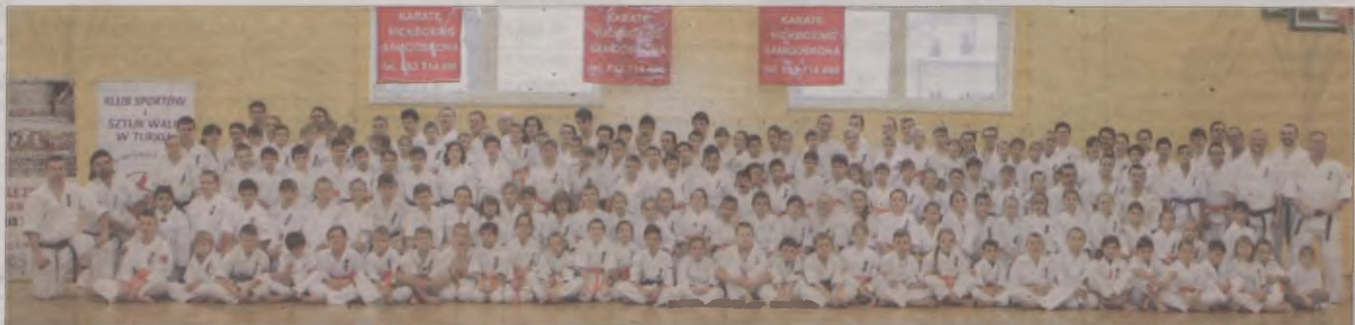
Blisko 200 zawodników zmierzyło się w niedzielę 10 stycznia z egzaminem na wyższe pasy kyokushin karate.