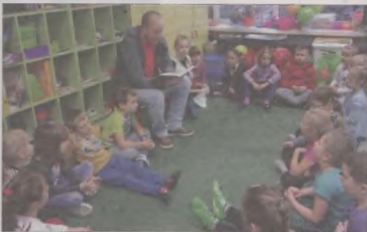
Rodzice czytając dzieciom, często dopiero wtedy zdają sobie sprawę z tego, ile radosnych wspomnień z ich dzieciństwa związanych jest z czytaniem wówczas książkami.