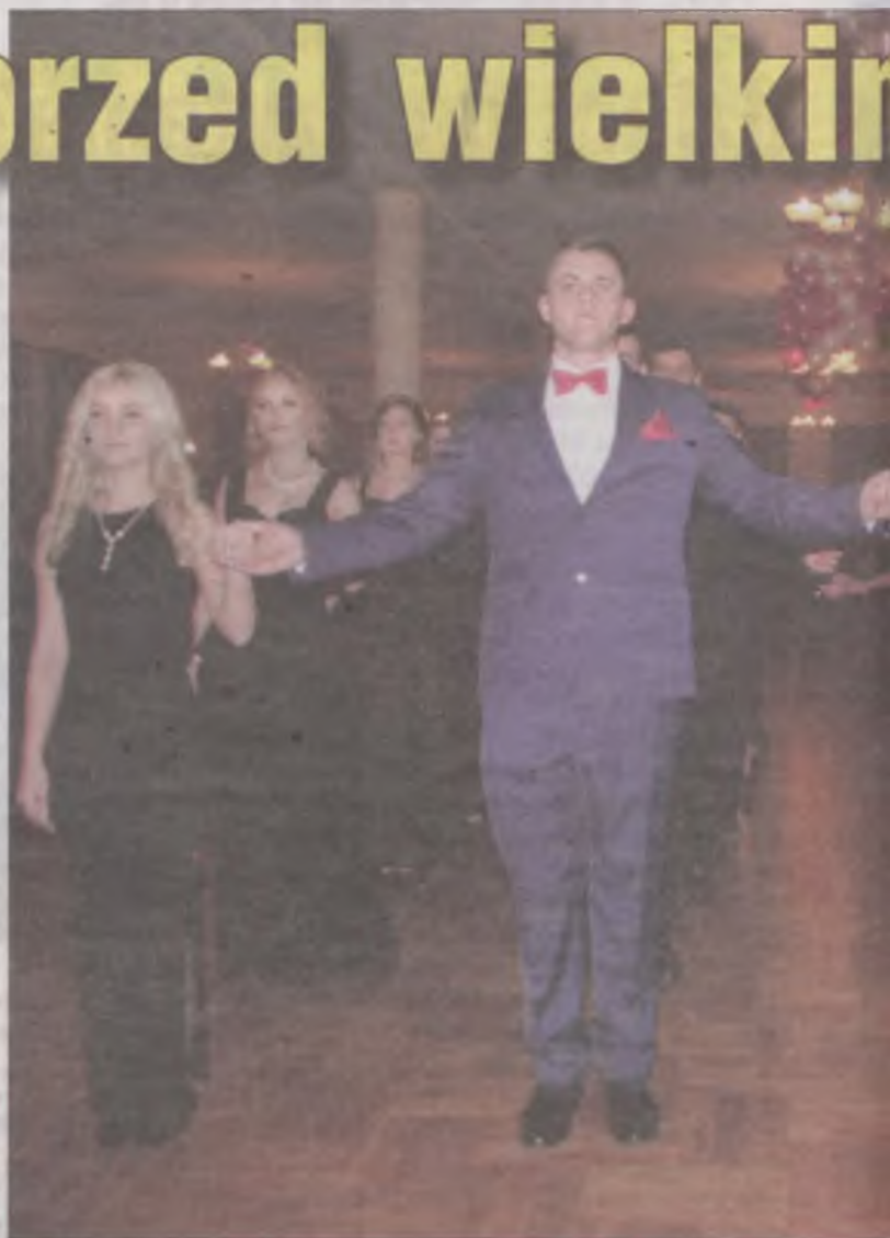
Czternaście par zatańczyło w tym roku poloneza. Nie było łatwo dopaść jednak znakomicie, układ taneczny i samo wykonanie sprawiły, że widzowie

kiem prowadziła oficjalną część uroczystości.