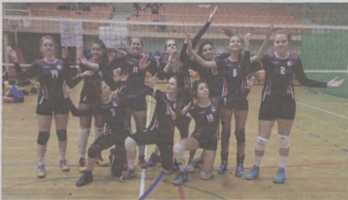
Po trudnym spotkaniu z UKS Szamotulanin, to kadetki Piątki Turek pojedą na finały do Pity.

Odbył się on w sobotę 16 stycznia w Turku w hali widowiskowo-sportowej przy Parkowej. Regułą jest, że sędziowie i zespoły gości meldują się najpóźniej godzinę przed meczem. Tym razem zespół z Szamotuł wraz z rodzicami i kibicami zajechał do Turku już na dwie godziny przed rozpoczęciem rozgrywek. Od początku meczu, wspaniały doping kibiców rywali, który miał pomóc drużynie z Szamotuł, stał się mobilizujący dla zespołu „Piątki” Turek. Dokładna zagrywka i skuteczny atak dał zawodniczkom „Piątki” Turek wygraną do 14. Jednak w drugiej partii, to zespół z Szamotuł rozpoczął grę dominacyjną i wykorzystując błędy zawodniczek z Turku, wygrał do 18. Trzeci set spotkania to praktycznie powtórka pierwszego seta i znów wygraną „Piątki” Turek - do 15. W czwartej odsłonie spotkania drużyna UKS „Piątka” Turek postawiła sobie za cel wygraną seta i postawienie „kropki na i” w dwumeczu. Po pierwszych akcjach zawodniczki z Turku prowadziły: 3:2, 7:4, 10:5.