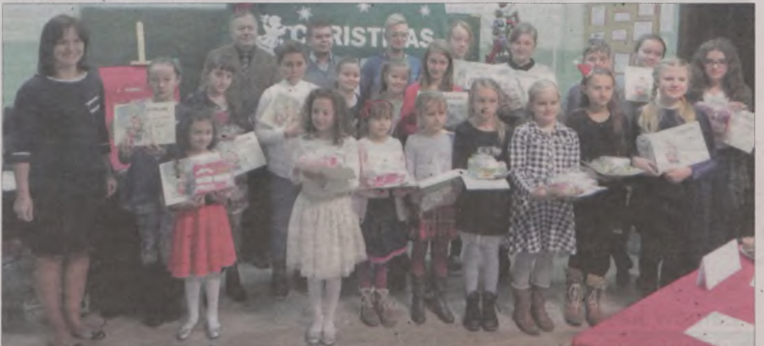
W konkursie wzięło udział 19 uczniów z czterech gminnych szkół.

Radę Rodziców przy Szkole Podstawowej w Wyszynie. Wszyscy uczestnicy otrzymali również słodkie podarunki ufundowane od firmy Kupiec. boxa