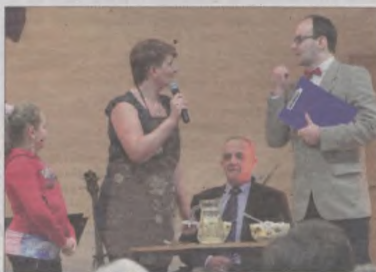
Chwila napięcia. Nasz polski Michelle smakuje pierwsze danie - to propozycja Wilamowa.