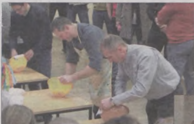
Panowie rywalizowali w bicia piąsy.

Imprezę zorganizowano przy wsparciu finansowym PKG Termy Uniejów Sp. z o.o. w Uniejowie