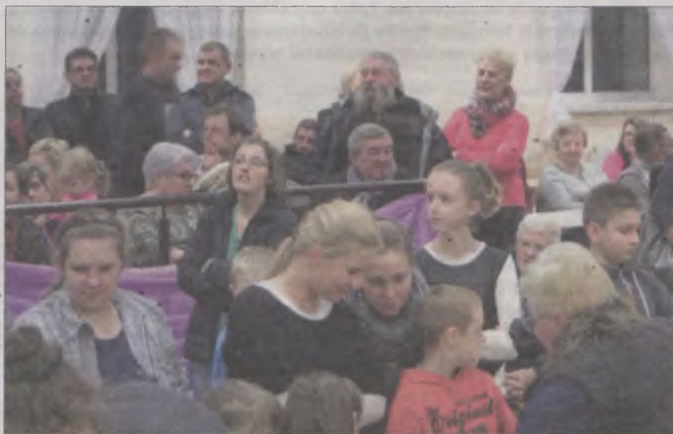
Sala w Wilamowie wypełniła się gośćmi.