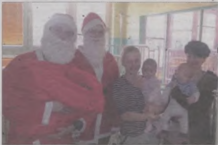
Uczestnicy akcji na oddziale dziecięcym.