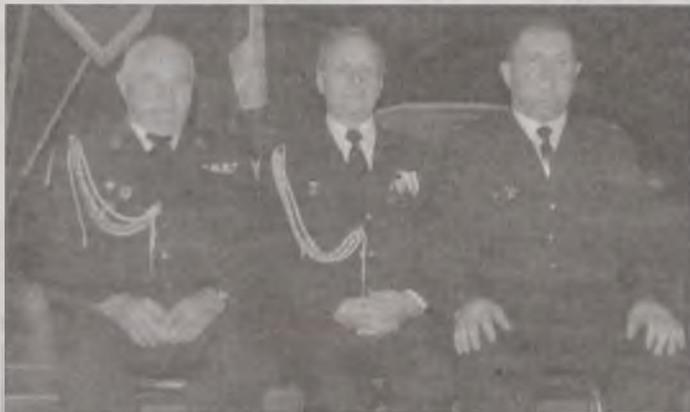
Komisja rewizyjna w nowym składzie.