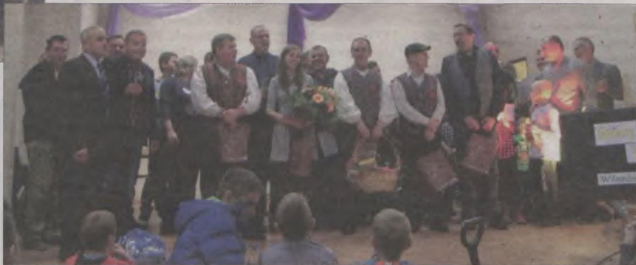
Wszystkie drużyny świętowały zwycięstwo - nieważna była liczba punktów, ale podjęcie wyzwania.