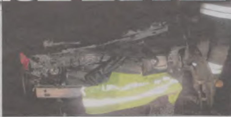
W samochodzie jechała 25-letnia mieszkanka województwa kujawsko-pomorskiego.

Na miejsce oprócz policjantów i pogotowia ratunkowego, wezwani zostali strażacy z Turku i Władysławowa. Podróżująca samochodem o własnych siłach wysiadła z auta, jednak nie czuła się dobrze i pogotowie przewiozło ją do szpitala w Koninie. Do zadań ostatnich należało zabezpieczenie miejsca zdarzenia, oświetlenie terenu zdarzenia i odłączenie w hondzie akumulatora. ii