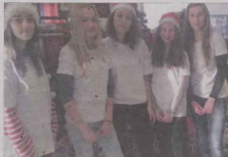
Wolontariuszki Szkolnego Koła PCK w Słodkowie.