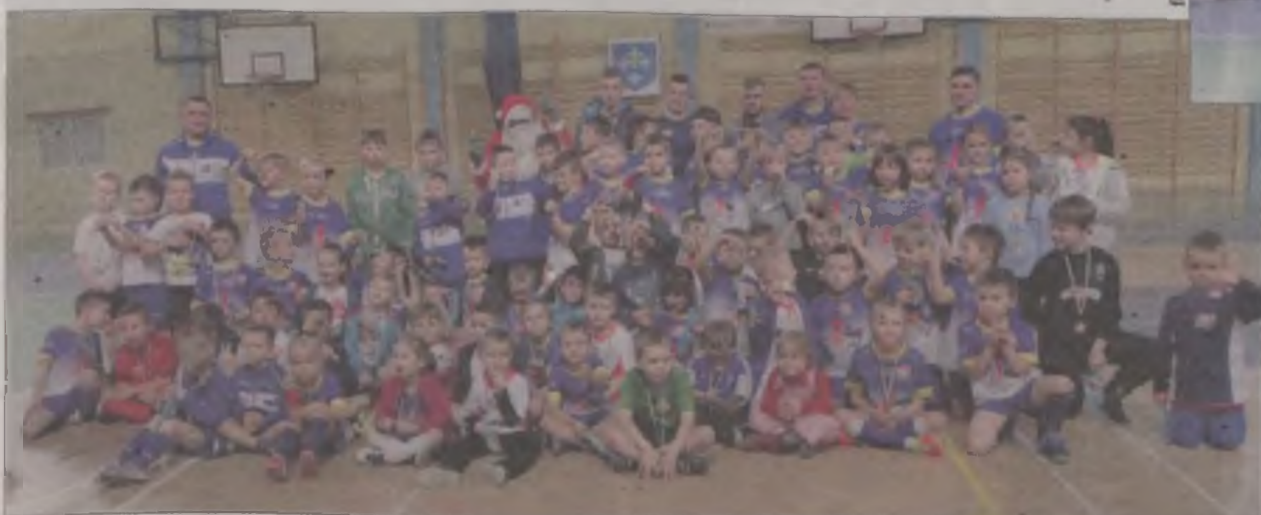
W tym roku w Świętecznym Turnieju wzięła udział rekordowa liczba uczestników, prawie 130.