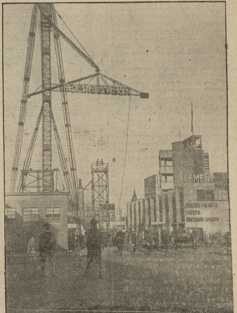
Pod ramiona olbrzymiej betoniarki chroni się cały przemysł budowlany.

W tymże samym pokoju nr. 52 postarano się nam przedstawić wykresowo rozwój Korpusu przy obejmowaniu poszczególnych odcinków granicznych. A więc w roku 1924 objęto narazie odcinek granicy polsko - sowieckiej w rejonie Wileńszczyzny i w rejonie Wołynia. W roku następnym, t. j. 1925 przyszła kolej na Polesie i na linię Zbrucza; w roku 1926 ubezpieczono się od strony Walde-marasa, na koniec w r. 1927 ubezpieczono odcinek granicy polsko - niemieckiej w części przylegającej do granicy polsko - litewskiej i odcinek granicy polskorumuńskiej w części przylegającej do granicy polsko - sowieckiej. Kolejne etapy obejmowania granicy znaczą nam kolory żółty (1924), niebieski (1925), czerwony (1926) i ceglasty (1927).