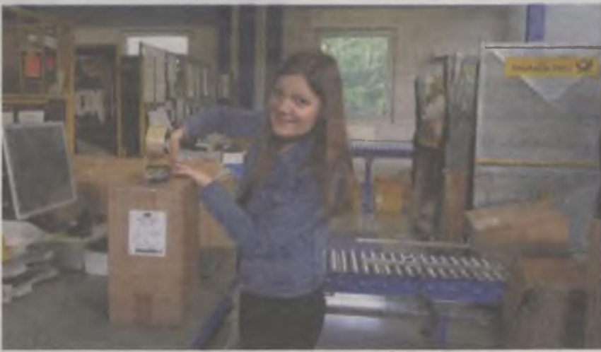
Zadaniem uczniów z Turku było między innymi zabezpieczanie towarów w magazynie, przyjmowanie list przewozowych, ich realizacja oraz znakowanie przesyłek.

W ramach współpracy szkół, odbyło się również spotkanie z władzami Kaufmännisches Berufskolleg Walther Rathenau. Uczniowie mieli też możliwość zwiedzenia szkoły, do której uczęszcza około 2500 uczniów z miasta i okolic. Już w maju mło-