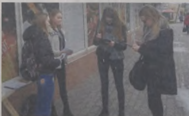
Projekt drużyny gimnazjalistek zakłada skwer Imienia Rocha Rupniewskiego.

Obie grupy projektowe w pierwszej kolejności zgromadziły materiały