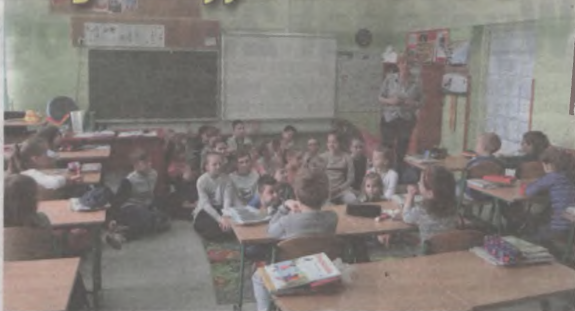
Przedkolaki z „Małego Odkrywcy”, podczas wizyty w Szkole Podstawowej nr 4 w Turku, wzięły udział w zajęciach poprowadzonych przez nauczycielki.