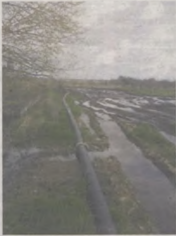
Według mieszkańców poferment, czyli odpad z przykońskiej biogazowni, spłynął z pól i dostał się do Teleszyny a nią do zbiornika Przykonia.

Podobny sygnał dotarł na policję oraz do Urzędu Gminy w Przykonia i we wtorek, 18 kwietnia, przedstawiciele obu instytucji ruszyli na wizję lokalną. -Doszliśmy do samego końca rurociągu, aż do przepompowni, z której odpad odbierany jest przez wóz asenizacyjny i wywożony na pola - mówi Jolanta Chrostek z UG w Przykonia. -Duża część substancji na polu była już przeorana. Główny problem występował za biogazownią, gdzie rozłączył się rurociąg.