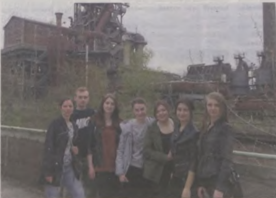
Uczniowie z turkowskiego ZST gościli w Duisburgu od 28 marca do 8 kwietnia.

Praktyki zawodowe w Niemczech odbyły się w ramach projektu „Erasmus+ Twoją szansą na sukces zawodowy”, realizowanego we współpracy ze szkołą partnerską Kaufmännisches