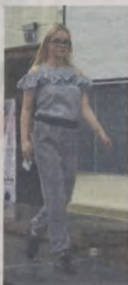
„Szare Miraż” to połączenie szarości, prążków oraz falbanek.

cję składającą się z siedmiu strojów, których wspólną cechą były szarości, prążki i falbanki. Uczestnicy konkursu swoje prace prezentowali podczas pokazu mody na modelkach, a także manekinach, plakatach oraz w prezentacjach multimedialnych. -Nie spodziewałam się, że moja kolekcja zostanie wyróżniona, bo naprawdę był wysoki poziom. Włóknosność była godna podziwu, nie wspominając o kolekcjach, które zajęły pierwsze trzy miejsca - opowiada wyróżniona turkowiec.