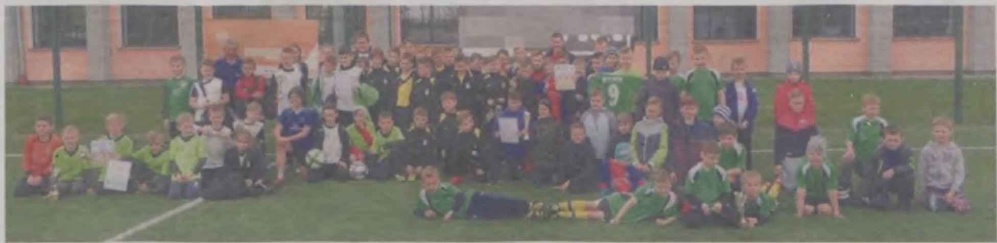
Uczestnicy turnieju Dobra Cup 2017.