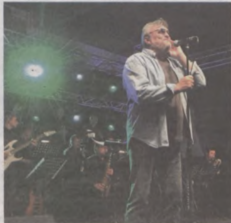
Mimo upływu lat głos Cugowskiego nie blaknie i uwodzi kolejne pokolenia.