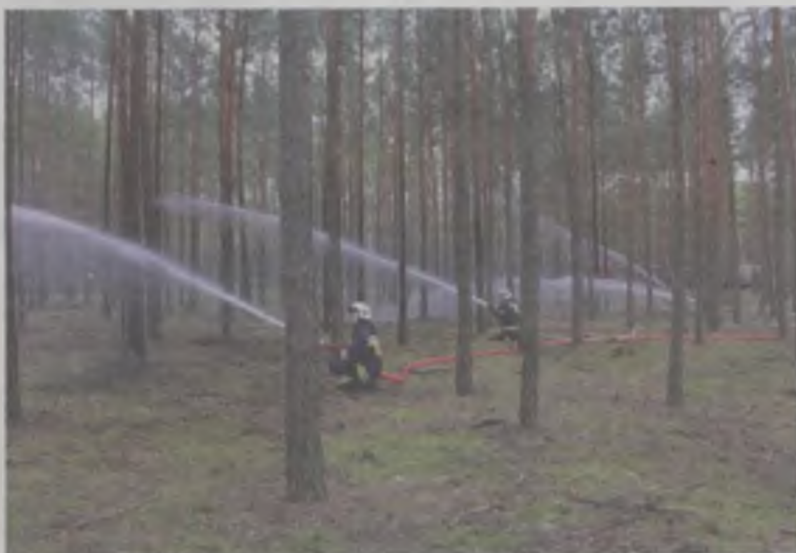
Celem ubiegłotygodniowych ćwiczeń było gaszenie pożaru lasu ...

Strażacy sprawdzili też w praktyce parametry pomp pożarniczych oraz urządzeń do podawania wody. Dodatkowym elementem ćwiczeń było doskonalenie organizacji łączności na terenie akcji przy użyciu