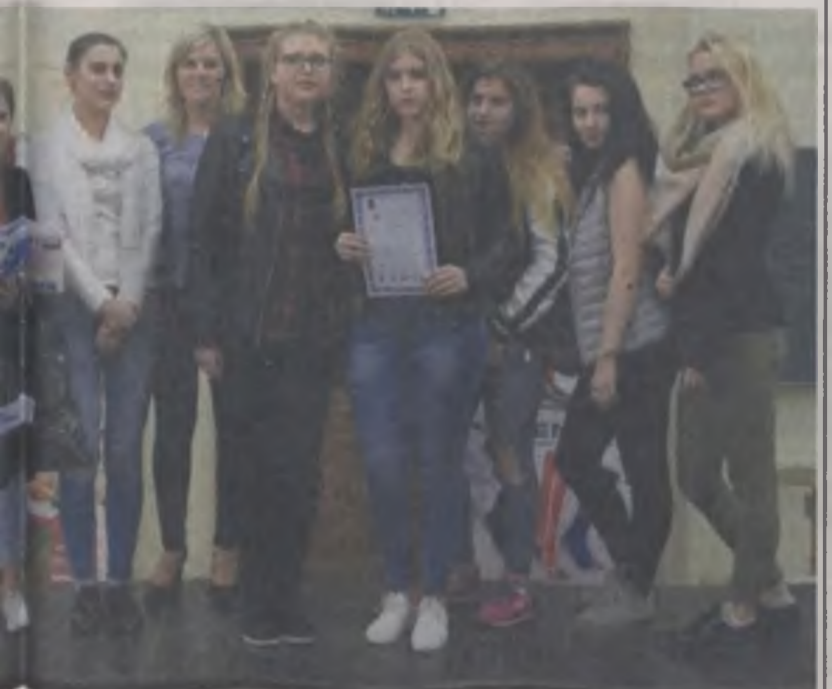
lowej) tuż po wyróżnieniu podczas ogólnopolskiego konkursu TEXTIL 2017 "Mika Łódzka". Na zdjęciu wraz z koleżankami z klasy, które także brały udział w Frączak.

Do Łodzi wraz z koleżankami z technikum technologii odzieży pojechały także uczennice z kierunku technik przemysłu. Po zakończeniu konkursu, wspólnie uczestniczyły w warsztatach z mikroskopii włókien. Dowiedziały się podczas nich między innymi jak wygląda hadanie morfologii powierzchni oraz składu chemicznego próbek materiałów przy użyciu wysokorozdzielczego skaningowego mikroskopu elektronowego z