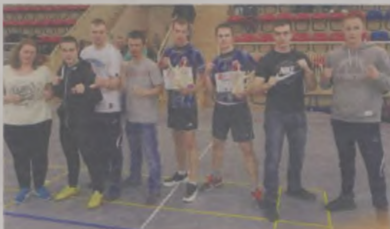
Reprezentacja Klubu Sportu i Sztuk Walk z Turku podczas chodzieskich konfrontacji K-1.