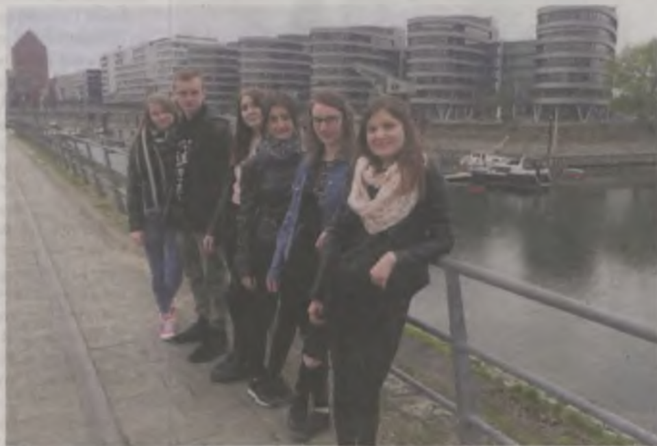
Oprócz zdobywania doświadczenia zawodowego, młodzież zwiedziła też leżący nad Renem półmilionowy Duisburg.