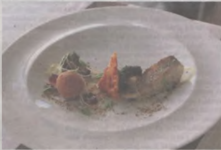
Zdaniem jurorów najlepsze danie główne przygotowano w Restauracji Termalnej Bistro&Cafe. Sandacz na musie porowym z falafelem, galaretką z buraka i palonym brokulem zdobył pierwsze miejsce.

Uniejowski Festiwal Smaków rozpoczął się w sobotę 22, a zakończył w niedzielę 23 kwietnia. Bohaterami tegorocznej, czwartej edycji imprezy były ryby. Do udziału w konkursie przystąpiły wszystkie uniejowskie lokale. Każdy przygotował dania specjalne, których na co dzień nie ma w menu. Niektóre z restauracji zrobiły także desery. Zarówno jurorzy, jak i pozostali uczestnicy konkursu mieli okazję spróbować: ryby smażonej we francuskim cieście ozdobionej warzywami, szczupaka z uniejowskiej rzeki zapiekanego z serem mozzarella i pomidorami z opiekanymi ziemniakami, salata i sosem cytrynowym, sandacza w ziołowym maśle w sosie z leśnych grzybów z zielonym puree z miejsc-