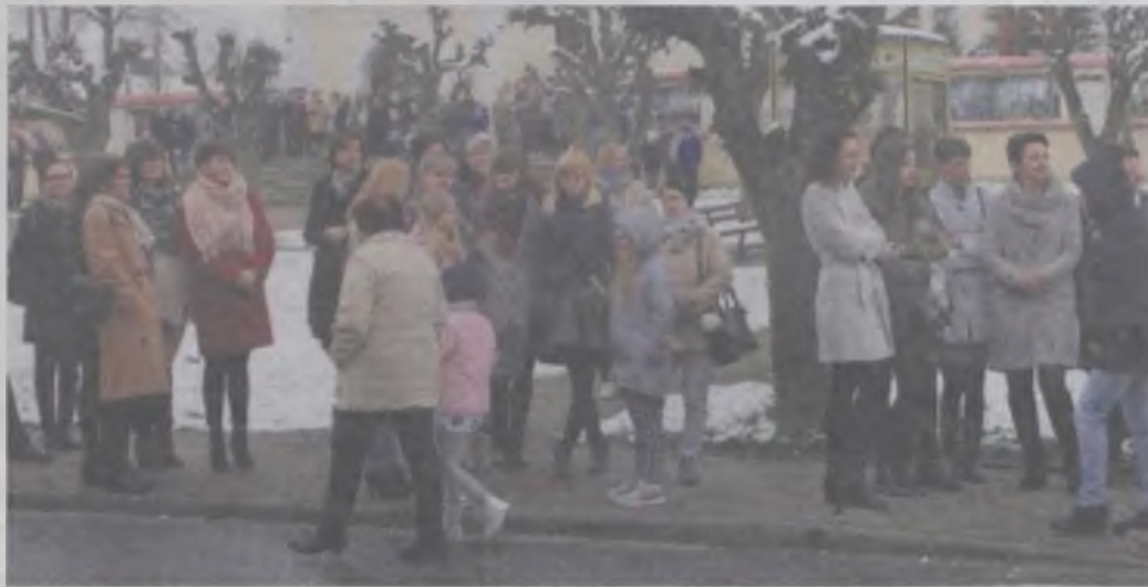
Kobiety czekały na swoich mężczyzn, którzy do krzyży w procesji „podążali bez względu na pogodę, wiek i trud”.

„Do krzyży w procesji podąża lud bez względu na pogodę, wiek i trud”. To maksyma towarzysząca pątnikom wyruszającym każdego roku w procesji Emaus. W tym roku była ona szczególnie na czasie, ponieważ mężczyźni wyruszający w wielkanocny poniedziałek o godzinie 5.30 z dobrskiego kościoła musieli stawić czoła śnieżycy. Pomimo tak trudnych warunków atmosferycznych nie brakowało chętnych do pokonania dziesięciokilometrowej trasy wiodącej polnymi drogami, leśnymi duktami i częściowo asfaltem. Na czele niesiono krzyż i figurę Jezusa zmartwychwstałego,