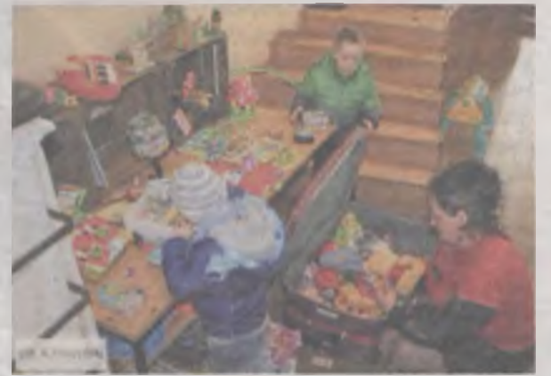
Spośród przyniesionych przedmiotów każdy znalazł coś dla siebie.

Zamierzasz założyć firmę albo zainwestować w rozwój prowadzonej działalności? A może szukasz dofinansowania na realizację Innego projektu, dzięki któremu pozytywnie wpłyniesz na swoje otoczenie? Skorzystaj w tym celu ze środków UE, a jeśli nie wiesz jak po nie sięgnąć, na tym spotkaniu pomogą Ci znaleźć rozwiązanie: