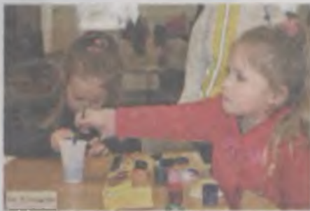
Oprócz kiermaszu stowarzyszenie zorganizowało także warsztaty dla dzieci.

nie szafy, które stało się jednocześnie hasłem naszej akcji integracyjnej, nie ogranicza się do samej odzieży, choć od niej – to znaczy od wymiany nieużywanych już ubrań – narodził się pomysł zeszłorocznego kiermaszu. Chodzi o zwyczaj przekazywania sąsiadom czy znajomym ubrańek po niemowlakach, ciuchów, z których wyrosły już nasze dzieci lub ubrań zalegających na półkach z różnych powodów: „bo się w nie mieścimy”, „bo są na nas za duże”, „bo nie mod-