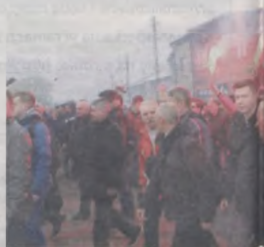
Petardy i race to nieodłączny element dobrskiego Emausa.