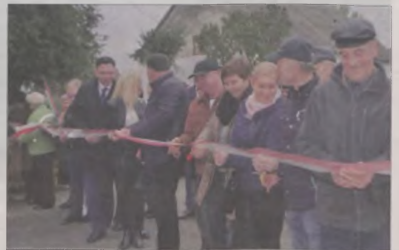
Oficjalnego otwarcia inwestycji mógł dokonać każdy z mieszkańców.

mieszkańcy Boru, ponieważ brak asfaltu na odcinku między ostatnim domem w ich miejscowości i pierwszym gospodarstwem w Lekaszynie był bardzo uciążliwy: „Ten kawałek drogi gruntowej prowadził do sytuacji, w której część mieszkańców wołała jechać okrężną, kilka razy dłuższą drogą przez Augustynów, bo tam w całości był asfalt. Tutaj bez krępacji zapuszczały się głównie traktory. Teraz mamy drogę jak marzenie: