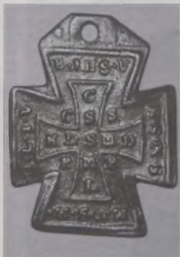
Najciekawszy z nich i bodaj najstarszy krzyż św. Benedykta.