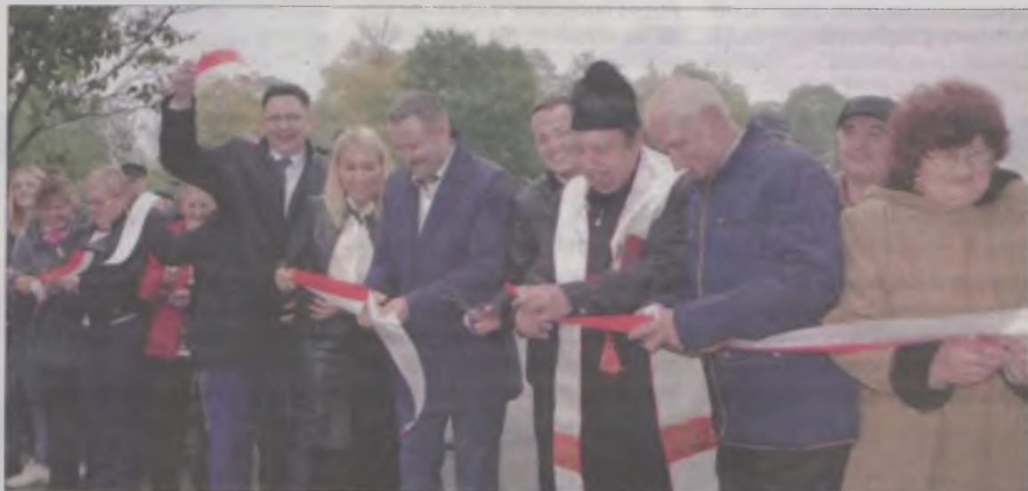
Radość uczestników była jak najbardziej słuszną.

szeroka, bez dziur, z wygodnymi wjazdami. A powiem szczerze, że przecinanie szarfy razem z burmistrzem i gośćmi z Łodzi to był miły gest, że my, mieszkańcy też otwieramy drogę." – relacjonowała mieszkanka Boru.