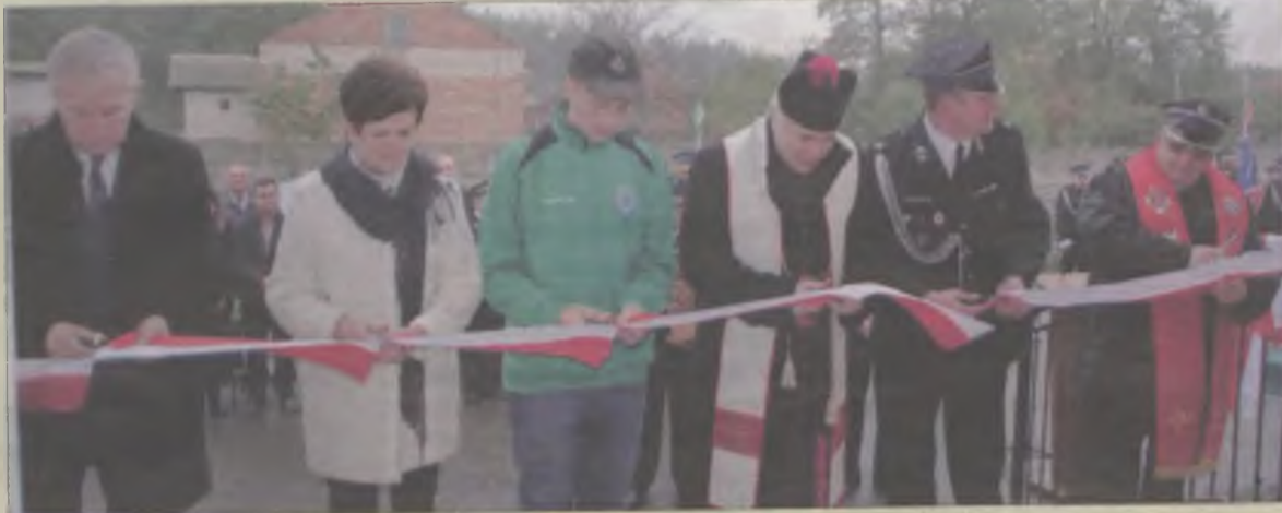
Nie mogło zabraknąć oficjalnego przecięcia wstęgi.

Kolejny etap to już rok 2001. –Wtedy zostały przywiezione niezbędne do budowy materiały, a aktywność społeczna nadal była żywa. Trwały prace przy rozładunku materiałów oraz inne związane z inwestycją. W międzyczasie powstał też pomysł, aby pomiędzy