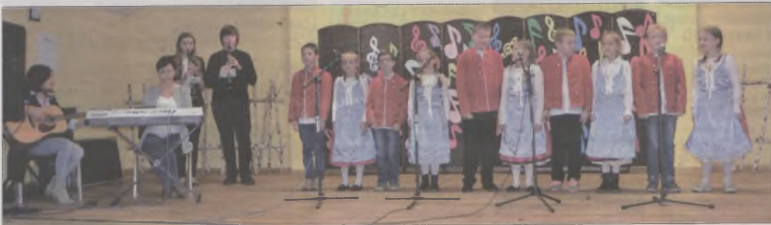
Dobraszy dwa z Dohrejwykonali „Lipkę” i „Jarzębinę czerwoną”.

w muzyce ludowej tkwi siła nie- zwykła. Dlatego warto ocalić od zapomnienia to, co jeszcze istnieje. -Mamy nadzieję, że dzięki festiwalowi zatrzymacie się na chwilę wstuchując się w ludowe pieśni, w których odnaleźć można opowieści naszych przodków – dodały.