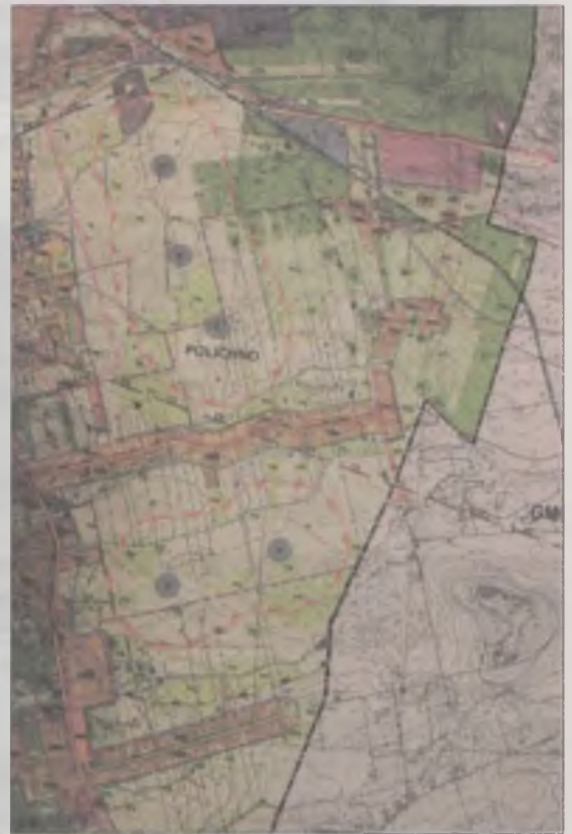
W okolicy Polichna zapisano w studium pięć wiatraków.

Jakie ruchy zostały teraz mieszkańcom Polichna? Do 13 listopada, podobnie jak wszyscy inni władysławowianie, mogą złożyć uwagę do studium. Trafi ona do rozpatrzenia przez wójta. Jeśli uzna on, że jest zasadna i zasłu-