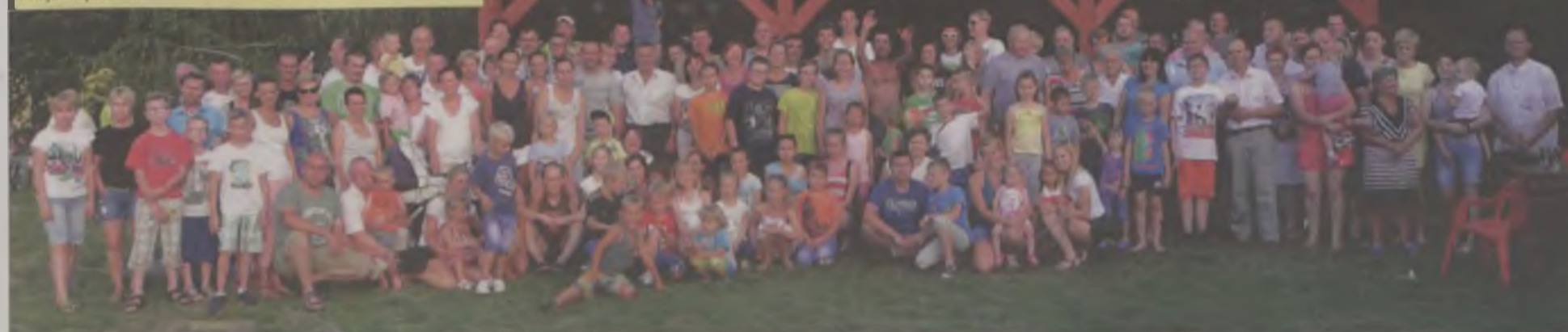
Na tegoroczny piknik w Psarach przybyło ponad 200 osób.