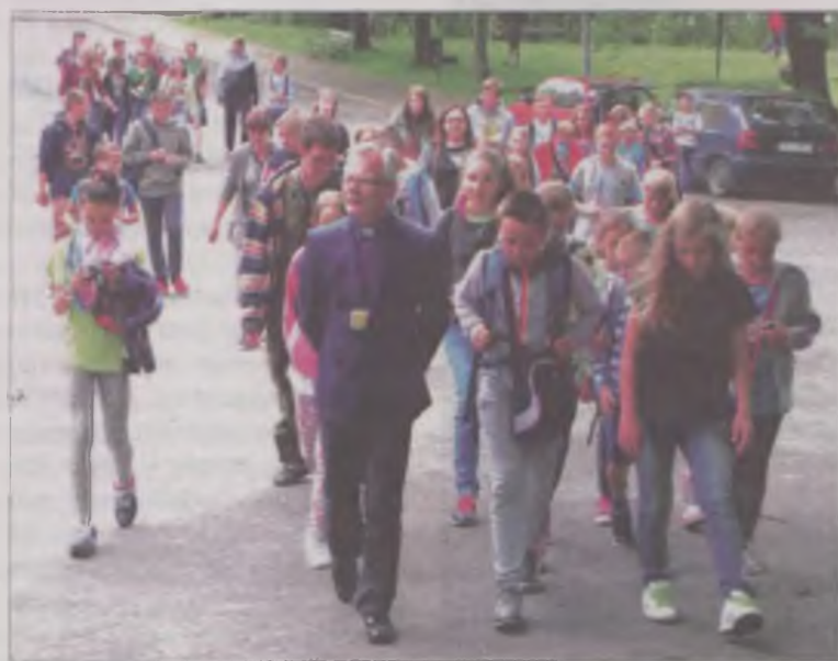
Wzmacnianiu wiary musi towarzyszyć poszerzanie horyzontów - dlatego tak wiele chcieliśmy zwiedzić.