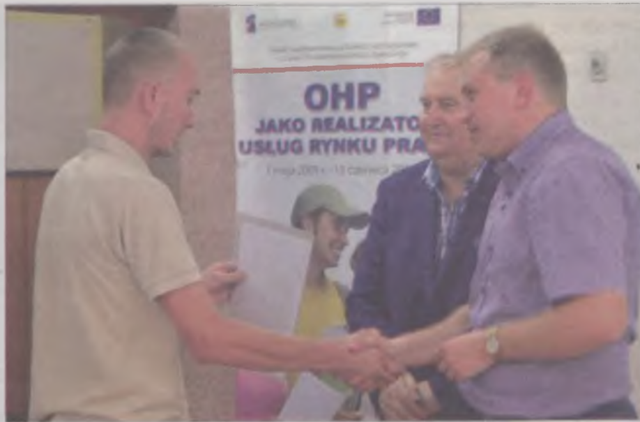
Kilkunastu młodych mieszkańców powiatu podniosło swoje kwalifikacje zawodowe dzięki projektowi realizowanemu przez Ochotnicze Hufce Pracy.

Niebawem ruszy nabór na nowe kursy organizowane pod zapotrzebowanie miejscowego rynku pracy – będzie można zdobyć kwalifikacje w zawodzie kosmetyczki, operatora wózka jezdniowego, spawacza metodą TIG i operatora koparko-ładowarki. Rekrutacja już w sierpniu. ika