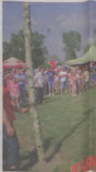
Rzut plackiem do kosza.