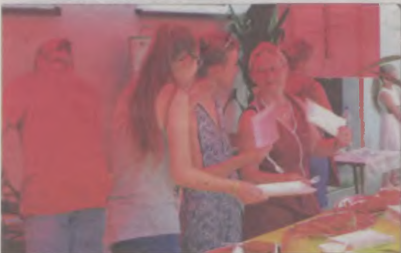
Panie uwijały się jak wukropie, żeby zaspokoić głód smakoszy ziemniaczanych placków.