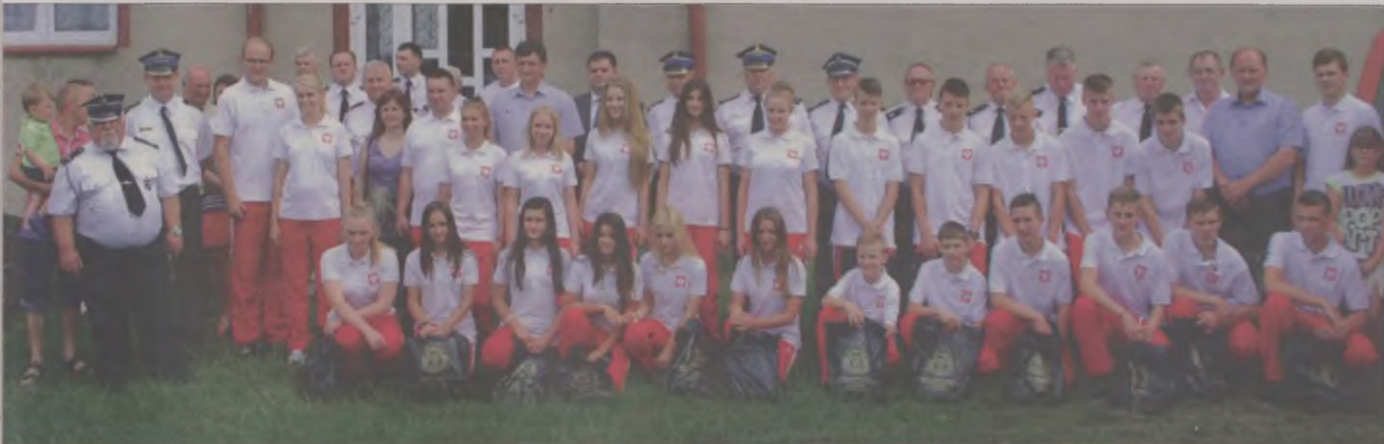
Pamiątkowe zdjęcie uczestników pożegnania.