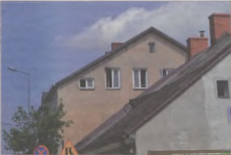
Lokator domu przy ulicy 3 Maja, ponad dwa miesiące temu, będąc pod wpływem alkoholu, postawił garnek na gazie i zasnął. Na szczęście sąsiedzi w porę zareagowali i wezwali strażaków.

Jeżeli sędzia wyda nakaz przymusowego leczenia, być może w kamienicy zapanuje spokój. Jednak kogoś, kto nie chce przestać pić, trudno do tego zmusić i sytuacja niekoniecznie musi się zmienić. Wtedy sąsiedzi będą zmuszeni wnioskować o eksmisję uciążliwego lokatora. it