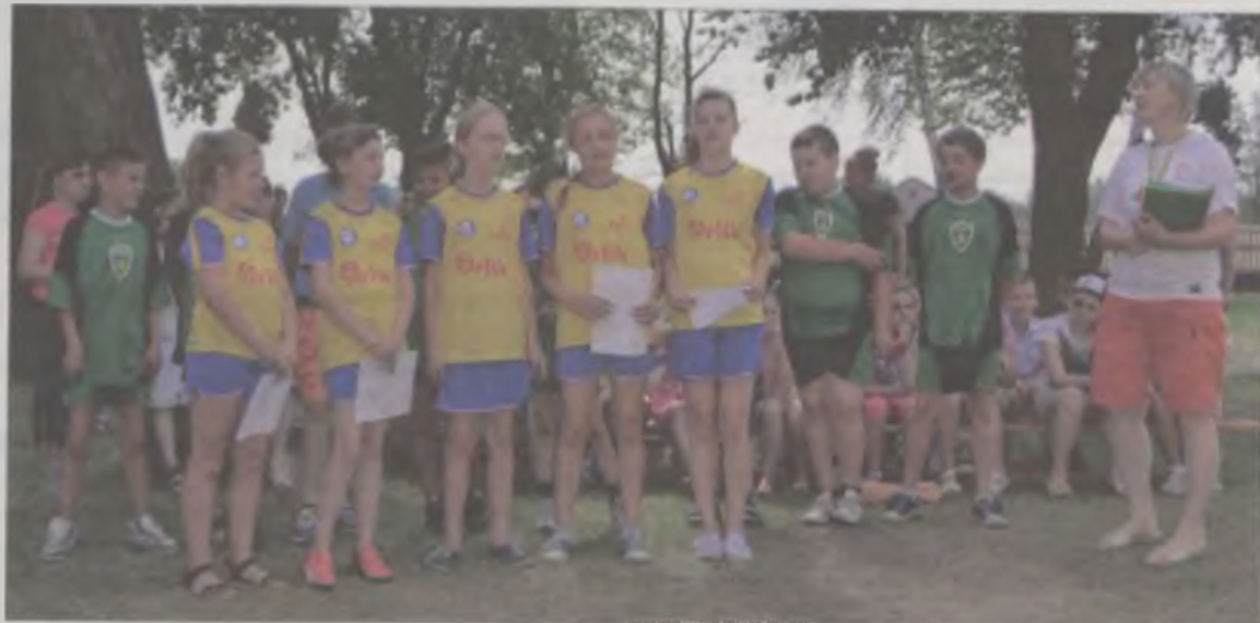
Piłkarze wraz z opiekunką wymyślili własny tekst do znanej Koko Euro Spoko.

Czas spędzali w świetlicy, sali komputerowej, pracowni plastycznej, a także na świeżym powietrzu. Opiekunowie prowadzili zajęcia plastyczne, muzyczne, informatyczne, konkursy, gry i zabawy sportowe. Miłośnicy gry w piłkę chętnie rywalizowali w konkursach spraw-