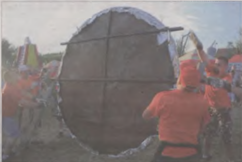
Kulminacyjny moment przewracania wielkiej plinzy.