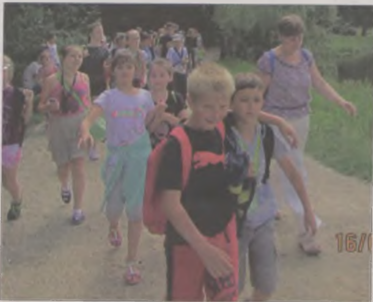
Półkolonie odbywały się po hasłem „Ruch to zdrowie”, więc organizatorzy starali się, by dzieci aktywnie spędzały czas.

nościowych, a także zawodach i rozgrywkach pod hasłem „Mała Olimpiada”. Wybrano też króla strzelców i najlepszego bramkarza.