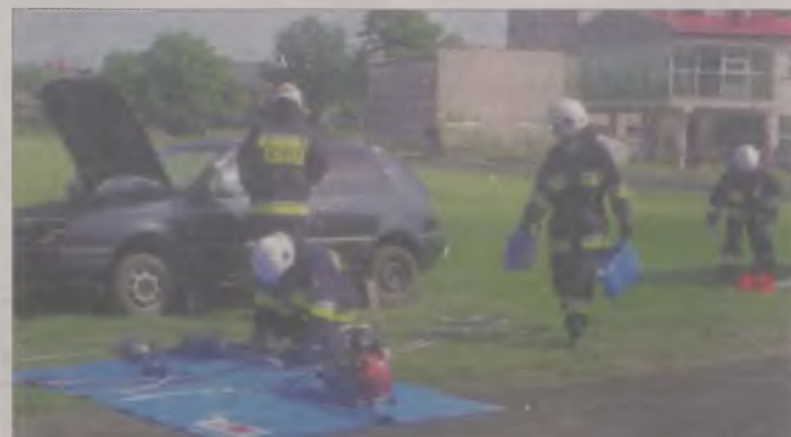
Druhowie z Tuliszkowa przygotowali pokaz ratownictwa drogowego.

W piątek popołudniu uczestnicy obozu doszli do gospodarstwa agroturystycznego w Biczcu, w gminie Lisiec Wielki. Tam czekała na nich praca fizyczna - musieli ciąć drzewo ręczną piłą, bo to, jak wyjaśniali organizatorzy, także zadanie strażaka, przydaje się w trakcie wichur. Kolejne zadanie były z zakresu tematyki przeciwpowodziowej, aczkolwiek dla młodzieży była to nie lada gratka - przejście przez rzekę Powę na zawieszono-