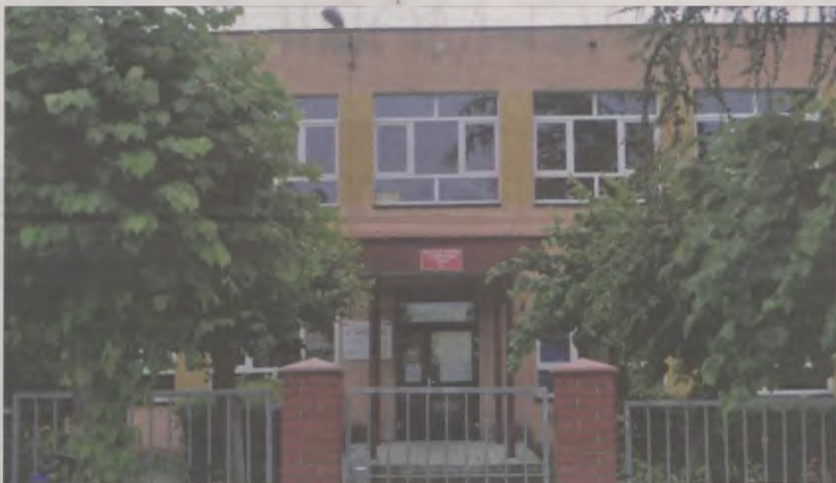
Szkoła Podstawowa w Piekarach – niegdyś samodzielna placówka, dziś mieści się tu już tylko filia podstawówki z Dobrej.