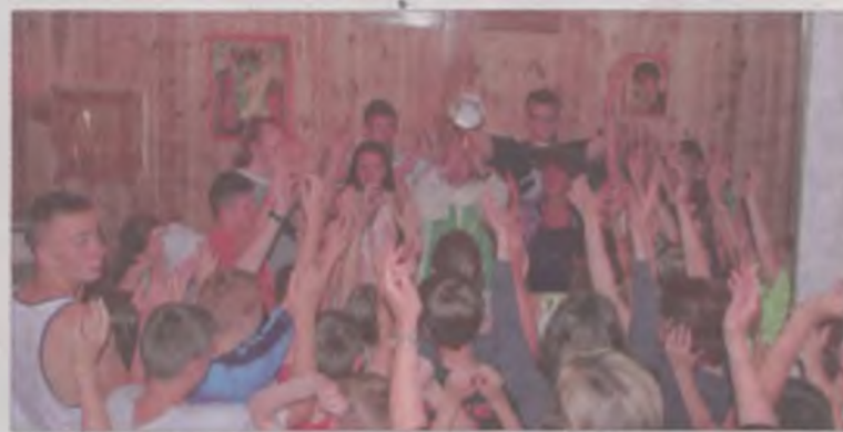
Modlitwa, karaoke w Bila Voda i czeska gorączka złota – czyli wakacje z Chrystusem.