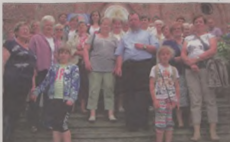
Wierni z Wilamowa przed świątynią w Chelmcach (okolicie Kalisza) - nazywaną przez pielgrzymów „kaliską Częstochową”.