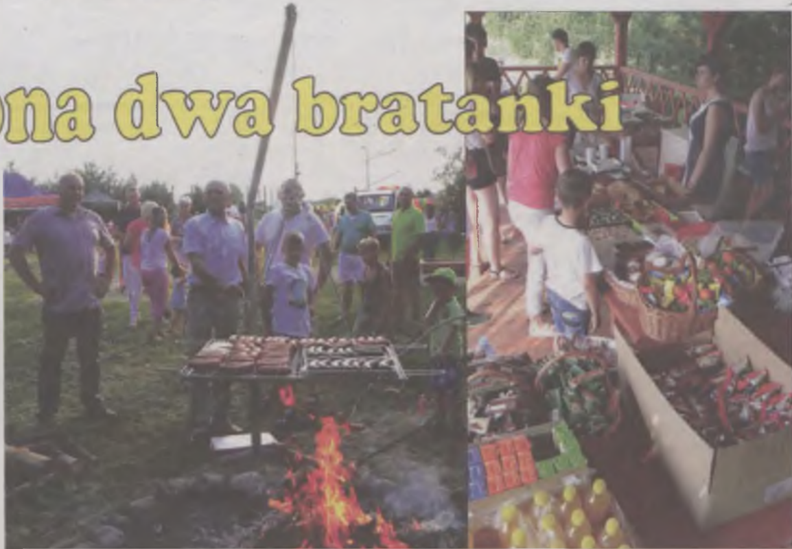
Dzięki sponsorom stoły i grill uginały się od jedzenia. Była zupa gulaszowa, zapiekane ziemniaczki z koperkiem, wiele rodzajów ciast, owoców, słodycze, lody i napoje.

Nie mogło też zabraknąć smacznego jedzenia, przygotowanego przez mieszkanki sołectw. Zaproponowały one poczęstunek w formie wiejskiego stołu. Można było spróbować zupy gulaszowej, zapiekanych ziemniaczków z koperkiem, wędlin, chleba ze smalcem, oraz wiele różnorodnych ciast i owoców. ika