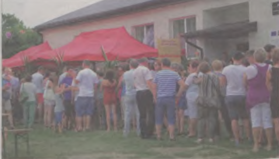
W kolejce po plinzę.