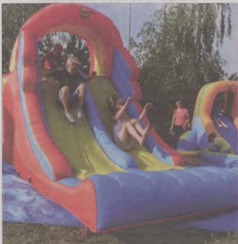
Najmłodsze dzieci wybrały zjeżdżalnię.