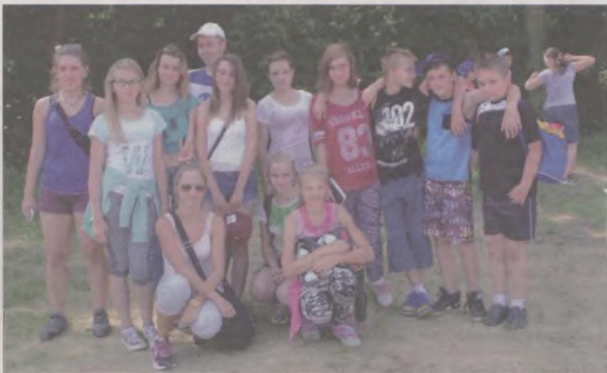
W obozie wzięli udział tuliszkowscy młodzi strażacy.

le czasu. Stały przed nimi zadania i problemy, z którymi musieli się zmierzyć. W obozie wzięło udział kilka młodzieżowych drużyn pożarniczych z terenu gmin: Kramsk, Tuliszków, Stare Miasto, Golina, ale też dalszych jak zaprzyjaźniony Godów czy grupa niemiecka z Mitenwalden. Niestety w tym roku nie dotarli młodzi strażacy z Czech.