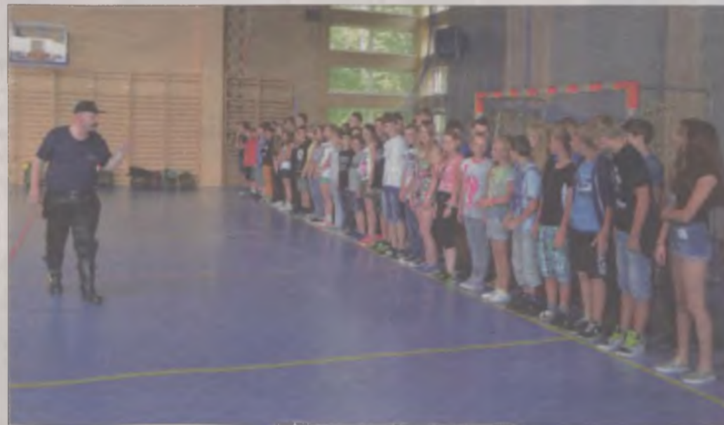
W czwartkowe popołudnie młodzież obozowa przeszła pierwsze szkolenie i zakwaterowała się w Zespole Szkół w Tuliszkowie.

W tym roku, w minione czwartkowe popołudnie wszyscy uczestnicy, w sumie prawie 70 młodych ludzi w wieku od 12 do 16 lat, przybyli do Zespołu Szkół w Tuliszkowie. Obóz trwał do niedzieli, a w sali gimnastycznej spędzili pierwszą noc. Wcześniej jednak ustawili się w dwuszeregu, by odbyć pierwszy apel, wysłuchać regulaminu i zasad. A tych było sporo - cisza nocna o godz. 22.00 i pobudka codziennie o 6.00 - obie przyjęte głośnym buczeniem. Z entuzjazmem wysłuchali natomiast informacji o wieczorze zapoznawczym i dyskotecie. -Czeka was wiele zadań, z którymi na pewno sobie poradzicie, ale choć są wakacje musicie też przestrzegać zasad. Będziecie zwiedzać naszą okolicę, która jest piękna. Zwracajcie uwagę na okoliczności przyrody i pamiętajcie, że każde