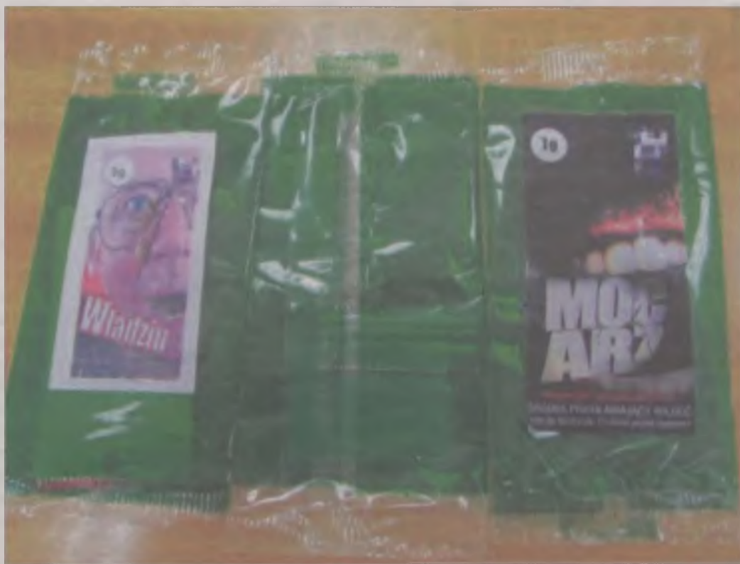
Największe żniwo w całym kraju zebrał dopalacz o nazwie Mocarz. Po jego zażyciu ludzie stawali się agresywni i nieohliczalni, kilka osób straciło życie.

nia związane z dopalaczami, do szpitala trafiło 13-letnie dziecko!). O dziwo w czerwcu przyjęto jedynie „tylko” 3. Lipiec pobija czarny rekord. Niestety dopalacze silnie uzależniają. Mimo tego że najczęstsze objawy zatrucia to silne bóle brzucha, wymioty, utrudnio-