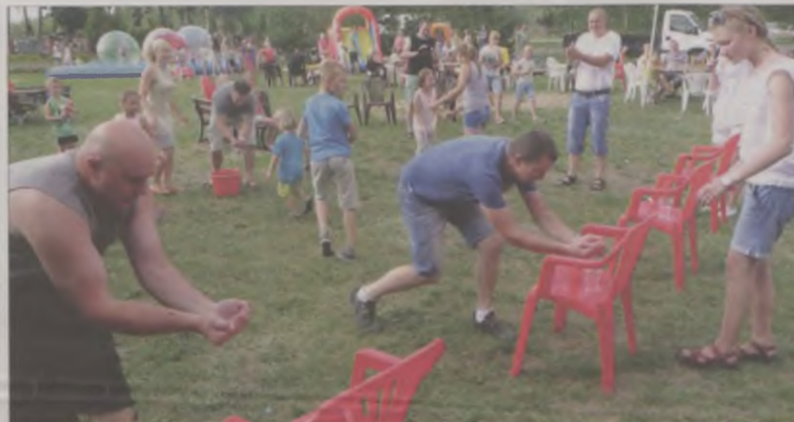
Dla uczestników przygotowano wiele zabaw i konkursów rodzinnych. Rozdano wiele nagród i upominków.