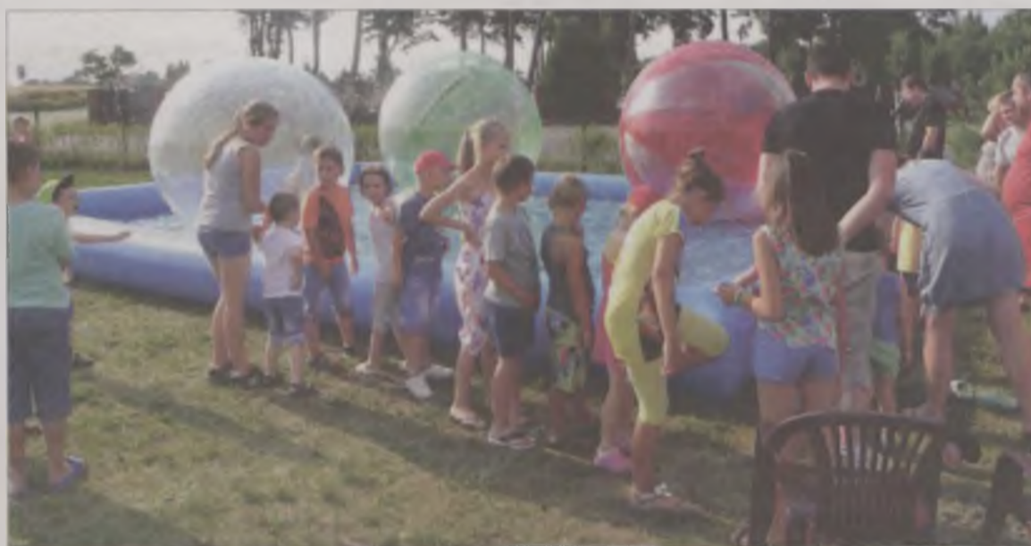
Idealna rozrywka w upalny dzień. Do basenu z piłkami ustawila się kolejka dzieci.