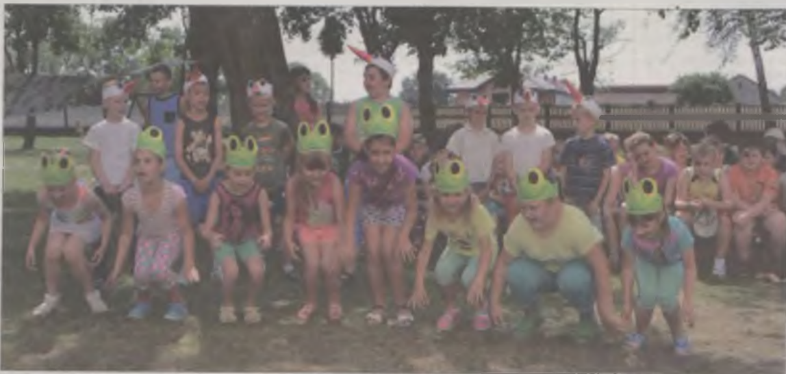
Grupa Żabek zaśpiewała piosenkę „Jesteśmy żaby, aby, aby”.