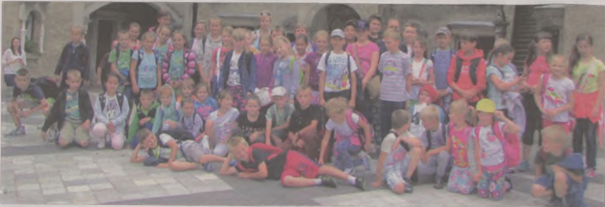
Uczestnicy półkolonii zwiedzali Zamek Czartoryskich w Goluchowie.