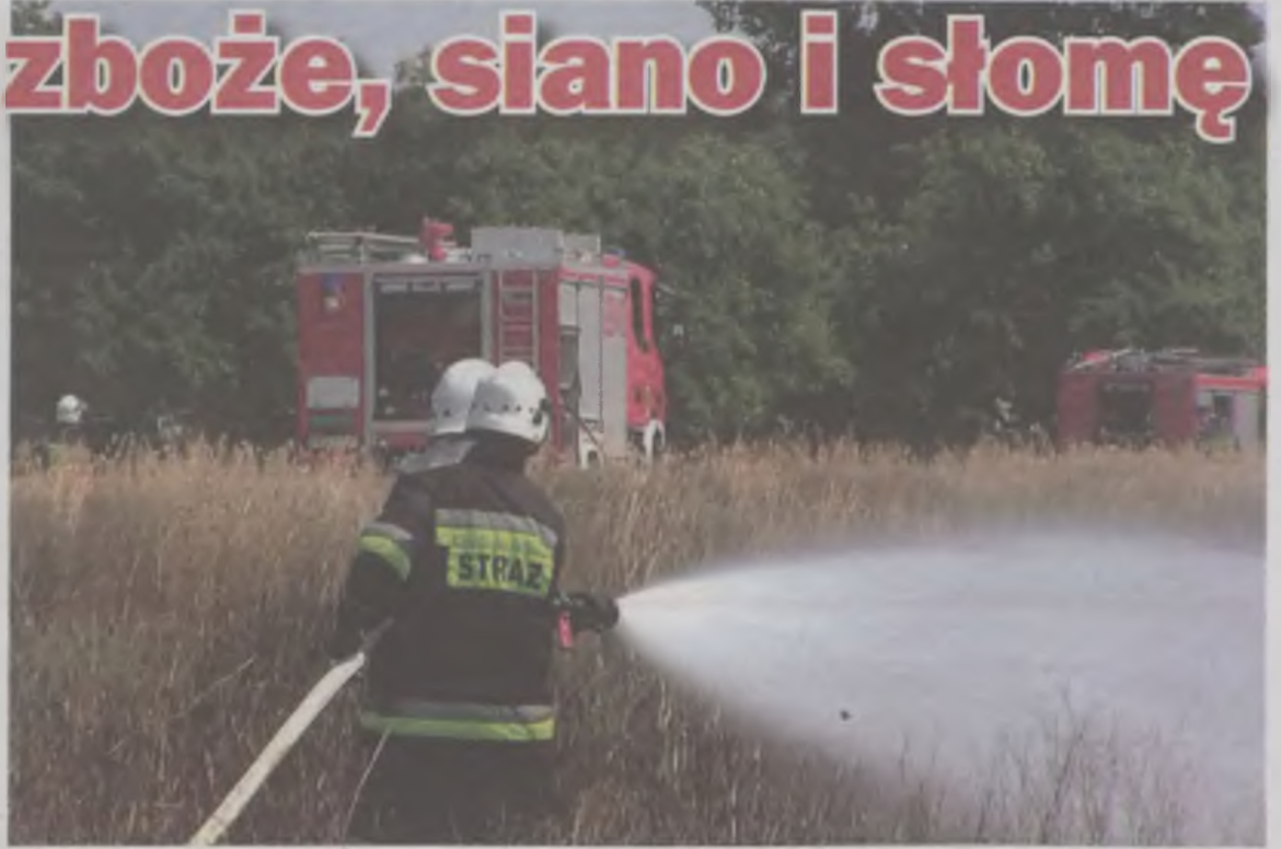
W Targówce spłonęły 32 ary zboża.

Mimo szybkiej akcji gaśniczej budynek spłonął doszczętnie. Budynek w każdej chwili mógł się zawalić, dlatego strażacy go rozebrali. il