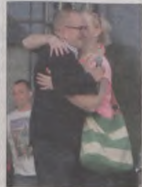
...koniec końców, walka o mikrofon zakończyła się pokojowo.