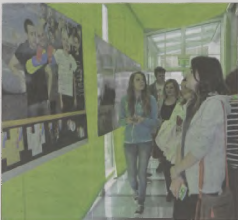
Wystawa jest swoistą prezentacją możliwości, jakie daje utalentowanej młodzieży kolska szkoła plastyczna.

Konkursy zostały przygotowane przez nauczycielki uczące przedmiotów humanistycznych. il