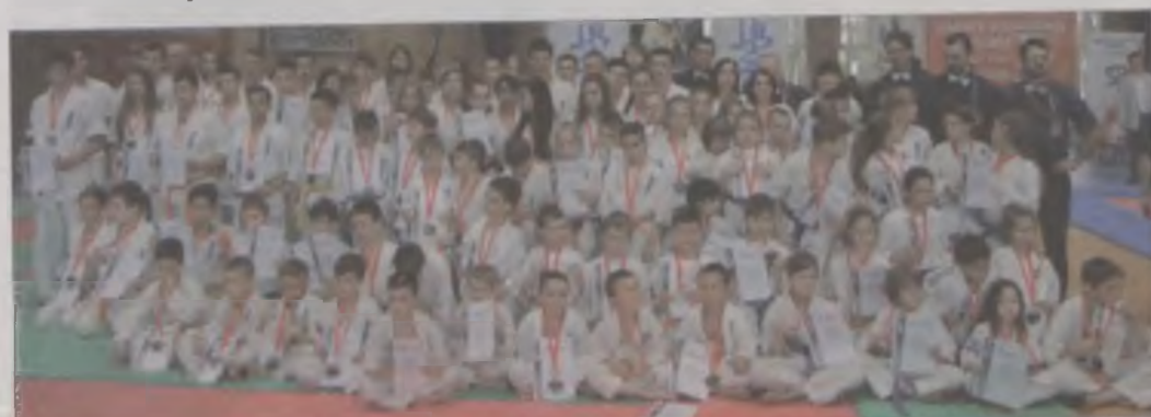
W turnieju uczestniczyło ponad 200 zawodników, najlepszą drużyną okazała się ekipa z Turku.