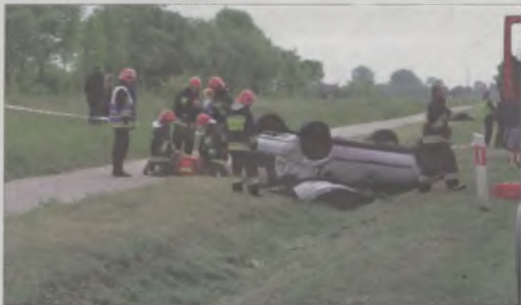
Zanim rannymi w wypadku zajęło się pogotowie, strażacy udzielili im pierwszej pomocy.