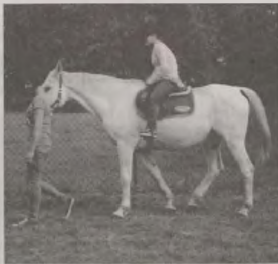
By dosiąść konia trzeba było wystać się w kolejce.