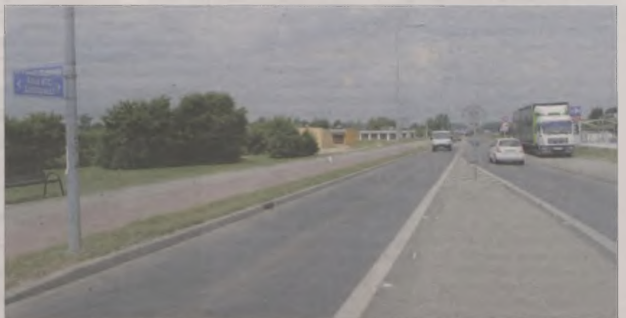
Wykorzystując długie proste na Alei Solidarności piraci drogowi rozpędzają auta dużo ponad dopuszczalną prędkość.

Do tematu wrócimy w kolejnym wydaniu Echa Turku. boxa