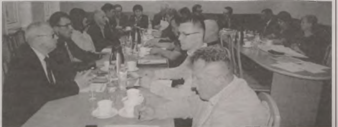
Podczas sesji nadzwyczajnej radni wyrazili chęć zaciągnięcia pożyczki na budowę kanalizacji.

ma być wybudowana w Kolnicy i częściowo w Brudzewie. - „Idziemy” w stronę Marulewa – dodał wójt zapewniając, że w dalszej przyszłości sieć obejmie też Brudzyń, dalszą część Kolnicy, a najlepiej byłoby gdyby cała gmina została skanalizowana. Radni wypowiedzieli się na temat pożyczki pozytywnie, tym samym zgodnie przyjęli propozycję wójta. boxa