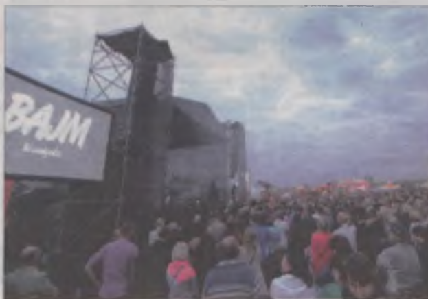
Na chwilę przed występem zespołu Bajm i Beaty Kozidrak - płyta boiska przy Termach pękła w szwach.