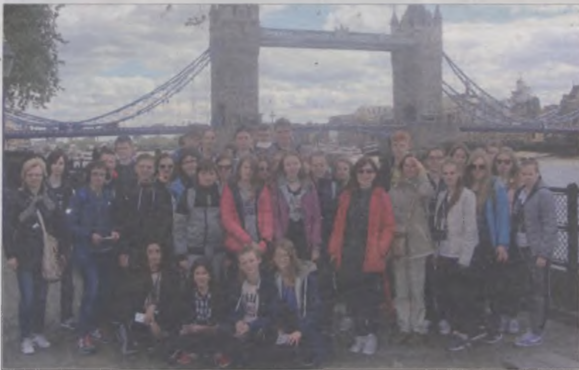
Jedną z atrakcji wycieczki był spacer brzegiem Tamizy.

Uczniowie turkowskiego G2 nie tak dawno powrócili z sześciodniowej wycieczki do Londynu. Oglądali tam zabytki, zwiedzali muzea, spacerowali po uliczkach i skwerach. Musieli też zsiłfować język angielski wypełniając zadania nauczycieli.