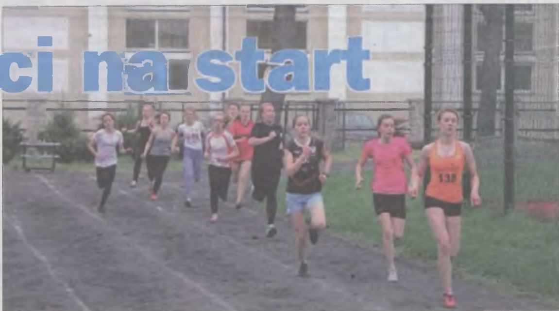
Na bieżni dziewczęta na 600 metrów.