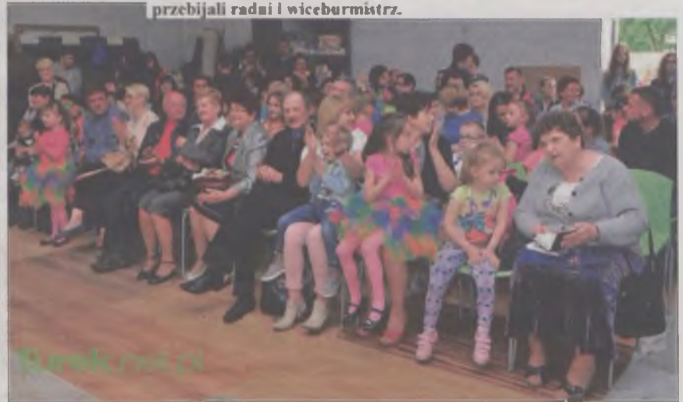
Na koncert do Przystani przyszły tłumy.