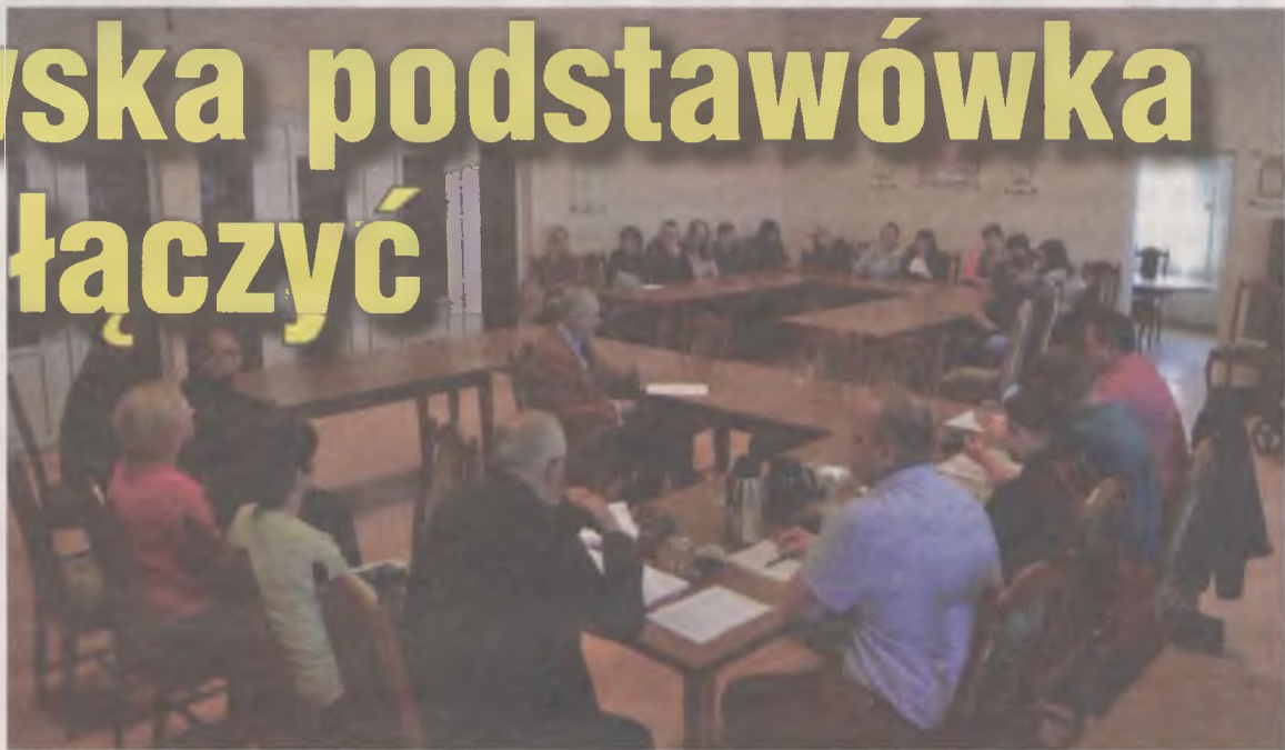
Aby porozmawiać z pomysłodawcami powstania zespołu szkół rodzice przyszli na posiedzenie komisji oświaty. Mieli okazję zapytać „u źródła” dlaczego wójt chce rozpocząć oszczędzanie właśnie od ich dzieci.

Jak sprawy się potoczą okaże się pewnie niebawem. Pewne jest, że na kolejną sesję Rady Gminy Władysławów, we wtorek (26 maja) nie wpłynęła uchwała o tworzeniu zespołu szkół.