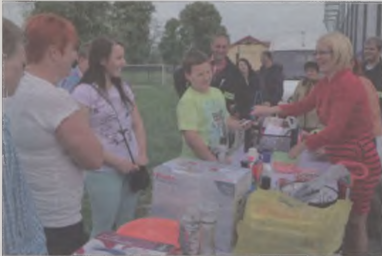
Do stoiska z loterią fantową ustawiła się spora kolejka. Było warto, bo każdy los był wygrany.

były konkursy z nagrodami. I to nie były jakimiś. Dla pań zestawy kuchennych naczyń, dla panów przyrządy do majsterkowania czy grillowania, a dla najmłodszych gry, zabawki czy sprzęt sportowy. Organizatorzy wykazali się dużą pomysłowością podczas