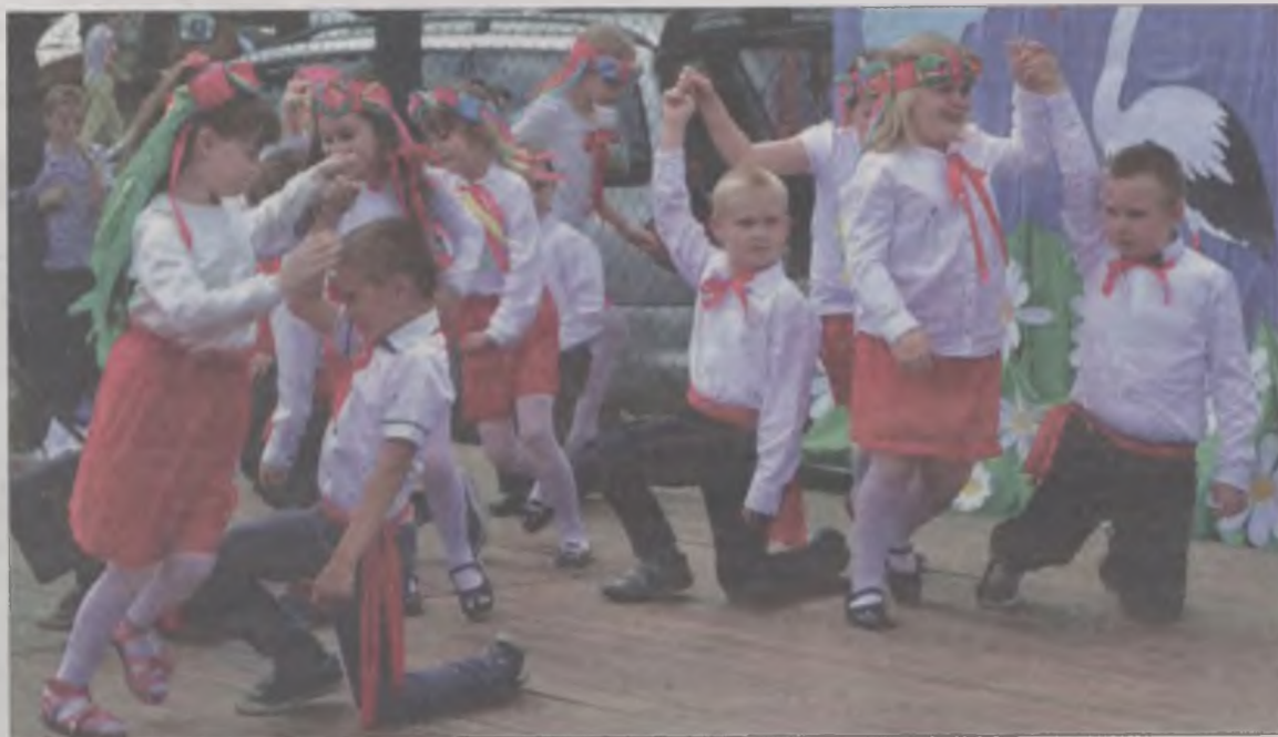
Podczas pikniku swoje wokalne i taneczne umiejętności prezentowali uczniowie ze szkoły podstawowej.