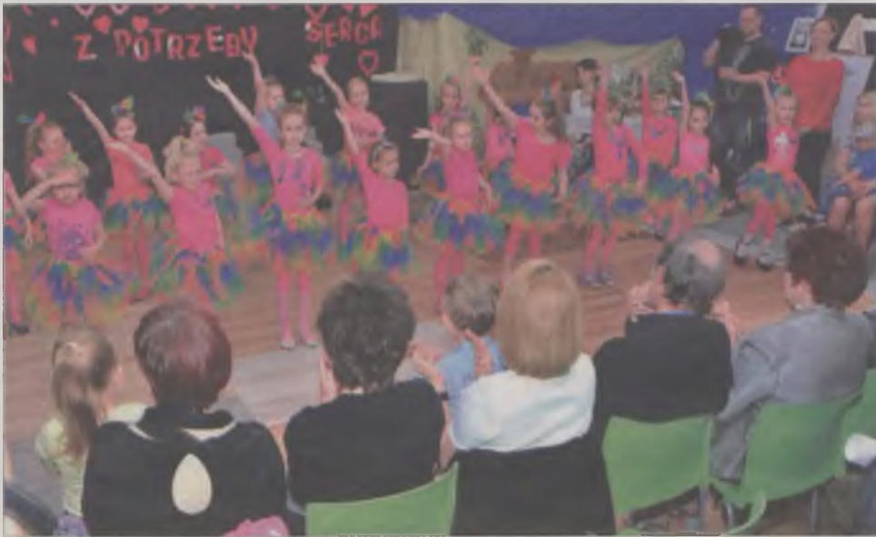
Imprezę dla Ismenki przygotowało stowarzyszenie Przystań, był to dla nich już 10. jubileuszowy koncert charytatywny. Na scenie wystąpiły maluchy z Kuźni Artystycznej.