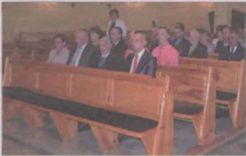
W malanowskim kościele odprawiono mszę świętą, w której uczestniczyła rodzina stulata.

Jak mówią o nim najbliżsi – to wzorowy obywatel, ojciec, dziadek, pradziadek, prapradziadek, dobry i uczynny sąsiad, który nigdy nie umiał odmówić nikomu pomocy. Zawsze bardzo ciężko pracował, a nawet w wolnej chwili zawsze znalazł sobie zajęcie. Jest i zawsze był osobą bardzo religijną, nie