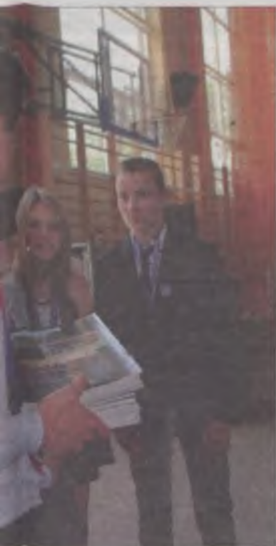
plikację o szkole, przygotowaną na