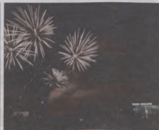
Tradycyjnie, koncert zakończył fenomenalny pokaz fajerwerków.