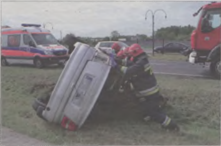
By odłączyć w oplu akumulator, strażacy postawili samochód na koła.

Choć konflikt między małżeństwem z gminy Władysławów trwa już od dawna, to nikt się nie spodziewał, że mężczyzna może być zdolny do ugodzenia żony nożem.