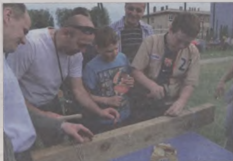
Trudną sztuką okazało się posługiwanie młotkiem. Wygrywał ten, kto mniejszą ilością uderzeń wbil gwóźdź w deskę.