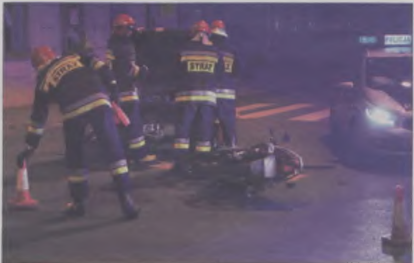
Do wypadku na jednym z turkowskich skrzyżowań doszło w czwartkowy wieczór.