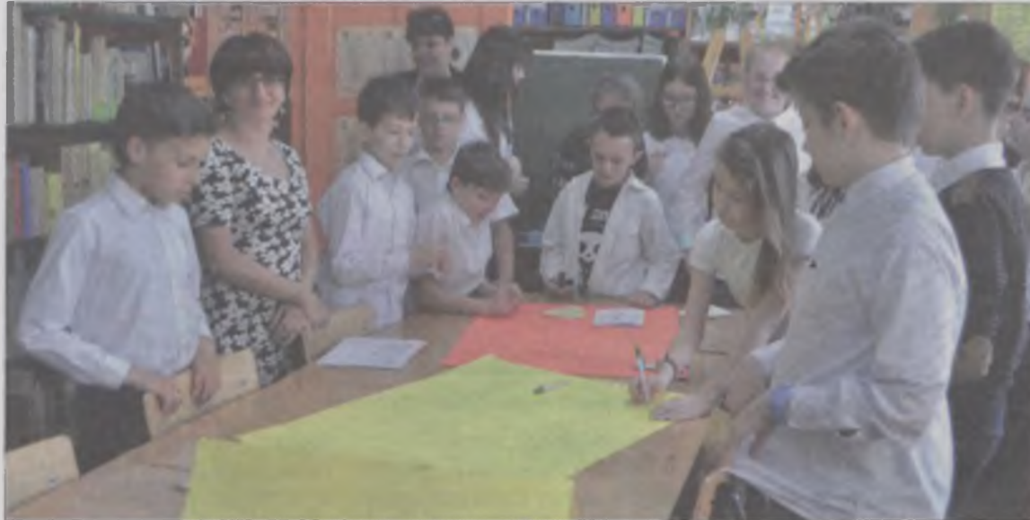
W świąteczny dla biblioteki dzień uczniowie stworzyli laurkę.

W piątek do odwiedzin w bibliotece przyuczano też najmłodszych – mury „jedyńki” odwiedziły dzieciaki z Przedszkola nr 8. boxa