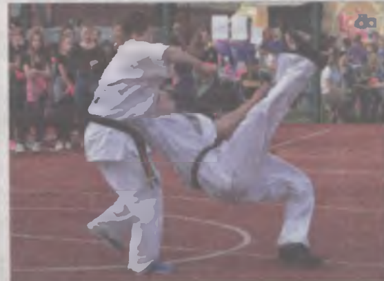
Podczas pikniku we Władysławowie prezentowali się karatecy i judocy z miejscowych klubów.

W organizację pikniku włączyli się nie tylko dzieci, nauczyciele i dyrektor Szkoły Podstawowej we Władysławowie, ale też Rada Rodziców. il