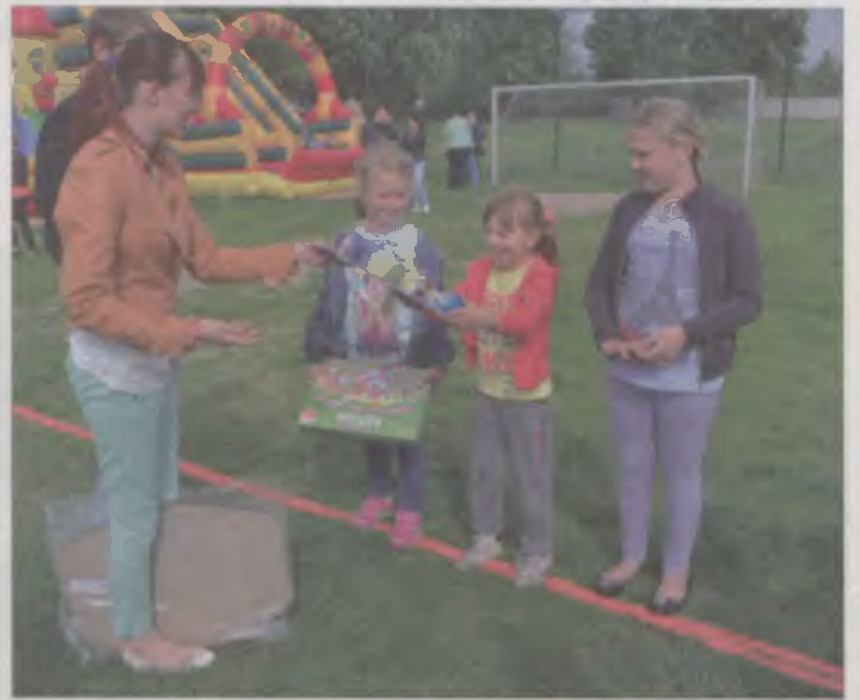
Dla dzieci organizatorzy przygotowali bieg z jajkiem na łyżce.