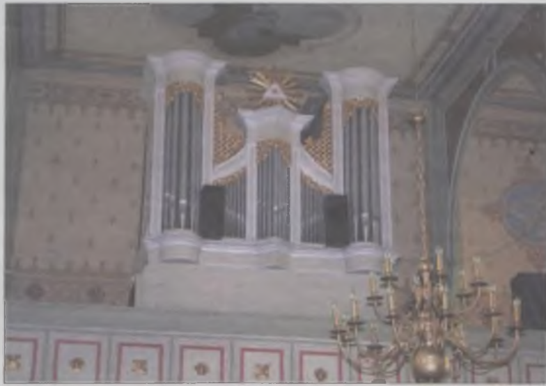
Z tej strony organy prezentują się bardzo dobrze.

Dzień 8 grudnia r. z (roku zeszłego - przyp. red.) na długo pozostał w pamięci parafian wsi Tokary