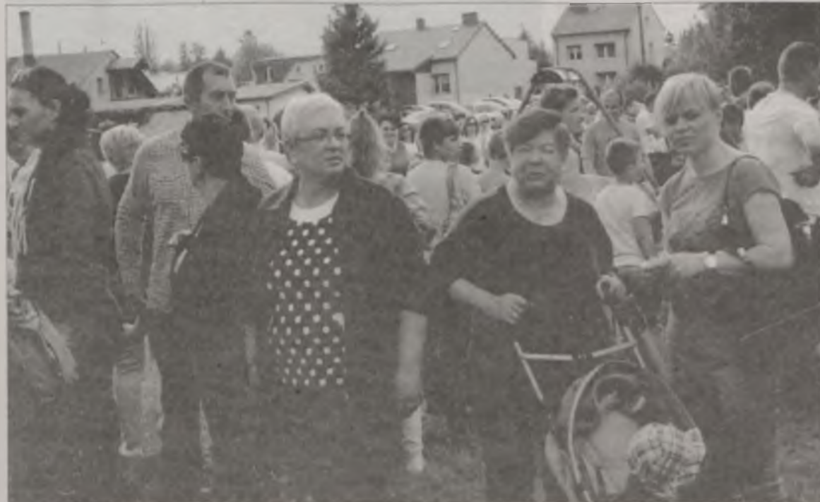
Festyn przyciągnął tłumy.