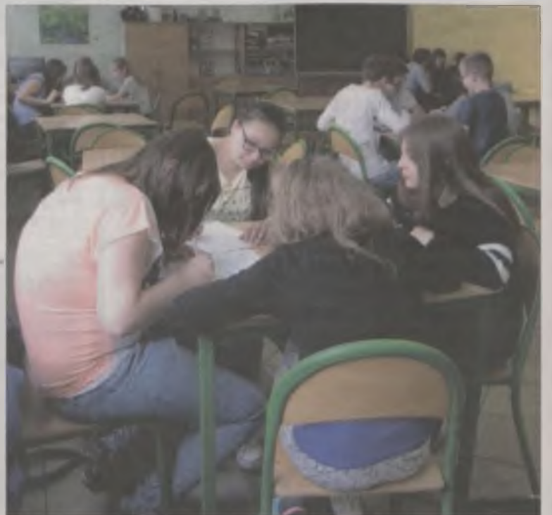
Gimnazjaliści z jedyńki wzięli udział w konkursie o czasach antycznych, a także demokracji.