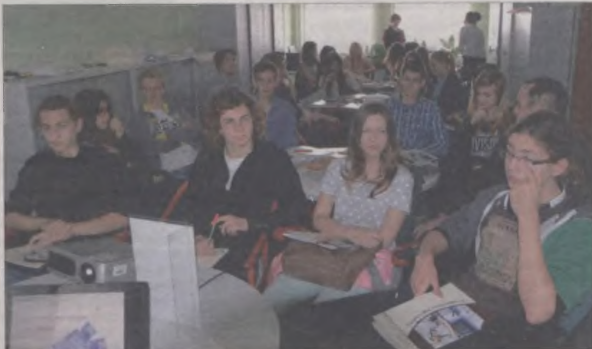
Do udziału w konkursie zorganizowanym przez TIG zgłosiło się trzydzieścioro uczniów. Dlatego warsztaty odbywały się w dwóch grupach. W tych przedpołudniowych uczestniczyli uczniowie z turkowskiego liceum i Zespołu Szkół Rolniczych w Kaczkach Średnich.

na biznes otrzymają statuetki, dyplomy i atrakcyjne nagrody pieniężne. il