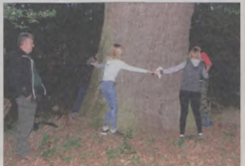
Trzeba było kilku gimnazjalistów, by objąć potężny dąb.