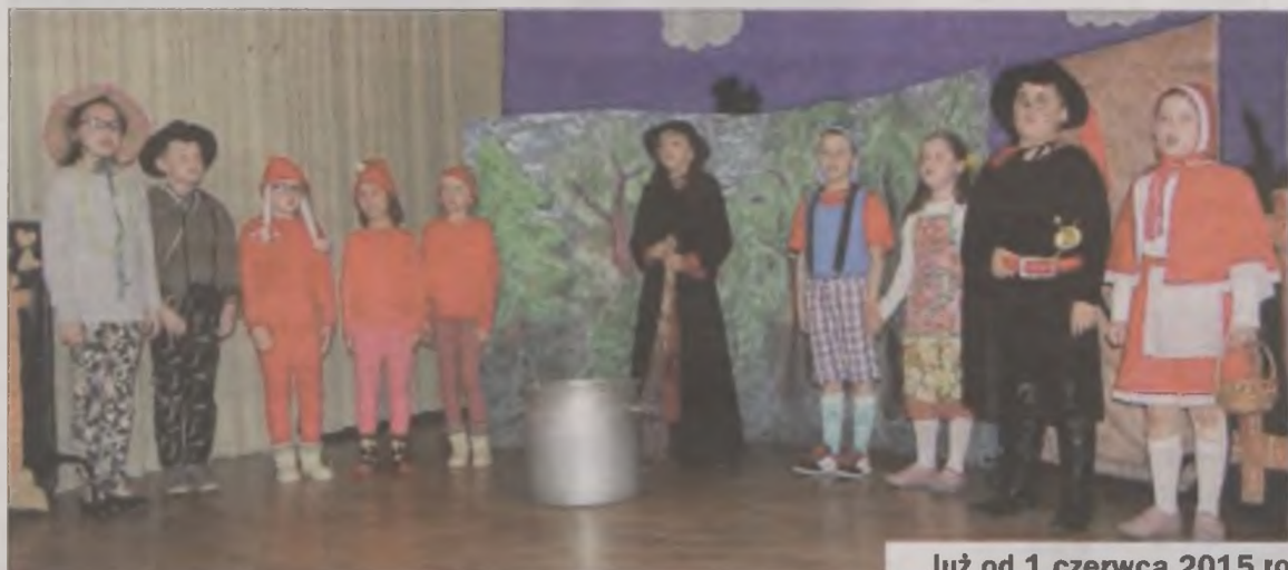
„Ambaras w bajkowym lesie” wystawiła klasa druga „b”.

na - nauczycielka ze Szkoły Podstawowej w Poddębicach, zdecydowała nagrodzić wszystkie zespoły. Uczniowie klasy IIa z podstawówki w Uniejowie, którzy zaprezentowali spektakl „Hej, te nase góry”, przygotowany pod kierunkiem Urszuli Świerczyńskiej, otrzymali pierwszą nagrodę ex aequo z zespołem z Poddębic. Dostali też nagrodę za najciekawsze kostiumy sceniczne. Grupa uczniów z klas Ic i IIIa wystawiła spektakl „Ploteczki” przygotowany przez panię Joannę Wicherkiewicz i Dorotę Bamberską. Oni wraz