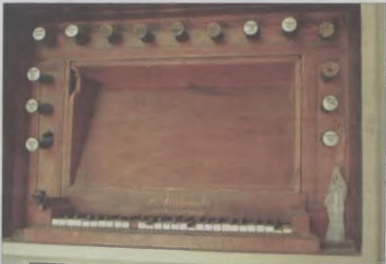
Klawiatura i pozostałe elementy drewniane są w znacznym stopniu zniszczone.