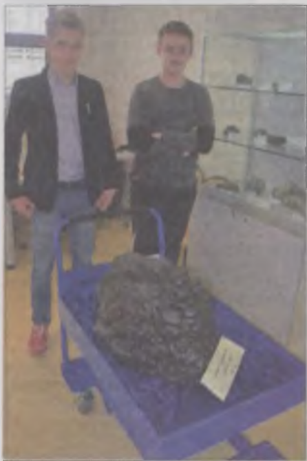
Przy meteorycie w Muzeum Ziemi.

park Morasko - projekt na rzecz społeczeństwa, regionu, i nauki” oraz „Śladami pacyficznego wypraw Jamesa Cooka”. Zwiedzi też wraz z opiekunami Muzeum Ziemi. Największą atrakcją był duży meteoryt oraz zgromadzone w lapidarium okazy skał. (art)