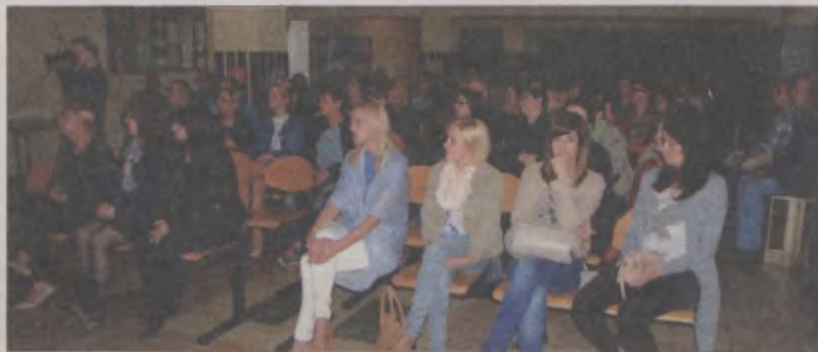
Rodzice uczniów Szkoły Podstawowej we Władysławowie nie godzą się na połączenie z gimnazjum. Zorganizowali już kilka spotkań, by wyrazić swój sprzeciw.