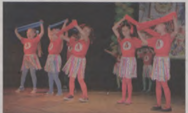
Podczas przeglądu zaprezentowały się maluchy ze wszystkich turkowskich placówek.