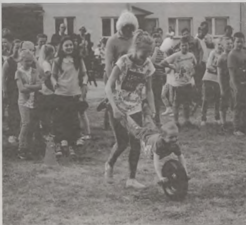
Dla dzieci przygotowano konkursy sportowo-rekreacyjne z nagrodami.

Przygotowano też wiele zabaw i konkursów sportowo-rekreacyjnych dla dzieci i ich rodziców. Nagrodą były między innymi piz-