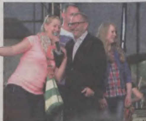
...ale nie spodziewał się, że ktoś będzie chciał przejąć rolę konferansjera...