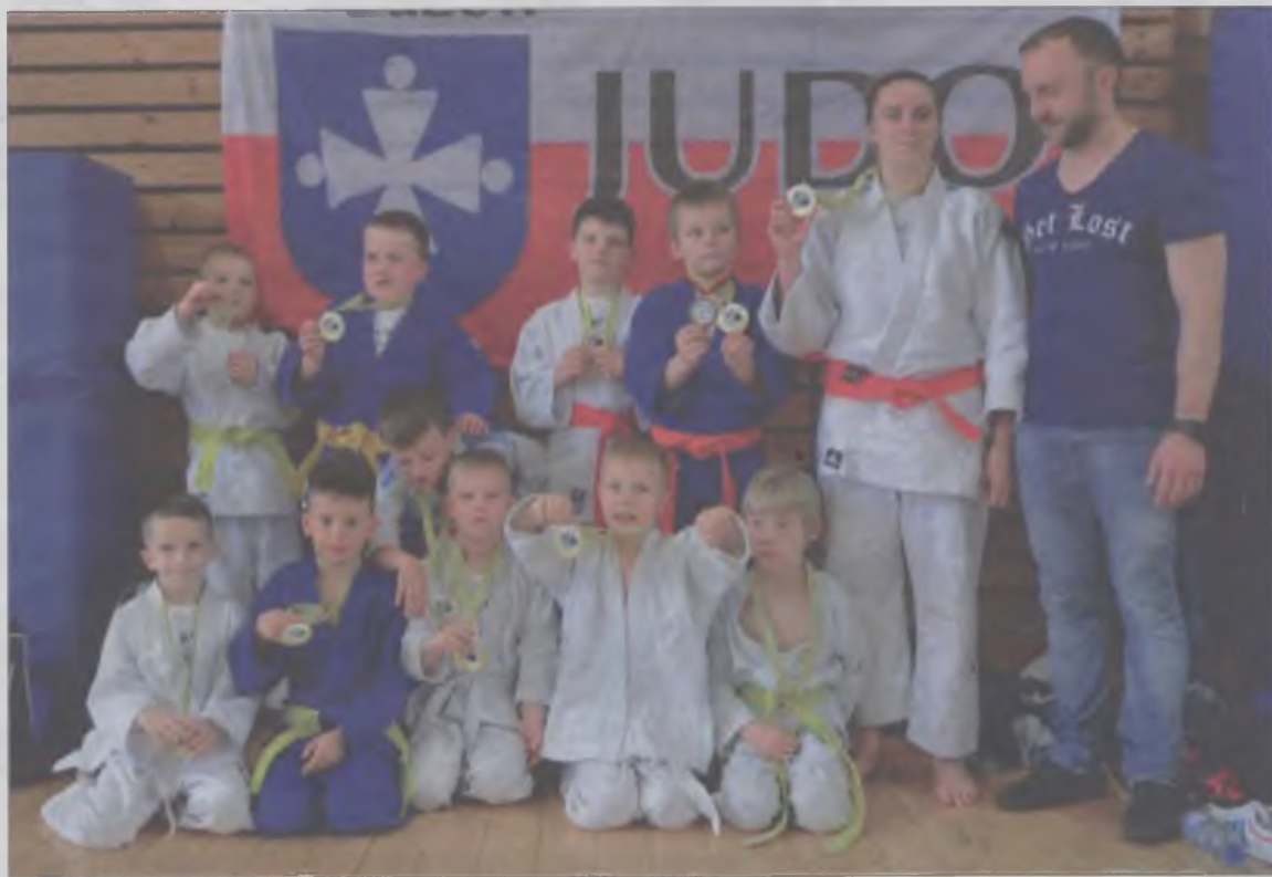
Medaliści berlińskiego Tegel Cup z powiatu tureckiego.