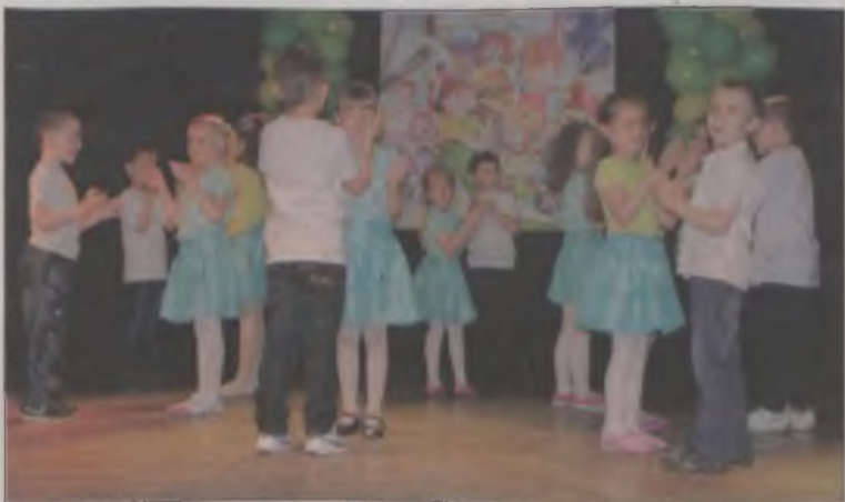
Każda z grup specjalnie na tę okazję przygotowała zestaw piosenek i tańców.