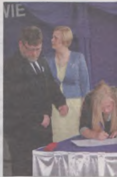
Składanie podpisów pod aktem nadania imienia.