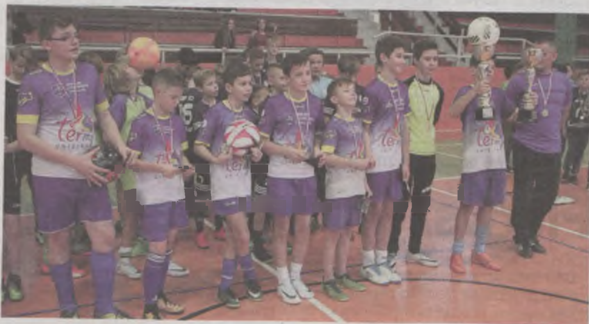
Zwycięzcy Turnieju Niepodległościowego, czyli termalna reprezentacja Uniejowa.

W poniedziałek 13 listopada, w hali sportowej Szkoły Podstawowej nr 10 w Sieradzu, po raz piąty rozegrano turniej piłkarski z okazji rocznicy odzyskania przez Polskę niepodległości. Tym razem do rywalizacji stanęło 12 ośmioosobowych drużyn, m.in. z Łodzi, Uniejowa, Kalisza, Warty, Burzenina, Łubnic, Sieradza. Wygrała reprezentacja Szkoły Podstawowej z Uniejowa, zaraz za nią znalazła się drużyna Gospodarzy, zaś trzecim miejscem na pudle zestawienie najlepszych