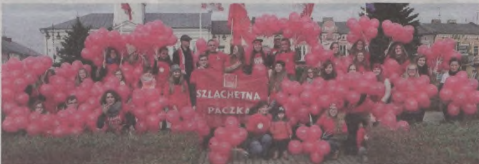
Jak co roku finał happeningu odbył się w turkowskim rynku.

W tym roku w bazie zarejestrowano zostały 53 rodziny z Turku i okolic. Jednak wolontariusze Paczki do projektu włączyli 37 rodzin. –Zachęcamy wszystkich do przyłączenia się do akcji, tym bardziej, że nic nie sprawia tyle radości, jak uszczęśliwienie drugiego człowieka – przekonywali do udziału w szlachetnej inicjatywie wolontariusze. To proste. Wystarczy wejść na stronę www.szlachetnapaczka.pl . Tam można wybrać rodzinę, klikając na ikonę „wybierz rodzinę”. Wystarczy poszukać województwa wielko-