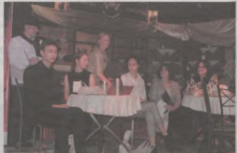
Podczas finału poetyckich konkursów publiczność miała okazję obejrzeć premierowy spektakl, będący efektem warsztatów prowadzonych przez Bożenę Remelską, aktorkę kaliskiego teatru.

Artystyczna jakość spektaklu tak bardzo podniosła