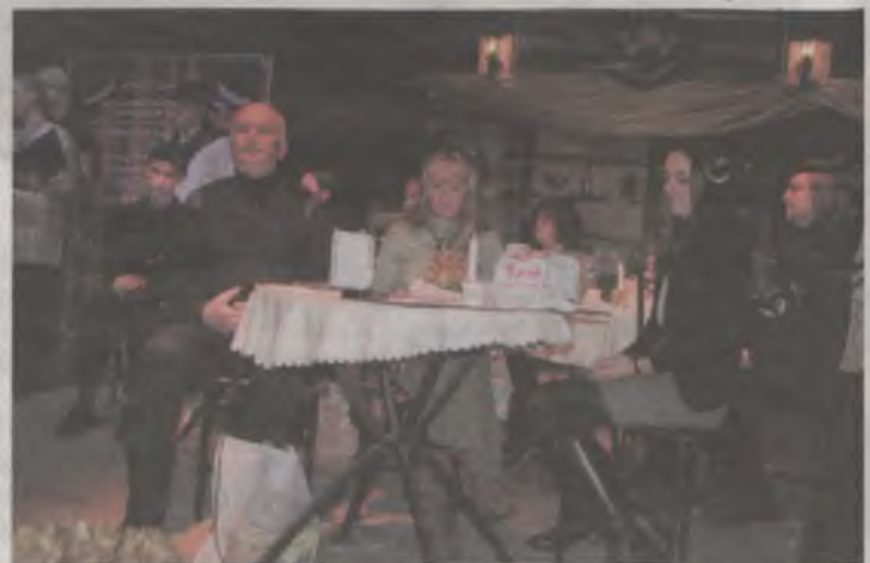
Laureaci poetyckich konkursów.