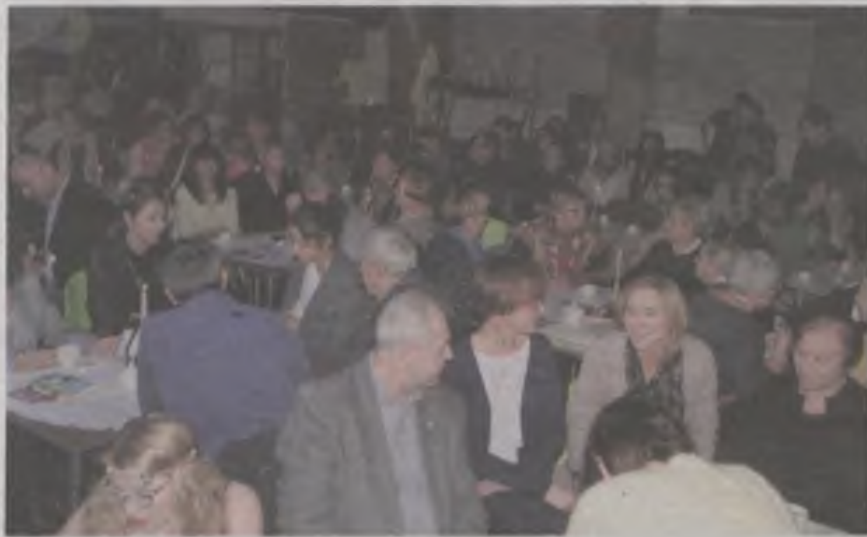
Poetyckie spotkanie w Przystani przyciągnęło sporą grupę odbiorców.

Turkowski Uniwersytet Trzeciego Wieku zarejestrowany