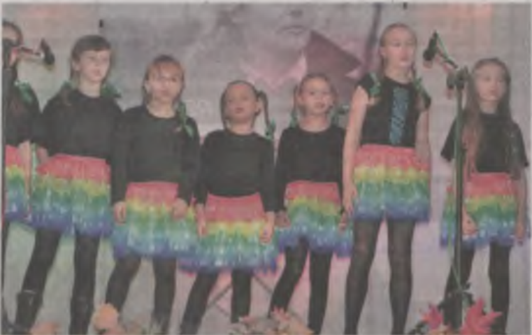
Kokardki wykonały dziecięcą piosenkę, do której słowa napisała Agnieszka Osiecka.

Organizacja koncertu i powiązanych z nią warsztatów odbyła się w ramach projektu autorstwa Centrum Kultury i Biblioteki Publicznej w Malanowie pt. „Muzyczne pejzaże z Agnieszką Osiecką” dofinansowanego ze środków Narodowego Centrum Kultury. (art)