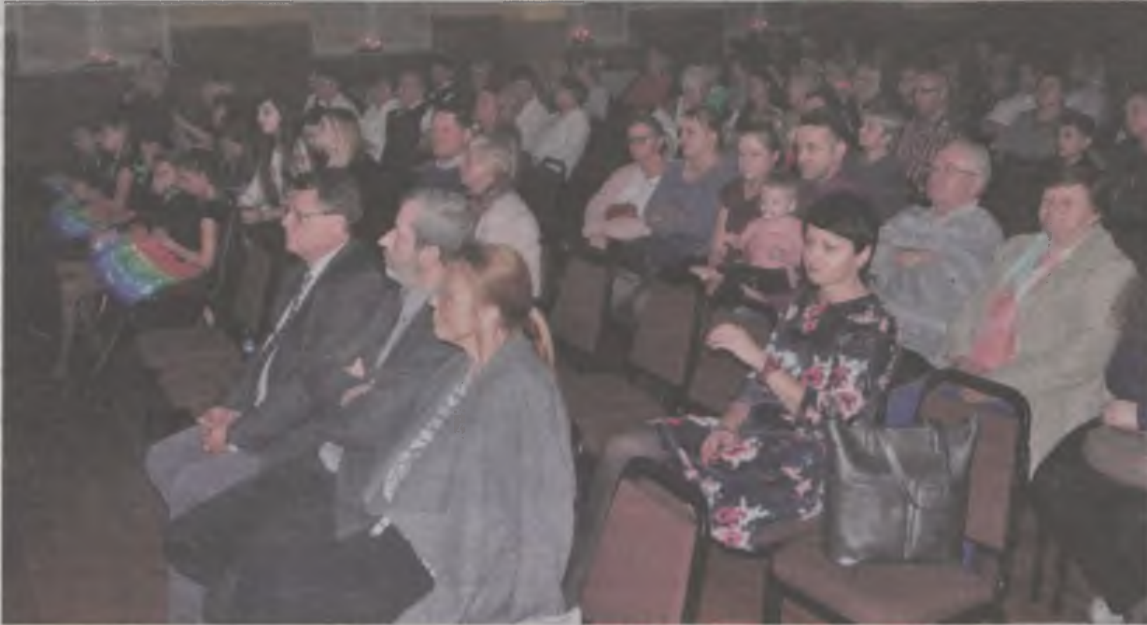
Widzowie, a wśród nich wójt i przewodniczący Rady Gminy, byli zachwyceni klimatem koncertu.