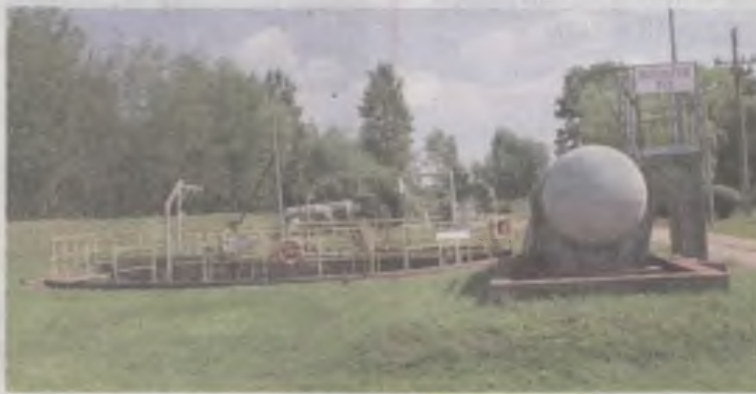
Dobrska oczyszczalnia w oczekiwaniu na modernizację.

Zapytaliśmy kierownika Świętochowskiego w jaki sposób będą oczyszczane ścieki w trakcie robót prowadzonych na dobrskiej oczyszczalni? Odpowiedział: -Dotychczasowy ciąg technologiczny oparty