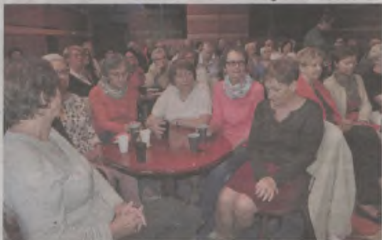
Na spotkanie przybyło ponad 60 osób, co świadczy o dużym zainteresowaniu powstaniem TUTW.