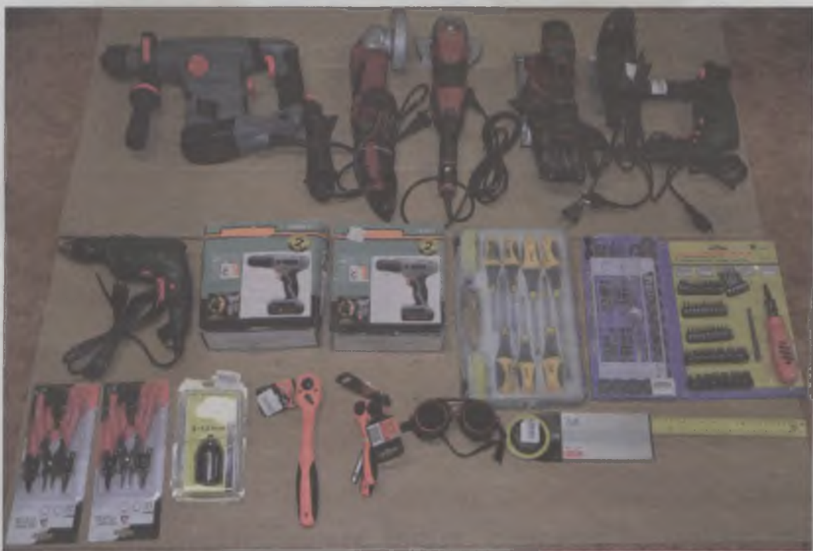
Policjantom udało się odzyskać część sprzętu skradzionego w sklepie.