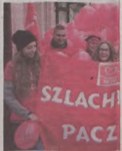
W tegorocznej edycji Szlachetnej Pa