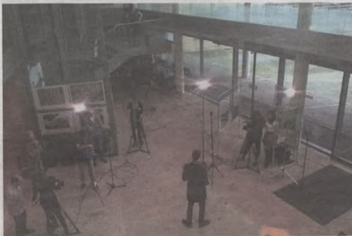
Tym razem studencka przygoda zawiodła turkowskich licealistów do telewizyjnego studia.