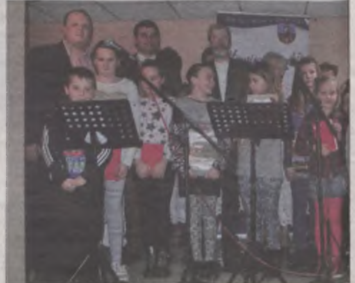
Dzieci uczestniczące w konkursie plastycznym otrzymały nagrodę.