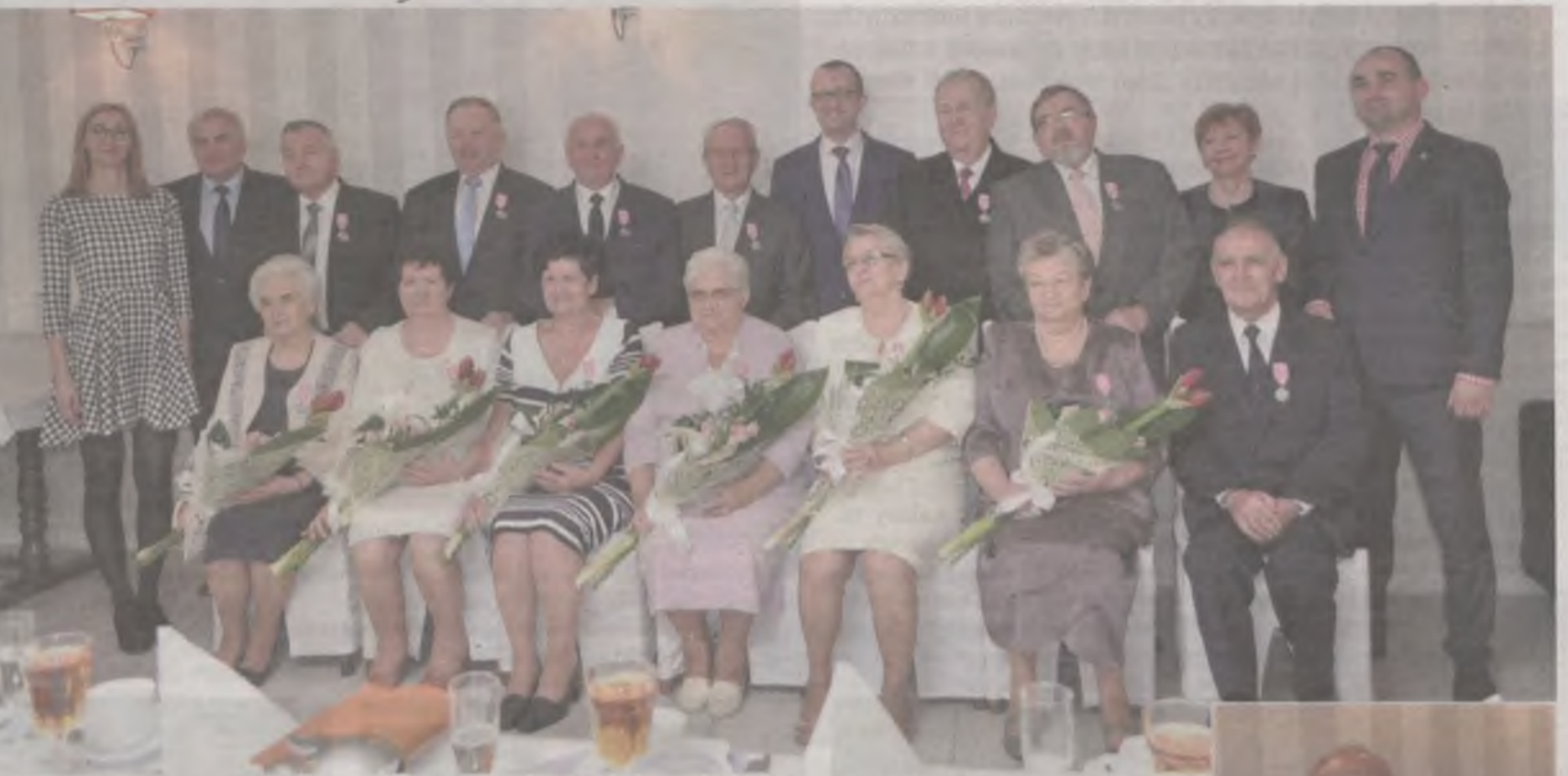
Siedem par z miasta i gminy świętuje w tym roku jubileusz półwiecza razem.

„W seniorach drzemią duże pokłady wiedzy, ogromne doświadczenie, a przede wszystkim olbrzymia chęć dzielenia się tym wszystkim z młodszym pokoleniem. Są wśród nas ludzie, którzy odeszli na zasłużoną emeryturę, nie są już więc czynni zawodowo, ale nadal chcą być użyteczni i jak najdłużej aktywni społecznie. Tak, jak każdy człowiek, chcą być dostrzegani i potrzebni nie tylko w swoich rodzinach, ale także i w szerszym wymiarze społecznym. Nadal czują się młodo, chcą zdobywać nową wiedzę, nowe umiejętności, rozwijać swoje pasje, podróżować w nieznaną, nawiązywać nowe kontakty i poznawać ciekawych ludzi. Chcą zwiększać swoje kompetencje, odkrywać talenty uczestnicząc w różnych formach aktywności” – przekonują w liście nadesłanym do redakcji członkowie Stowarzyszenia. Zachęcają jednocześnie do aktywnego uczestnictwa w inicjatywie, dodając: „Na naukę nigdy nie jest za późno, to wie doskonale każdy z nas. Przecież „ludzie nie dlatego przestają się bawić, że się starzeją, ale starzeją się, bo przestają się bawić” – przytaczają słowa Beniamina Franklina, ojca założyciela amerykańskiej demokracji.