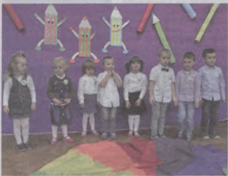
Maluchy musiały udowodnić swoją przydatność do przedszkolnej braci.