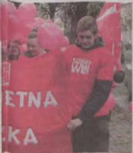
Paczkę bierze udział 14 wolontariuszy.