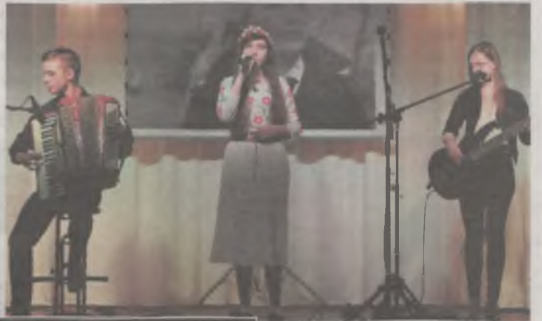
Zespół Akord zaśpiewał piosenki Maryli Rodowicz i Czerwonych Gitar.