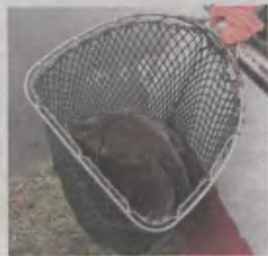
Tym razem w zbiorniku przy Dobrskiej pływać będzie przede wszystkim leszcz.

Oczekiwana, konieczna inwestycja, jaka rozpoczęła się ubiegłą wiosną, oprócz pożytków, z których mogą się cieszyć mieszkańcy, przyniosła