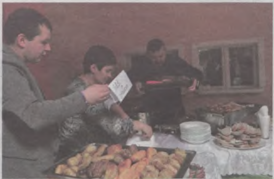
Kucharskie umiejętności gospodyń z Bibianny cieszą się wielkim uznaniem w powiecie.