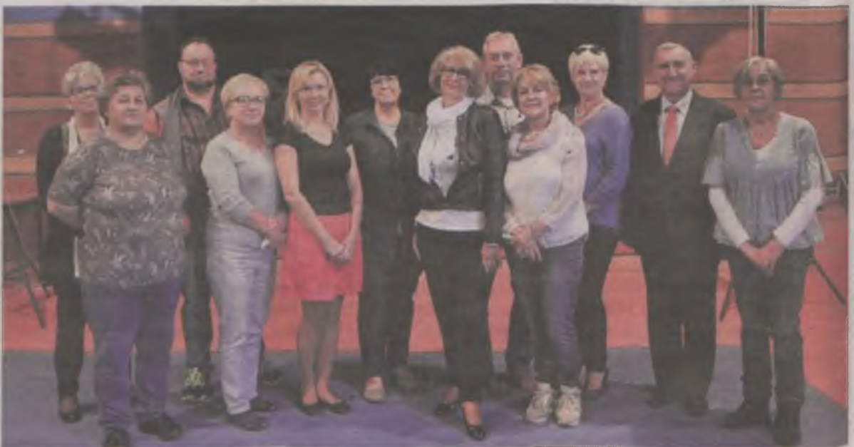
Zarząd TUTW zaprasza wszystkich ludzi „50plus” do uczestnictwa w tej inicjatywie.