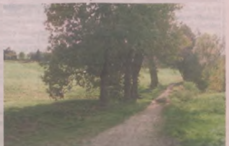
Tu na razie jest piaszczysto, ale będzie asfaltobetonowo.

Plac budowy został natychmiast przekazany turkowskiemu przedsiębiorstwu, które z zadaniem ma się uporać do 10 grudnia tego roku. Być może prace zakończą się wcześniej, by św. Mikołaj mógł ze ścieżki skorzystać w dniu 6 grudnia. (art)