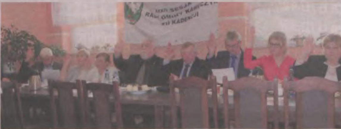
Radni jednogłośnie uchwalili nowe stawki podatków.

Najważniejszym punktem obrad było uchwalenie przyszłorocznych stawek podatków. Poinformowano, że po długiej dyskusji na komisjach Rady, zdecydowano utrzymać stawki podatków od środków transportu na dotychczasowym poziomie. Podobnie z ceną kwintala żyta niezbędna do naliczenia podatku rolnego - 47 zł. Jest ona nadal o ponad pięć złotych niższa od ceny ogłoszonej przez prezesa Głównego Urzędu Statystycznego. Również stawki podatków od nieruchomości w większości pozostawiono bez zmian. Podniesiono jedynie o dziewięć groszy podatek od o gruntów pod zbiornikami wodnymi (stawy) oraz od powierzchni budynków związanych z działalnością leczniczą. Lekarze, pielęgniarki itp. zapłacą 9 groszy więcej za każdy metr użytkowanej powierzchni. (art)