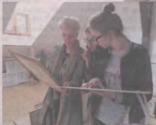
Takie intymne spotkanie z dziełem było niezwykłym przeżyciem dla licealistów.

Druga część naszego wyjazdu do Konina, to zwiedzanie Muzeum Okręgowego w Gosławicach. Składa się ono z kilku obiektów. Zwiedziliśmy szlachecki dwór wzniesiony na początku XIX wieku. Piękny, murewany, piętrowy budynek posiadający od frontu ganek wsparty na drewnia-