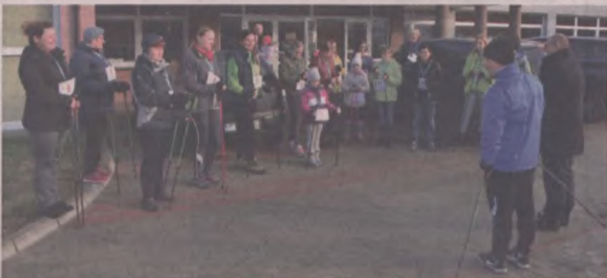
W tym roku pogoda nie rozpieszczała sympatyków aktywnego świętowania.