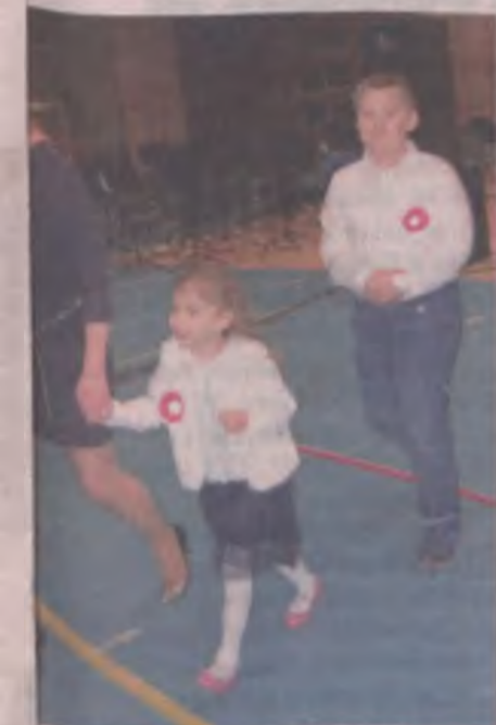
zawskich zaśpiewała „Szarą piechotę”.