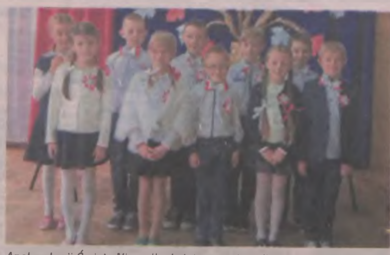
Apel z okazji Święta Niepodległości przygotowali uczniowie z klasy piątej Szkoły Podstawowej w Wilamowie.