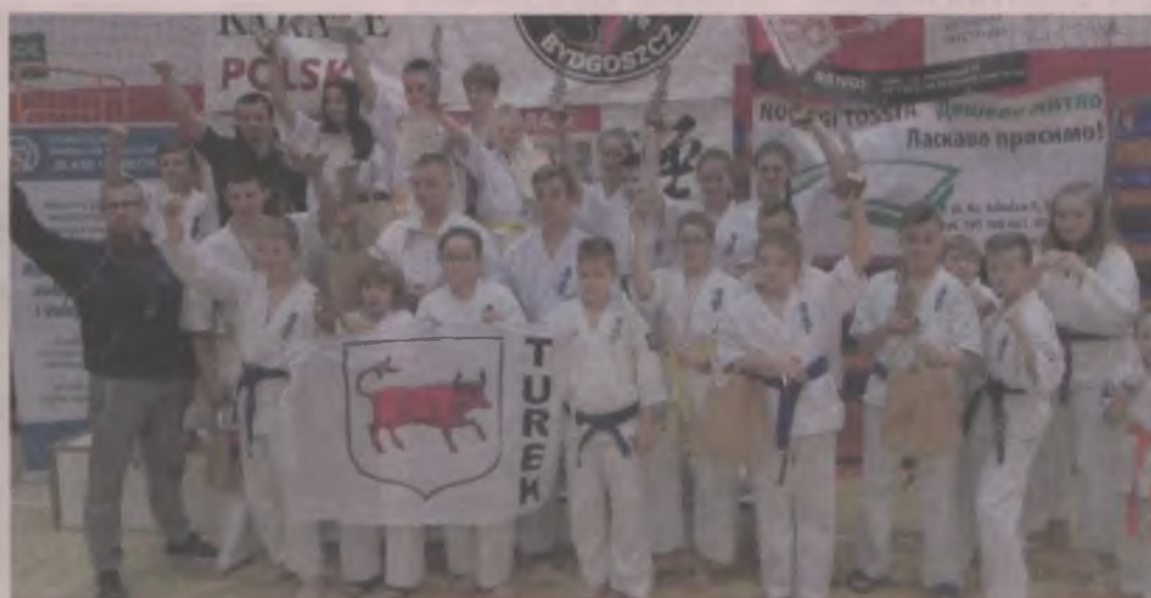
Reprezentacja powiatu turkowskiego podczas pucharu oyama w Bydgoszczy.