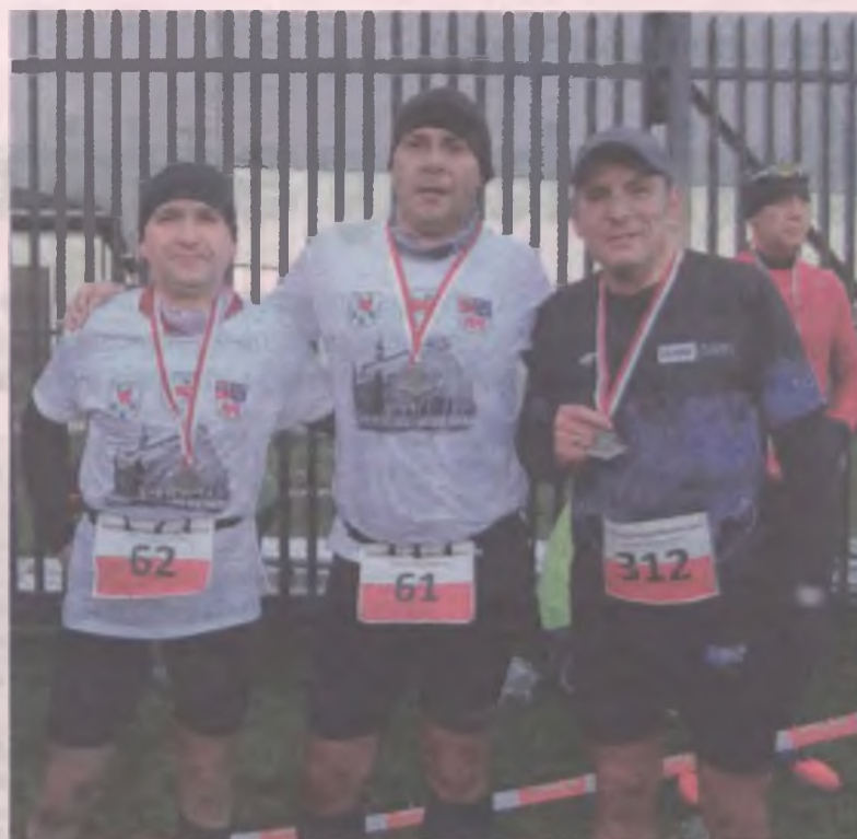
Biegi są nie tylko okazją do sprawdzenia swojej kondycji, ale stanowią również dobry pretekst do spotkań.