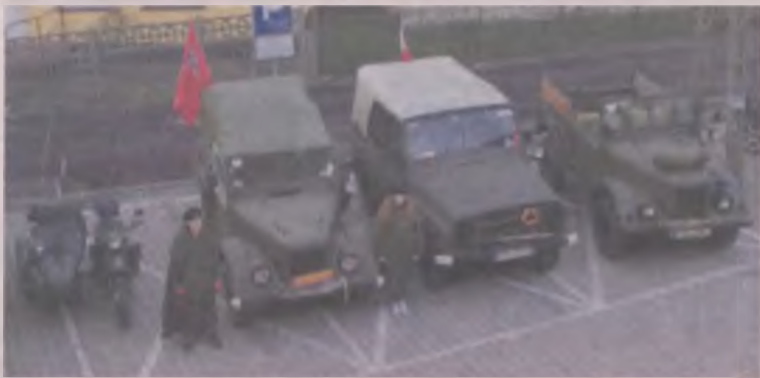
Grupa rekonstrukcyjna prezentowała swoje pojazdy.

Nieco zziębnięci, a nawet przemoczeni ludzie (zaczął intensywnie padać deszcz), ze smakiem jedli ciepłą grochówkę, którą pomagał gotować wójt. Były też gorące napoje i ciasto. Można też było obejrzeć wystawę umundurowania, broni i wyposażenia żołnierzy z okresu pierwszej i drugiej wojny światowej oraz PRL. To także wynik współpracy z grupą rekonstrukcyjną. Kulminacyjnym punktem niepodległościowego święta, było śpiewanie pieśni patriotycznych wraz z miejscowymi zespołami ludowymi Tradycja i Jarzębinki. (art)