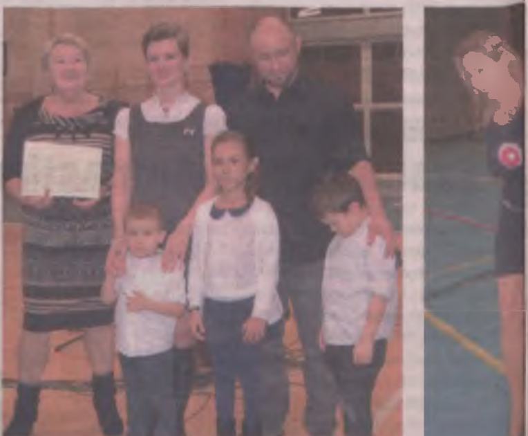
Rodzina Rosiaków wykonała dla publiczności „O mój rozmarynie” oraz „Przybyli ułani pod okienko”.