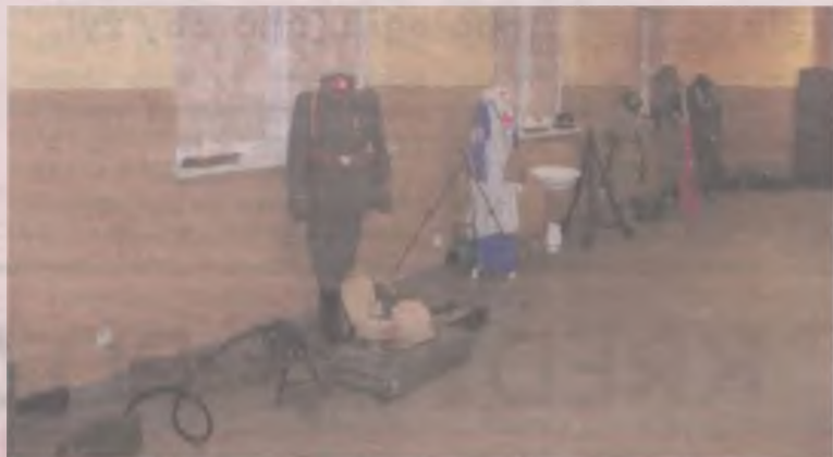
W świetlicy można było obejrzeć wystawę umundurowania, broni i wyposażenia żołnierzy.

-Teraz cieszymy się pełnią wolności i możemy się nią radować jak nasi przodkowie przed 99 laty - mówił. Cytował też słowa św. Jana Pawła II na temat wolności, głoszone między innymi podczas pielgrzymek do Polski. Krytycznie mówił o ludziach, którzy przedkładają swoją europejskość nad narodowe wartości. Nabożeństwo ubarwiła wykonana w trakcie udzie-