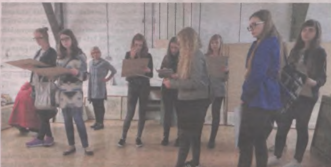
Pracownicy muzeum w Koninie przygotowali naszym licealistom bardzo intymne spotkanie z Glicensteinem.