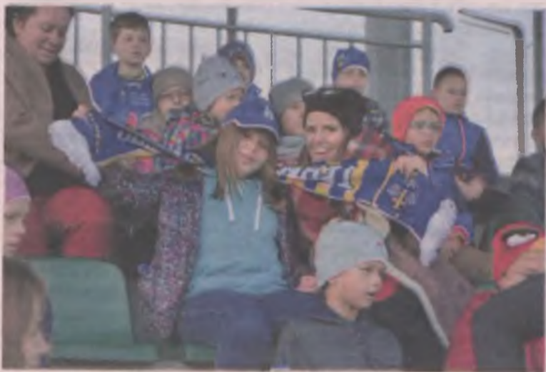
Jak zawsze podczas rozgrywek kibiców nie brakowało.