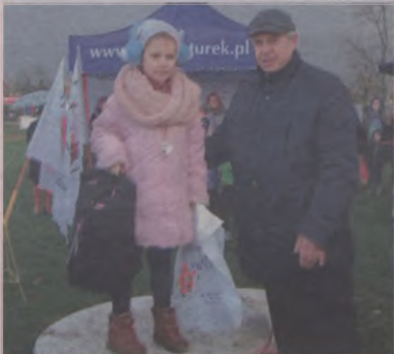
Największy podziw budzili najmłodszy, którzy nie zrezygnowali z uczestnictwa w imprezie mimo tak niesprzyjającej aury. Stąd należą im się największe brawa.

Liczba uczestniczących rodzin – 971. Liczba uczestniczących – 267 osób.