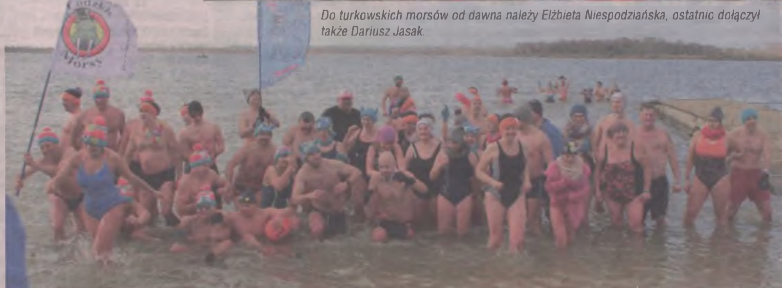
Z przytupem, w ubiegłą niedzielę morsy rozpoczęły sezon zimnych kąpiei.