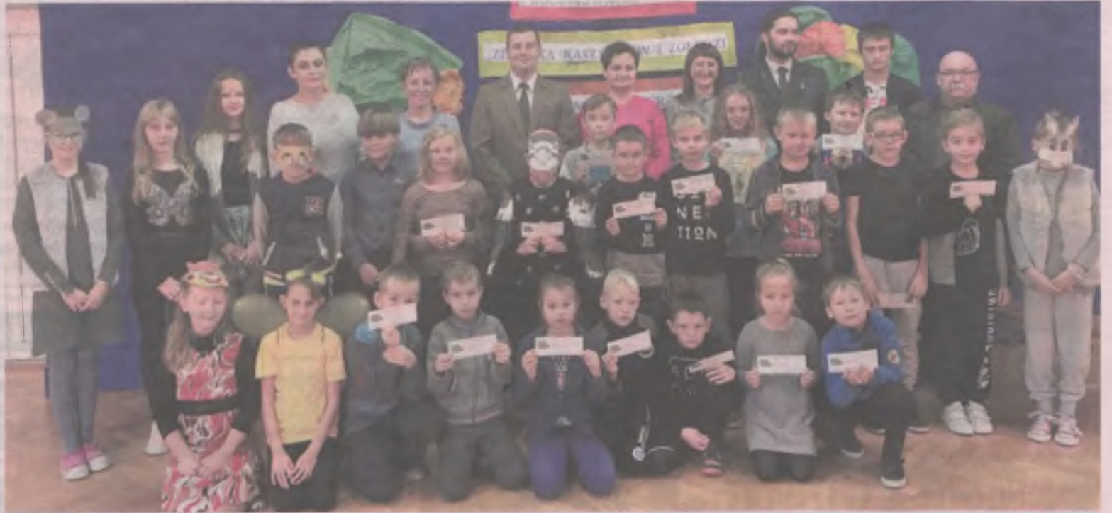
Goście, gospodarze i uczestnicy akcji podczas spotkania podsumowującego.

rzano też występ cisewskich dzieci, tematycznie związany z przeprowadzoną akcją. -Podtrzymując naszą współpracę wspólnie wybierzemy się na zimową wycieczkę do lasu, aby uczniowie sami mogli zobaczyć, jak wygląda dokarmianie zwierząt przy użyciu karmy, którą pomagali zbierać - mówi pani Popardowska. (art)