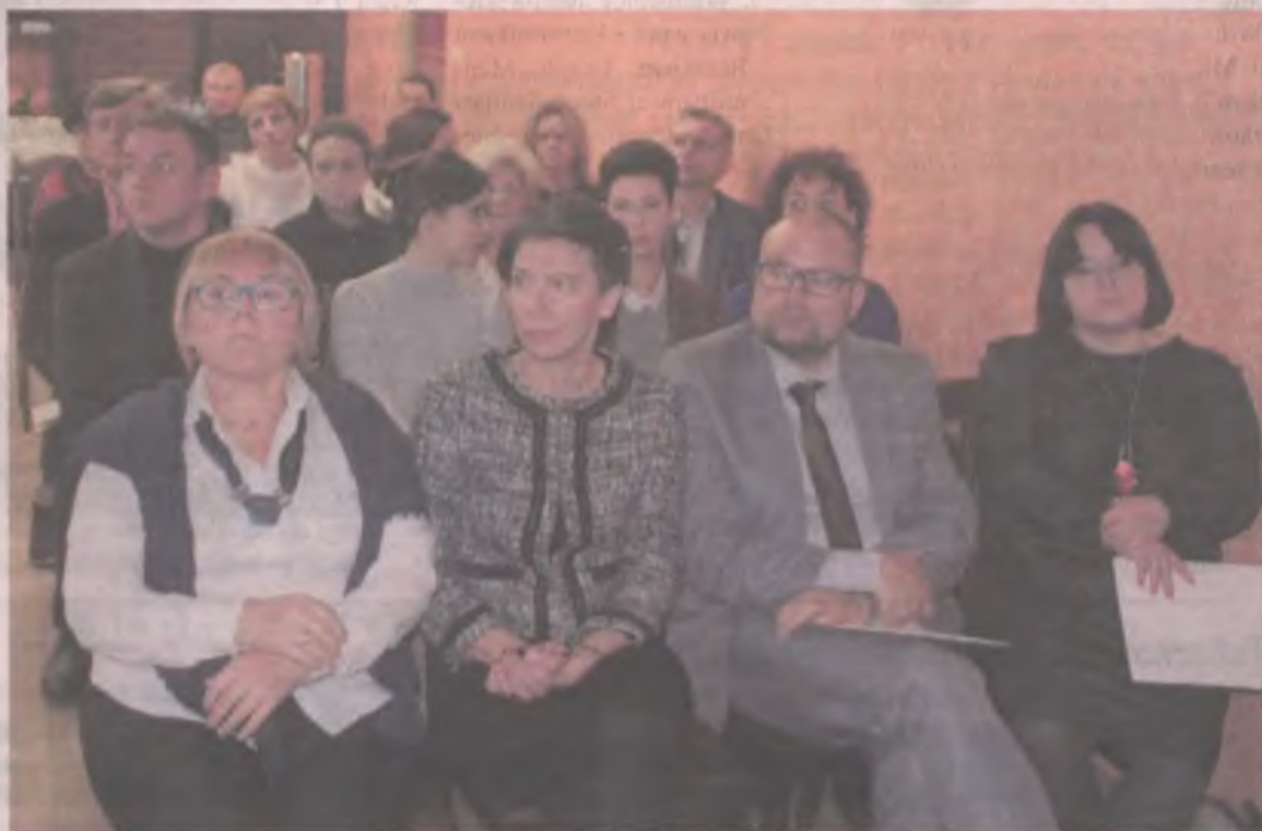
W konferencji brali udział przedstawiciele władz państwowych, samorządowych wszystkich szczebli oraz instytucji i organizacji zajmujących się niepełnosprawnymi.