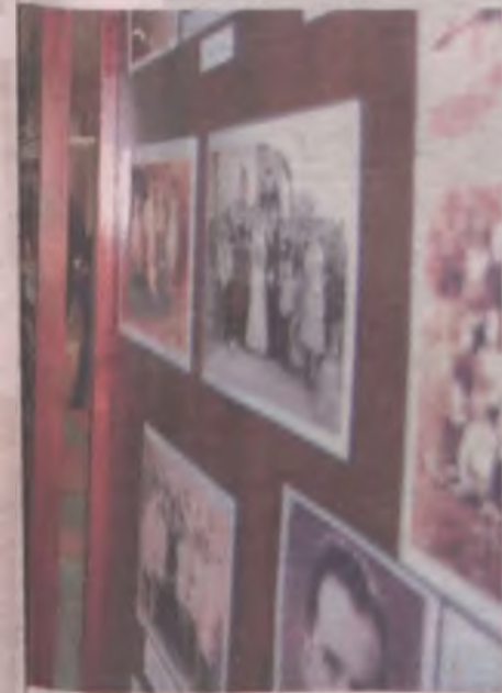
st do dyskusji i sięgania w zakamarki