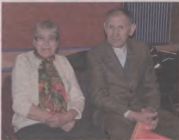
Każdy z seniorów uczestniczących w spotkaniu otrzymał ulotki i kamizelki odblaskowe.