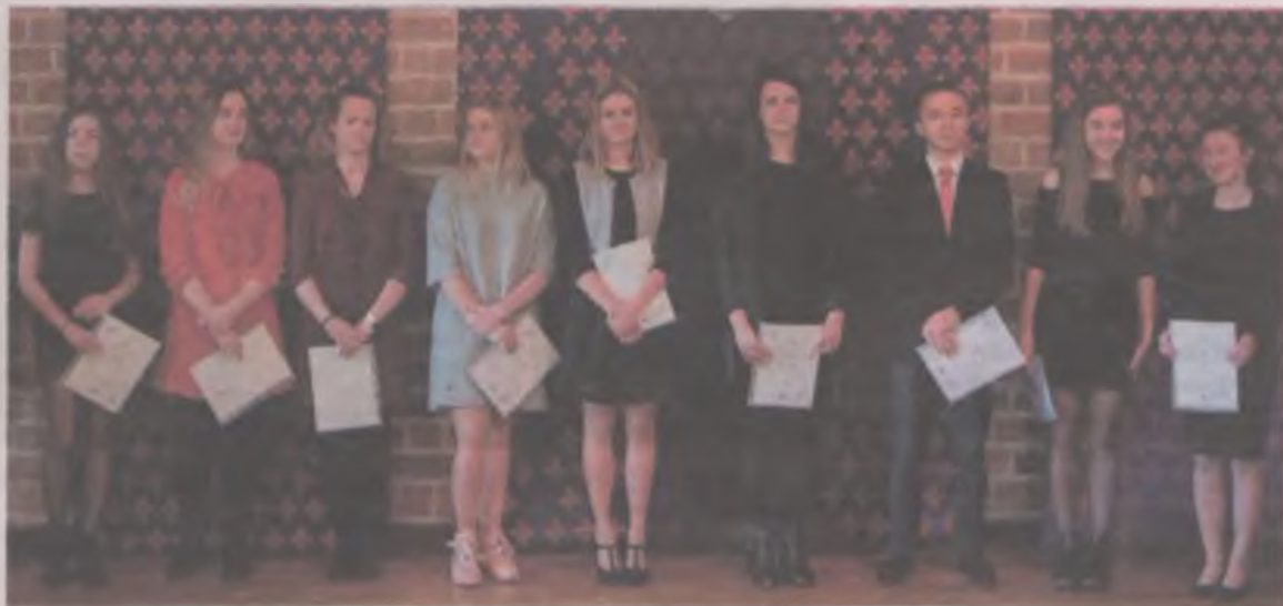
Uczniowie szkół średnich nagrodzeni za wysokie wyniki w nauce.