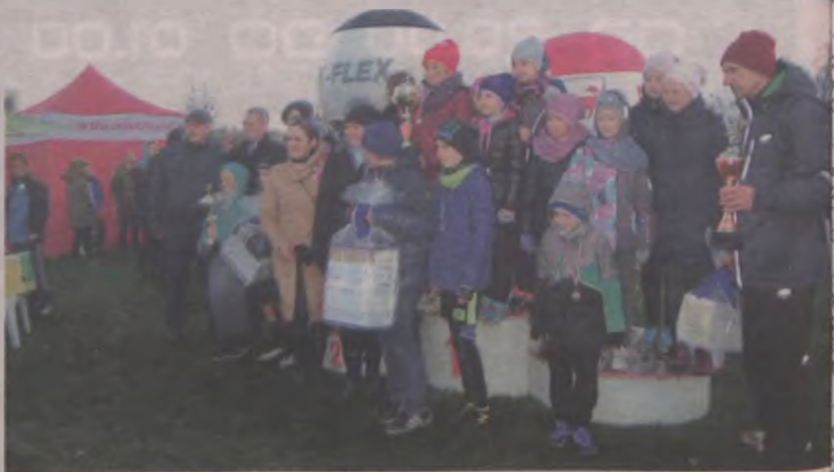
Zwycięzcy klasyfikacji szkół podstawowych: SP5 Turek oraz SP4 Turek.