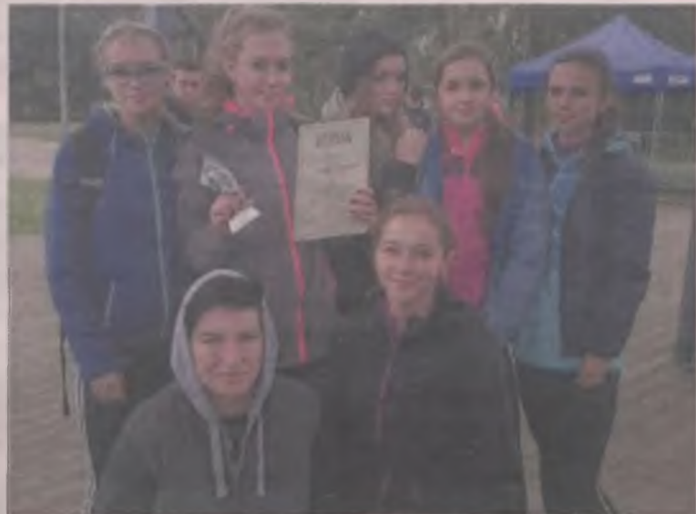
Zwycięska drużyna SMS LO Aleksandrów Łódzki.

chłopców rocznika 1998-2001). W sumie o zwycięstwo walczyło około 300 zawodniczek i zawodników z