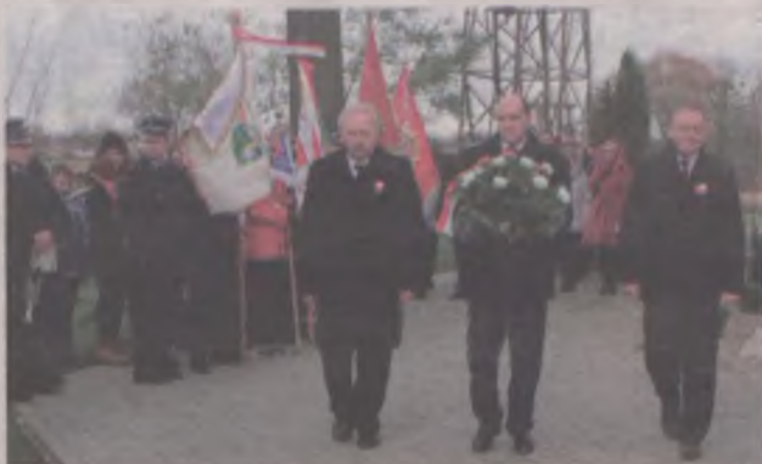
Kwiaty pod pomnikiem składają przedstawiciele Koła Miłośników Tradycji.