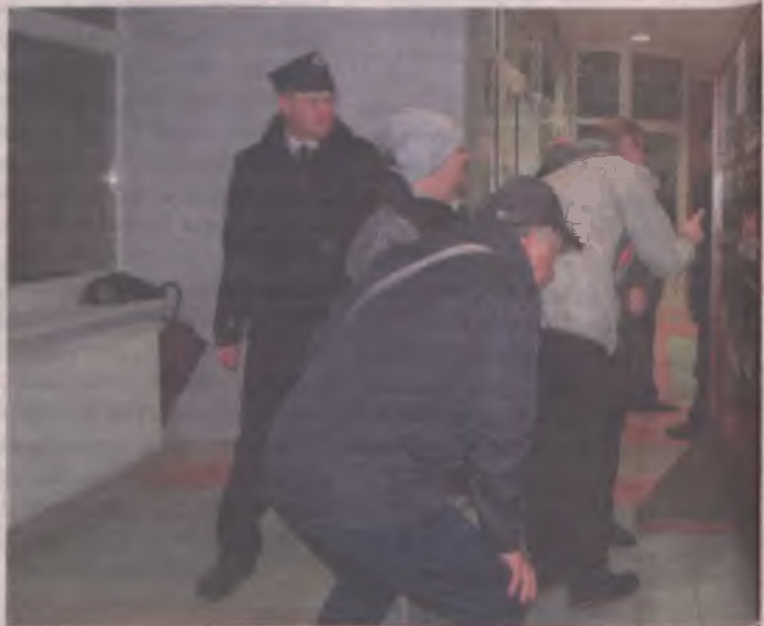
Wystawa zdjęć cieszyła się dużym zainteresowaniem i stanowiła pretekst do rodzinnej pamięci.