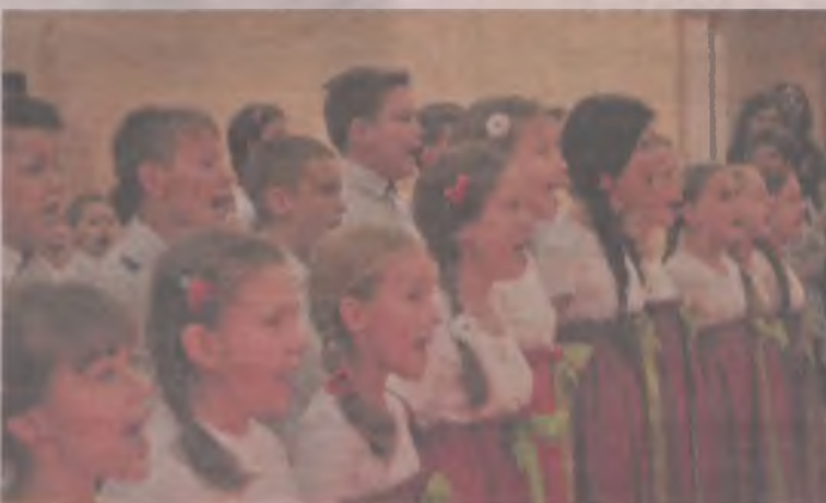
Uczniowie świetnie radzili sobie z pieśniami żołnierskimi.

cić, by zostały zapomniane - mówił czwartoklasista.