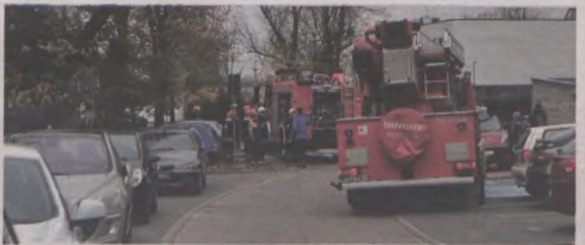
Pięć zastępów straży pożarnej zadysponowanych zostało do zadymienia w jednej z piwnic bloku przy ulicy Legionów Polskich w Turku.