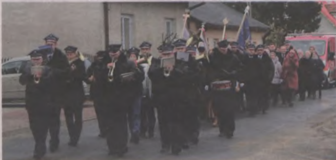
Ze skweru 650-lecia przemaszerowano do kościoła w Tokarach.

SKUP ZŁOMU W PRZYKONIE ul. Przemysłowa 6