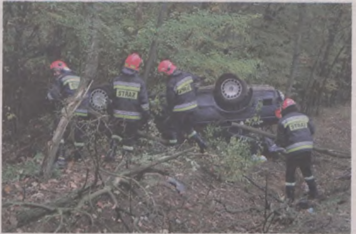
Kierowca BMW nie dostosował prędkości do panujących warunków, dlatego wpadł w poślizg i dachował w lesie.