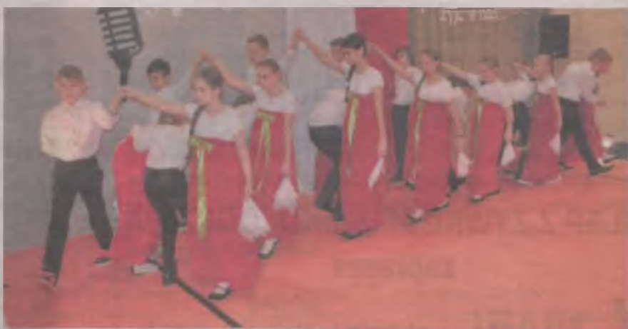
Koncert pieśni patriotycznych w Chlebowie rozpoczął się od poloneza.

Piątkowa (10 listopada) Uroczystość z okazji Święta Niepodległości „Półki Polska żyje w nas”, rozpoczęła się od poloneza. Następnie uczniowie wyjaśnili zebranym, że pieśni patriotyczne są zapisem losów Polaków na przestrzeni wieków. Stanowią dużą część dziedzictwa kulturalnego narodu. -Zawsze były i nadal są manifestacją naszej tożsamości. Dlatego nie możemy dopuścić,