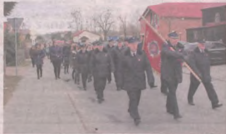
Z kościoła przemaszerowano na cmentarz.

Po nabożeństwie obejrzano i wysłuchano okolicznościowego pro-