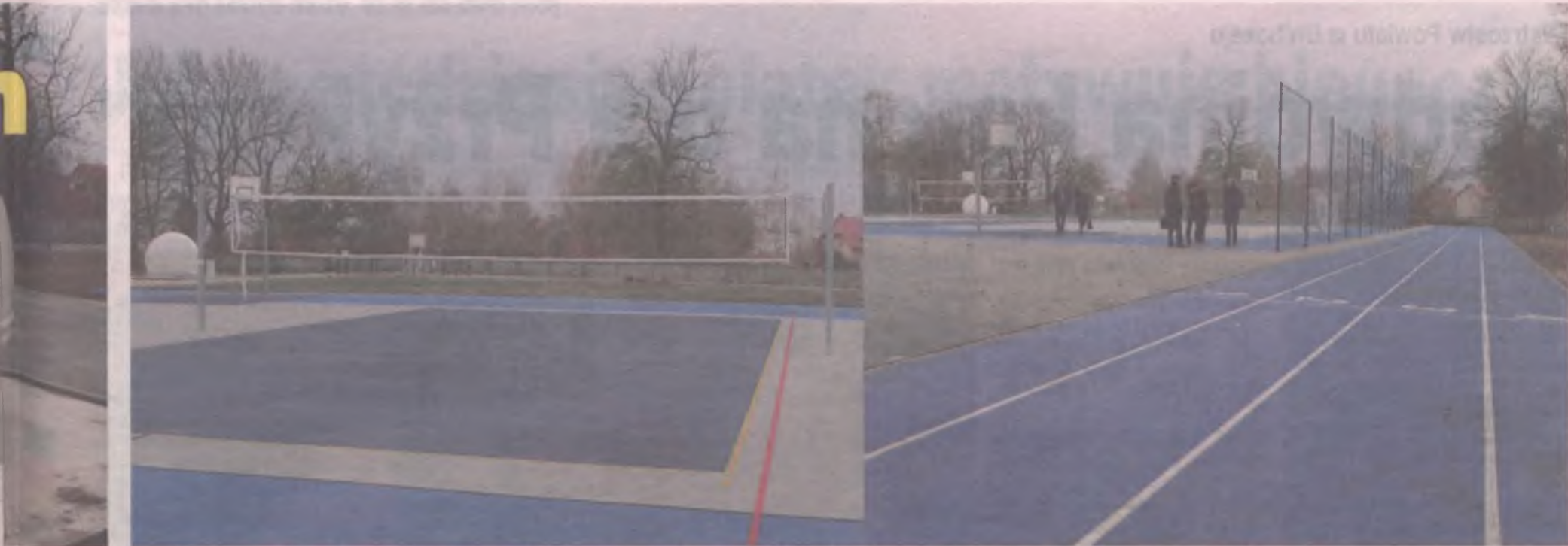
Kompleks o sztucznej nawierzchni z boiskiem do siatkówki i czterotorową bieżnią o długości 60 m.

ódek me- rami ycz- ne, barometr mechaniczny tarczowy, deszczomierz. Szkoła posiada również automatyczną stację meteorologiczną on-line, dzięki której możliwy jest