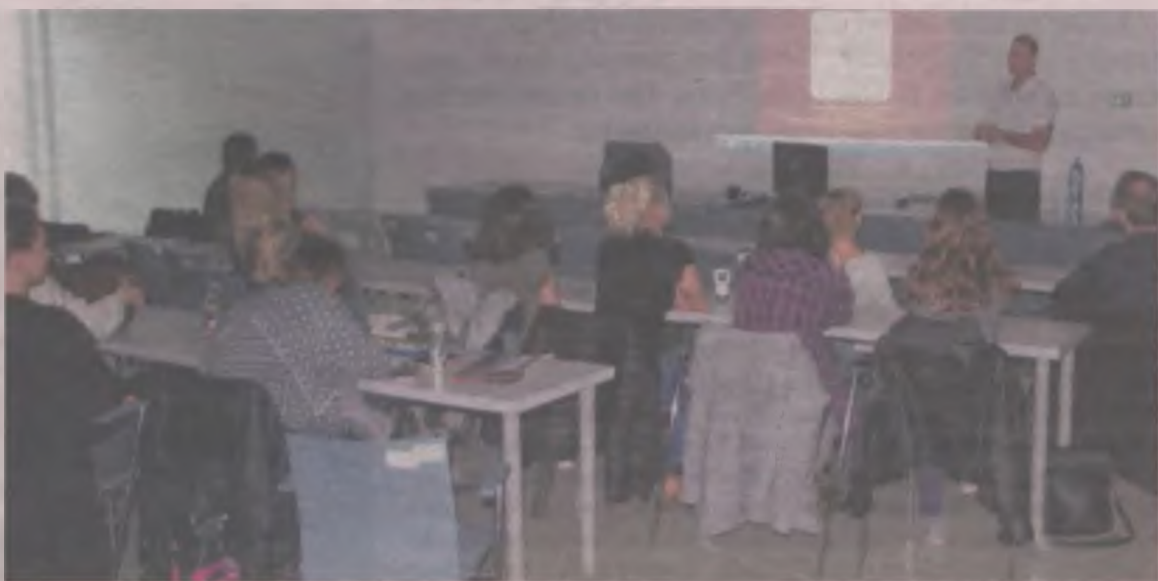
Dzieła krakowskiego artysty w Turku oraz zagadnieniom związanym z jego renowacją poświęcone były wykłady dla studentów oraz kadry naukowej dwóch artystycznych uczelni w Łodzi i we Wrocławiu.