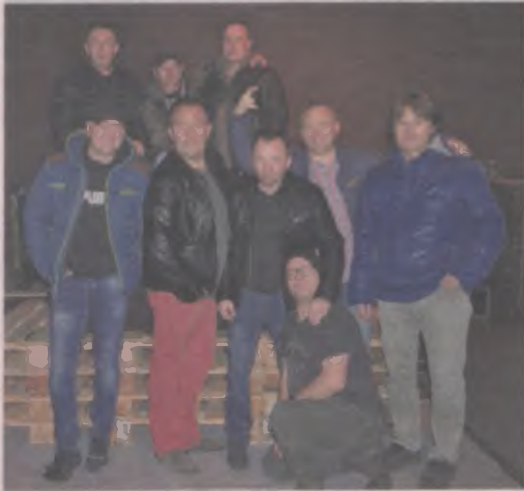
Pamiątkowe zdjęcie obu zespołów.