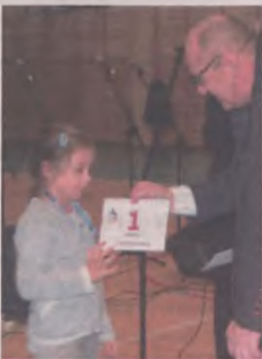
Tradycyjnie wśród uczestników Marszu dla Niepodległej rozlosowano nagrody, którymi były sklepowe talony.