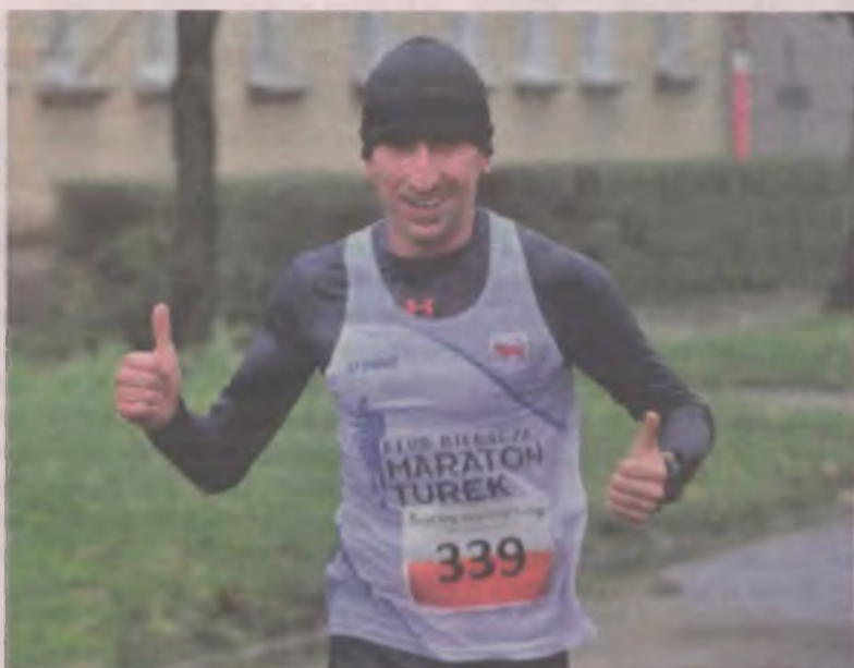
Czasem w strugach deszczu przyszło uczestnikom biegu głównego pokonywać turkowską dziesiątkę.