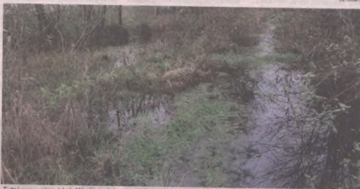
Tutaj rowu nie widać. Woda rozlała się na dużym obszarze i jest coraz bliżej gospodarstw.