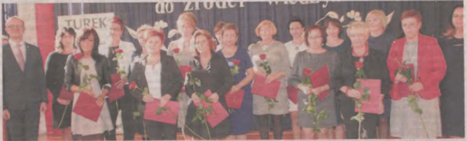
Burmistrz przyznał nagrody II stopnia 20 nauczycielom.