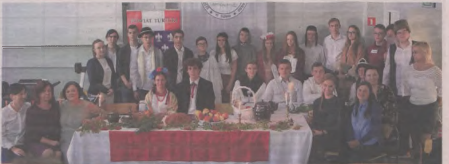
Dramat Wyspiańskiego czytali uczniowie technikum i Szkoły Podstawowej nr 5.