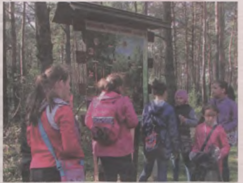
Akcja miała również aspekt edukacyjny.