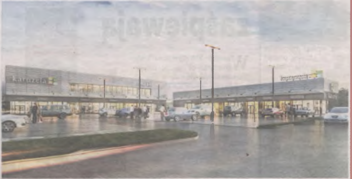
Wizualizacja przedstawia dwa dobudowane budynki handlowe CH Karuzela.

Sklep Martes Sport z markowymi artykułami sportowymi zmieni swoją lokalizację i będzie znajdował się w drugim dobudowanym