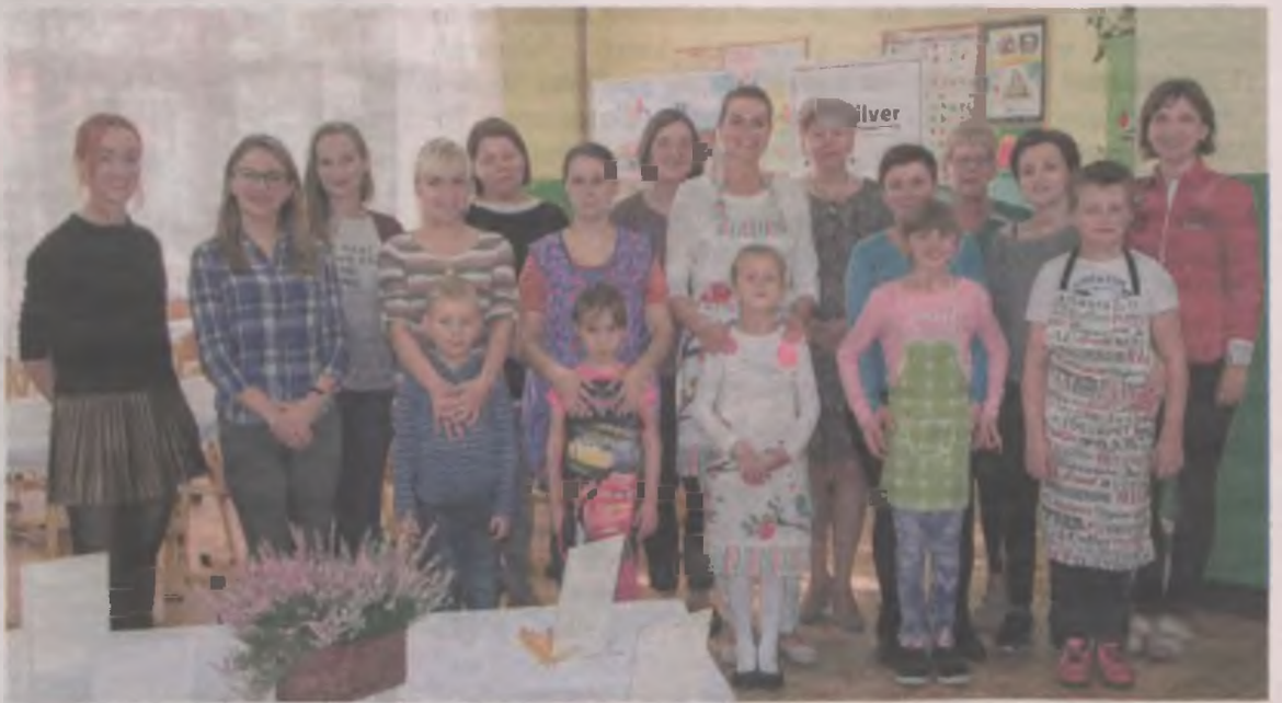
Wspólne zdjęcie uczestników i organizatorów warsztatów bez wątpienia zachęca do wzięcia udziału w kolejnym kulinarnym wydarzeniu, które odbędzie się za miesiąc.

Przedsięwzięcie jest realizowane przy współpracy Gminy Uniejów,