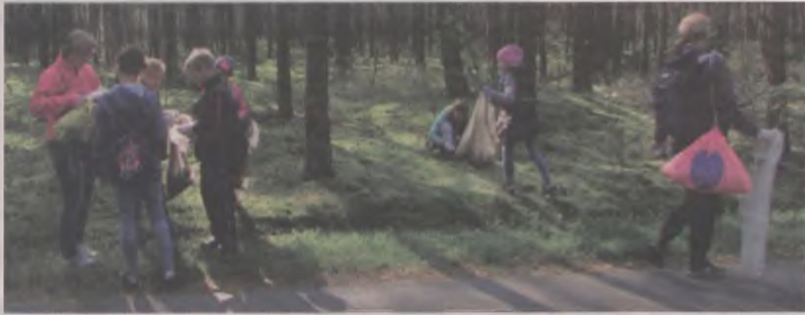
Śmieci zbierano do foliowych worków.