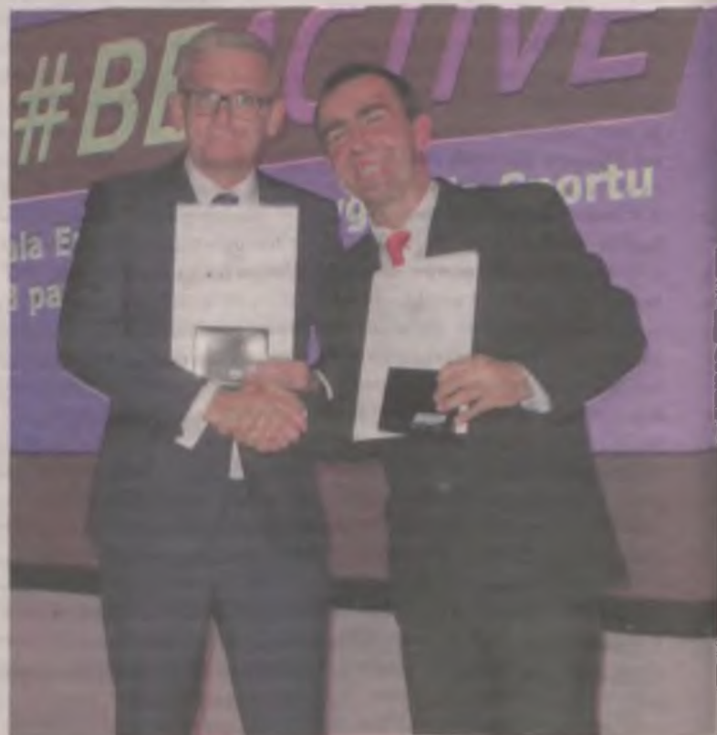
Przedstawiciele szkół powiatu tureckiego gratulują sobie sukcesu.