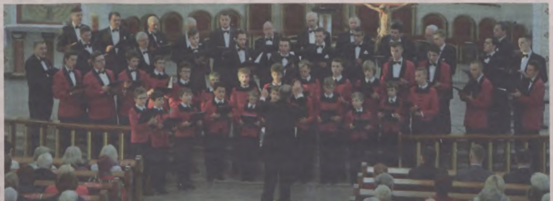
Niedzielny koncert w Turku był jednym z wielu Wielkopolsce, zorganizowanym w rocznicę śmierci Stefana Stuligrosza. Profesor był ogromnym zwolennikiem umuzykalniania Wielkopolan. Dzięki temu mieliśmy okazję niejednokrotnie zetknąć się z kulturą przez duże „K”.