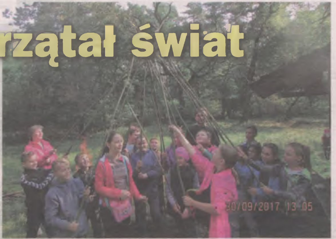
Uczniowie ze Szkoły Podstawowej w Krwonach gotowi na rozpalenie ogniska.