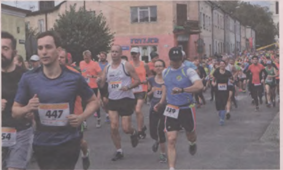
W niedzielnym Biegu Do Gorących Źródeł wzięło udział prawie tysiąc uczestników.

Dla zawodowych biegaczy liczył się wynik, celem amatorów było przede wszystkim przełamanie słabości, a przy okazji udowodnienie sobie oraz innym, że dadzą radę pokonać trasę wraz z