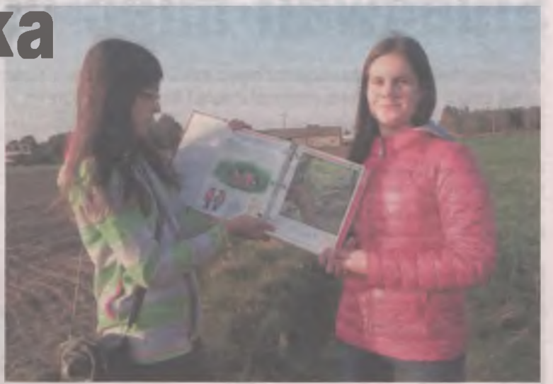
Atlasy ptaków pozwalały precyzyjnie określić gatunki zauważonych ptaków.

Dzieci ze szkół w Słodkowie i Cisewie drożdżika nie wypatrzyły. Zaobserwowały za to następujące gatunki ptaków: szpaki, czajki, gawrony, grzywacze, wróble, wrony siwe i sroki. Wyniki obserwacji wysłano do centrali Ogólnopolskiego