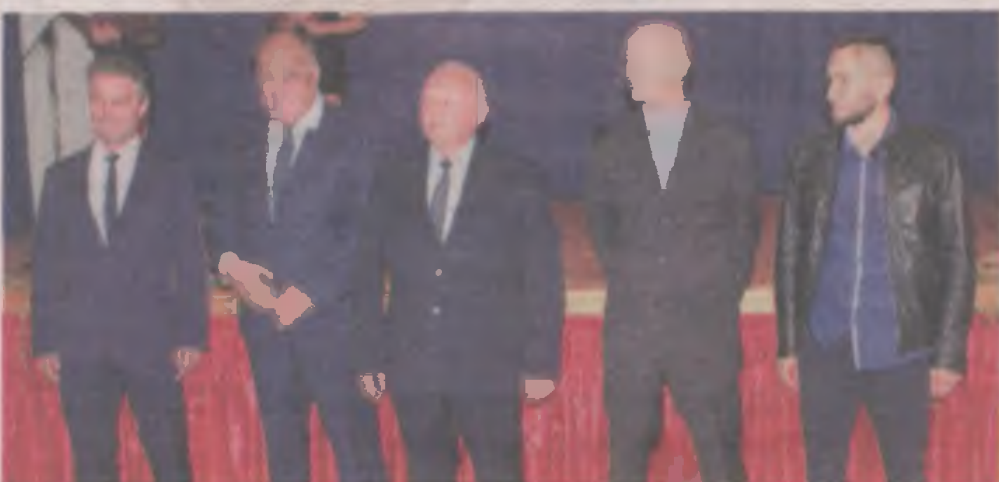
Nauczyciele nominowani w kategorii „szkolny osiłek”.