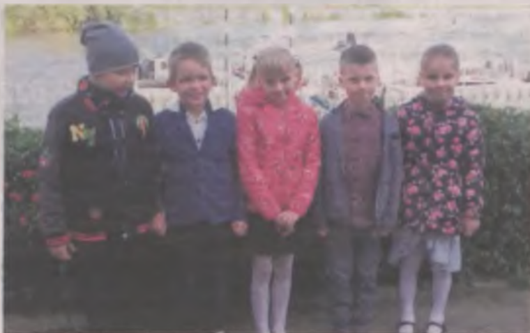
Miłaczewscy filmowcy nad Wisłą.

Udział w konkursie postanowiła wziąć piątka dzieci z oddziału przed-