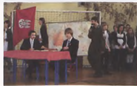
Przedstawienie historyczne w G1

3 listopada w Domu Kultury w Kórniku odbył się finał XI Powiatowego Konkursu Recytatorskiego Wpisani w historię. Naszą szkołę reprezentowało troje uczniów: