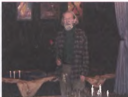
Spektakl Złota Kaczka