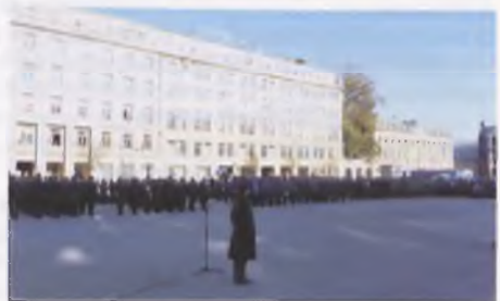
Uroczystości na Placu Wolności w Poznaniu

stry Reprezentacyjnej Sił Powietrznych na Plac Wolności. Na początku oficjalnych uroczystości złożono meldunek Dowódcy Garnizonu, podniesiono flagi państwowe oraz odegrano hymn. Następnie głos zabrał Wojewoda Wielkopolski, Piotr