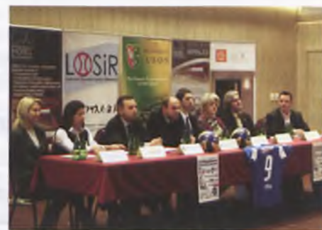
Konferencja prasowa przed Turniejem

Patronat honorowy nad wydarzeniem objęli Burmistrz Miasta Luboń, Wojewoda Wielkopolski, Konsul Honorowy Republiki Słowenii, Marszałek Województwa Wielkopolskiego i Prezydent Miasta Poznania. Turniej został zorganizowany przy współpracy Lubońskiego Ośrodka