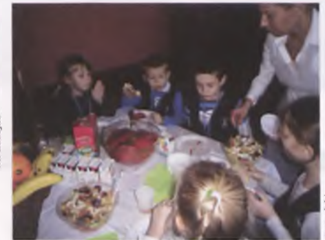
Śniadanie dla wszystkich w SP3

8 listopada została przeprowadzona ogólnopolska akcja edukacyjna „Śniadanie daje moc”, która została objęta honorowym patronatem Wielkopolskiego Kuratora Oświaty.