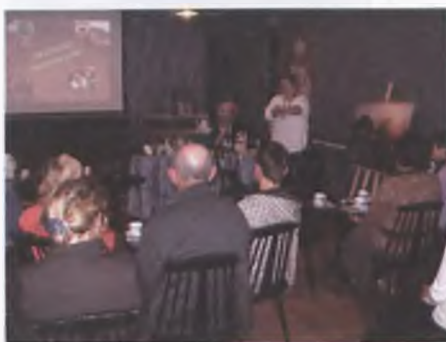
O kawie przy kawie

Zapraszamy na naszą stronę internetową: www.biblub.com