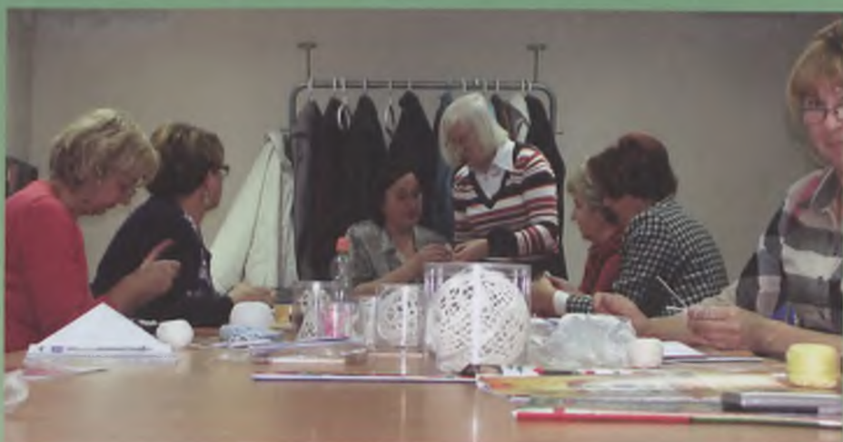
pierwsze zajęcia praktyczne