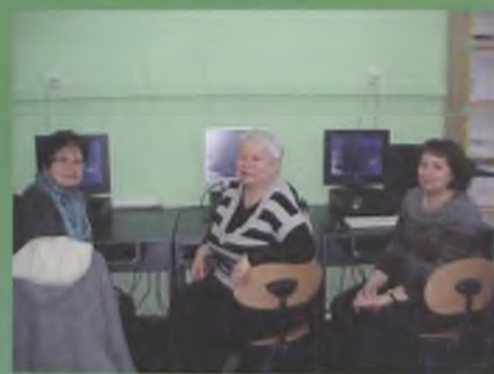
Zajęcia z informatyki