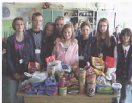
Zbiórka karmy dla zwierząt

Uczniowie Trójki wzięli udział w szkolnej akcji zbiórki karmy dla zwierząt z poznańskiego schroniska. Akcję zorganizowało kółko ekologiczne w ramach obchodów Światowego Tygodnia Ochrony Zwierząt. Dziękujemy za ofiarność i zapraszamy do następnej akcji w przyszłym roku.