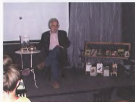
Spotkanie z Illgiem