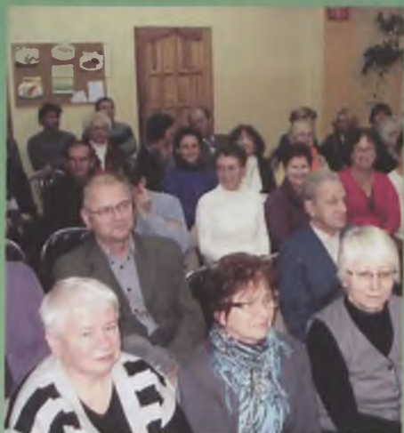
Pierwsze wykłady i ...