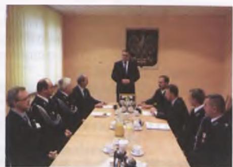
Porozumienie Ochotniczej Straży Pożarnej

Jednostki OSP działające w ramach Systemu Ratowniczo-Gaśniczego podejmują działania zmierzające do ochrony życia, zdrowia, mienia i środowiska poprzez wal-