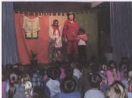
Spektakl Krasnal Hałabala