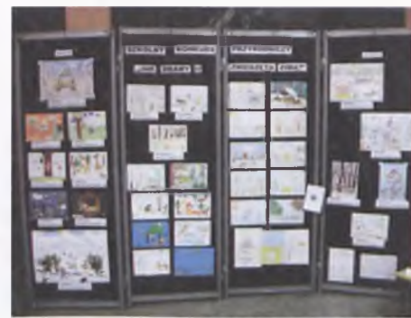
Pokonkursowa wystawa w SP3