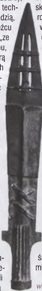
Włócznia św. Maurycego

Synowie rodów polańskich od początku stanowili zatem trzon drużyny książęcej, z której rekrutowali się później dowódcy wojsk, wyruszających na podbój sąsiednich krain. Sami Piastowie byli bardzo wojowniczą dynastią. W ciągu IX i X wieku drogą podboju lub uzależnienia zdołali opanować cały obszar dzisiejszej Polski środkowej: Wielkopolskę, Mazowsze, Ziemię Chełmińską, Łęczycko-Sieradzką. cdn.