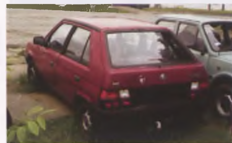
Auto bez tablic rejestracyjnych uznaje się za wrak

też tych przesłanek jeszcze nie spełnia. Istotną podpowiedzią dla stwierdzenia faktu, czy samochód stał się wrakiem jest art. 2 pkt 33 ustawy Prawo o Ruchu Drogowym, który stanowi, że pojazdem samochodowym może być tylko ten pojazd silnikowy, którego konstrukcja umożliwia jazdę z prędkością powyżej 25km/h. Zatem wszystkie pojazdy silnikowe z wyjątkiem ciągników rolniczych, które z jakichś powodów nie spełniają tego wymogu (brak elementów wyposażenia, czy mechaniczne uszkodzenia) można zakwalifikować jako wraki.