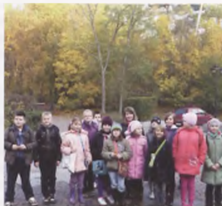
Jesienny spacer w WPN