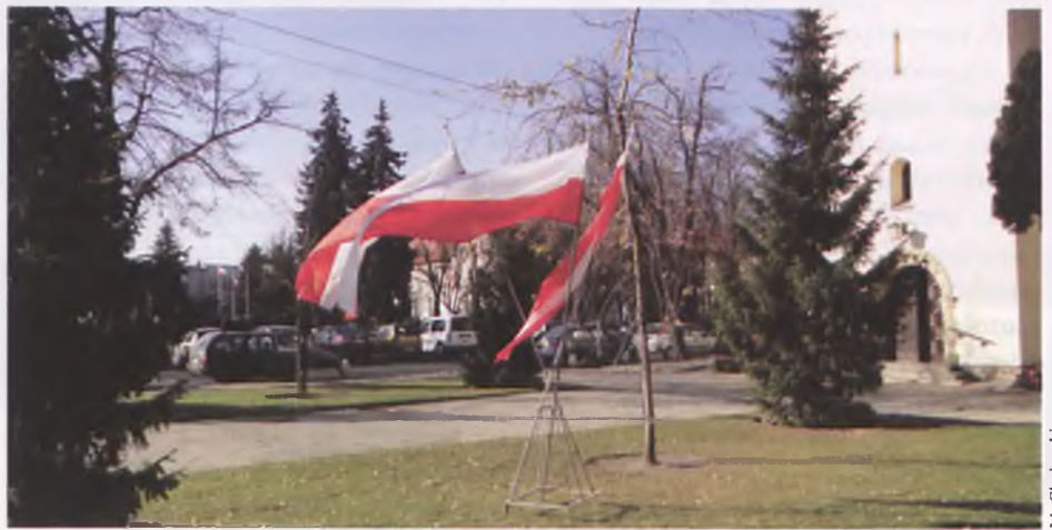
Wiele ulic i miejsc zostało udekorowanych flagami z okazji Święta Niepodległości

W listopadowym święcie uczestniczyli licznie przybyli mieszkańcy, delegacje władz miejskich, służb mundurowych, szkół i organizacji społecznych. ■