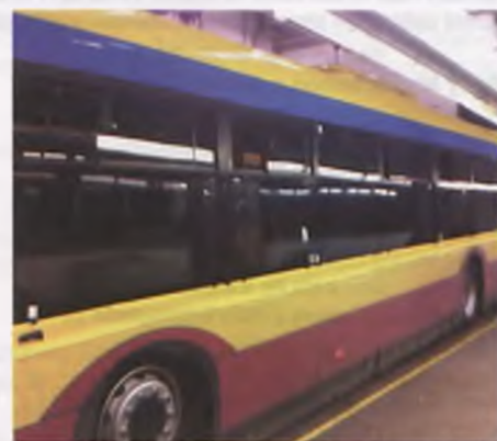
Autobusy w charakterystycznych dla Lubonia barwach