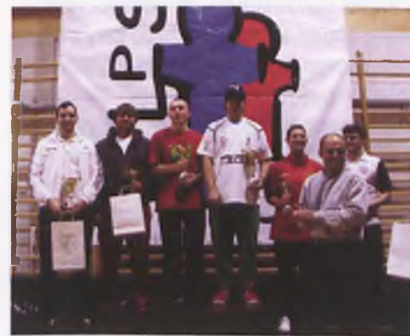
Zwycięzcy Mistrzostw Polski Garlando