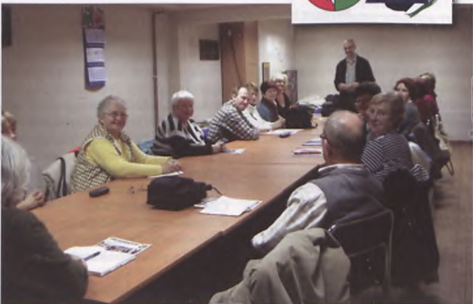
Zajęcia sekcji artystycznej w Ośrodku Kultury