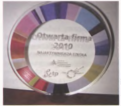
Wyróżnienie Otwarta Firma dla SP3

Szkoła Podstawowa nr 3 w Luboniu została laureatem konkursu na najaktywniejszą szkołę w ramach III Światowego