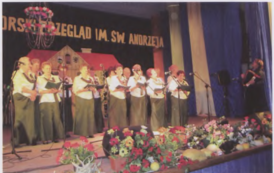
Występ „Szarotek” na festiwalu w Debrznie