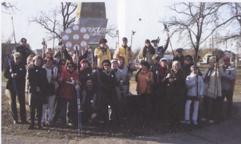
Uczestnicy I Lubońskiego Rajdu Nordic Walking im. Włodzimierza Kaczmarka

Sprzyjająca, słoneczna pogoda sprawiła, że marsz ścieżką rowerową Kocie Doły, aż po Kątnik nad Wartą i z powrotem, był miłym rekreacyjnym spacerem. Na zakończenie rajdu przewidziano ciepłą niespodziankę – gorące napoje i degustację potrawy lokalnej Ziemniaki Po Lubońsku