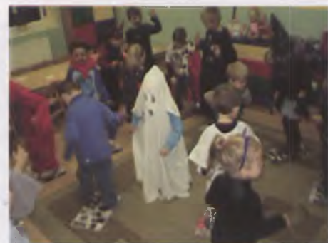
Dzień Postaci z Bajek w przedszkola Chatka Skrzatka w Luboniu

UWAGA: kontynuujemy cykl spotkań z bajkami, na który zapraszamy dzieci nie uczęszczające do żadnego przedszkola.