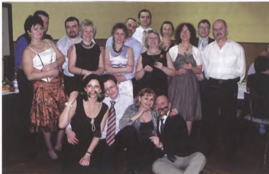
Członkowie Wspólnoty Lubońskiej