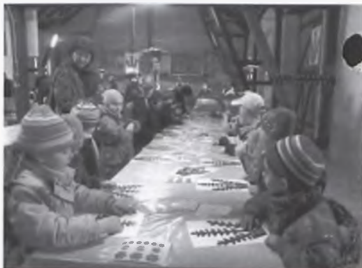
Spotkanie z tradycją w muzeum w Szreniawie