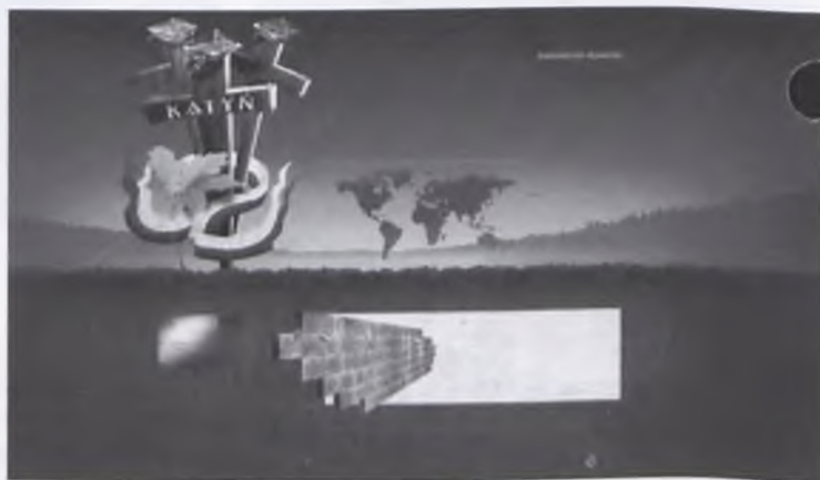
Dęby Katyńskie to ogólnopolska inicjatywa, której celem jest stworzenie żywego pomnika pamięci ofiar katyńskich