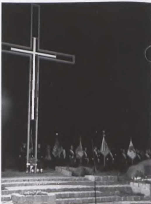
Wspólna modlitwa mieszkańców pod krzyżem na Wzgórzu Papieskim w naszym mieście