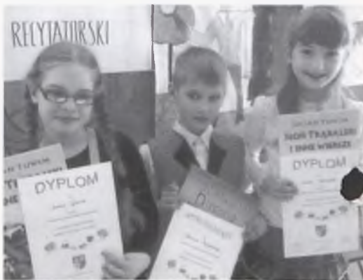
Uczestnicy konkursu recytatorskiego