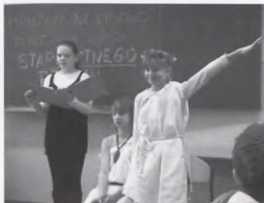
Lekcja historii poświęcona starożytnemu Rzymowi