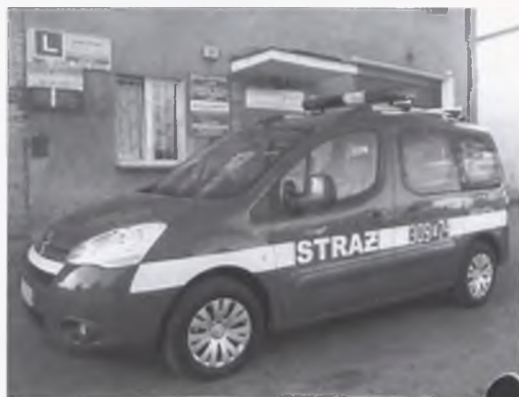
Ochotnicza Straż Pożarna zakupiła samochód z wygospo-darowanych przez jednostkę środków

Jest to samochód Specjalny Lekki Rozpoznania Ratowniczego, przeznaczony do zadań pomoc-nicznych w jednostce. Samochód może służyć między innymi do przewozu pomp pływających i elektrycznych w czasie lokalnych podtopień. Może wówczas samodzielnie prowadzić dzia-łania ratownicze. Został wyprodukowany w 2010 roku i zakupiony jako nowy w kredycie 50/50. Środki wygospodarowała sama jednostka OSP za zabezpieczanie wyścigów na torze Poznań w roku 2010. W ten sposób strażacy odciążyli bu-dżet Miasta Luboń. Samochód zastąpił starego już Tarpana Honkera, który przekazano Ochot-nicznej Straży Pożarnej na Osiedlu Kwiatowym