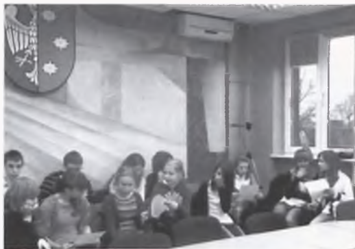
Uczniowie na Młodzieżowej Sesji Rady Miasta Luboń

W ramach pokazów wielkanocnych dzieci obejrzały przedstawienie, które wprowadziło je w tematykę wiosenną i świąteczną oraz uświadomi-