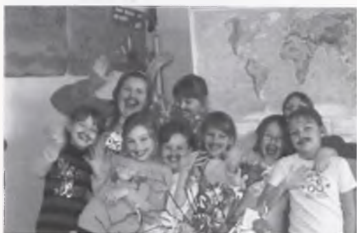
Drugoklasiści z SP 4 uczcili odejście Adama Małysza na „sportową emeryturę” między innymi zapuszczając na tę okazję wąsy