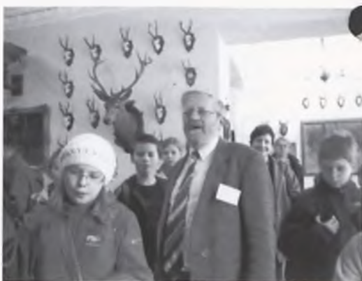
Wycieczka do Muzeum w Uzarzewie