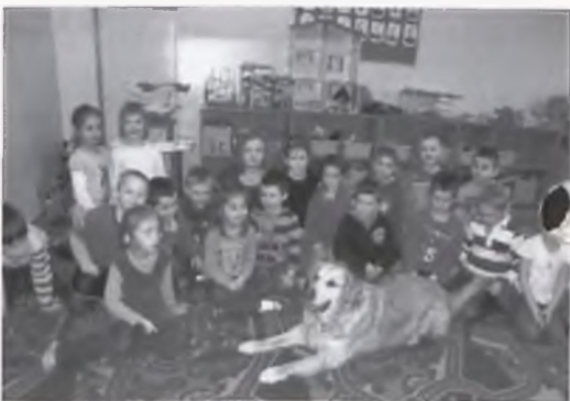
Spotkanie edukacyjne poświęcone psu