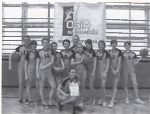
Zwycięska drużyna koszykarek