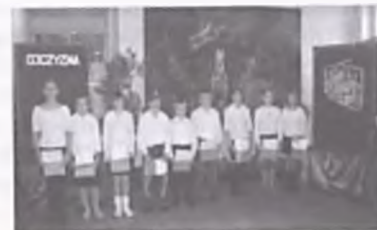
Na zdjęciu klasa Va podczas akademii.

Ten sam program przedstawiony został na oficjalnych obchodach 87 rocznicy odzyskania niepodległości z udziałem władz miasta i mieszkańców 11 listopada na rynku w Żabikowie.