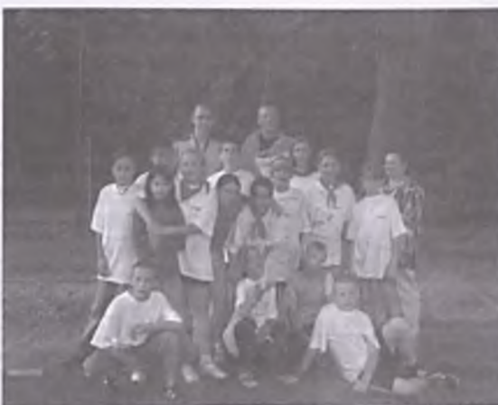
Fot. Grupa w czasie zajęć sportowych. Luboń wyróżniał się specjalnym koszulkami, które posłużyły również do zbierania pamiątkowych podpisów.

w pierwszy i trzeci poniedziałek miesiąca od 16.00 do 18.00