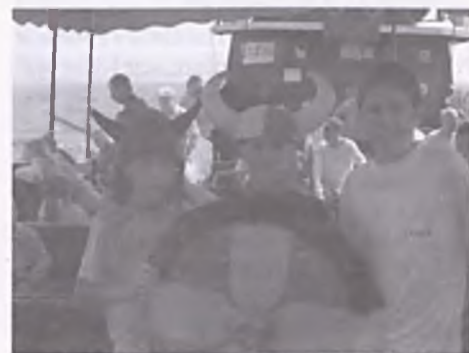
Fot. Wycieczka statkiem wikingów po morzu.