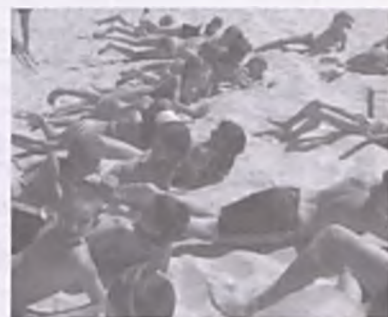
Fot. Chrzest morski na plaży. Jednym z jego elementów była „kąpiel” w piasku.