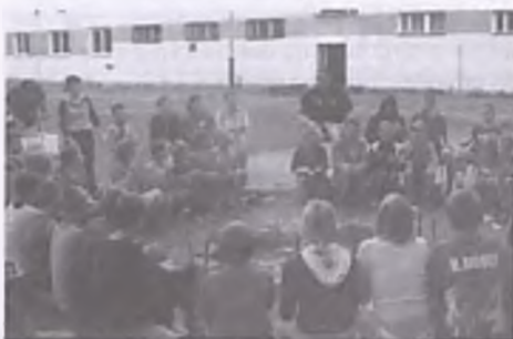
Fot. Ognisko, podczas którego koloniści mieli okazję nauczyć się śpiewania szant.