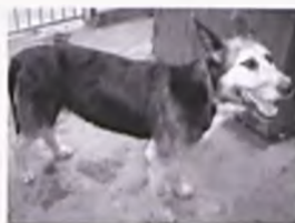
Lusja- szorstkowłosa, ok 6 lat, w schronisku od 31.07.06