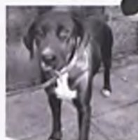
Kama- czarna suczka ok. 3 lat, w schronisku od 16.08.06

OŚRODEK KULTURY W LUBONIU ROZPOCZĄŁ ZAPISY NA PÓŁKOLONIE ZIMOWE (15.01.2007-19.01.2007) KOSZT UCZESTNICTWA: 45 ZŁ W PROGRAMIE KINO, PŁYWALNIA I WYCIECZKI INFORMACJE I ZAPISY POD NR TEL.061/8130072