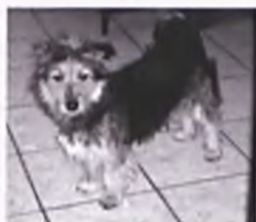
Kosmo- szorstkowłosa, ok 1,5 roku, w schronisku od 12.12.06