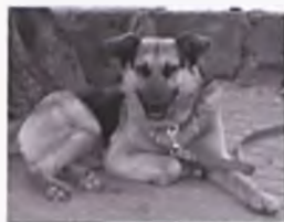
Bemol- wilkowaty, ok..2 lat. w schronisku od 8.07.06