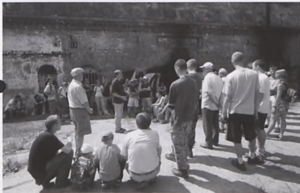
W lipcu fort VIIIa zwiedziła rekordowa liczba osób (260!).