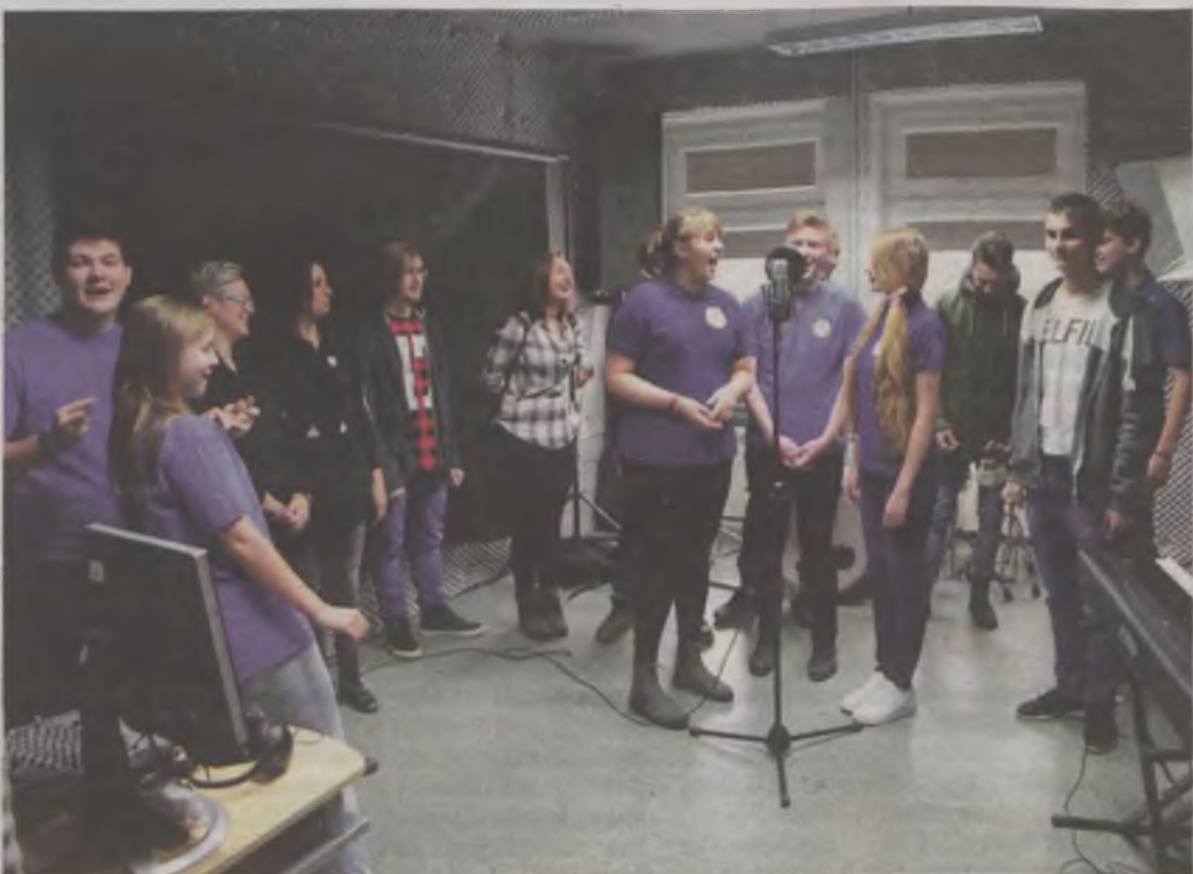
Uczniowie Zespołu Szkół Technicznych w Turku

Teraz młodzież ma także możliwość nagrywania i montowania własnych audycji, utworów muzycznych. Co więcej, może też poprawiać brzmienie zapisanych już ścieżek dźwiękowych. -Dzięki Art Technica Studio, nasza szkolna grupa muzyczna „Alteracja”, której działalność obejmuje także tworzenie autorskich piosenek i aranżacji instrumentalnych, ma możliwość realizacji twórczych przedsięwzięć oraz organizowania prób w profesjonalnych warunkach. To ważny czynnik motywujący zespół, do po-