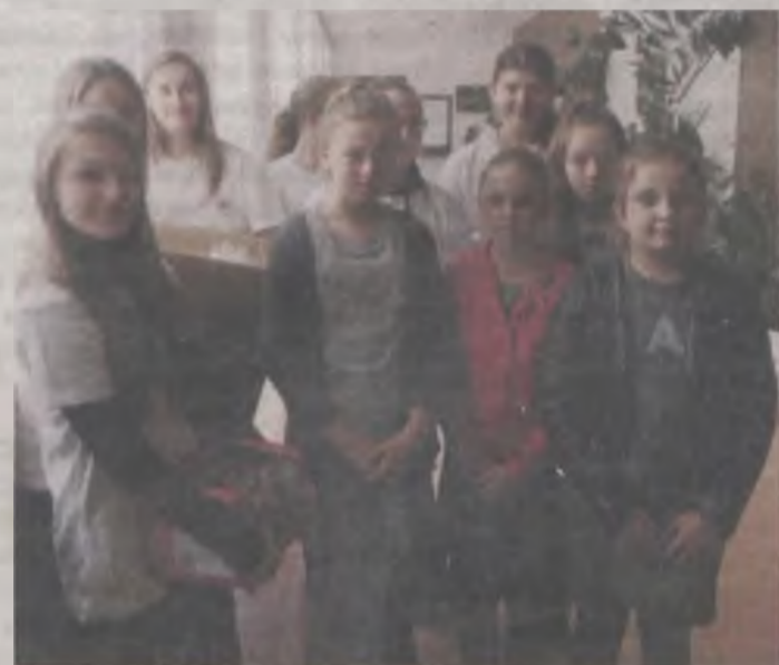
Wolontariuszki z upominkami w Skęczniewie.

Wolontariusze Szkolnego Koła PCK odwiedzili starszych, samotnych i schorowanych pensjonariuszy Domu Pomocy Społecznej w Skęczniewie. Uczniowie wystawili im przedstawienie jasełkowe i obdarowali upominkami. Było to 210 słodkich prezentów oraz piękne, kolorowe serduszka z masy solnej wykonane przez Kluby Wiejówka ze szkół: podstawowej w Cisewie i Zespołu Szkolno-Przedszkolnego w Słodkowie.