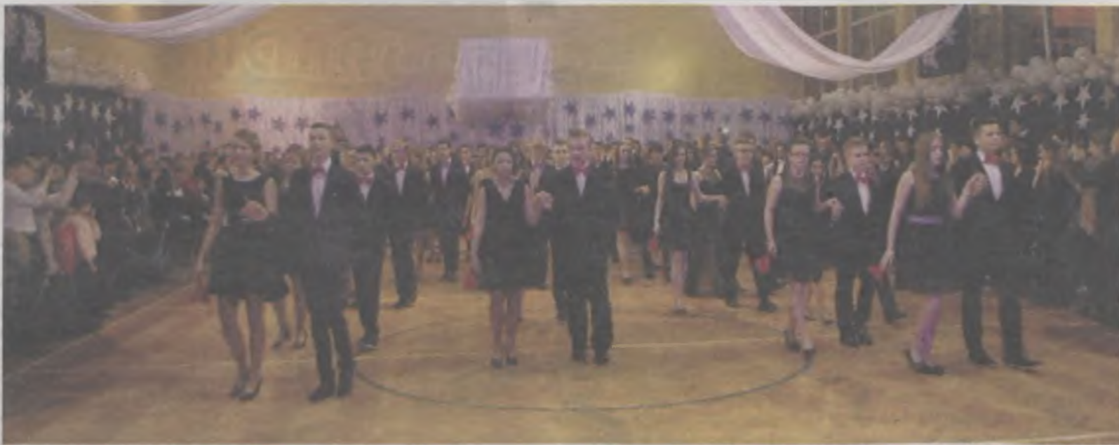
W tym roku poloneza w Gimnazjum nr 1 tańczyło 28 par.