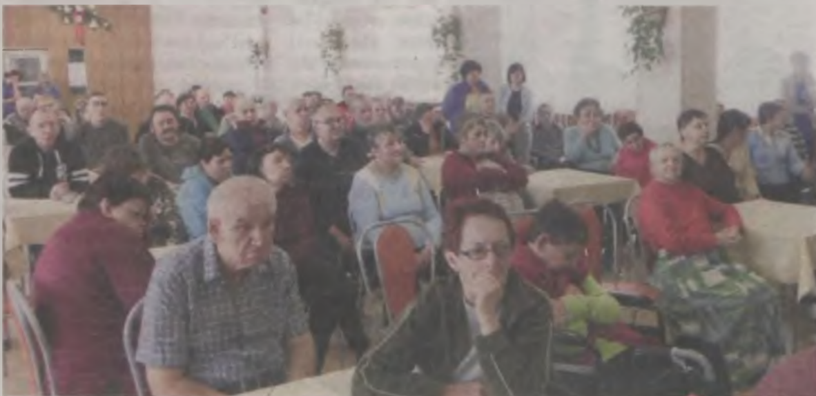
Pensjonariusze z radością przyjęli młodych gości.