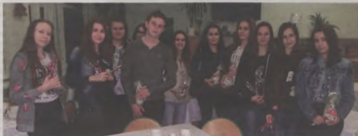
Impreza była znakomitą sposobem na wartościowe spędzenie wolnego czasu w czasie ferii zimowych oraz rozwijanie pasji literackich i filmowych.