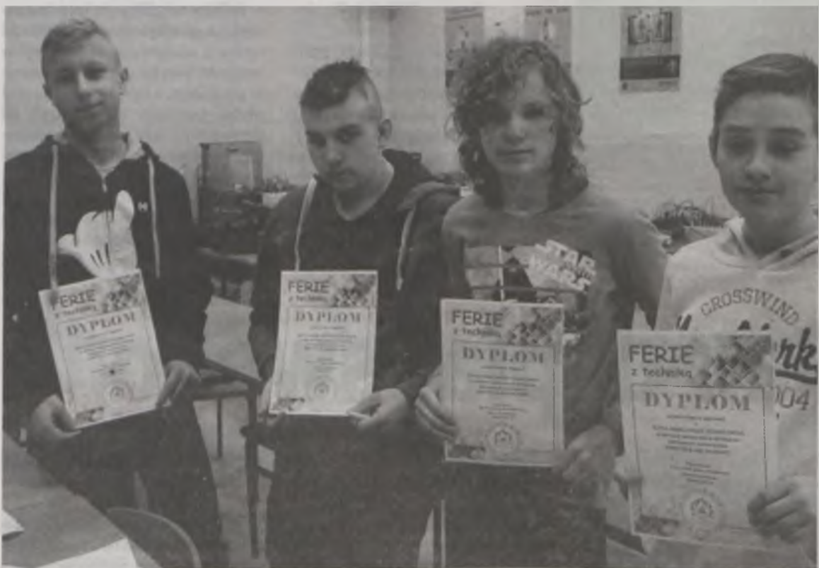
W nagrodę za udział w zajęciach, każdy gimnazjalista otrzymał dyplom oraz wylosowany przez siebie projekt techniczny o maszynach CNC, przygotowane przez uczniów trzeciej klasy technikum mechatronicznego w ramach zajęć z zawodowego języka angielskiego.