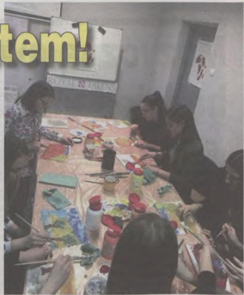
Podczas warsztatów plastycznych licealiści mierzyli się z tematem „Afryka-Plemię-Sahara”.

ków najprzyjemniejszą częścią zajęć na Uniwersytecie. Dwie studentki, które studiują na kierunku związanym z plastyką, opowiedziały nam o swoich pasjach związanych z malarstwem. Później rozdały wszystkim płótna i każdy z nas mógł wykazać się swoim talentem plastycznym. Tematyką naszej pracy była: „Afryka-Plemię-Sahara”. Każdy stworzył na swoim płótnie coś niezwykłego. Do naszej pracy mogliśmy wykorzystać farby akrylowe. Nawet nasza pani polonistka wykazała się swoimi umiejęt-