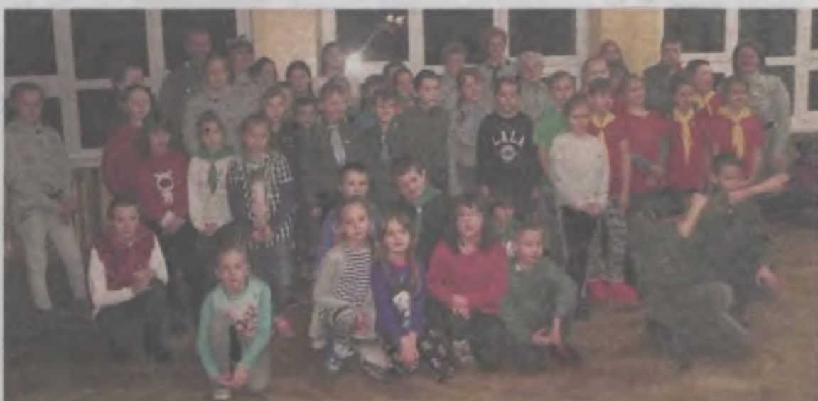
Uczestnicy spotkania przyjechali do Wilamowa by lepiej poznać się nawzajem i gromadzić wspólne doświadczenia.

Niektóre z dzieci, pomimo tego, że mieszkają w odległości kilkunastu kilometrów od Wilamowa, były tu po raz pierwszy. Dlatego jednym z kolejnych punktów programu był... - „zwiedzanie” mogłoby brzmieć nieco na wyrost - ...był po prostu spacer po okolicy. Jak się okazało, Wilamów poza stuletnim neobarokowym kościołem, zażytkowym młynem czy ciekawymi krajobrazami, może się pochwalić także obecnością prężnie