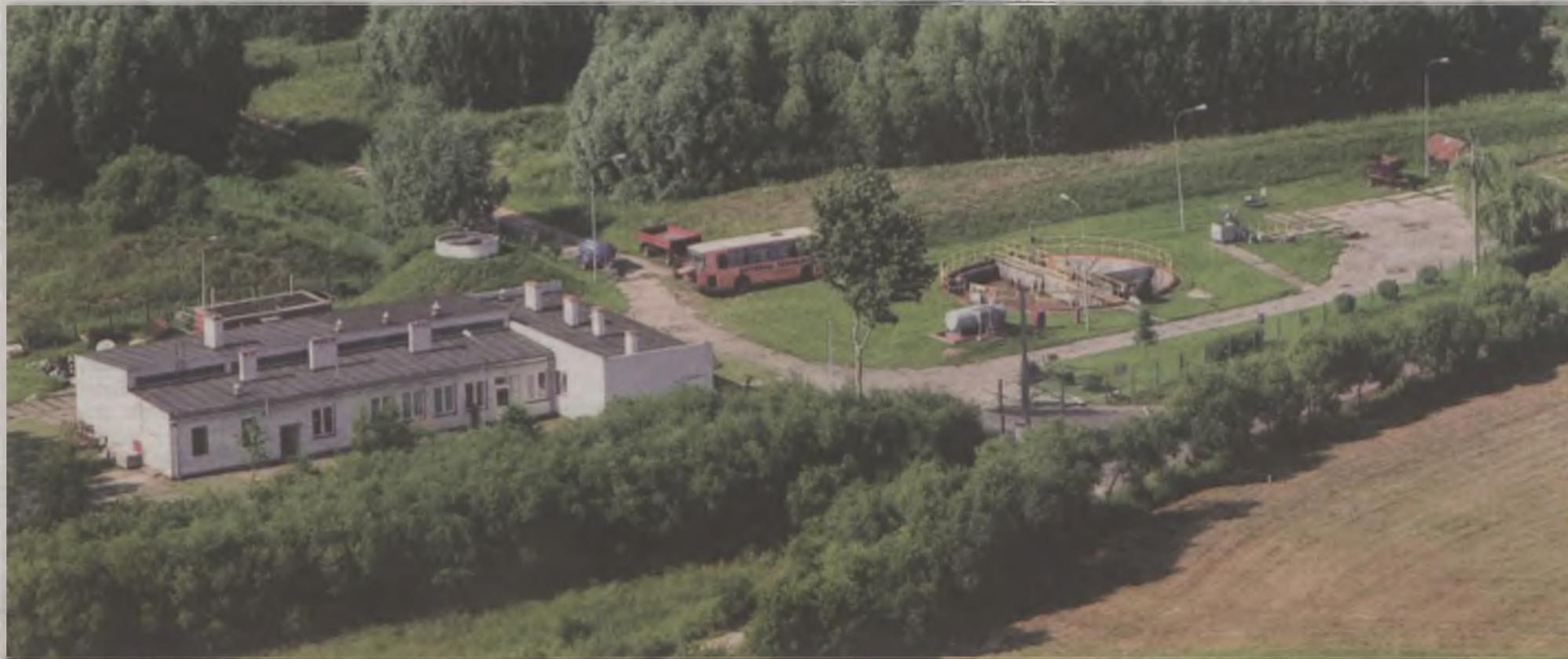
Oczyszczalnia w Dobrej wymaga kapitalnego remontu, który ma kosztować 3,8 mln zł.