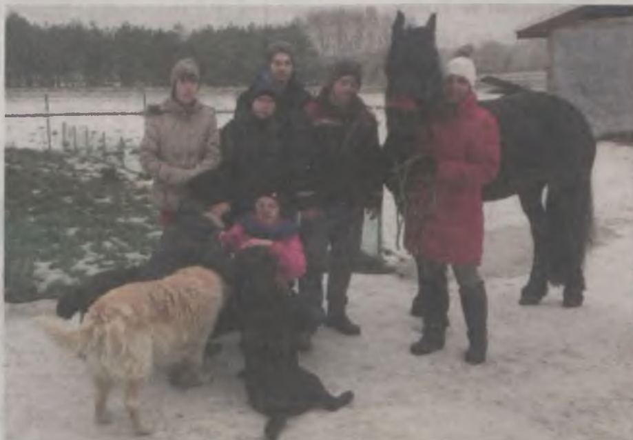
Psy Danuty Janiak uwielbiają dzieciaki, dlatego cały czas dotrzymywały im towarzystwa. Także klacz Fryzja lubi towarzystwo ludzi.

Jednak dla wycieczkowiczów największą atrakcją były konie. Młodzież poznała ich rasy i fachowe