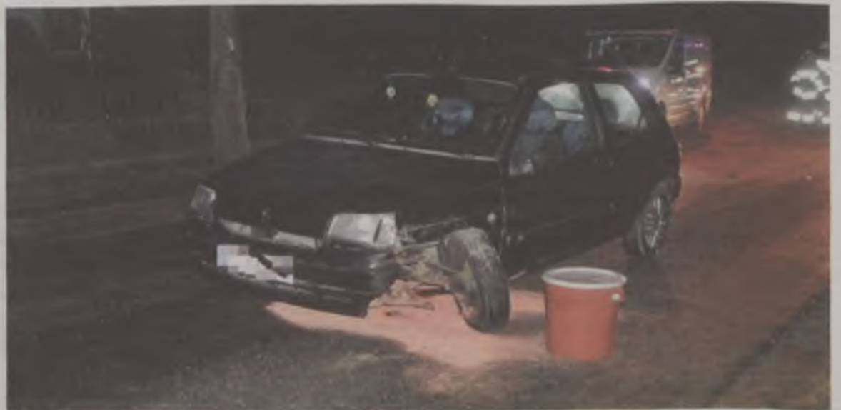
Do kolizji w Kotwasicach doszło z winy kierowcy renaulta clio, który podczas wymijania uderzył w toyotę avensis.

W sobotę, 4 lutego, po godzinie 18.00, w Kotwasicach w gminie Malanów, zderzył się renault clio z toyotą avensis ciągnącą przyczepkę. Na miejscu pojawili się strażacy oraz policjanci. Jak wynika z ustaleń funkcjonariuszy, jadący pierwszym z aut, nie dostosował prędkości do panujących na drodze warunków, i podczas wymijania toyoty doprowadził do kolizji. il