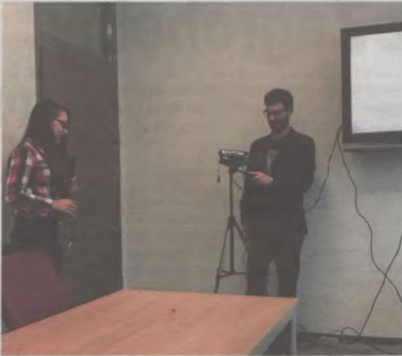
Podczas warsztatów licealiści mogli sprawdzić, jak to jest być reporterem. I jak mówią, nie było to wcale łatwe doświadczenie.