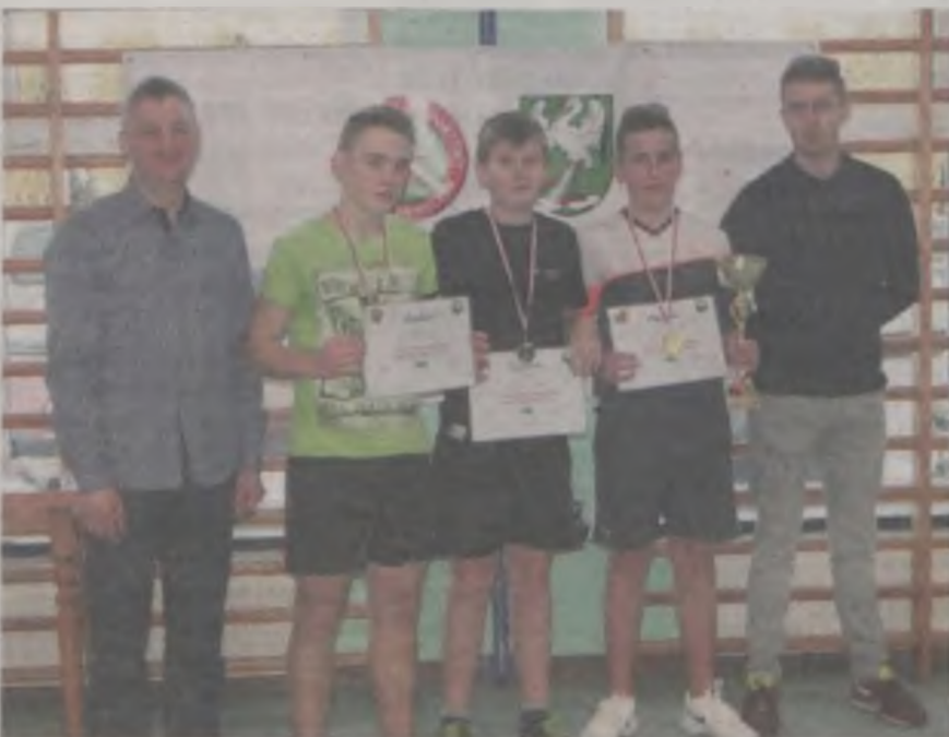
Trzej najlepsi w kategorii gimnazjalistów.