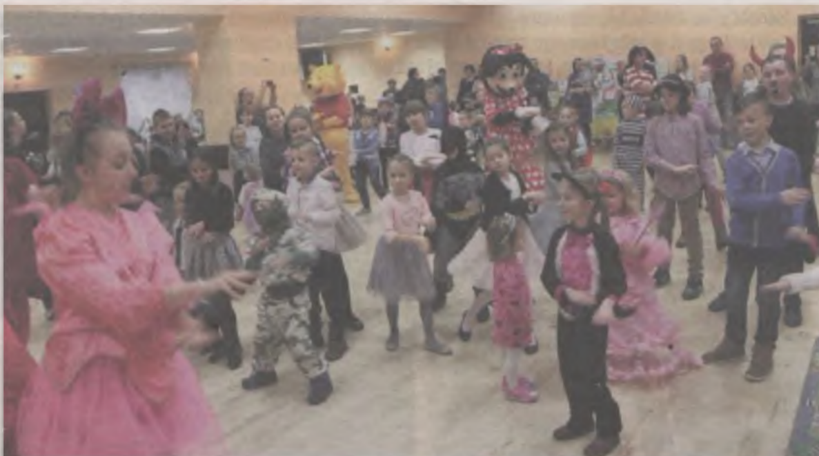
Podczas balu gier i zabaw dla dzieci nie brakowało.