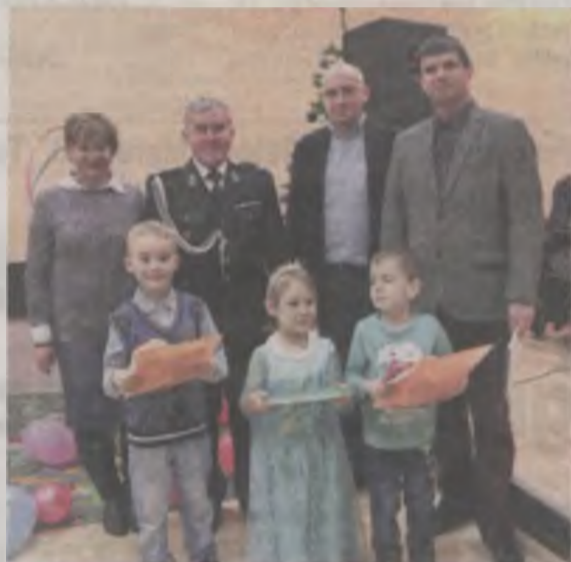
Przedшкоlaki nagrodzone w konkursie „Zapobiegamy Pożarom”.