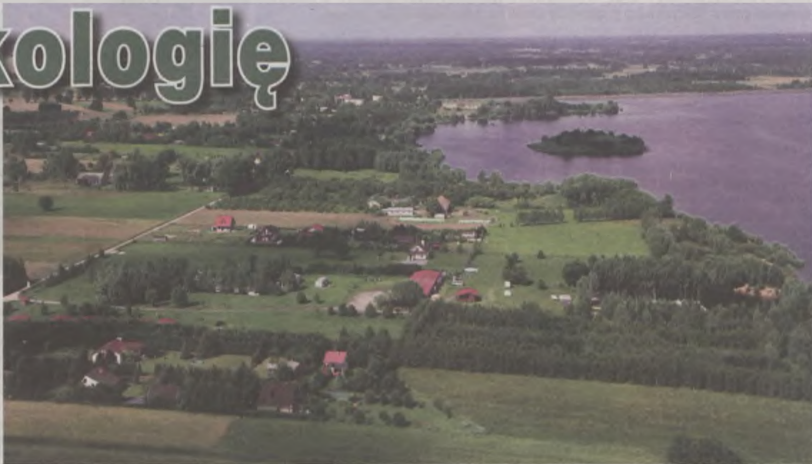
Te tereny nad zbiornikiem Jeziorsko zostaną skanalizowane.