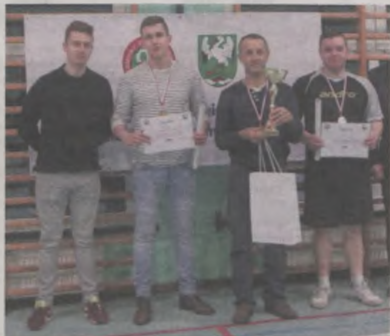
Pierwsza trójka turnieju seniorów.

W godzinach popołudniowych do stołów podeszli seniorzy. Do rywalizacji stanęły dwie panie w kat. do 50