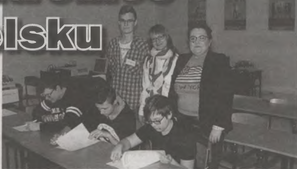
Spotkanie miało również motywować przyszłych inżynierów do dalszej nauki angielskiego.

Uczniowie rozwiązywali różnego rodzaju łamigłówki z dziedziny mechatroniki i robotyki. Okazuje się, że wiele pojęć związanych z branżą mechatroniczną funkcjonuje w języku polskim w identycznej lub bardzo zbliżonej formie, co może świadczyć o tym, że dzisiejszy świat coraz bardziej staje się globalną wioską. Duże zainteresowanie gimnazjalistów współczesnym rozwojem techniki sprawiło, że rozwią-