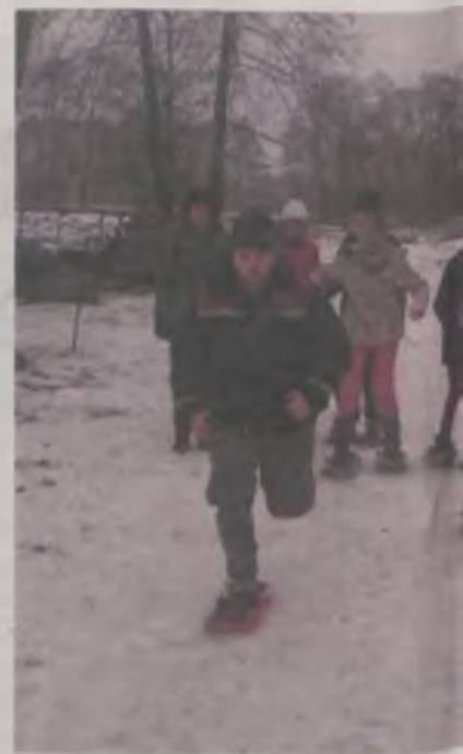
W biegu na raketach śnieżnych młodzieńczością fizyczną.