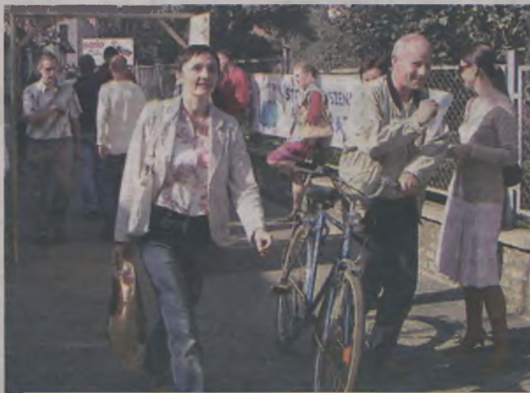
Symboliczne drzwi ustawiono na deptaku pomiędzy zieleniakiem a kościołem.

Lęki, depresje, nieradzenie sobie z stresem, w trudnych sytuacjach życiowych to choroby przełomu XX i XXI wieku. Stąd coraz częściej ludzie świadomie poszukują wsparcia