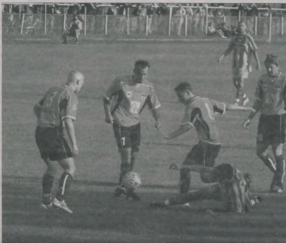
Pilkarze Tura Turek grając w lidze i Pucharze Polski stoczyli już 13 meczów, rozegranych w ciągu 8 tygodni.

Zarząd Konińskiego OZPN na swym posiedzeniu w dniu 16 sierpnia 2006 roku podjął decyzję w sprawie powiększenia stanu liczebnego rozgrywek w Klasie A w sezonie 2007/2008 do 16 drużyn. Awans w Klasie B w końcowej tabeli sezonu 2006/2007 uzyskują drużyny z miejsc od 1 do 4.