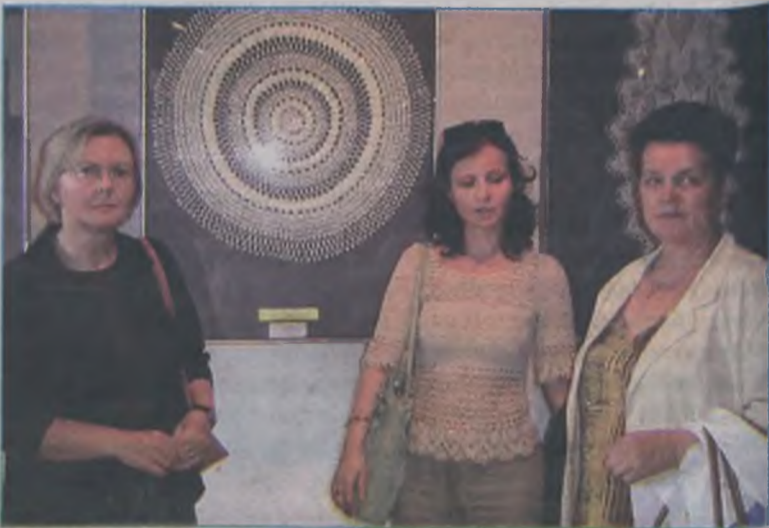
Prace prezentowane przez artystki z Turku i Konina bardzo podobały się komisji konkursowej.

Różnorodność wystawianych eksponatów i ich uroda jest na tyle wielkim atutem, by zaprosić do zwiedzania wystawy do dnia 26 listopada w Łodzi w salach Centralnego Muzeum Włókiennictwa. MJ