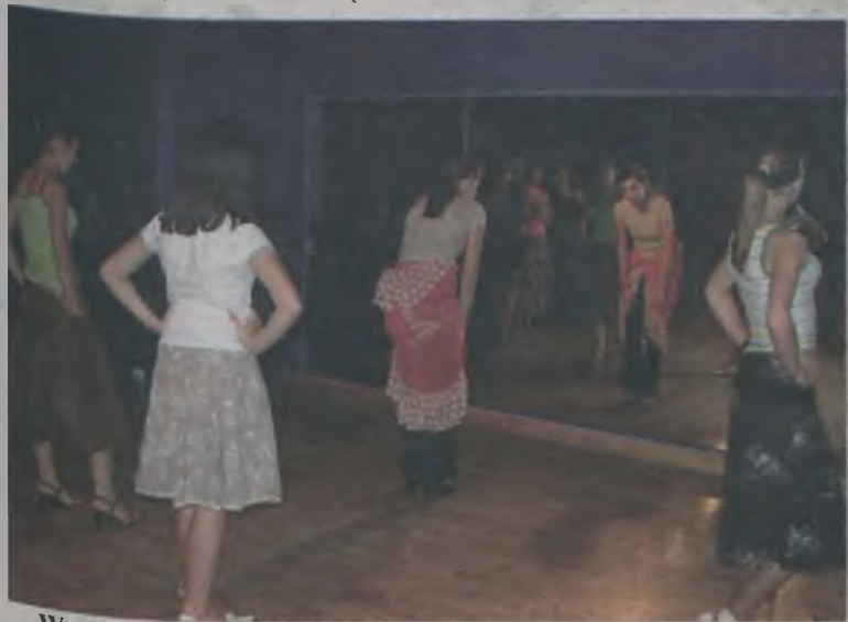
W zajęciach flamenco uczestniczyło 15 osób.

Czy będą następne kursy flamenco w Turku? Nikt nic nie obiecuje, ale uczestnicy liczą na powtórkę. aw