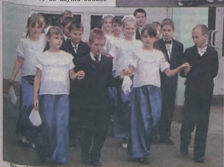
Na zakończenie uczniowie zatańczyli poloneza.

Oficjalne otwarcie było doskonałą okazją do tego, aby wszystkim, którzy przyczynili się do powstania nowej szkoły podziękować, co uczynili sami uczniowie, prezentując krótki, ale bardzo wymowny program artystyczny. Następnie przyszedł czas na zwiedzanie nowego obiektu, który bez wątpienia jest chlubą Dziadowic. MJ