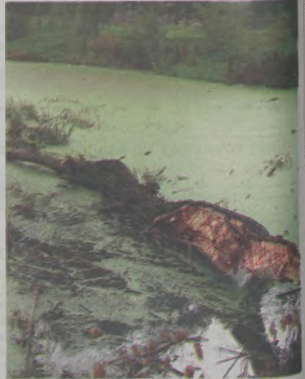
Jedno z obciętych drzew i gałęzie w stawie

W parku za Domem Kultury w Dobrej, ktoś obciął grube gałęzie kilku