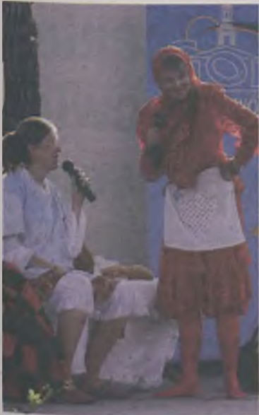
Bajkę o Czerwonym Kapturku wykonał kabaret „Guzik”.

20 lat minęło odkąd w dawnym kościele ewangelickim we Władysławowie rozpoczął swoją działalność Gminny Ośrodek Kultury.