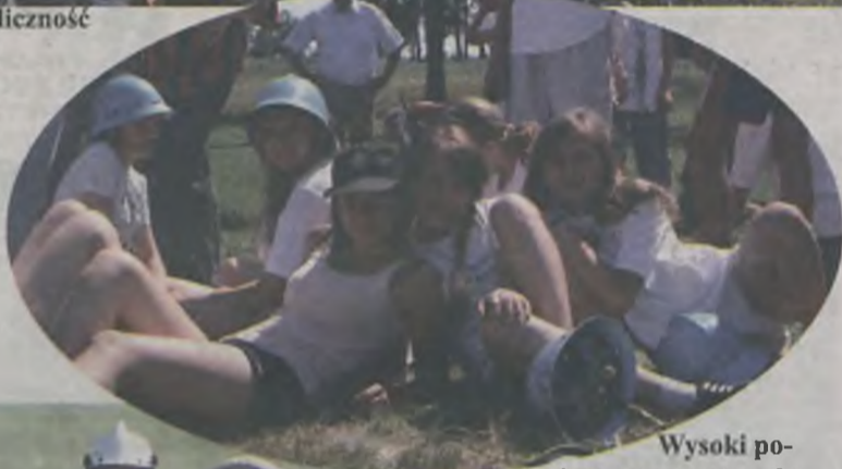
Wysoki poziom zaprezentowały drużyny żeńskie

Drużyny, jak co roku rywalizowały w dwóch konkurencjach: sztafecie oraz bojuwce. Pierwsza to bezbłędne pokonanie toru przeszkód, druga, to konkurencja bardziej widowiskowa,