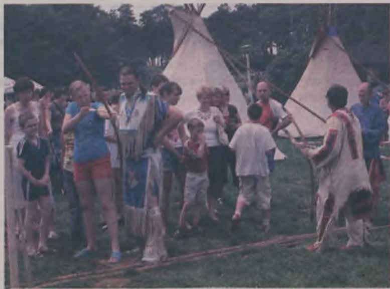
Strzelanie z łuku nie jest proste, ale mając jako instruktorów Indian, można bez problemu trafić w środek tarczy.

Doskonale zorganizowane stoisko gastronomiczne, z możliwością zrealizowania bonów konsumpcyjnych no i słońce, to wszystko miało wpływ na atmosferę festynu, który trwał do późnych godzin wieczornych. I zapewne to nie jedyny taki festyn na kopalnianym ośrodku w Ślesinie. ika