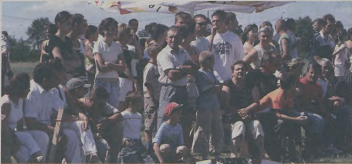
Zawody obserwowała liczna publiczność

Do końca trwała rywalizacja pomiędzy drużynami Ochotniczych Straży Pożarnych w gminnych zawodach pożarniczych, które odbyły się w niedzielne popołudnie, 2 lipca w Grąbkowie (gmina Malanów). Dopiero po bojuwce ostatecznie rozstrzygnięta się zacięta rywalizacja pomiędzy przedstawicielami OSP Malanów i OSP Bibianna.