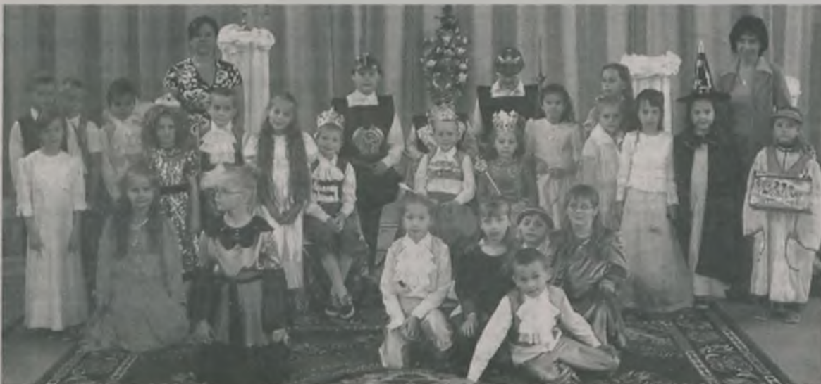
Scenografia przedstawienia wiernie odzwierciedlała dwór królewski: damy dworu, dworzan, rycerzy – właściwe dla baśniowych czasów Kopciuszka

Aktorskiego bakcyła połknęły podczas grudniowej wycieczki do teatru w Kaliszu. Uczniowie klas pierwszych Szkoły Podstawowej w Malanowie, bo o nich mowa, dzięki pracy koła teatralnego „Bajkoludy”, sami mogli przygotować swoje pierwsze przedstawienie - „Kopciuszka”.