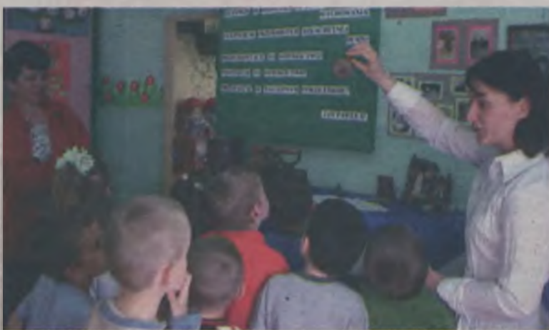
Dzieci miały okazję zapoznać się ze starymi sprzętami i rękodzielnictwem oraz historią regionu.

Ponad trzydzieści drużyn reprezentujących siedemnaście powiatów województwa wielkopolskiego wzięło udział w IV Wojewódzkich Zawodach Młodzieżowych Drużyn Pożarniczych, rozgrywanych w niedzielę, 25 czerwca na stadionie miejskim w Tuliszkowie.