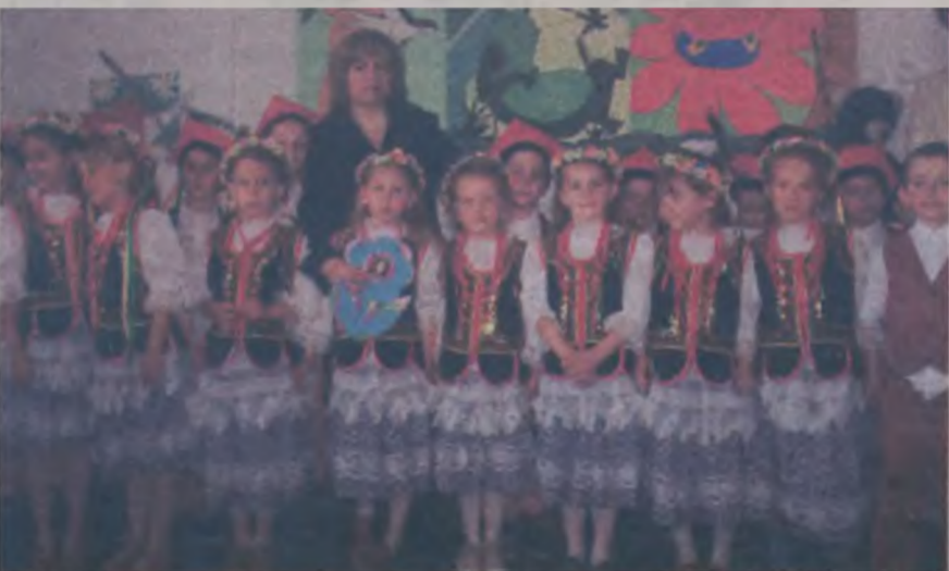
Przedszkolaki w strojach krakowskich zaprezentowały popularnego krakowiaka.