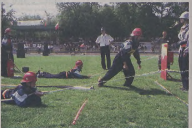
Dziewczęta w konkurencjach wymagających sprawności i organizacji były tak samo skuteczne, jak chłopcy.