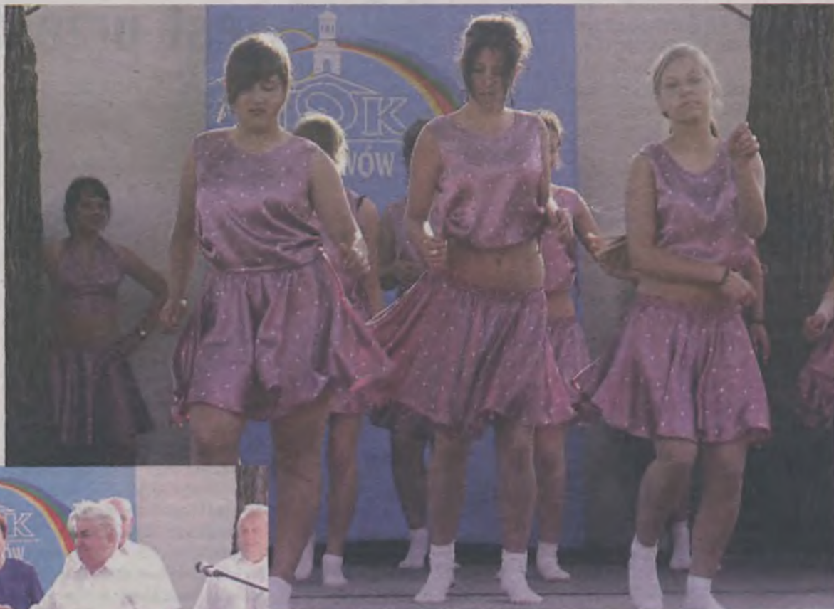
Na scenie wystąpiły najpierw zespoły taneczne, m.in. „FLESZ”.

Rocznice świętowano we Władysławowie hucznie. Z tej okazji pracownicy GOK zaprosili na spotkanie zarówno władze samorządowe, jak i wszystkich, którzy przez te 20 lat