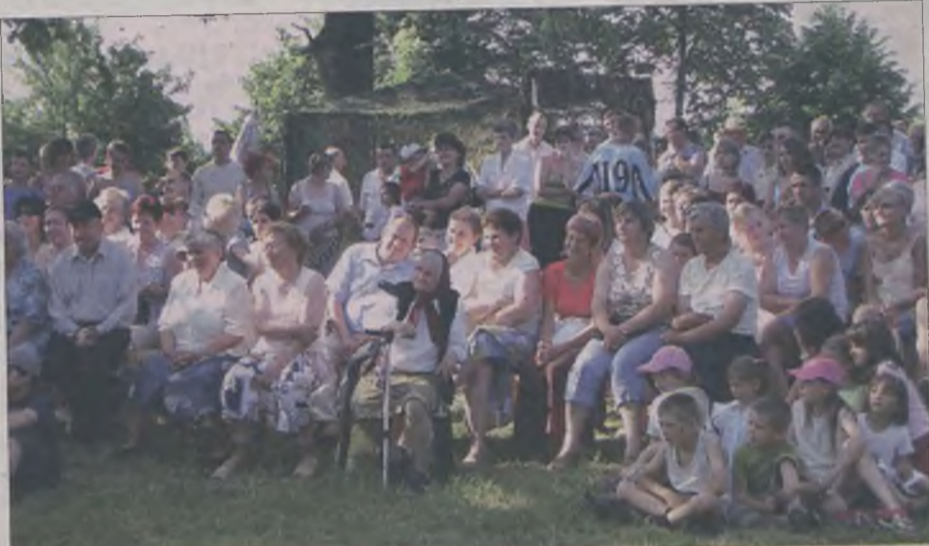
W festynie uczestniczyło około 400 osób

gromkimi brawami nagrodziła młodych artystów.