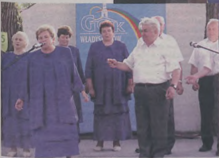
Zaśpiewało też „Wspomnienie” i „Wyszynianki”.