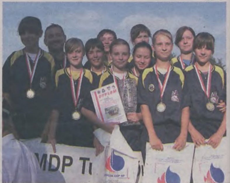
Młodzieżowa Drużyna Pożarnicza Dziewcząt z Tuliszkowa będzie reprezentowała powiat turecki na zawodach wojewódzkich.