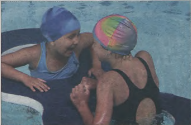
Dzieci korzystają ze wszystkich atrakcji pływalni.

Już od tygodnia trwają zorganizowane przez turecki OSiR zajęcia dla spędzających lata w mieście dzieci ze świetlic środowiskowych. W pierwszym tygodniu dzieci bawiły się na krytej pływalni, w drugim będą pluskać się na basenie odkrytym. Ale zajęcia to nie tylko zabawa. -Uczymy dzieciaki jak zachowywać się na pływalni i nad otwartą wodą. Jak najprościej można się uratować samemu, jeżeli w wodzie złapie nas choćby skurcz. Dzieci dowiadują się też jak postępować w sytuacjach zagrożenia i jak wezwać pomoc. Jestem zaskoczony tym jak dużo