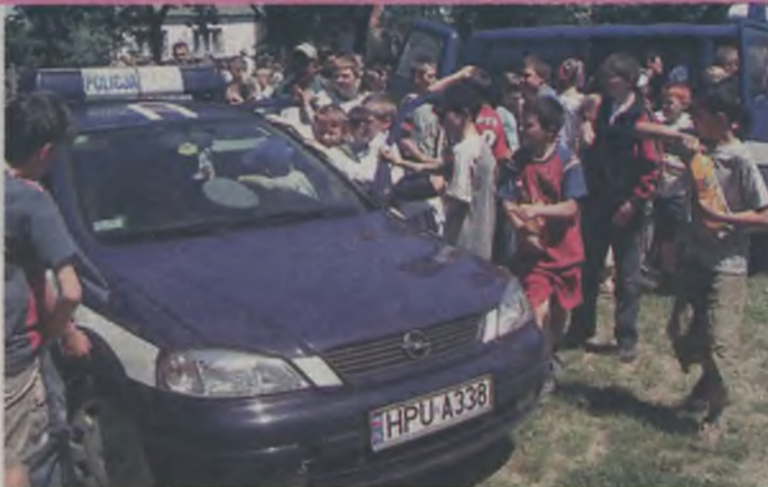
Wszyscy chcieli posiedzieć choć chwilę w policyjnym radiowozie.

lały się występy artystyczne uczniów szkół, zawody sportowe i plastyczne a także wiele innych atrakcji. Uczestnicy festynu z wielkim zainteresowaniem oglądali, przygotowany przez Ochotniczą Staż Pożarną, pokaz udzielenia pierwszej pomocy poszkodowanym w wypadku. Strażacy podkreślali, że dla życia są często decydujące pierwsze minuty po wypadku. Policjanci umożliwili natomiast wszystkim chętnym obejrzenie wnętrza samochodów i sprzętu.