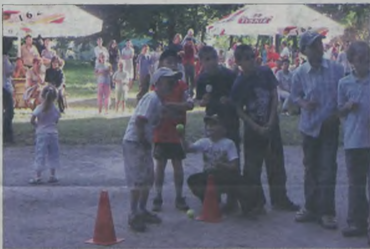
Festyn to wiele atrakcji ruchowych, w których uczestniczyły całe rodziny.