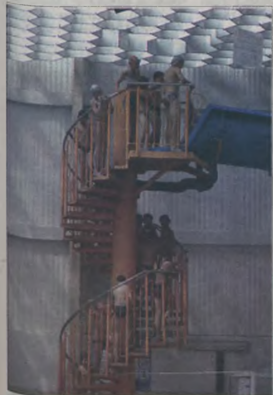
Kolejka na zjeżdżalnię wydłużała się z każdą chwilą.