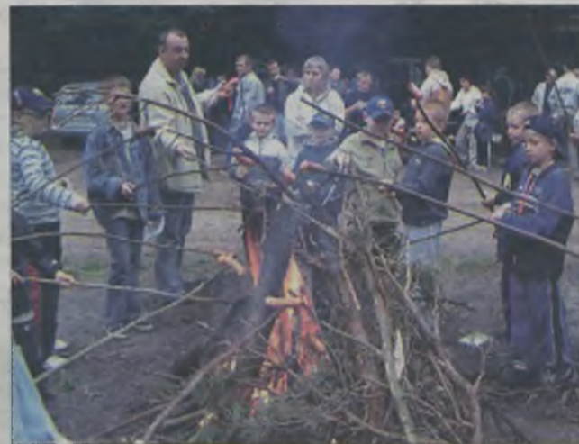
Imprezę zakończyło wspólne ognisko.