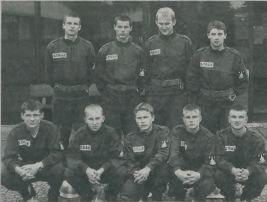
Drużyna z Głuchowa