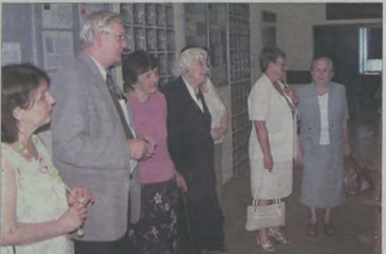
Bazylika licheńska to główny temat wystawy fotograficznej

Organizatorem wystawy jest Katolickie Stowarzyszenie „Civitas Christiana” w Turku przy współudziale Urzędu Miejskiego w Turku. Wystawę można oglądać do połowy sierpnia. mj