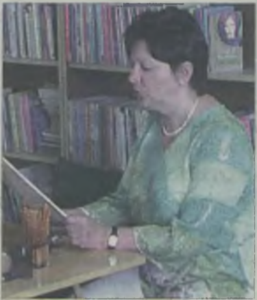
Pisarka podczas spotkania zapoznała młodzież ze swoimi książkami odkrywając tajniki twórczej pracy pisarza.

Pierwsza książka przeznaczona dla dzieci „Szczekająca szczeka Saszy” otrzymała wyróżnienie w konkursie Książka Roku 2005 organizowanym przez Polską Sekcję IBBY. MJ