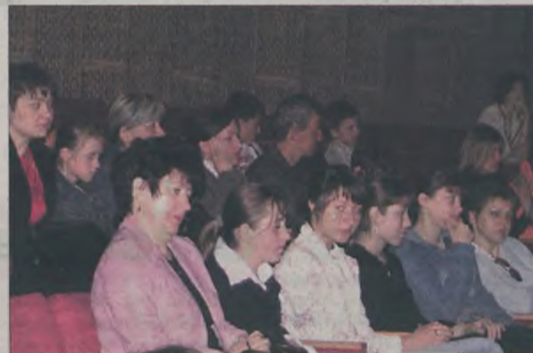
Młodzież chętnie uczestniczy w konkursach promujących zdrowy tryb życia.

W ramach ogłoszonego przez WHO hasła „Pracując dla zdrowia” odbył się również konkurs na wykonanie plakatu dla uczniów szkół gimnazjalnych