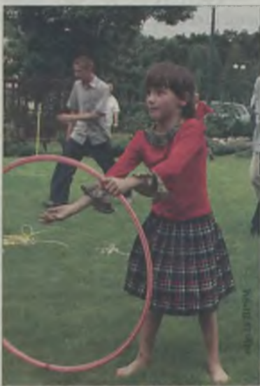
A po południu spędziły na grach i zabawach na placu przed domem pielgrzyma.

zaproszenie opiekunów sanktuarium - księży marianów. Przyjaźń między nimi a wspólnotą marianów zawiązała się na dobre przed rokiem. Pierwsi do domu dziecka przyjechali księża, w ubiegłą niedzielę nastąpiła rewizyta.