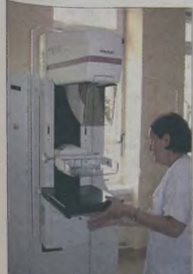
Od 1 czerwca ten mammograf wykonuje prześwietlenia w szpitalu w Turku.

Od 1 czerwca wykonujemy badania pacjentek. Mamy nadzieję, że będziemy mogli pomóc wszystkim chętnym kobietom – mówi Bogdan Kawka. aw