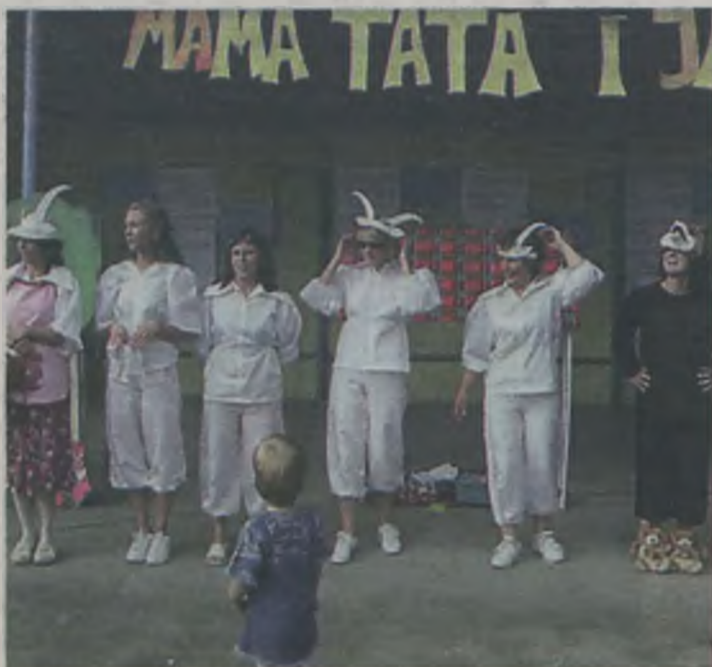
W imprezie festynowej uczestniczyły mamusie

Mama, tata i ja- to hasło przewodnie festynu zorganizowanego w sobotę, 17 czerwca przez Przedszkole w Tuliszkwie. Imprezie rodzinnej przyświecało nie tylko słońce, ale przede wszystkim wspólna wesoła zabawa.