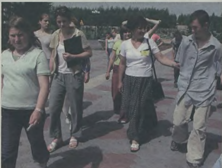
Dzieci maszerują na południową mszę św. w bazylice mniejszej.

Wychowankowie z Nowego Świata przyjechali do Lichenia na