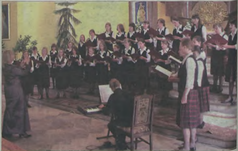
Przebieg koncertu chóralnego w kościele parafialnym w Malanowie odbył się już po raz drugi.