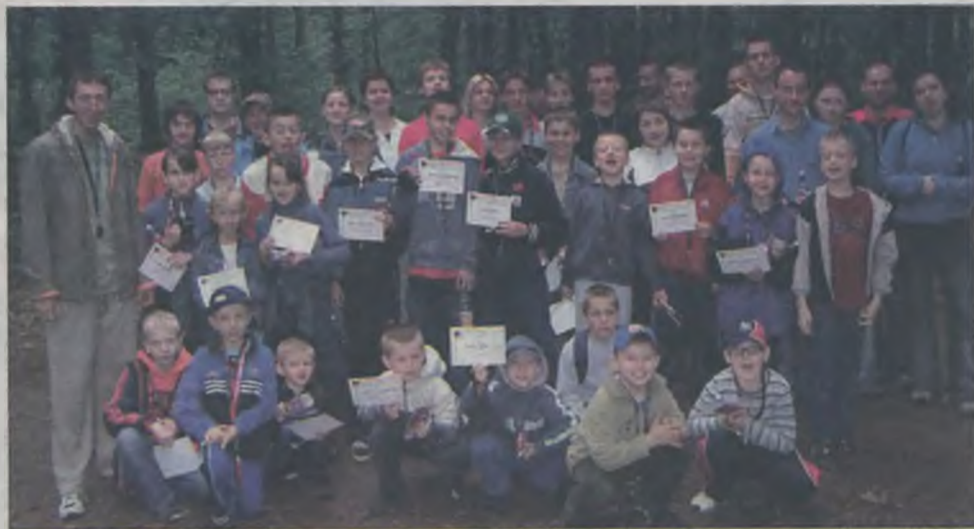
W spotkaniu uczestniczyli dzieci i dorośli.

Na terenie Nadleśnictwa Turek odbyły się III Spotkania z Oyama Karate. Uczestnicy imprezy podzieleni na 5 zespołów mieli do pokonania trasę z punktami kontrolnymi, na których musieli wykazać się znajomością wiedzy z biologii, technik i terminologii karate a także sprawnością fizyczną.