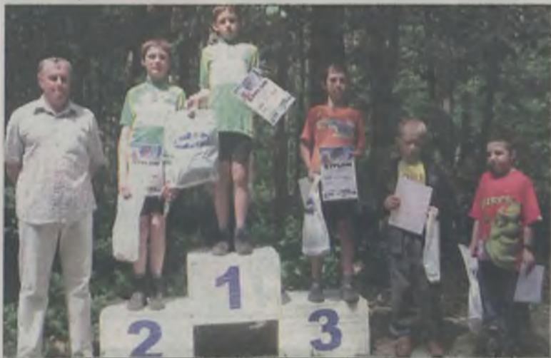
Medale otrzymali najmłodsi uczestnicy, którzy dzielnie pokonali leśne trasy.