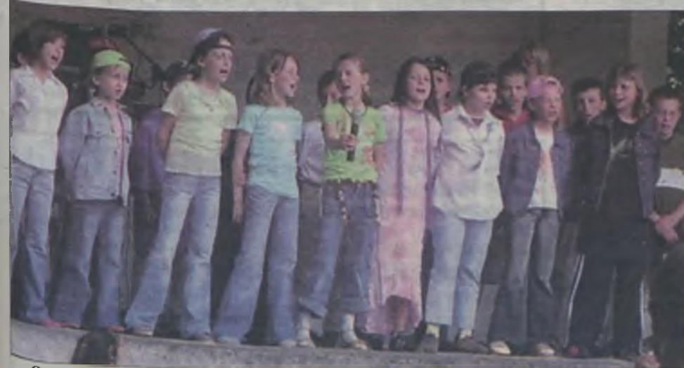
Oczywiście nie obyło się bez ciekawych występów artystycznych.