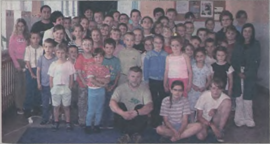
W Szkole Podstawowej w Chrzęblich gościł reżyser i scenarzysta serialu "Pensjonat pod różą", były uczeń tejże szkoły.

Spotkanie przebiegało w wyjątkowo miłej atmosferze a na zakończenie uczniowie i nauczyciele stanęli do wspólnej pamiątkowej fotografii. MJ