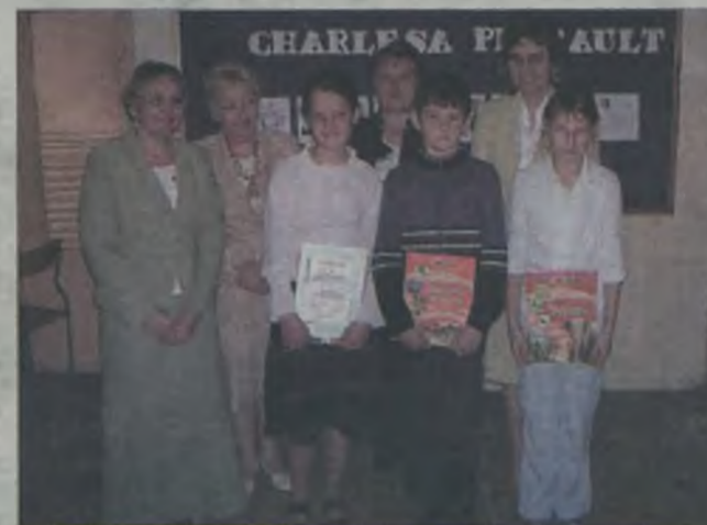
Najlepsi otrzymali nagrody książkowe