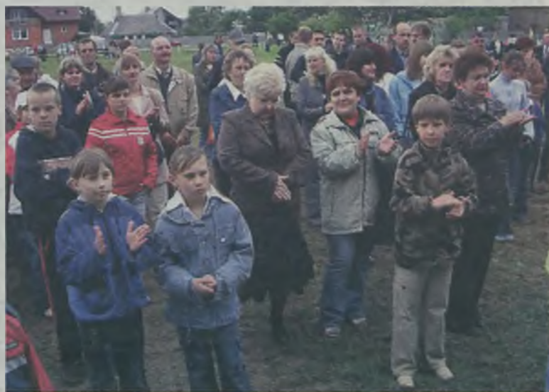
Mimo chłodu, dopisała festynowa publiczność.