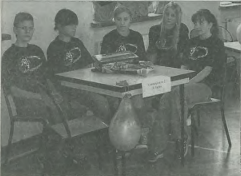
Z dziesięciu zaproszonych do konkursu gimnazjów, udział wzięły tylko dwa. Na zdjęciu u góry zwycięska reprezentacja gospodarzy konkursu – Gimnazjum nr 2 z Turku, a na dole - gimnazjaliści z Malanowa.

W drugiej edycji Powiatowego Konkursu Ekologicznego "Szlakiem pomników przyrody w naszym powiecie", zorganizowanego przez Gimnazjum nr 2 w Turku udział wzięły zaledwie dwie drużyny: reprezentacja gospodarzy oraz uczniowie Gimnazjum z Malanowa. Trzeci zadeklarowany zespół z brudzewskiego gimnazjum niestety nie dojechał.