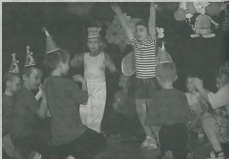
Bohater piosenki i patron przedszkola nr 6 – Kubuś Puchatek.

Lecznica dla Zwierząt sp. jawna Muszyński Jan i wspólnicy w Turku ul. Folwarczna 12 ogłasza, że w dniach 19-20.06.2006 w godz. od 9 - 18 odbędzie się szczepienie psów przeciwko wściekliznie cena szczepienia 15,00 zł