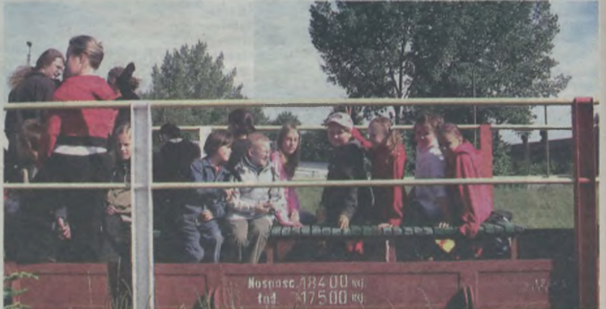
Kolejką do Zbierska pojechała przede wszystkim żadna przygód młodzież

Ci, którzy tylko chcieli przejechać się kolej-