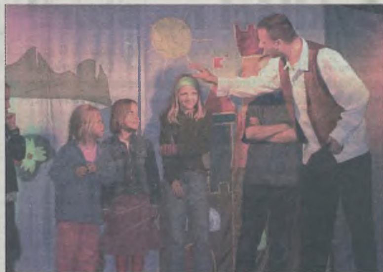
Dzieci aktywnie uczestniczyły w przedstawieniu pt. „Szewczyk Dratewka”