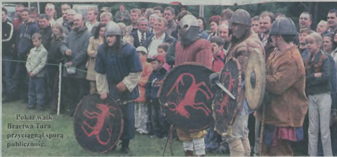
Pokaz walk Bractwa Tura przyciągnął sporą publiczność.