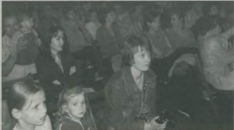
Występy przedszkolaków obserwowali rodzice, rodzeństwo i opiekunowie.

Organizatorami Przeglądu były Miejski Dom Kultury w Turku i wszystkie placówki biorące w nim udział.