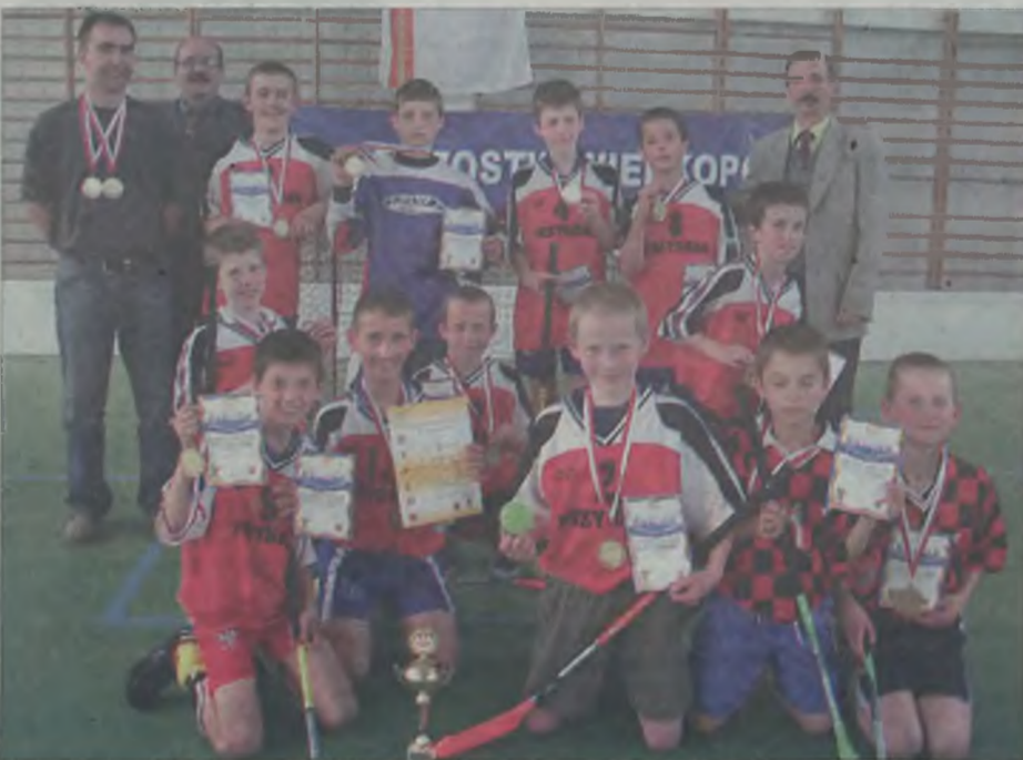
Brązowi medaliści Mistrzostw

Zmęczeni i podłamani poprzednim pojedynkiem przykonianie, nieomalże oddali dwie pierwsze tercje drużynie z poznańskiej SP 78., tracąc pięć bramek. Zryw w ostatniej tercji, przyniósł tylko dwa gole Ruska.