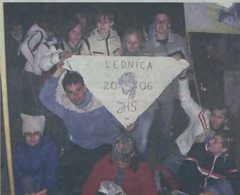
W spotkaniach lednickich uczestniczyli pielgrzymi z parafii św. Mikołaja w Brudzewie...