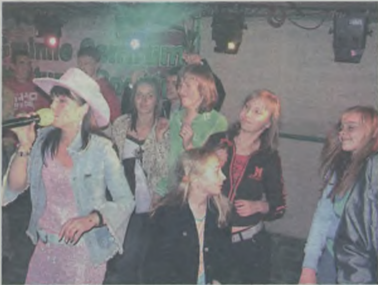
Występom zespołu „Rasputin” towarzyszyło wielkie szaleństwo i dobra zabawa.

Niestety, nienajlepsza niedzielna pogoda nie pozwoliła na zrealizowanie całego programu. Stąd też nie było zapowiedzianych lotów balonem oraz licytacji obrazów młodych malanowskich artystów. Ich prace zostaną wyeksponowane w Gminnym Centrum Kultury i Sportu, gdzie odbędzie się aukcja. W czasie Dni Malanowa pierwsze pieniądze na swoją działalność pozyskało Stowarzyszenie „Nadzieja”, sprzedając własne wypieki. MJ