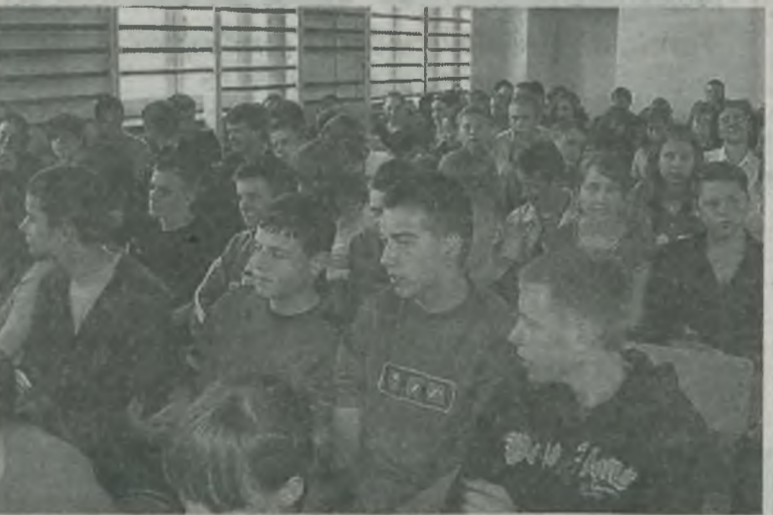
Znacznie liczniejszą grupą okazała się publiczność.

Z dwóch obecnych na konkursie drużyn, lepsza okazała się reprezentacja gimnazjum z Turku. -Tak naprawdę nie ma znaczenia kto zajął które miejsce. Najważniejsza jest wspólna zabawa i propagowanie tej tematyki