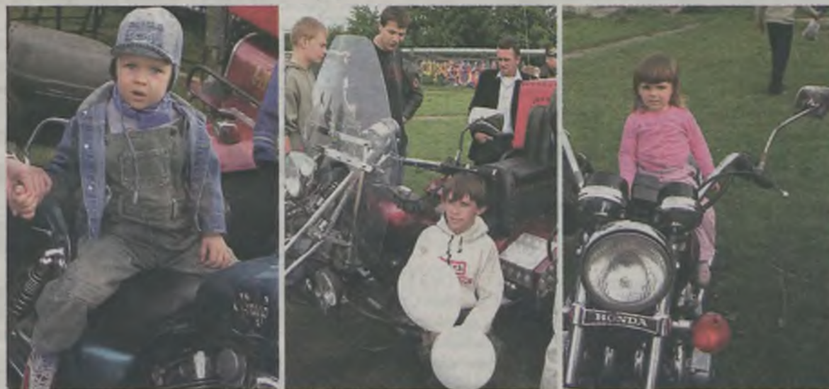
Niewątpliwą atrakcją festynu zarówno dla małych, jak i dużych było pojawienie się na murawie OSiRu motocykli „czoperów” z kaliskiego klubu cyklistów

Oprócz licznych konkursów dla dzieci, na scenie pojawiły się zespoły „Staszczyk” oraz „Ścigani”. Niewątpliwą atrakcją festynu zarówno dla małych, jak i dużych było pojawienie się na murawie OSiRu motocykli „czoperów” z kaliskiego klubu cyklistów. Każdy mógł nie tylko z bliska obejrzeć jednośladowe maszyny światowych marek, ale nawet usiąść i zrobić sobie pamiątkowe zdjęcie. Oczywiście najwięcej chętnych było wśród dzieci, które zaraz po zdjęciu biegly na dmuchany zamek.