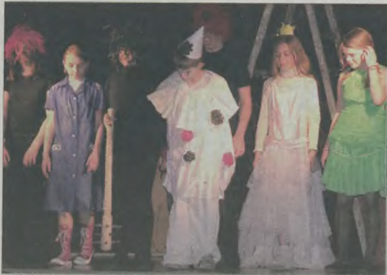
Zakochany Pajac, Królowa Siakataka i Diablica Aksamitka – główni bohaterowie zwycięskiego spektaklu

Tegoroczna “Turkolandia” to kolejny sukces Aksamitki i Zakochanego Pajaca, bohaterów przedstawienia przygotowanego przez Teatr “Szpilka” ze Szkoły Podstawowej nr 1 w Turku.