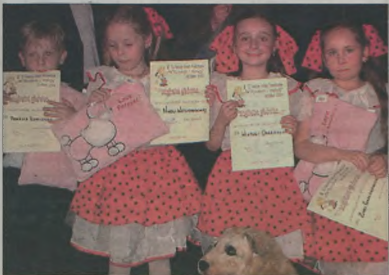
Zdobywczynie nagrody głównej z towarzyszącą jej na scenie zespołem