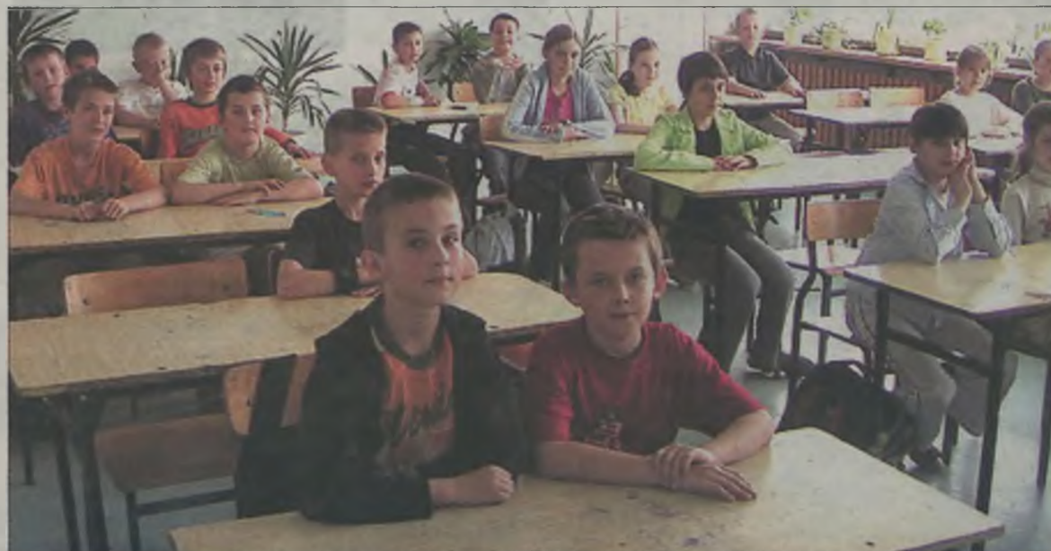
W antynikotynowych zajęciach profilaktycznych uczestniczyli uczniowie klas czwartych szkół podstawowych.