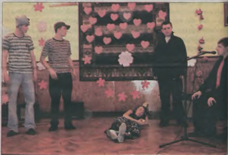
Na scenie pojawił się również kabaret „Memento Mori”.

Smaczku koncertowi dodał ostatni punkt programu, a mianowicie występ turkowskiego zespołu metalowego Power of Shit (polskiego tłumaczenia ze względu na bagaż kulturowy nie podajemy). Kapela bardzo szybko złapała do-