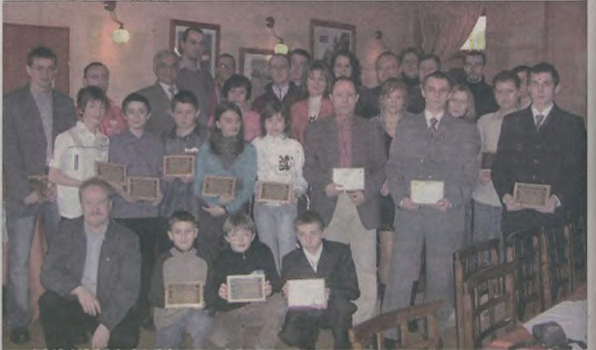
Pamiętkowe zdjęcie gości, władz klubu, trenerów wraz ze swoimi wychowankami.

Klub Sportów i Sztuk Walka ma za sobą udany rok, jego zawodnicy zdobyli między innymi drużynowe mistrzostwo Polski juniorów, wicemistrzostwo Polski seniorów, na ich koncie jest również puchar Polski, mistrzostwo Wielkopolski a także Pomorza i Kujaw, a jego zawodnicy startowali również w wielu międzynarodowych zawodach.