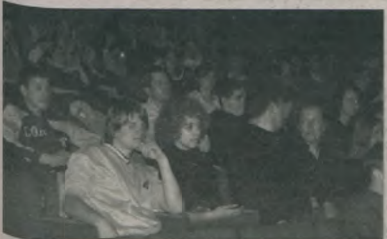
Noc Oskarowa po turecku odbyła się już po raz trzeci.

Ponadto dla kinomanów tradycyjnie już przygotowano quiz filmowy oraz bankiet oscarowy po turecku, czyli chleb ze smalcem, ciasteczka, kawę i herbatę. Impreza zakończyła się grubo po 2.00 w nocy. MJ