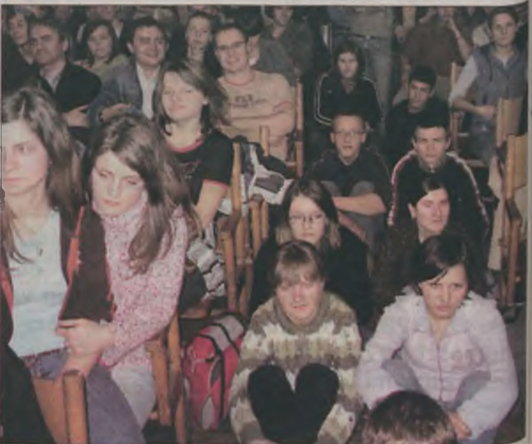
Na koncert o miłości przyszło blisko trzysta osób

-Dziś przekonaliśmy się, że do naszego liceum przyszedł fenomenalny rocznik. Świetni kabareciarze, znakomici wokaliści i profesjonalni muzycy. Tego nam właśnie było trzeba. Jesteśmy bardzo zaskoczeni- tak Galę podsumowała jedna z nauczycielek LO. BN, MJ