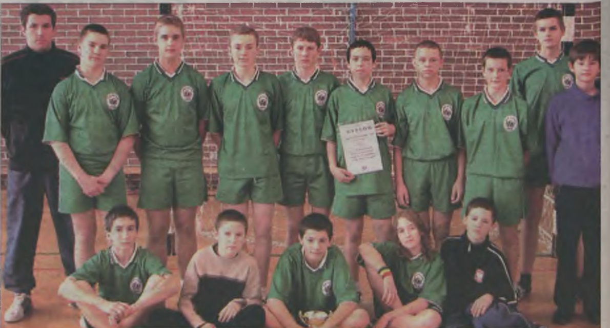
Mistrzami powiatu w piłce ręcznej szkół podstawowych została reprezentacja turkowskiej “Piątki”