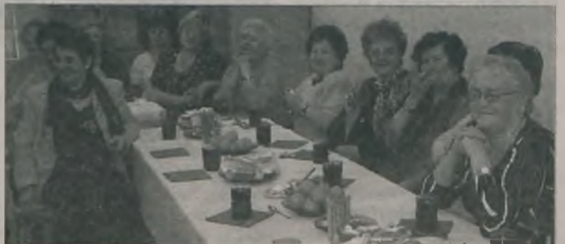
Po występach przedszkolaków członkowie „Promyka” miło spędzili czas przy herbatce i słodkościach

Stowarzyszenie „Tu i teraz” dziękuje przychylnym kwaciarniom za kwiaty подарowane z okazji Święta Kobiet. MJ