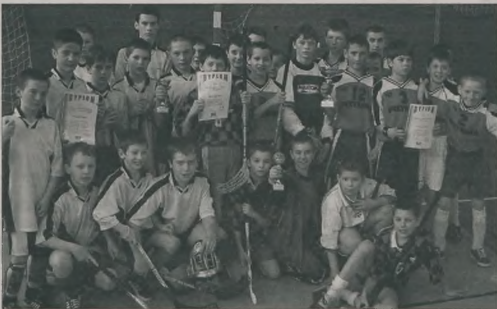
Najlepsi unihokeiści w powiecie