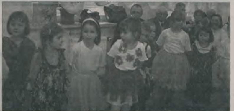
Dla seniorów z „Promyka” wstąpili mali artyści z Bajkowego Przedszkola.

były też wierszyki i piosenki, których bohaterkami były wszystkie kobiety. Podsumowaniem występów były gorące życzenia i kwiatki, które przedszkolaki wręczyły zado-