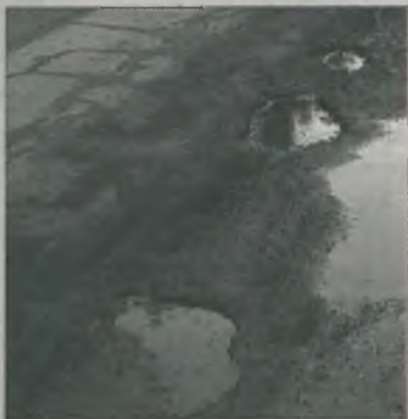
Dziura goni dziurę