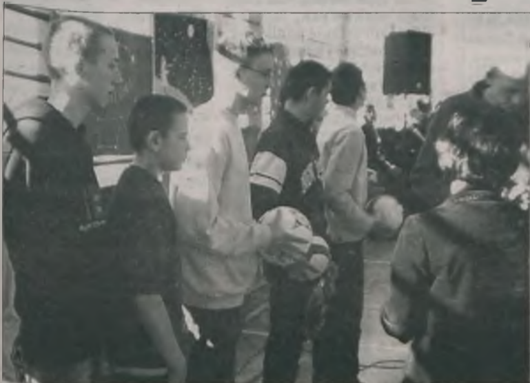
Mistrzostwa szkoły odbyły się w kategoriach dziewcząt i chłopców.

W okresie ferii zimowych w Gimnazjum nr 2 w Turku odbyły się mistrzostwa szkoły w dwójkach siatkarskich dziewcząt i chłopców.