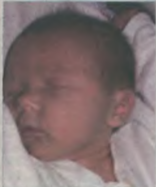
...Jurkiewicz córka Moniki ur.2 marca, godz.3.16 waga 2960, długość 50cm