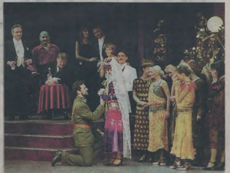
Spektakl Emmericha Kalmana to jedna z najpopularniejszych i najczęściej wystawianych operetek, które wystawiane są na światowych scenach muzycznych

Duże zainteresowanie wyjazdem jest przykładem, iż istnieje potrzeba organizacji wielu imprez kulturalnych, związanych z kulturą przez duże „K”. Potwierdza to prężnie działające koło w Malanowie i liczba chętnych zapisujących się na takie wyjazdy. Nie oznacza to, że czas spędzony wspólnie tylko przy kawie i cieście jest stracony. mj