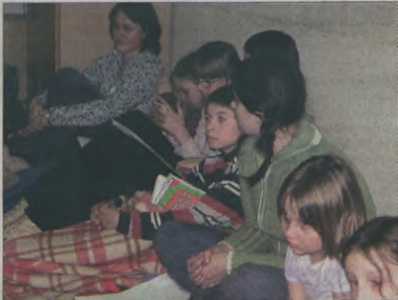
Impreza cieszyła się dużym zainteresowaniem wśród dzieci i młodzieży.