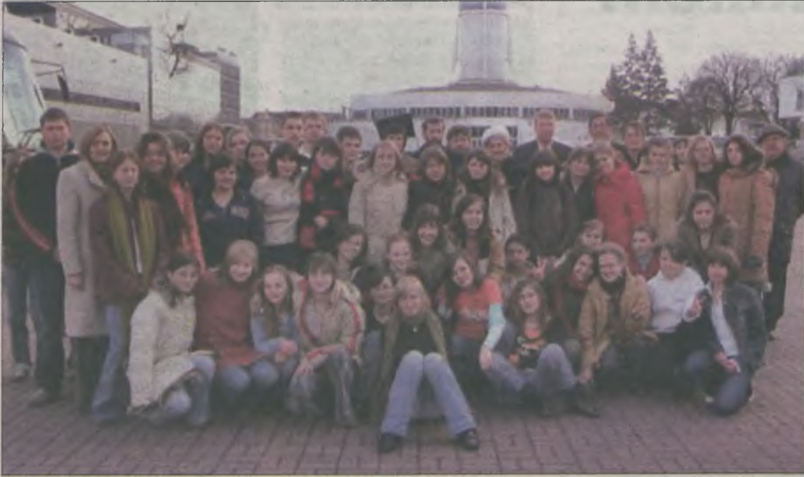
Reprezentacja Gimnazjum w Malanowie podczas X Targów Edukacyjnych w Poznaniu.

W sobotę 4 marca 2006 r. liczna grupa uczniów z Gimnazjum w Malanowie pod opieką nauczycieli, rodziców, radnych gminy Malanów i dyrekcji szkoły uczestniczyła w X Targach Edukacyjnych w Poznaniu. Wyjazd zorganizowany był w ramach projektu „Szkoła Marzeń”.