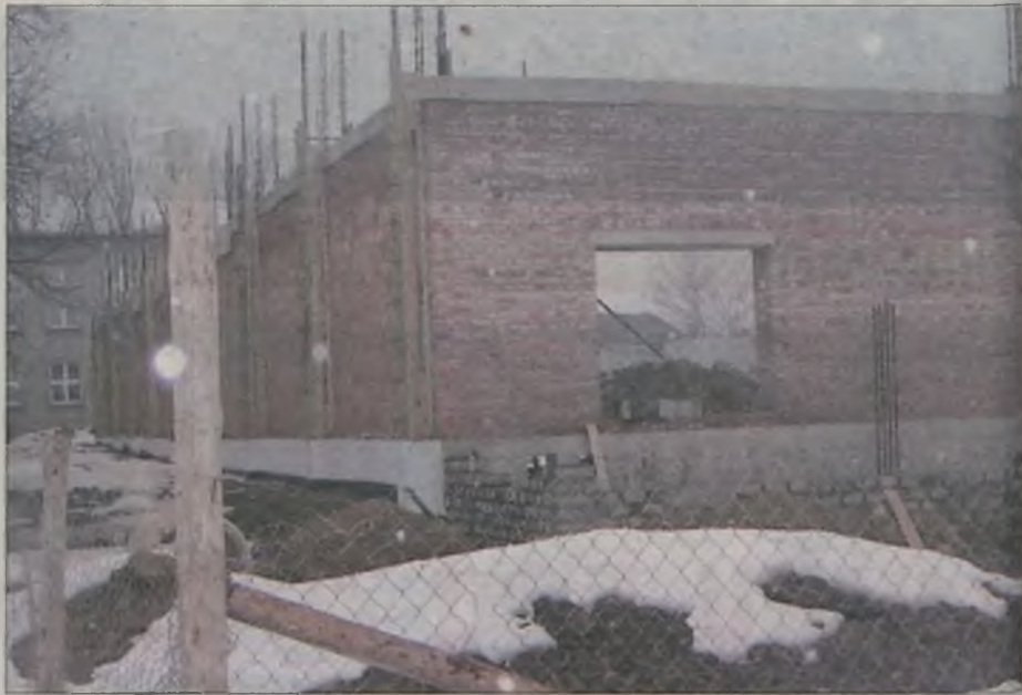
Decyzja Wojewódzkiego Sądu Administracyjnego wstrzymała prace budowlane. Teraz od wojewody będzie zależało, kiedy ruszą one ponownie.

Obecnie zakończono już najbardziej pracochłonny etap budowy – gotowe są instalacje podziemne, nad ziemią wyrosło pierwsze piętro murów, czekających na stropy. Zakończono również przebudowę przyszkolnej kotłowni, która w przyszłości ma także ogrzewać