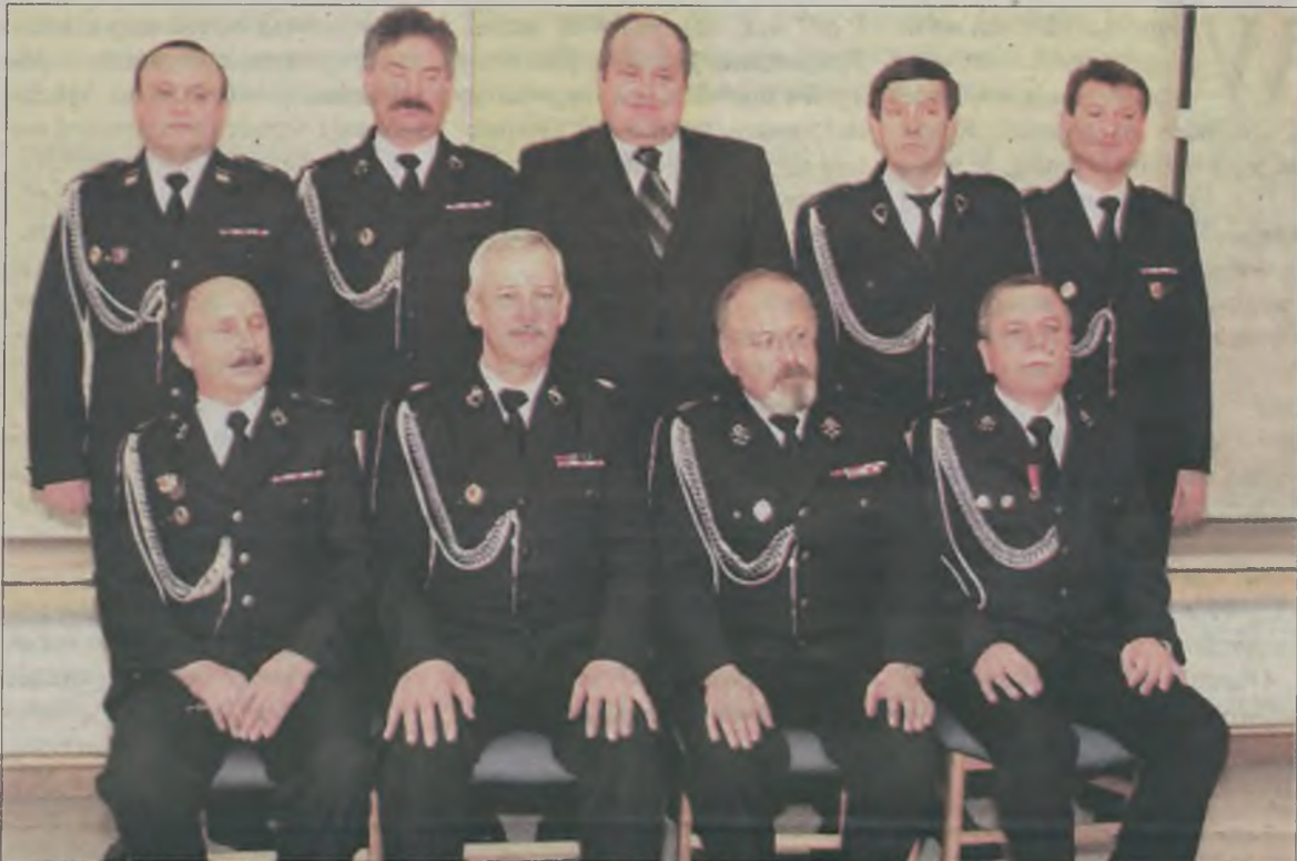
Najważniejszym punktem zebrania strażaków był wybór nowego zarządu.

Blisko trzystu strażaków z Kopalni Węgla Brunatnego „Adamów” uczestniczyło w corocznym spotkaniu sprawozdawczo wyborczym, które odbyło się w piątek 3 marca, w klubie Barbórka w Turku. Podczas spotkania strażacy podsumowali działalność minionych pięciu lat oraz wybrali zarząd na okres kolejnej kadencji.