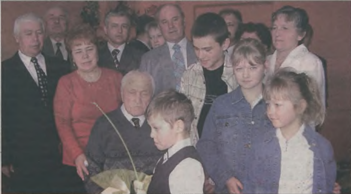
Jubilat z najbliższą rodziną

stał na roboty do Niemiec. Dochował się trzech synów, córki, dziewięciorga wnucząt i dziewięciorga prawnucząt. Żonę odprowadził na wieczny spoczynek przed ośmioma laty. Od około roku poważnie niedowidzi i ma problemy z poruszaniem się, ale jego umysł furk-