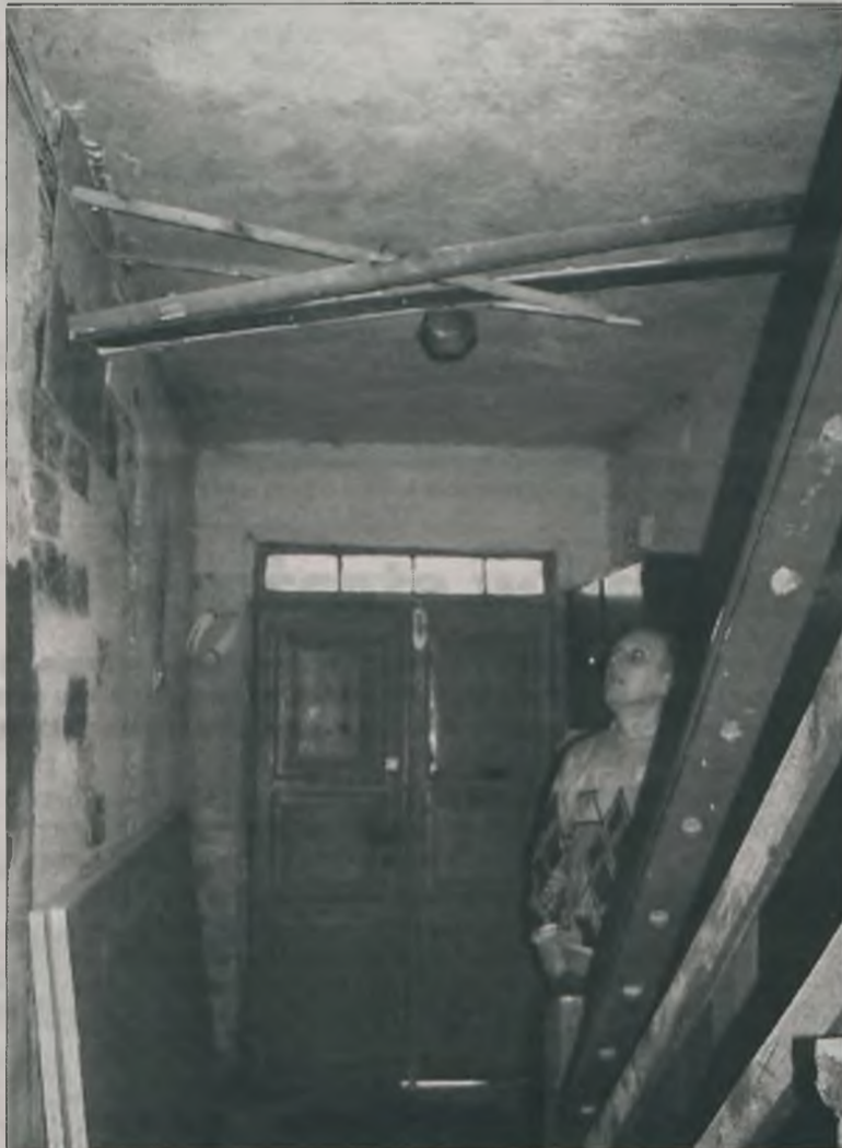
Jak można było się nie bać mieszkać w takim budynku, w którym stropy zabezpieczone są deskami i podpierane legarami?

Na szczęście zajęła się tym turkowska policja. Dochodzenie jakie wszczę-