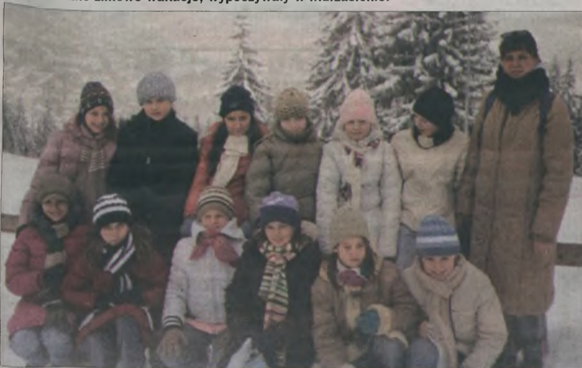
Jedną z wielu atrakcji zimowiska było podziwianie pięknej zaśnieżonej panoramy Tatr

Czterdzieścioro dzieci ze szkół podstawowych wyjechało na zimowiska zorganizowane przez Ośrodek Wsparcia dla Osób Problemami Uzależnień w Turku. Dzieci zakwalifikowane na tegoroczne zimowe wakacje, wypoczywały w Murzasichle.