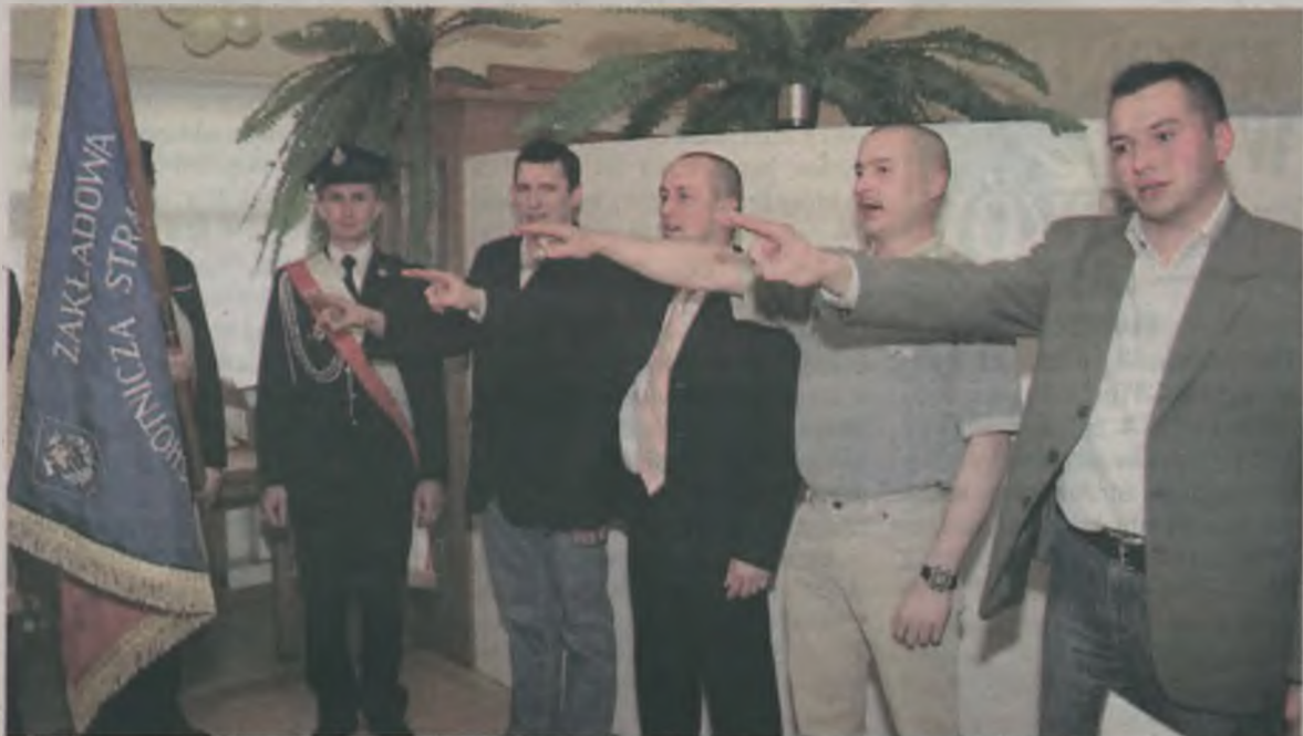
W szeregi strażackie wpisało się nowych dwudziestu sześciu ochotników, którzy zgodnie z tradycją złożyli uroczyste ślubowanie