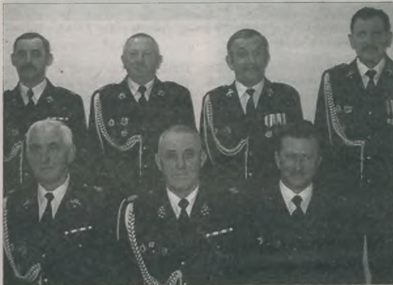
Zarząd OSP w Kowalach Pańskich