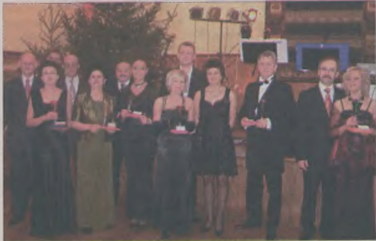
Najbardziej hojnym parom wręczono puchary „Super Sponsora”...

Już po raz dziesiąty na tradycyjnym Balu Absolwenta spotkali się członkowie Koła Wychowanków Gimnazjum i Liceum w Turku oraz miłośnicy i sympatycy turkowskiego „Ogólniaka”, najstarszej szkoły w naszym mieście. Bal ten to nie tylko impreza dobroczynna, ale potwierdzenie tego, że pielęgnowanie znajomości z czasów licealnych to piękna tradycja, którą warto i trzeba podtrzymywać.