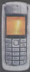
Nokia 6020 1zł brutto