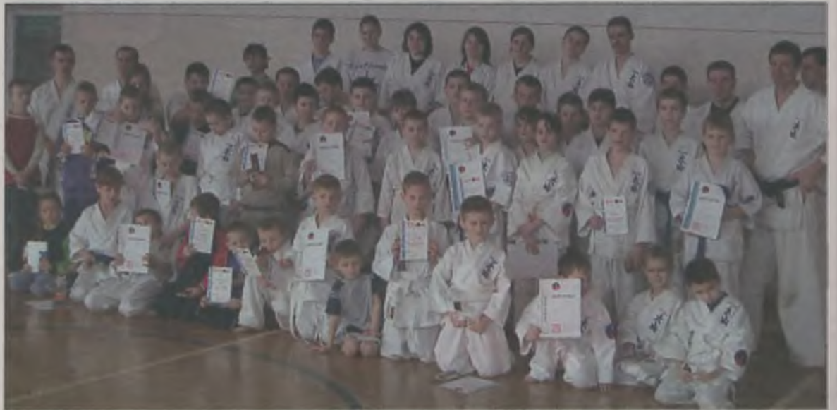
Uczestnicy zimowych zabaw z Oyama Karate.

Turkowski Klub Oyama Karate na czas ferii zimowych przygotował dla dzieci i młodzieży wiele różnych zajęć sportowo-rekreacyjnych. Podsumowaniem zajęć była impreza na pływalni krytej, która odbyła się w sobotę, 25 lutego.