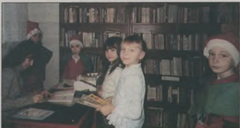
Biblioteka szkolna w Krwonach zyskała nowych czytelników.

W uroczystości brały udział skrzaty czyli starsi uczniowie, które twierdziły, że mieszkają w bibliotece i wiedzą wszystko o książkach. Poinformowały on swoich młodszych kolegów i koleżanki o zasadach wypożyczania książek z biblioteki. Ponadto polecieli pierwszokom tytuły, które powinny koniecznie przeczytać. Skrzaki wypowiedziały się również w imieniu zgromadzonych w bibliotece książek, przekazując wiedzę o tym, co wolno, a czego nie wolno z nimi robić, aby długo służyły jak największej liczbie czytelników.