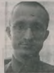
Chciałbym pogratulować samorządowcom z gminy Brudzew, za przebieg inicjatywy dotyczącej

Na zakończenie samorządowcy z gmin Brudzew, Przykona, Malanów, Kawęczyn, Turek oraz Starostwa podjęli decyzję, że spotkają się ponownie w Starostwie Powiatowym w Turku, gdzie podejmą decyzję o przystąpieniu do Programu LEADER+.