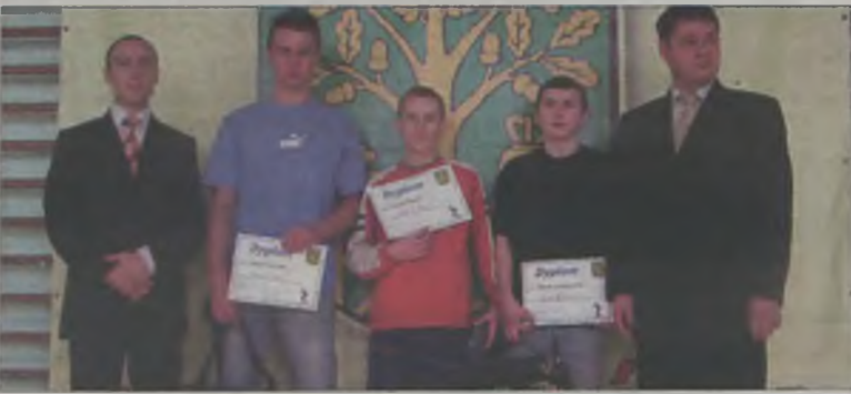
Nagrody dla najlepszych ufundował Urząd Gminy w Malanowie.

Po raz czwarty w niedzielę, 26 lutego w Malanowie odbyły się Gminne Mistrzostwa w Tenisie Stołowym. Impreza ta stała się już swoistą tradycją, dlatego cieszy się tak dużym zainteresowaniem wśród dzieci, młodzieży i dorosłych.