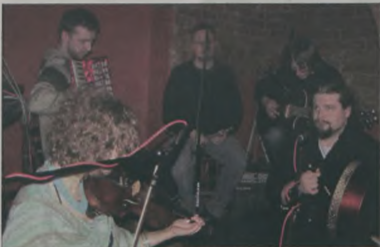
Irlandzkie klimaty wprowadził zespół Fun Glass z warszawy.

Blisko sto osób uczestniczyło w irlandzkiej biesiadzie, którą dla turkowie zorganizowano w piwnicy Art Cafe. Koncert tradycyjnej muzyki irlandzkiej po raz pierwszy w naszym mieście zaprezentowała warszawska grupa Fun Glass.