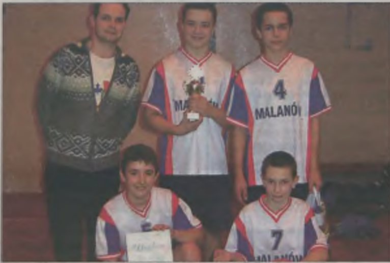
Reprezentacja Malanowa zdobyła dobre trzecie miejsce.