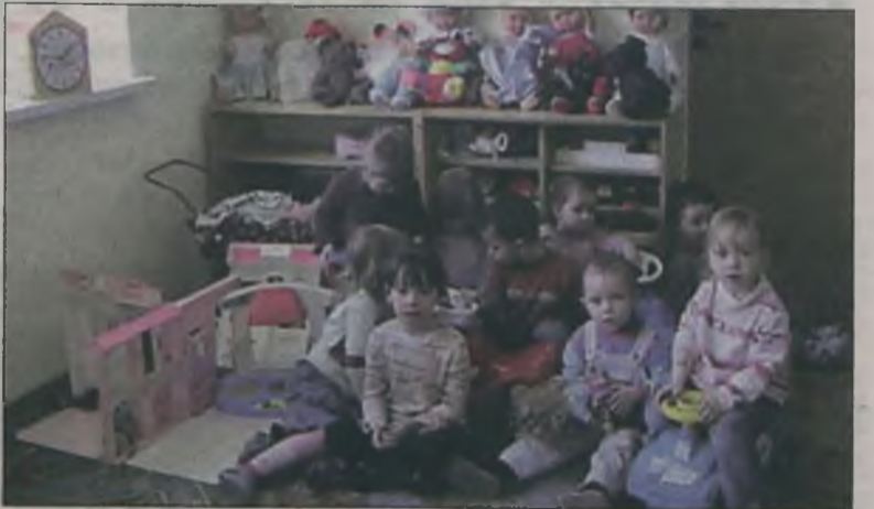
Dzieciaki po powrocie z ferii były mile zaskoczone wyremontowaną salą zabaw.

Nie lada niespodzianka czekała na dzieciaki w Przedszkolu w Tuliszkwie, bowiem po feriach czekała na nich nowa, wyremontowana sala zabaw.