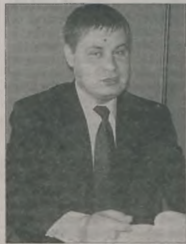
– Będziemy domagać się zwrotu pozostałych pieniędzy zagwarantowanych przez powiat – mówi wójt Krzeszewski