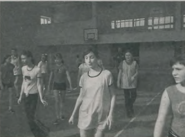
Mecz koszykówki dziewcząt.