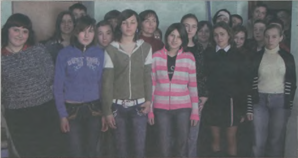
Odwiedziny gimnazjalistów związane były z wyborem dalszego kierunku nauki i przyszłego zawodu