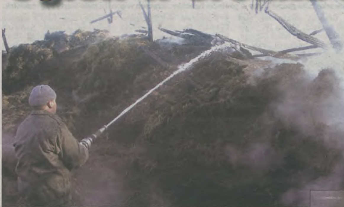
Akcja gaśnicza trwała niemal dwanaście godzin.

Poza gaszeniem ognia, ratownicy zajmowali się także wyprowadzaniem z obory zwierząt. Niestety, nie wszystkie udało się uratować. Poza zwierzętami, które padły w płonącej oborze, pożaru nie przeżyło również kilka z tych zwierząt, które udało się wyprowadzić. Ostatecznie w wyniku wysokiej temperatury i silnego zadymienia padło pięć koni (w tym źrebiak), dwa byki, jałówka, dwie maciory i dziesięć prosiąt.