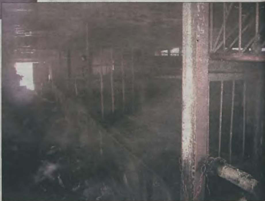
To był pierwszy od dłuższego czasu tak duży pożar w gospodarstwie rolnym w naszym powiecie.

Turkowska policja wszczęła postępowanie, które ma wyjaśnić ostateczną przyczynę wybuchu ognia. a