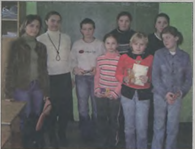
Młodzież w czasie ferii zimowych bardzo chętnie przychodziła do szkoły.

Organizatorów ferii cieszy fakt, że uczniowie bardzo chętnie i chętnie przychodzili do szkoły na zajęcia, pomimo, że był to czas wolny od nauki, przeznaczony na odpoczynek. Świadczy to o tym, że uczniowie lubią