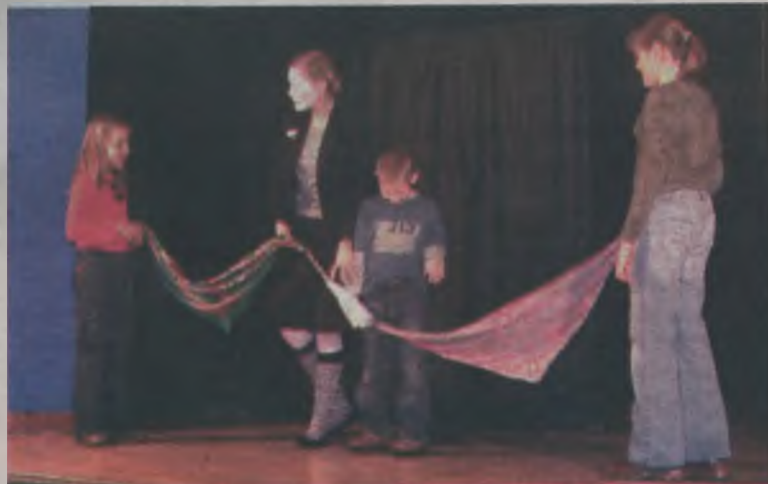
Mali widzowie byli zapraszani do udziału w przedstawieniu.

magia nie mogła wpłynąć na to, że i to wesołe przedstawienie musiało dobiec końca. aw