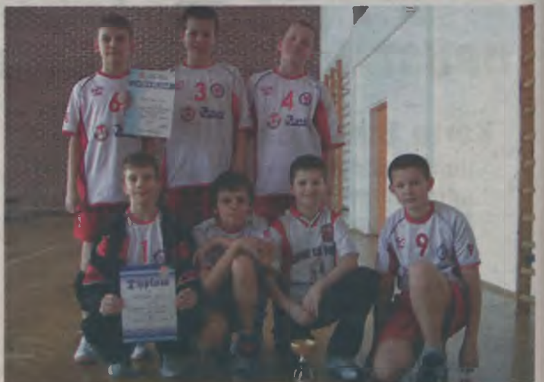
Chłopcy ze Szkoły Podstawowej nr 5 zdobyli w turnieju II i IV miejsce.

Drugi zespół UKS „Piątka” II w rozgrywkach eliminacyjnych wygrał 20:12 z SP 18 Kalisz I, 20:10 z UKS Piast Krotoszyn II, uległ jedynie 13:20 SP 4 Ozorków. Do rozgrywek finałowych weszli również z drugiego miejsca w grupie. W finale wygrali 20:18 z UKS „Piątka” I, 20:15 z SP 4 Ozorków, a porażkę ponieśli 11:20 z UKS Polon Krotoszyn, 19:21 z UKS Piast Krotoszyn I i 12:20 z SP 50 Wrocław. W klasyfikacji końcowej drużyna zajęła IV miejsce ocierając się o podium. ii