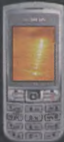
Siemens C75 1zł brutto

Dzięki Orange życie jest lżejsze. W Twoim Mixie abonament już za 25 zł brutto, SMS kosztuje tylko 1 gr, a do tego otrzymujesz 30% wipecz za każde doładowanie. To nie wszystkie niespodzianki. Na każdego kto odwiedzi nasz salon i zakupi aktywację w ofercie Twój Mix, czeka prezent.