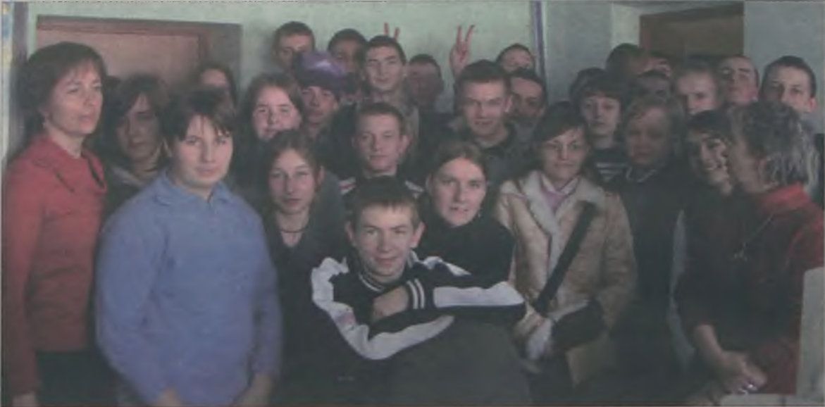
W naszej redakcji zawitali uczniowie klas trzecich Gimnazjum w Grzymiszewie.

-Mam nadzieję, że jesteśmy na półmetku naszych recitalowych spotkań- mówił Michał Bajor, rozpoczynając w czwartkowy wieczór, 2 marca 2006 roku, zatyłowany "30/30 - największe przeboje Michała", koncert w Miejskim Domu Kultury w Turku.