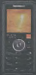
Sagem my301X 1zł brutto