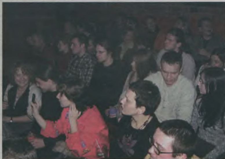
Na biesiadę po irlandzku przyszło prawie sto osób

Glass. W iście irlandzkie klimaty wprowadziły uczestników rytm wydobytą przez skrzypce, mandolinę, gitarę, bębny, flet i bozoki.