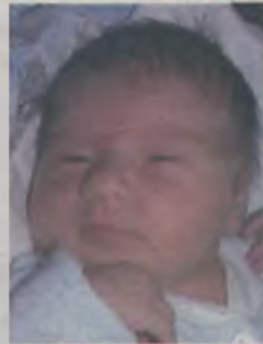
...Ignasiek córka Anny i Sylwestra ur.20 lutego, godz.17.05 waga 3820, długość 58cm