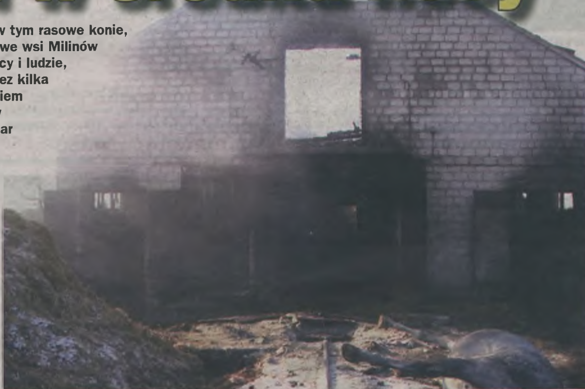
Ogień wybuchł w środku nocy. Strawił niemal cały budynek i kilkanaście sztuk zwierząt.

Pierwsi na miejsce dojechali druhowie z OSP Władysławów. Wówczas już ogień trawił dach, a płyty z eternitu pękały z trzaskiem. Ostatecznie do akcji gaśniczej wkroczyło 27 straża-