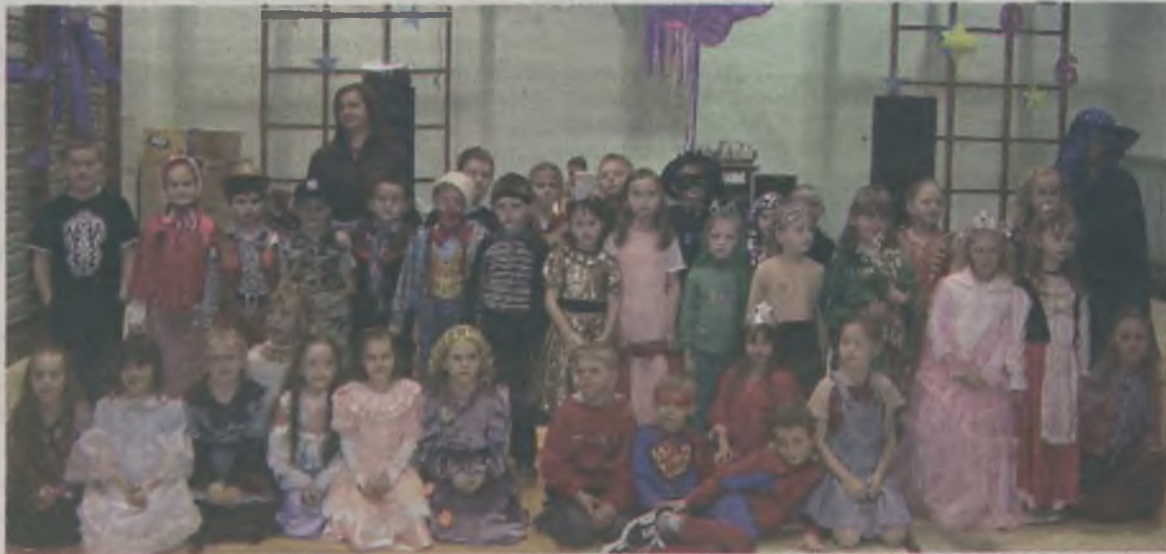
Dzieci po raz kolejny wykazały się niezwykłą pomysłowością i zaskoczyły różnorodnością wspaniałych strojów i rekwizytów.