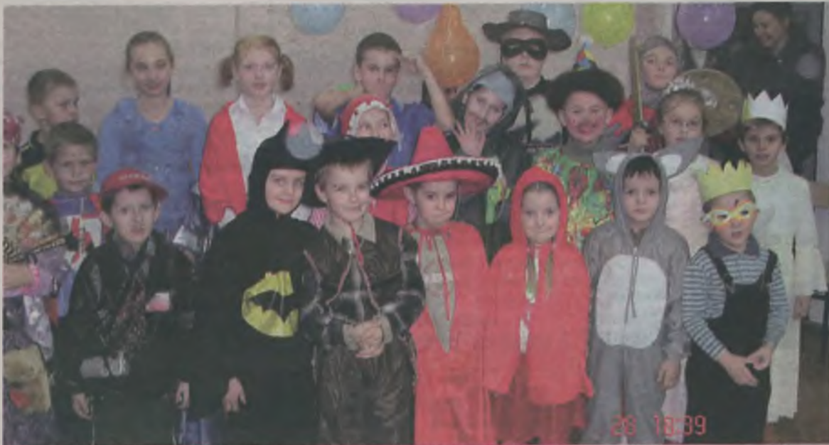
W ostatniej karnawałowej zabawie uczestniczyli mali mieszkańcy Cisewa