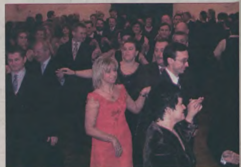
Podczas balu bawili się członkowie Koła Wychowanków Gimnazjum i Liceum w Turku oraz miłośnicy i sympatycy „Ogólniaka”.

Ze względu na jubileuszowy Bal Absolwenta nie mogło zabraknąć szczególnych chwil podsumowujących dziesięcioletnią historię. Z tej okazji dla najbardziej wyróżniających się par i jednocześnie