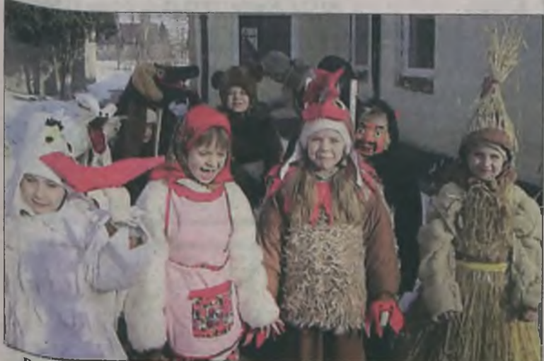
Przedszkolaki poprzebierane za zwierzęta i wesole cudaki wyruszyły z korowodem na ulice Tuliszkowa

Dzieciaki z Przedszkola w Tuliszkwie postanowiły ocalić o zapomniana starą tradycję chodzenia zapustników i we wtorek, 28 lutego poprzebierane za zwierzęta i wesole cudaki wyruszyły z barwnym korowodem na ulice Tuliszkowa.