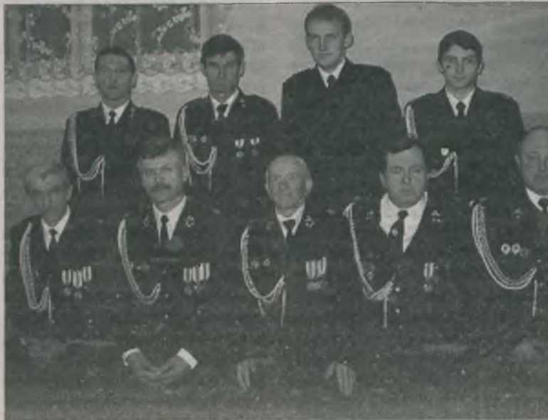
Nowy Zarząd OSP Głuchów