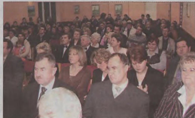
Sala po brzezi wypełniła się publicznością.

Instruktorów prowadzących zespoły i koła zainteresowań, dyrektor