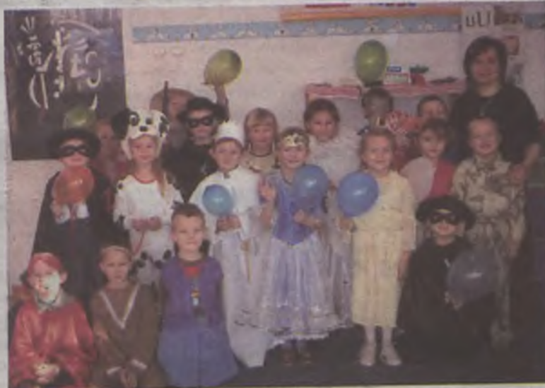
Przebierający z przedszkola w Grzymiszewie.