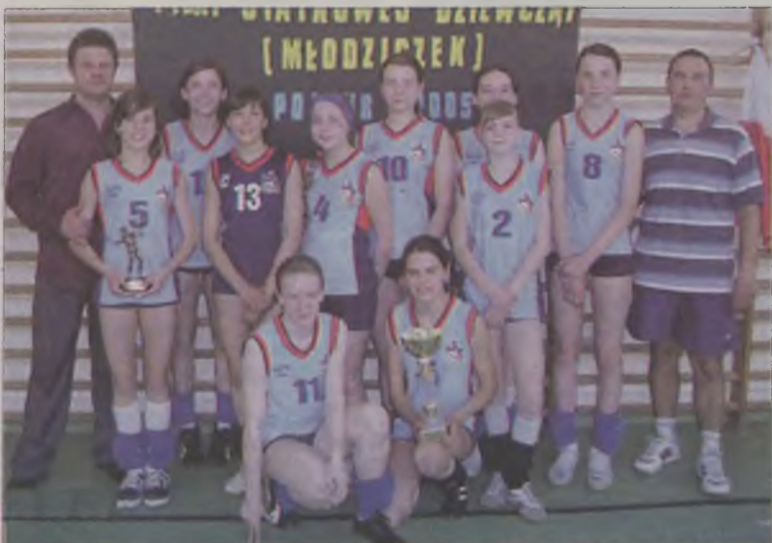
Siatkarki UKS Lis Tuliszków będą walczyć o finał mistrzostw Wielkopolski w kategorii młodziczek.