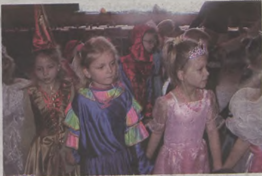
Przedszkolaki bawily się wysmienicie.