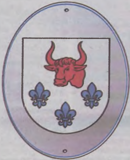
Wzór barwnej tablicy samorządowej, która być może niebawem pojawi się na ścianie budynku Urzędu Gminnego.

uwagę, że nie dysponuje ona odpowiednim sprzętem, by robić to dobrze, wskazywali nie odśnieżone drogi, dojazdy do gospodarstw, a część z nich nawet dopytywała, czy wójt zamierza ukarać za to finansowo firmę. Sołtysi zaproponowali, by część gminy odśnieżał inny usługodawca, który zresztą już obecnie robi to na zlecenie, gdyż ze względu na brak sprzętu i odległości, w południowej części gminy pługi i piaskarki z Kaczek zjawiają się dopiero późnym popołudniem, jeśli w ogóle się pojawiają. Wójt wyjaśniał, że niestety reguły przetargowe ograniczają taką możliwość. – To nauczka na przyszły rok – dla mnie i dla państwa radnych. Wybrałem firmę najtańszą, niestety dysponuje ona tym, czym dysponuje i jej oferta jest taka, jak cena. Ale gdybym wybrał droższą, to wszyscy tutaj oskarżalibyście mnie znów, że za drogą – podkreślał wójt. Dyskusja na temat spraw dość błahych w sumie trwałaby długo, bo radni już zaczęli zgłaszać problemy typu: źle parkujące samochody, za wcześnie czy za późno zapalające się oświetlenie uliczne, gdyby nie przewodniczący