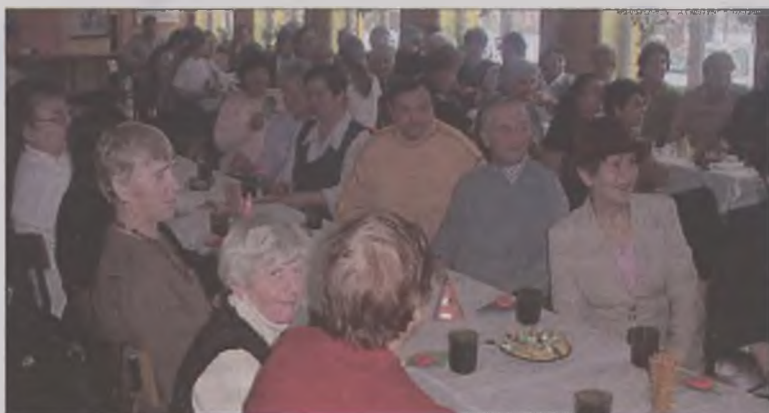
Mili goście z zachwytem przyglądali się popisom wnuków.