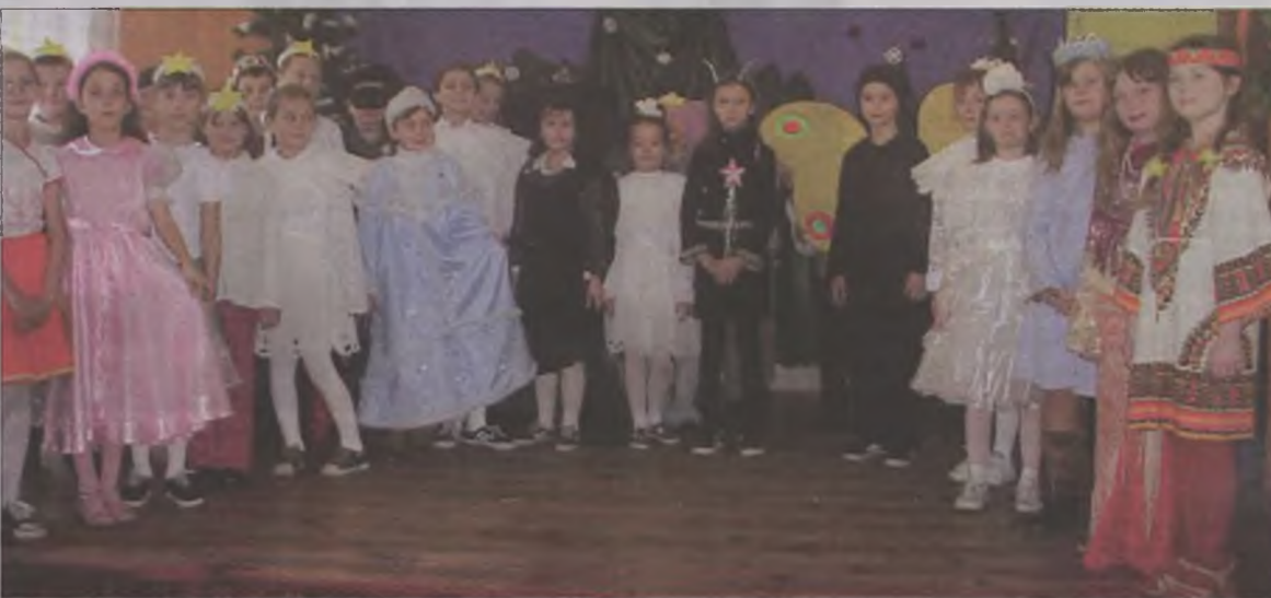
Przebrali się i występowali dla swoich kochanych babć i dziadków.

zaproszeni do wspólnej zabawy. Okazało się, że podobnie jak wnuczęta, świetnie radzili sobie w tańcu rock and roll'a. Na zakończenie mili goście otrzymali od swych pociech drobne upominki. a