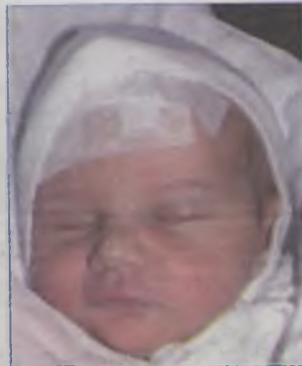
...Kołodziejczyk córka Anny i Jacka ur.17 stycznia, godz.10.30 waga 3650, długość 57cm