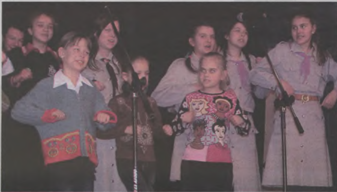
Na scenie oprócz harcerskich piosenek, dzieci i młodzież zaprezentowali również wesołe zabawy i pląsy.