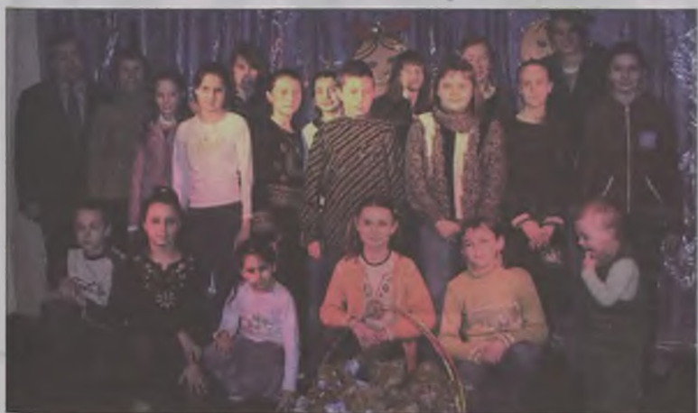
Uczestnicy konkursu piosenki.