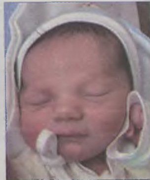
...Pakuła syn Justyny i Zbigniewa ur.19 stycznia, godz.14.10 waga 3680, długość 54cm