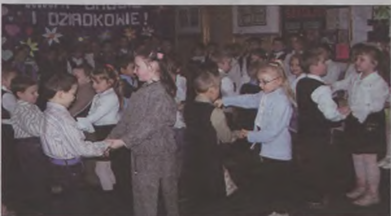
Wnuczęta dla swoich dziadków m.in. tańczyły kujawiaka.