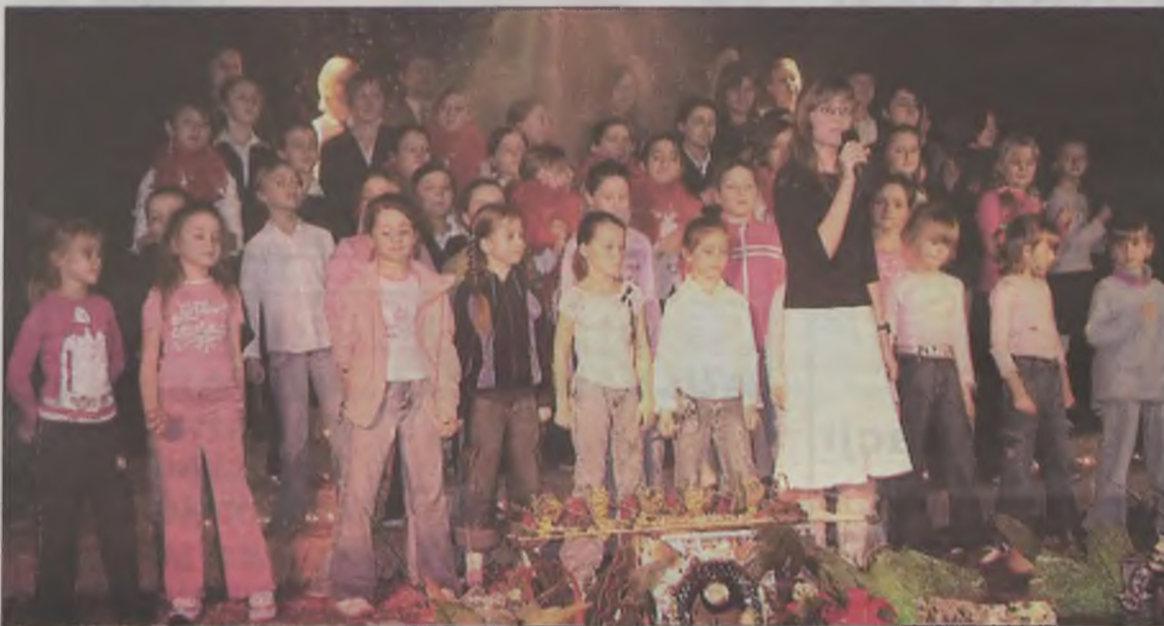
W finale pojawiły się na scenie wszystkie występujące zespoły dziecięce.

sięgają początków dwudziestego wieku, kiedy powstawały orkiestry dęte w Dobrej i Żeronicach.