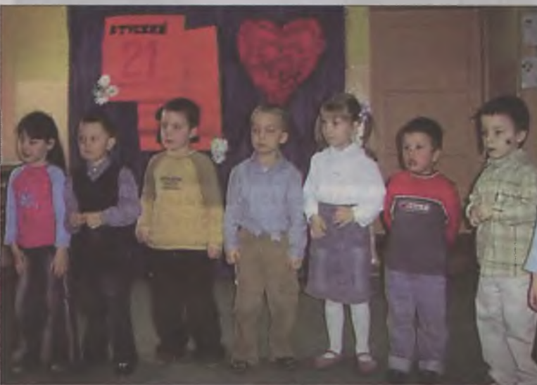
Maluchy zaprosiły swoich gości do wspólnej zabawy.

Tradycyjnie już Dzień Babci i Dzień Dziadka był okazją do zorganizowania uroczystości w Przedszkolu w Tuliszkowie, na którą dzieci zaprosiły swoich kochanych dziadków. Oczywiście maluchy złożyły swoim gościom życzenia, po czym zaprosiły ich na poczęstunek przygotowany przez rodziców i do wspólnej zabawy. A atrakcji było sporo. Był m.in. taniec z babciami, do którego na grzebieniach przygrywali dziadkowie. Wnuczęta dla swoich gości miały własnoręcznie wykonane upominki, takie jak korale, medale, serwetki, śnieżne gałązki oraz laurki. W trakcie spotkania niezawodni okazali się seniorzy z tuliszkowskiego zespołu „Jesień”, którzy do wspólnego śpiewania starych przebojów zachęcili babcie i dziadków. az