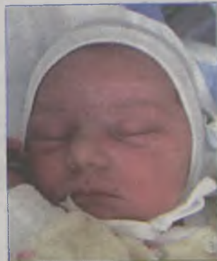
...Gii córka Iwony i Krzysztofa ur.20 stycznia, godz.3.10. waga 3600, długość 57cm