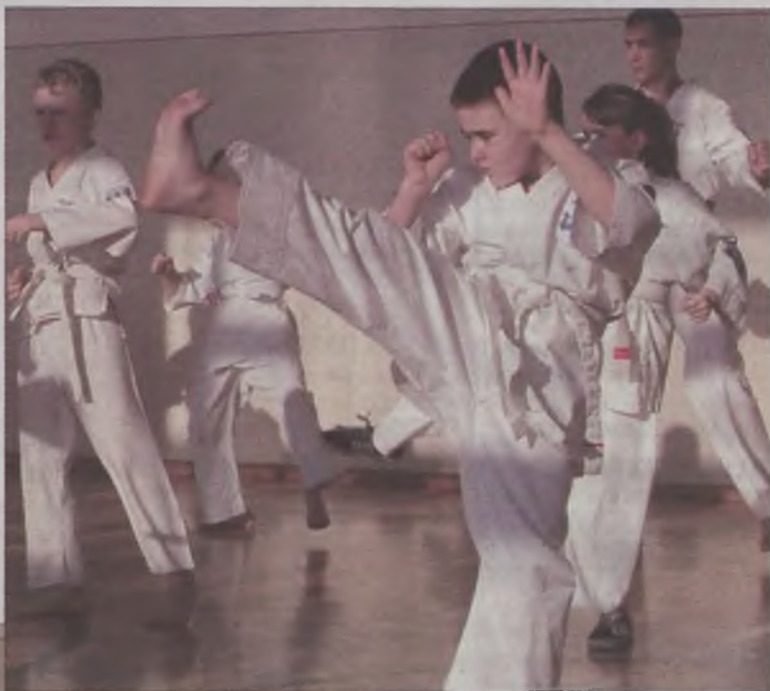
Zawodnicy musieli wykazać się zdobytymi umiejętnościami.

ków był to pierwszy egzamin z karate, nadający im pierwszy stopień. Jednak zarówno wśród tych początkujących, jak tych, dla których był to kolejny sprawdzian, egzamin wywołał silne emocje. Widać było wielkie skupienie, a później radość po zdanym egzaminie. Uczestnicy po zdanym egzaminie otrzymali certyfikaty potwierdzające nadany im stopień karate.