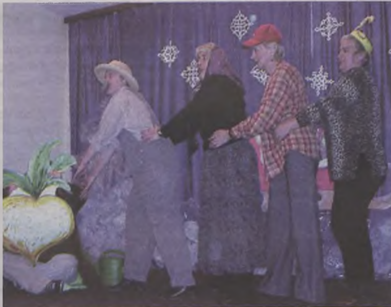
Inszenizacja wiersza Tuwima czyli panie z Forum rzepkę wyrzywały.

Na tym jednak nie koniec atrakcji, bowiem na maluchy czekały jeszcze szalone tańce. Na wzmocnienie panie przygotowały