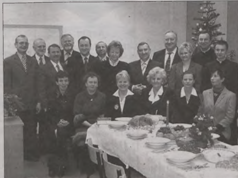
Uczestnicy spotkania opłatkowego w Klubie Ekologicznym.