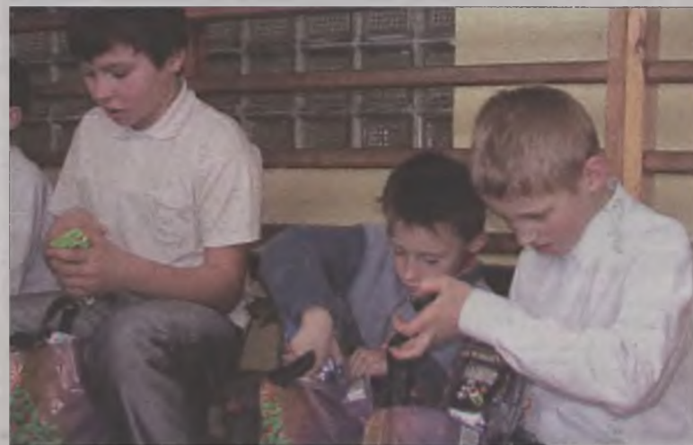
Mikołaj przyniósł dzieciakom paczki ze słodyczami i zabawkami.