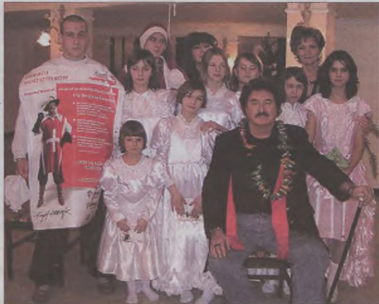
Piosenkarzowi bardzo podobał się występ dzieci z domu dziecka, którego był głównym bohaterem.

-Bardzo podoba mi się zaangażowanie Muszkieterów w działalność charytatywną. Konwój Muszkieterów obok Wielkiej Orkiestry Świątecznej Pomocy czy Polskiej Akcji Humanitarnej jest światłem w tunelu, dzięki któremu świat jest lepszy.