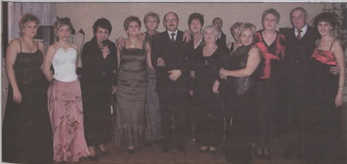
Organizatorki balu z władzami miasta i gminy Tuliszków.

Panie przygotowały również atrakcje kulinarne. Bal Charytatywny trwał do białego rana, a dochód z