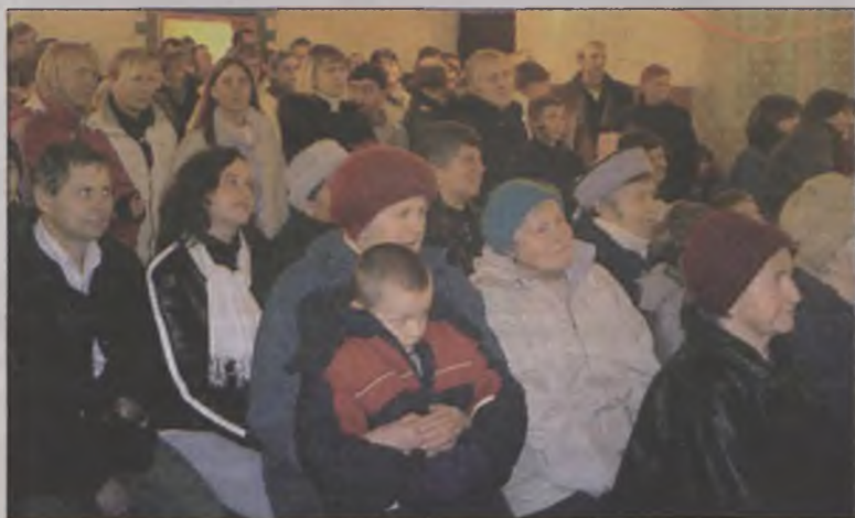
Sala wypełniona była po brzegi.