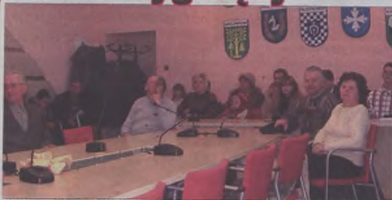
Rozstrzygnięcie konkursu odbyło się w sali konferencyjnej Urzędu Miejskiego w Turku

Organizatorami konkursu byli: Urząd Miejski, Przedsiębiorstwo Gospodarki Komunalnej i Mieszkaniowej oraz Miejski Dom Kultury w