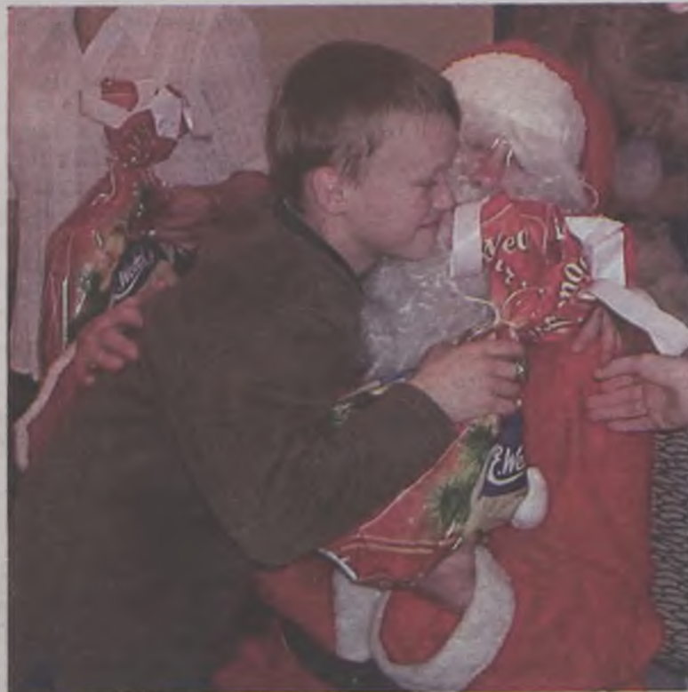
Dzieci kochają Mikołaja, bo on zawsze ma dla nich coś miłego.

napoje oraz fantazyjne kolorowe kanapki, owoce, ciasta i słodycze.