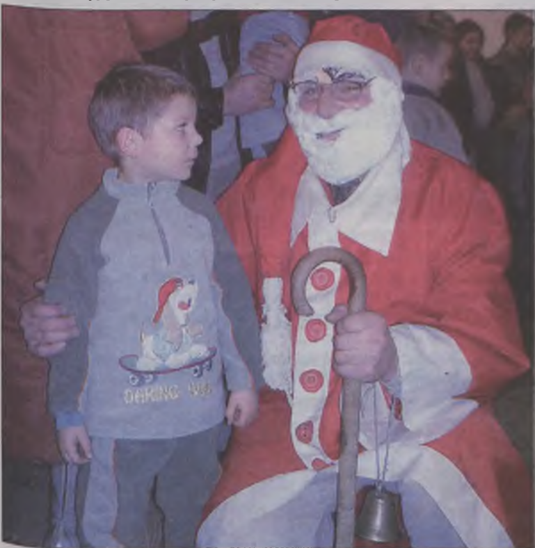
Mikołaj obdarowywał prezentami i miłymi słowami.

Druhowie z Ochotniczej Straży Pożarnej w Mikulicach (gmina Dobra) wspólnie z tamtejszą młodzieżą, przygotowali dla około pięćdziesięciu dzieci z tej wsi wspaniałą imprezę karnawałową. Były występy, Mikołaj z prezentami i dyskoteka.