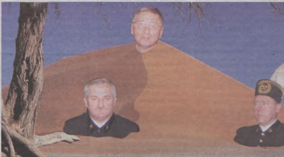
Odwołany 9 stycznia Zarząd kopalni nazywany był „darem św. Walentego”. A to z racji daty jego powołania. Jednak po czterech latach zarządzania kopalnią będzie bardziej kojarzony jako zasypany przez żwir, a to z powodu tak zwanej afery żwirowej, która była bezpośrednią przyczyną odwołania kierownictwa.

Ale już punkt trzeci obrad mógł zwiastować daleko idące decyzje, bowiem Rada zajęła się sprawą upomnienia udzielonego członkom Zarządu przez RN 9 maja 2005r., a następnie cofniętego 21 października 2005r. Przypomnijmy, że wspomniane upomnienie zostało udzielone po stwierdzeniu bałaganu w kontrakcie na sprzedaż przez kopalnię żwirów i piasków. Tym samym dotknięto bardzo delikatnej, a głośnej już tzw. afery żwirowej,