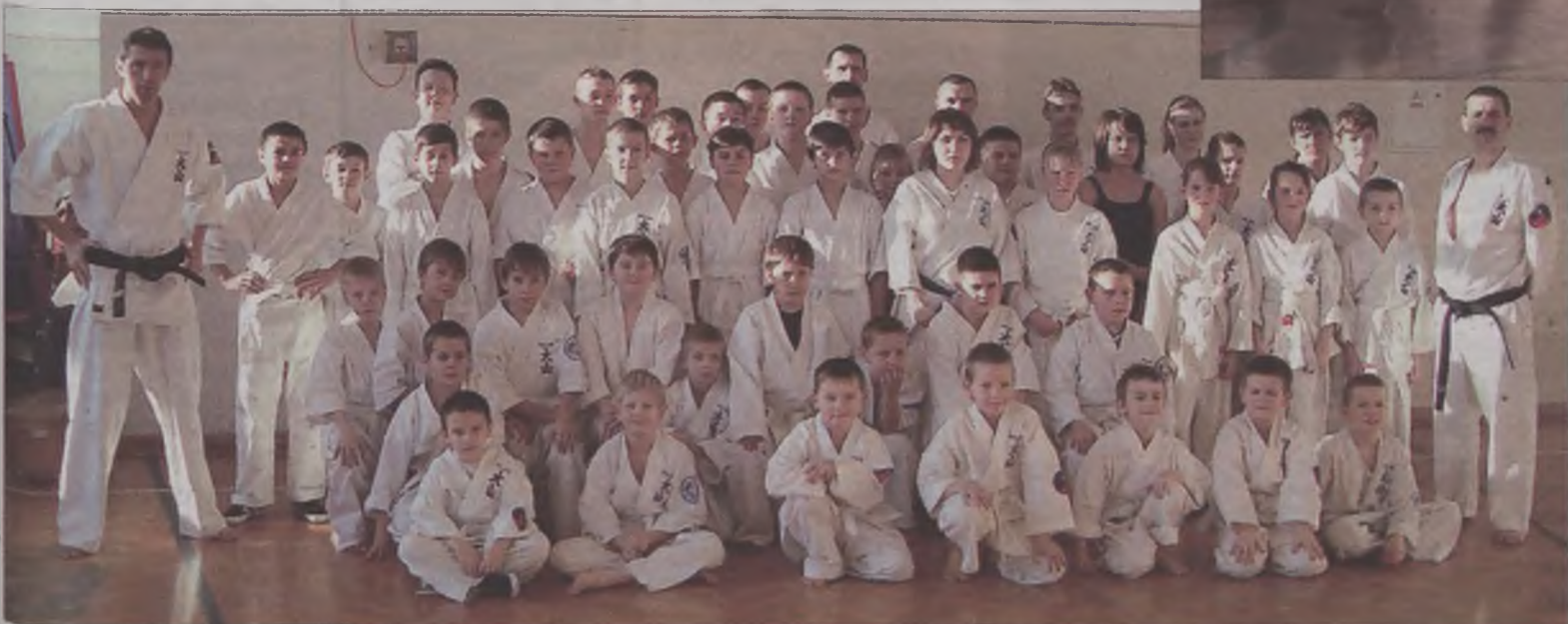
Uczestnicy egzaminu karate Oyama.