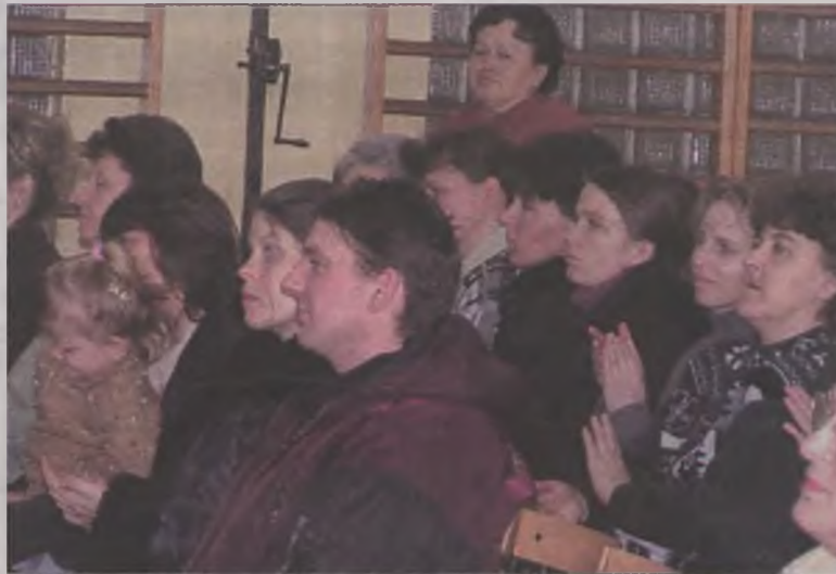
Występy swoich pociech obejrżeli m.in. rodzice.

Środowiskowe Ognisko Wychowawcze TPD w Brudzewie działa od początku 2004 roku. Stałą opieką