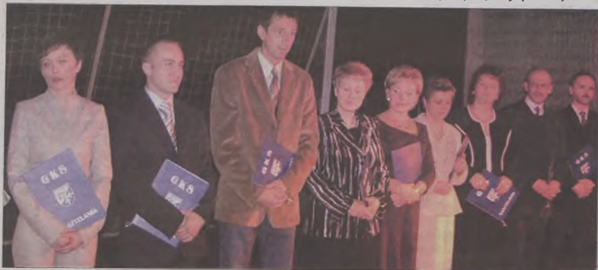
Podziękowania złożono również sponsorom, dzięki którym sportowcy mogli uczestniczyć w wielu zawodach i reprezentować barwy gminy.